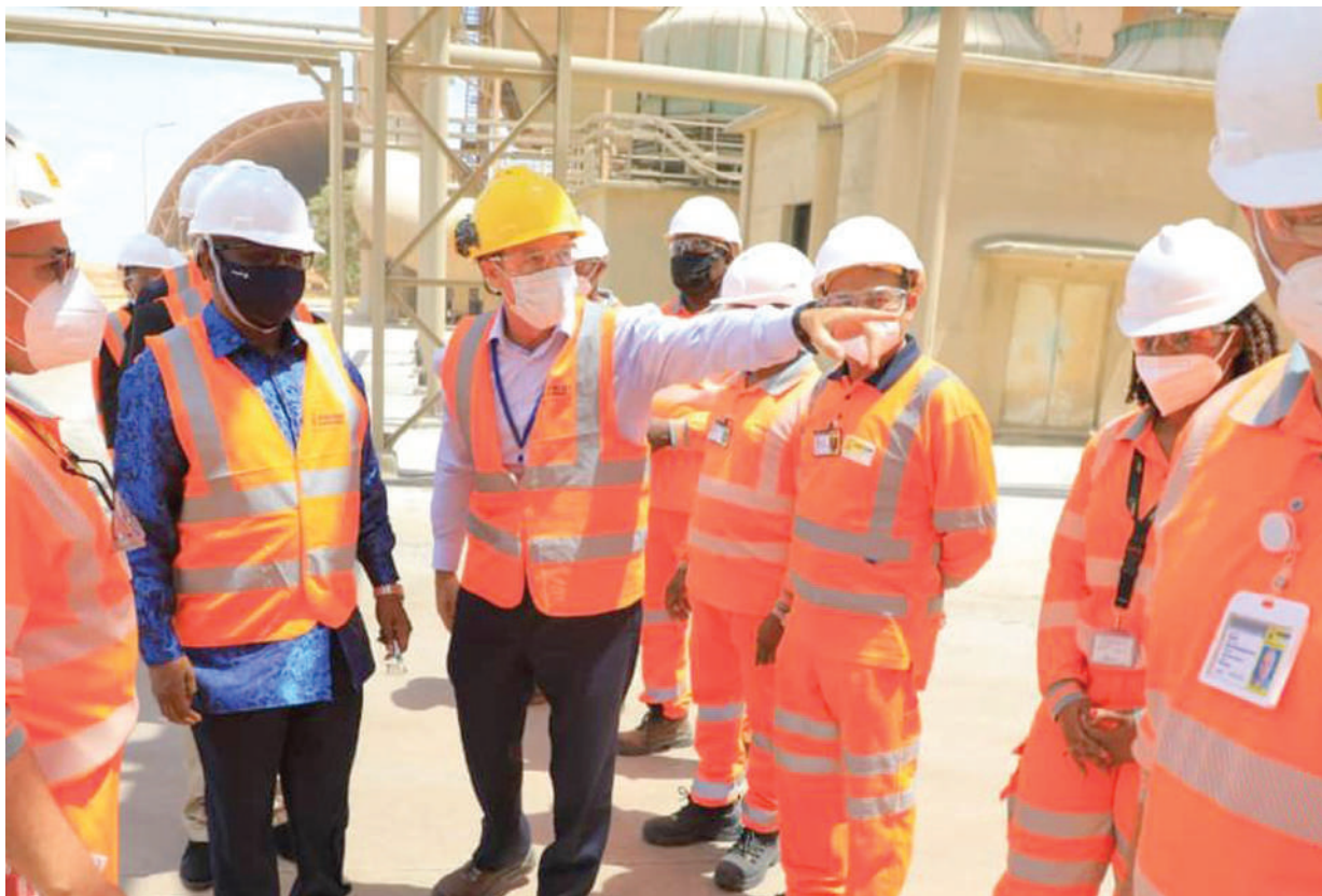
Waziri wa Viwanda na Biashara, Prof. Kitila Mkumbo (wa pili kushoto), akikagua na kupokea maelezo ya uzalishaji ya kiwanda cha saruji cha Twiga, alipotembelea kiwandani hapo, eneo la Wazo, mkoani Dar es Salaam jana, ili kujua hali ya upatikanaji na uzalishaji wa bidhaa hiyo.