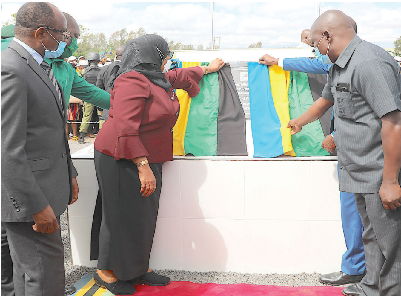
Rais Samia Suluhu Hassan, akiondoa kitambaa kuzindua rasmi barabara ya lami yenye urefu wa kilomita 32.2, katika eneo la Sanya Juu, wilayani Siha, mkoani Kilimanjaro jana.