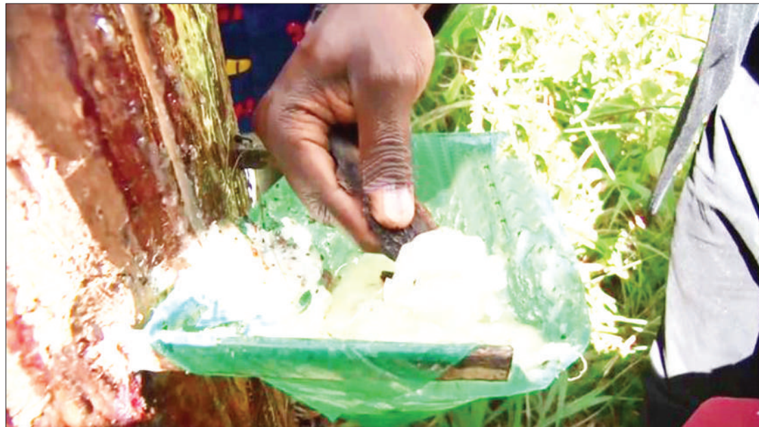
Ugemaji utomvu ukiendelea.

Wananchi waishio kwenye maeneo yenye ukame, hunufaika na miti ya asili iliyopo kwenye eneo lao, kazi yao ni kuulinda na kuitunza hiyo misitu ili kugema