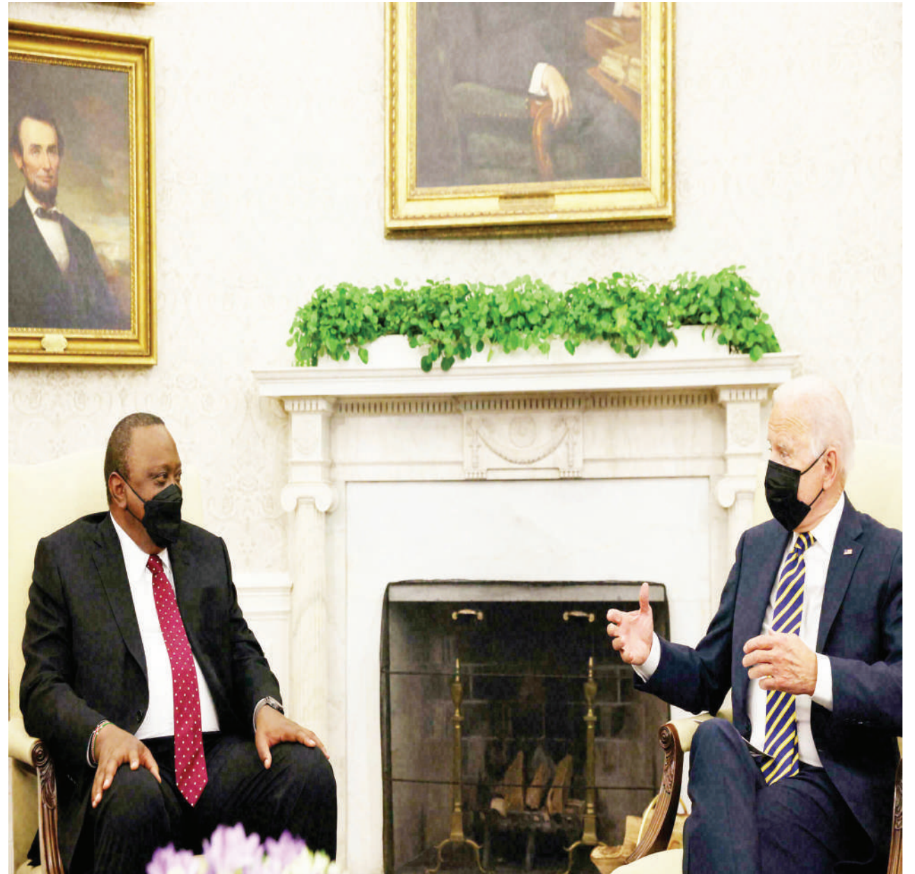
Rais wa Marekani, Joe Biden, amekutana na kufanya mazungumzo na mwenzake wa Kenya, Uhuru Kenyatta katika Ikulu ya white house, nchini Marekani.