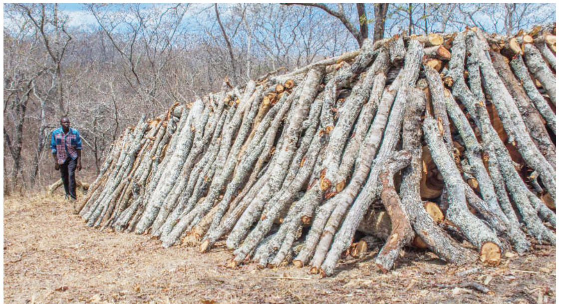
Sehemu ya shughuli za mkaa endelevu kwenye magunia, kijiji cha Ulaya Mbuyuni wilayani Kilosa.

Kimsingi, anasema fedha za mauzo ya mazao misitu, huingia kwenye mnyororo wa thamani kuanzia uandaaji eneo la uvunaji hadi mauzo na kufanya wanakijiji wa eneo husika wanufaike, hata kama hawahusiki na uvunaji wake.