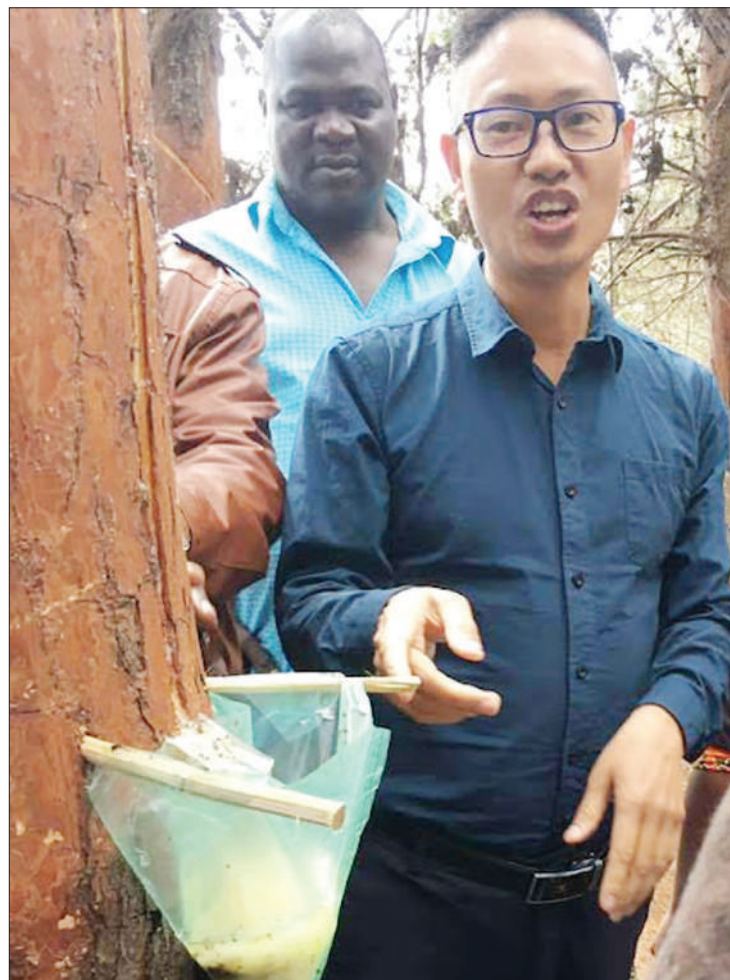
Mtaalamu akionyesha shughuli za ugemaji utomvu wa miti.

Uwezo wa uzalishaji aina zote za utomvu unakadiriwa kuwa zaidi ya tani 26,000 kwa mwaka, sehemu kubwa ikiuzwa nje ya nchi kama malighafi, na kiasi kidogo kinachobakia huchakatwa kwenye viwanda vichache vilivyomo katika nchi hiyo.