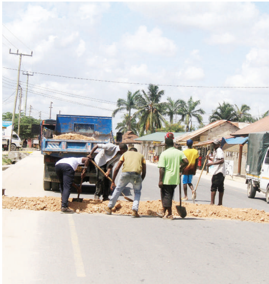
Watumishi wa Wakala wa Barabara Vijijini na Mijini wakiweka tuta katikane eno la Kitunda jijini Dar es Salaam juzi ili kuzidhibiti gari zinazokwenda kasi kwenye maeneo ya wakazi.