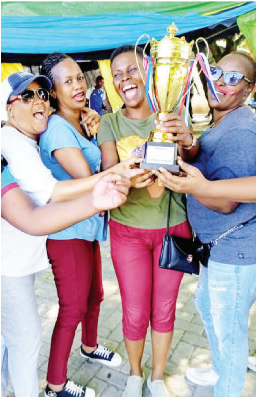
Mashabiki wa timu ya mpira wa miguu wa Kluba ya Waandishi wa Habari Mkoa wa Dar es Salaam (DCPC), wakiwa na kombe walilotwaa baada ya kushinda kwa penalti 4-3 dhidi ya Polisi Jamii Temeke. Hatua hiyo ya mikwaju ya penalti ilifikiwa baada ya kutoka sare ndani ya dakika 90.

Aliongeza kuwa hayuko katika ushindani na mtu yeyote na wanaenda katika mapumziko ya Kalenda ya Fifa wakiwa vizuri. Waziri aliwahi kuicheza Yanga na alitua hapo akitokea Mbao FC, lakini alikwama kuwa kwenye ubora kutokana na kutopewa nafasi mara kwa mara na hata alipopewa hakuo-nyesha ubora wake wa kucheka na nyavu kama ilivyo sasa.