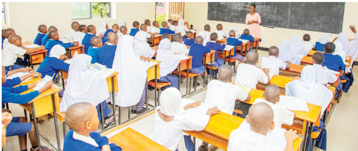
Wanafunzi wakiwa katika mazingira mapya ya kujifunzia.

U MBALI mrefu, utoro, uhaba wa miundombinu, msongamano madarasan ni miongoni mwa adha zilizokuwa zikiwakabili wanafunzi wa shule mbalimbali za Wilaya ya Korogwe mkoani Tanga. Kupitia mradi wa uboreshaji elimu ya awali na msingi (BOOST) unaotekelezwa chini ya Ofisi ya Rais, Tawala za Mikoa na Serikali za Mitaa (TAMISEMI), adha hizo zinaelekea kuwa historia.