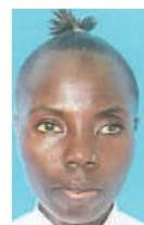
Na Tuntule Swebe