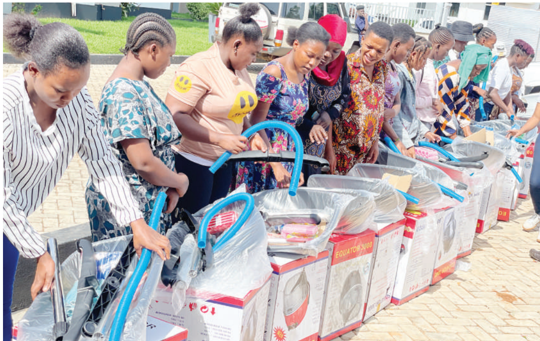
Wasichana waliosomea ususi wakifurahia vifaa vya kazi kutoka WiLDAF na UNFPA, walivyokabidhiwa ili kuendeleza ujuzi.

Katika juhudi za kupambana na ukatili huo, serikali inaweka mpango wa taifa wa utekelezaji wa kukomesha ukatili dhidi ya wanawake na watoto (NPA-VAWC) 2017-2022), unaoeleza kuwa ukeketaji ni mila inayoathiri wanawake