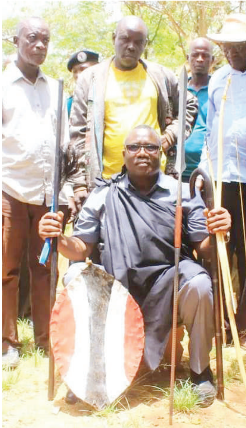
Mbunge wa Butiama ambaye ni Naibu Waziri wa Mambo ya Ndani, Jumanne Sagini, akisimikwa na wazee wa jadi wa Bukwaya, Kata Bisumwa, mkoani Mara kuwa rafiki wa amani juzi.