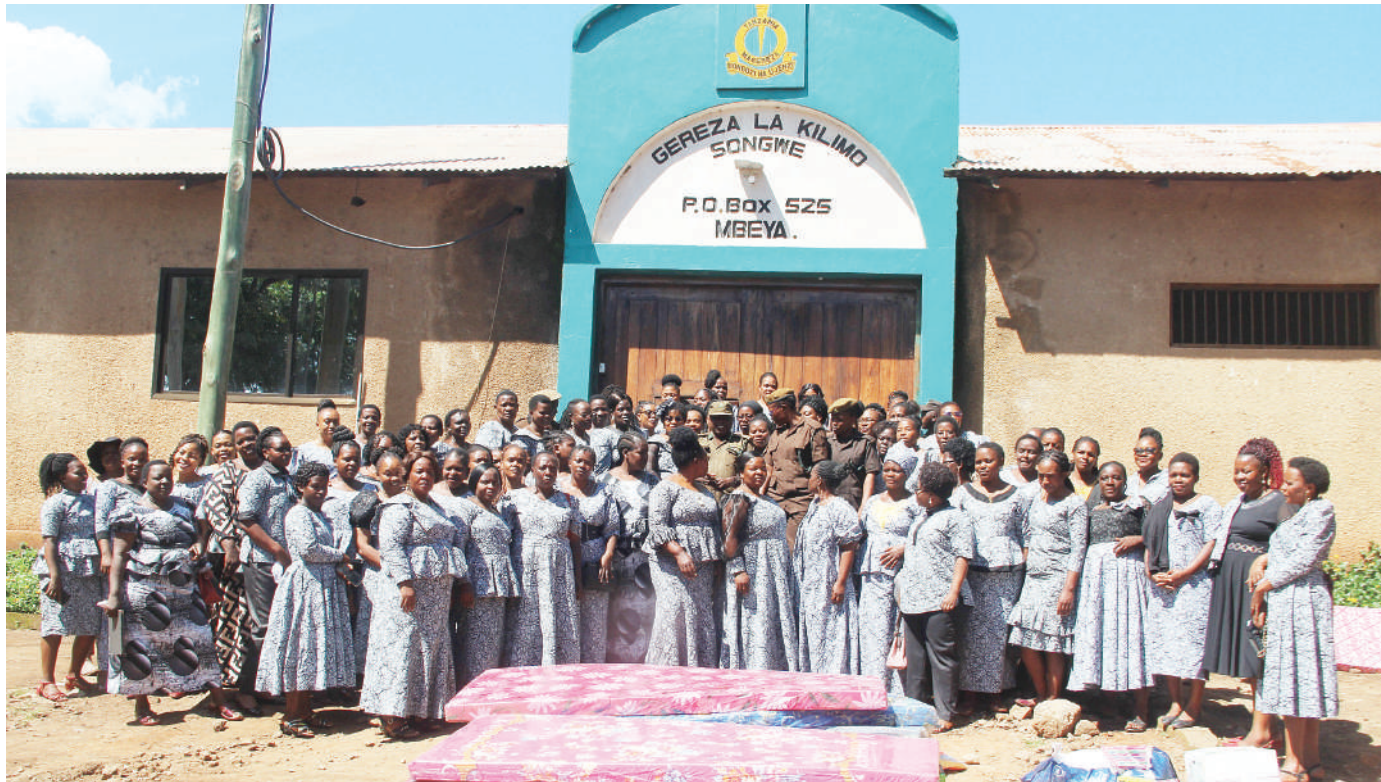
Walimu wakike wa Halmashauri ya Wilaya ya Mbeya, wakiwa pamoja na maofisa wa Jeshi la Magereza walipotembelea na kutoa misaada ya vitu mbalimbali kwa wafungwa wa Gereza la Kilimo la Songwe lililoko mkoani Mbeya juzi.