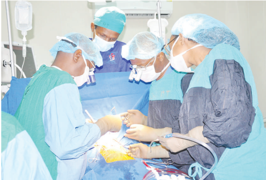
Huduma za upasuaji moyo zikiendelea JKCI.

Ikumbukwe kupitia bima ya afya, inawezekana kwa wananchi wengi kuhudumiwa ipasavyo. Itakuwa vyema iwapo Watanania wengi wataelewa umuhimu wa bima ya afya kwa maisha yao na kuchukua hatua za haraka ku-