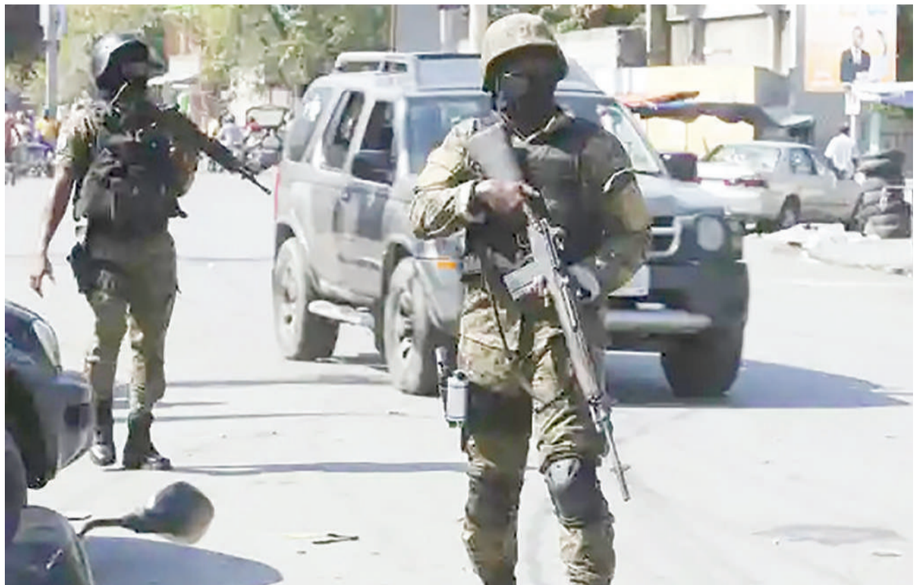
Kikosi maalum cha Ikulu ya Haiti kikiimarisha ulinzi katika mitaa ya mjini Port-au-Prince.

Alisema kikao hicho pia hutumiwa kufanya tathmini ya utekelezaji ikiwamo kuweka mikakati ya kuleta ufanisi katika utekelezaji majukumu kwa mujibu wa sheria na utaratibu wa mwongozo.