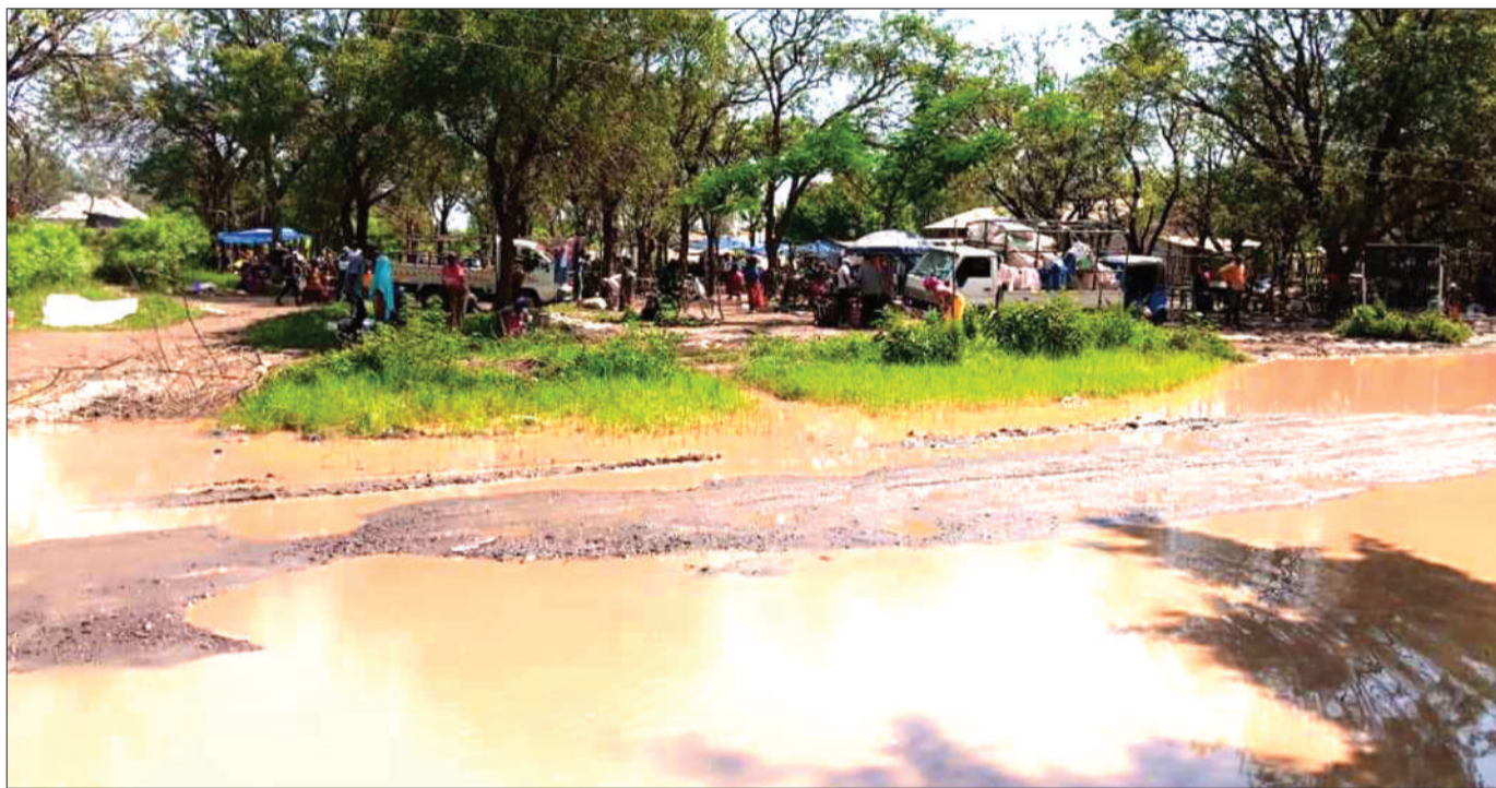
Moja ya maeneo ya Kijiji cha Mabogini, Wilaya ya Moshi, ambayo yamekosa mawasiliano ya barabara, baada ya mvua kubwa kunyesha jana.