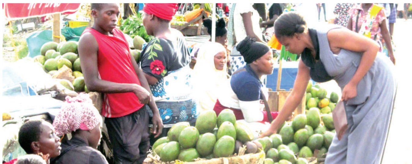
Wachuuzi wa matunda wakiwa wamepanga bidhaa zao jirani na barabara katika eneo la Mbezi Mwisho, jijini Dar es Salaam jana, hivyo kusababisha usumbufu kwa magari na watumiaji wengine wa barabara hiyo.

Uandikishaji wa daftari la kudumu la wapigakura kwa Wilaya ya Wete Mkoa wa Kaskazini Pemba linatarajiwa kuanza Januari 25 hadi 29, mwaka huu.