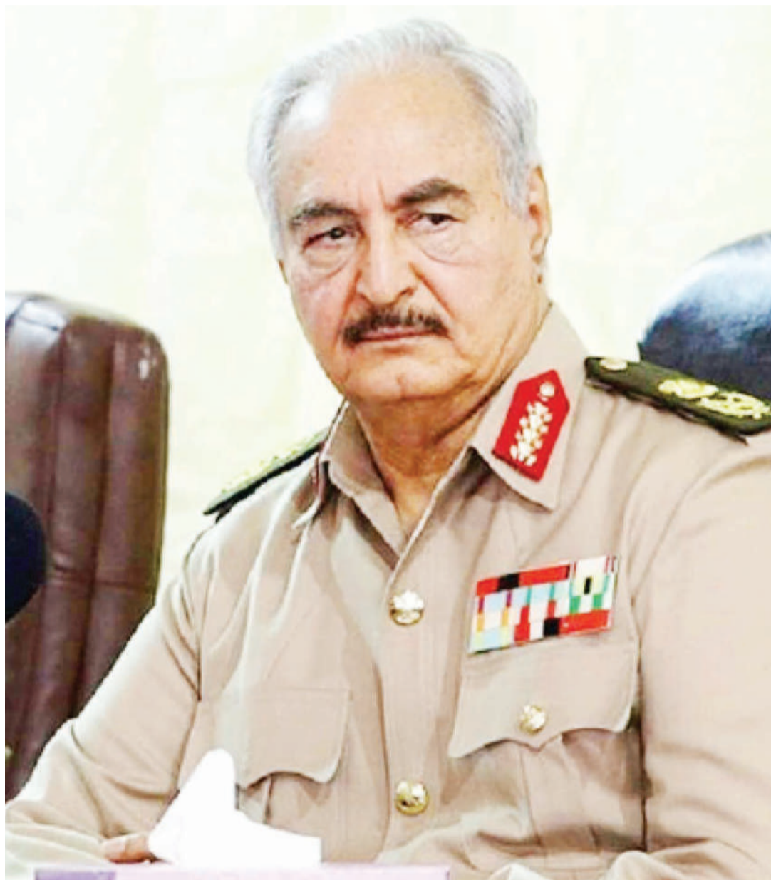
Kamanda Haftar anayedaiwa kusababisha mgogoro wa Libya kuathiri ukanda mzima wa Sahel.

Na pia kuna suala la ugaidi wa makundi ya Kiislamu. Mchanganyiko wa vurumai lote hilo kwa muda mrefu haukuwa ukiangaliwa kama ilivyokuwa ka-