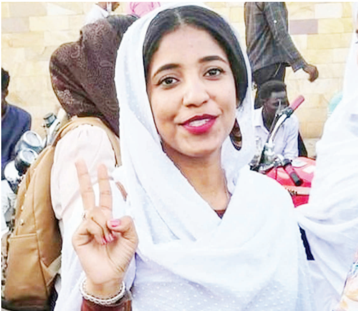
Mwanaharakati Salah akichagiza masuala ya mabadiliko ya kisiasa nchini Sudan.