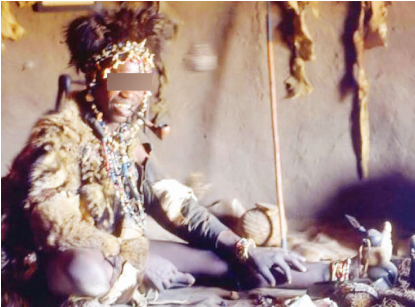
Kazi za waganga wa kienyeji hudaiwa kuhitajika zaidi wakati wa uchaguzi.