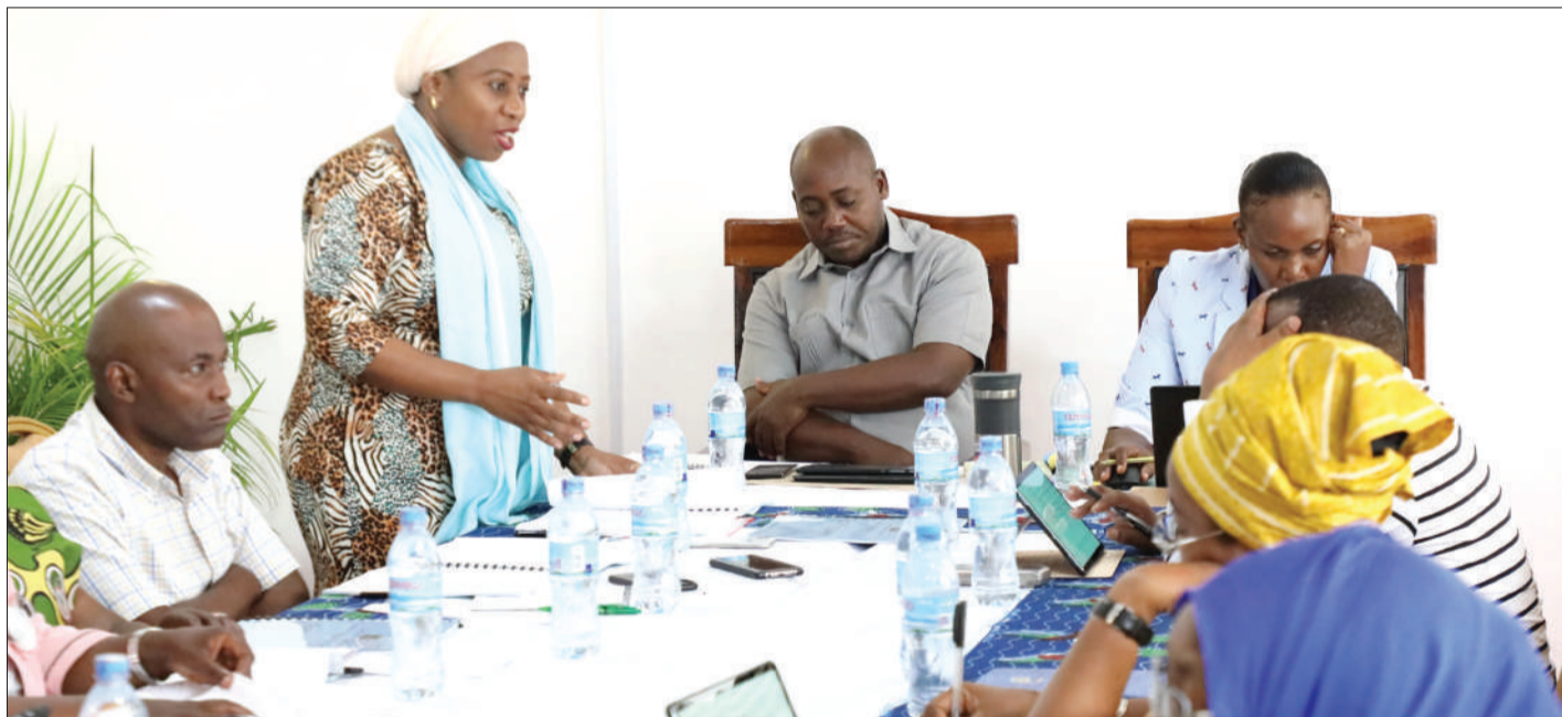
Waziri wa Afya, Maendeleo ya Jamii, Jinsia, Wazee na Watoto, Ummu Mwalimu, akitoa taarifa ya utekezaji wa Bajeti ya Wizara (Fungu 52), kwa kipindi cha nusu mwaka 2019/2020, kwa Kamati ya Kudumu ya Bunge ya Huduma na Maendeleo ya Jamii, jijini Dodoma jana.