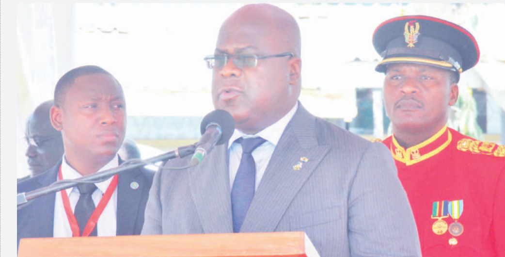
Rais wa Jamhuri ya Kidemokrasia ya Congo (DRC), Félix Tshisekedi.

RAIS wa Jamhuri ya Kidemokrasia ya Congo (DRC), Félix Tshisekedi, ametishia kuwafuta kazi mawaziri wake na hata kulivunja bunge, iwapo washirika wake wa kisiasa ambao wanaegemea katika mrenyo wa rais wa zamani Joseph Kabila, wataendelea kumdarau.