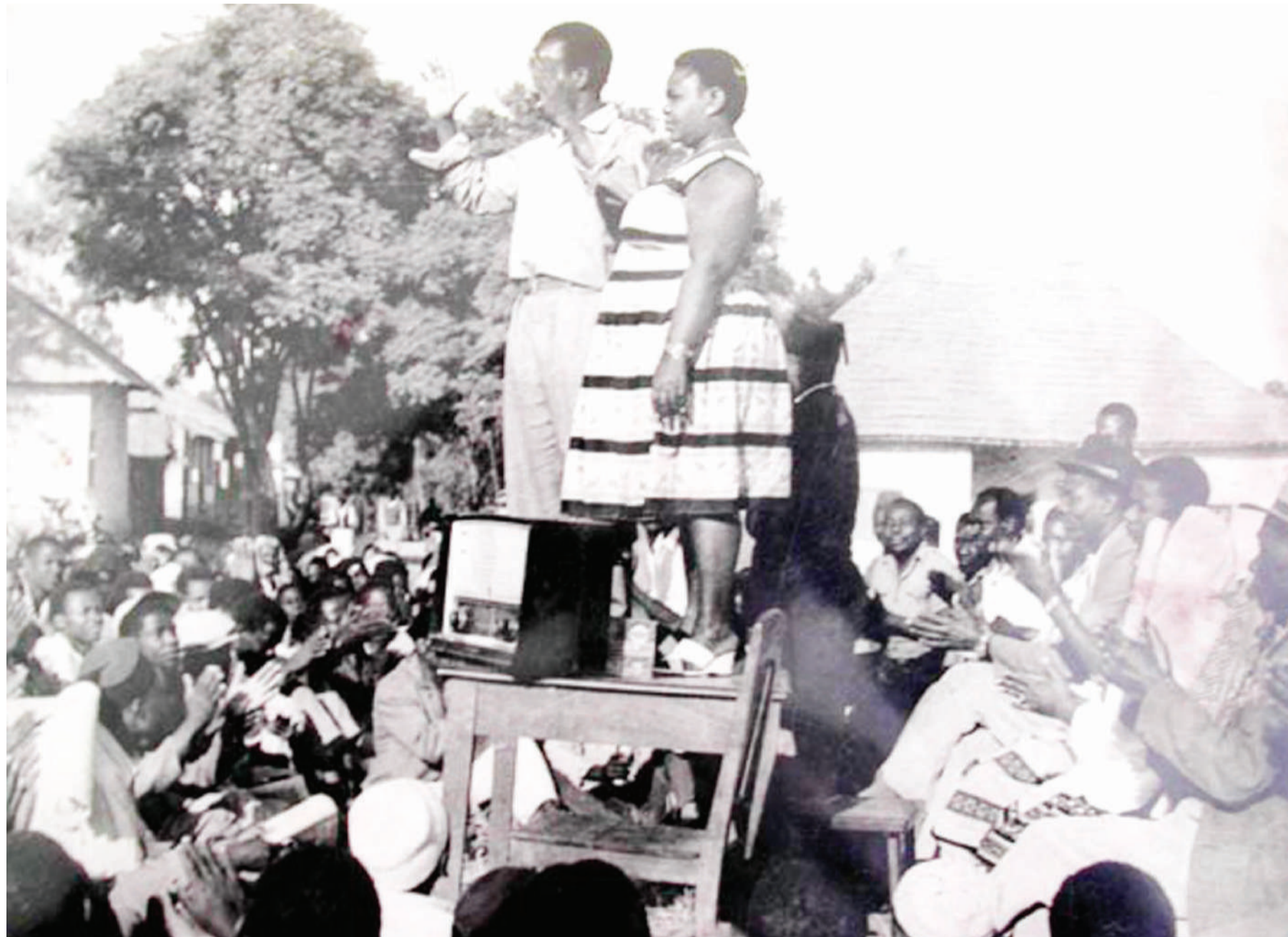
Mwanasiasa wa kwanza mwanamke wa Tanzania, Bibi Titi Mohamed, akiwa jukwaani na Mwalimu Julius Nyerere wakati wa harakati za Uhuru.