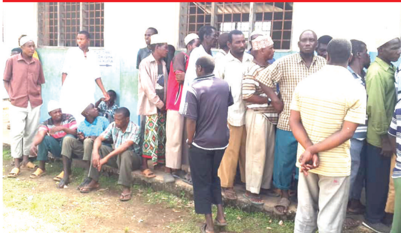
Baadhi ya wananchi wa Kijiji cha Kiuyu Micheweni Pemba, wakiwa katika foleni wakisubiri kupatiwa huduma ya kuhakiki taarifa zao na wengine kujiandikisha katika daftari la kudumu la wapigakura jana.

Alisema sera ya viwanda ina lengo la kukuza uzalishaji wa bidhaa kwa kukidhi mahitaji ya masoko pamoja na kuweza kuingia katika soko la ushindani.