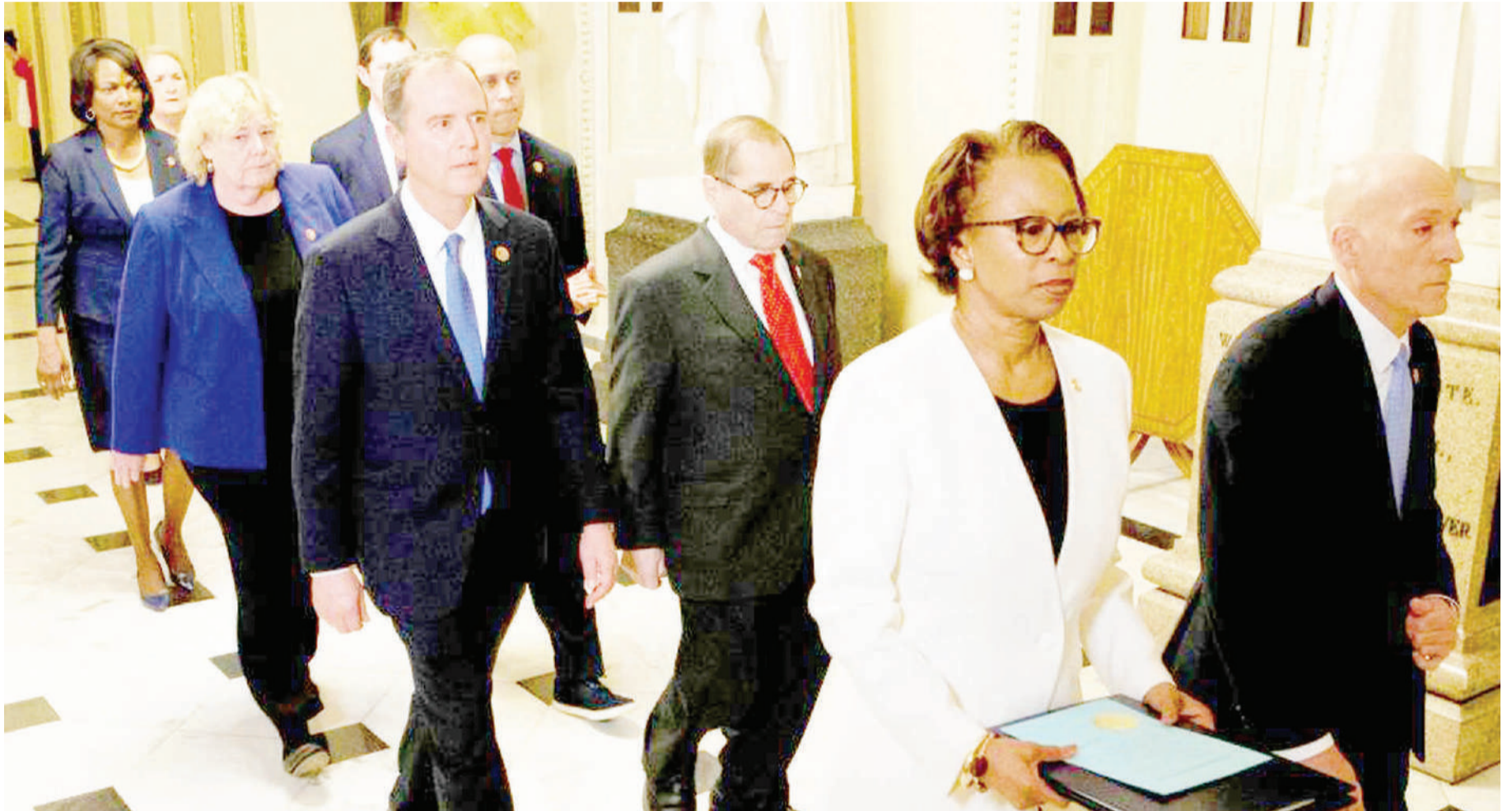
Maseneta nchini Marekani wakijiandaa kusikiliza mashtaka dhidi ya Rais Donald Trump.