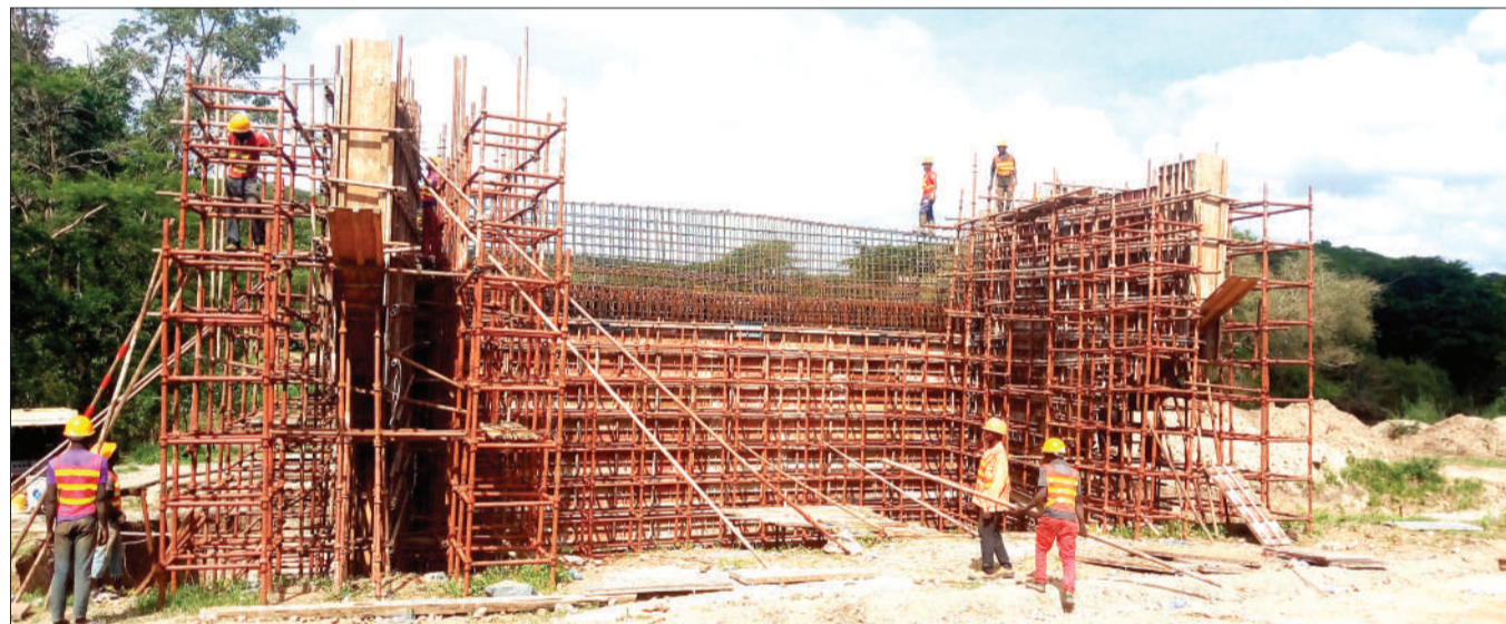
Mafundi wa kampuni ya Kichina inayojenga kipande cha barabara ya Mbeya-Tabora, kuanzia Chunya mjini hadi Mji wa Makongolosi chenye urefu wa kilomita 39, kwa kiwango cha lami, wakiendelea kusuka daraja la Mto Lupa, lenye urefu wa zaidi ya mita 30, juzi.

Alisema mfumo huo utawashirikisha wadau wote wa ardhi, kuanzia wachora ramani, wapimaji mpaka kwa watoaji wa hati miliki ili kuhakikisha hakuna kipande cha ardhi nchini ambacho hakitakuwa kinalihiwa kodi.