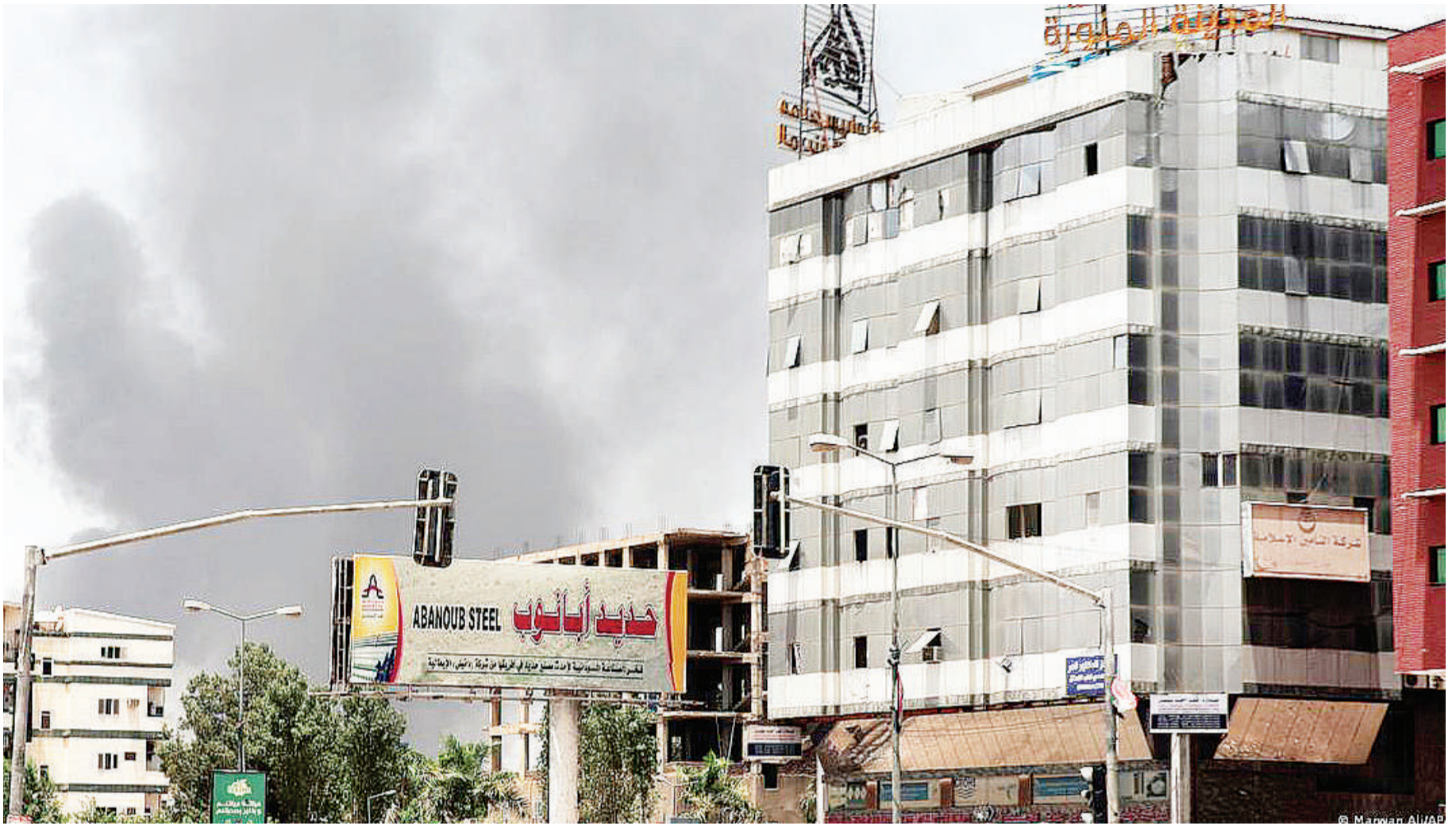
Anga la mji mkuu wa Sudan wa Khartoum limeendelea kutanda wingu la moshi unaotokana na milipuko ya mabomu.