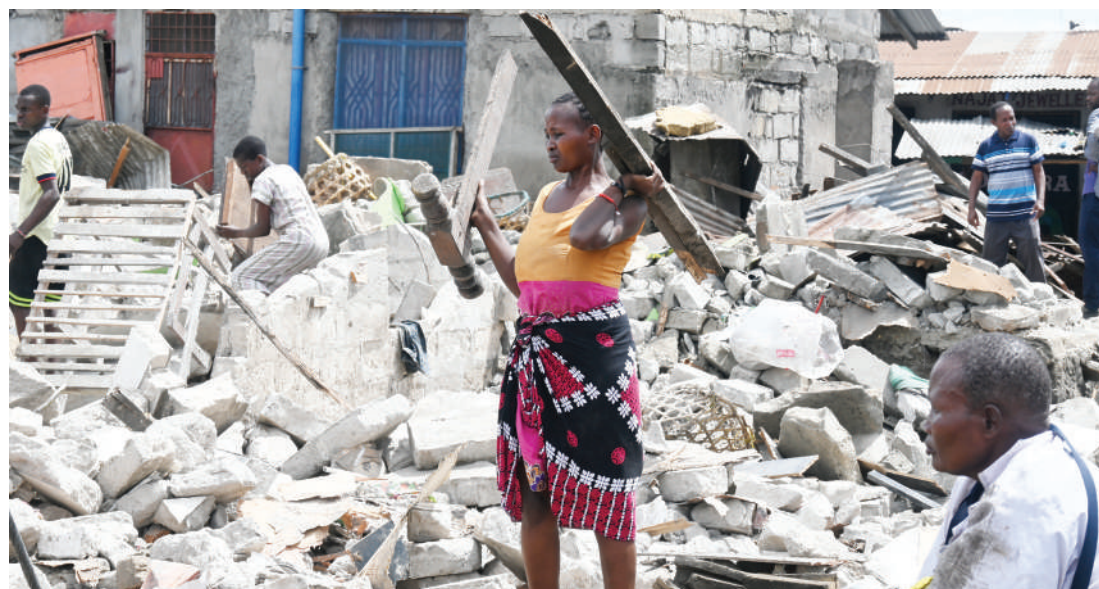
Baadhi ya wafanyabiashara wa Soko la kwa Bintikaenga, mtaa wa Matokeo, kata ya Mabibo, Dar es Salaam, wakioleka mabaki ya vitu vyao baada ya nyumba na mabanda yao ya biashara kuvunjwa sokoni hapo jana, kwa amri ya mahakama.

“Kila mwezi tutakuwa tukitoka zawadi kwa CRDB Wakala ambao watakuwa wamefanya miamala mingi, kufungua akaunti nyingi, na kuuza huduma za bima. Jumla ya zawadi zote katika kampeni hii ni pikipiki 40, bajaj tano na gari aina ya Toyota Alphad kwa mshindi wa jumla,” alibainisha.