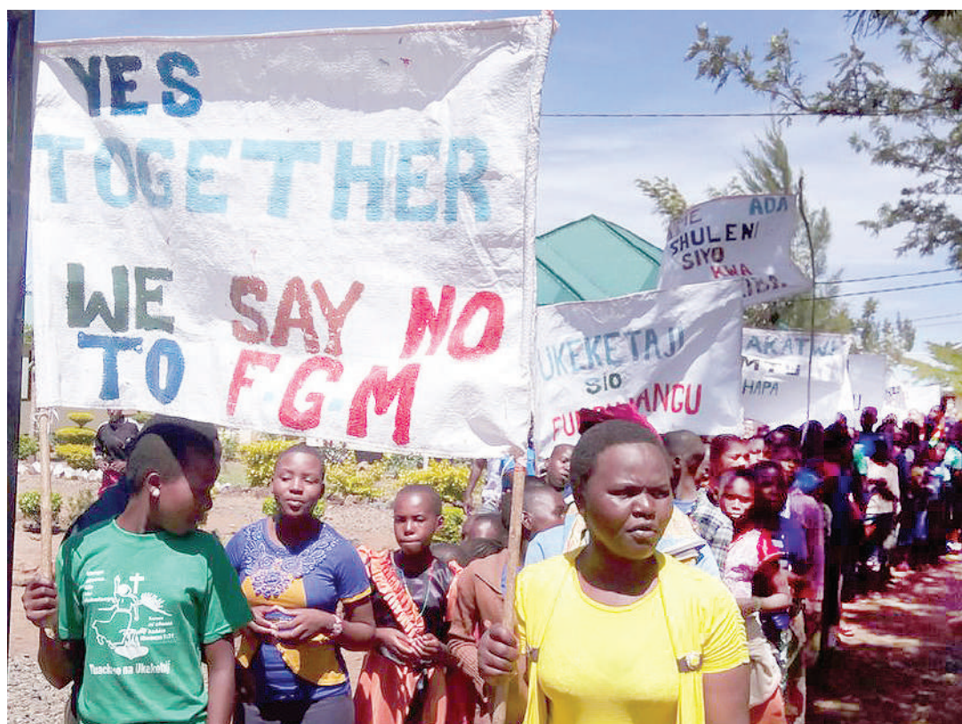
Harakati za kupambana na ukeketaji wilayani Tarime, inayoendana na elimu kwa umma.

"Kiungo kilichotolewa mwilini ni cha thamani sana... unapoondoa unasababisha kutokea madhara ambayo hayatarajiwi