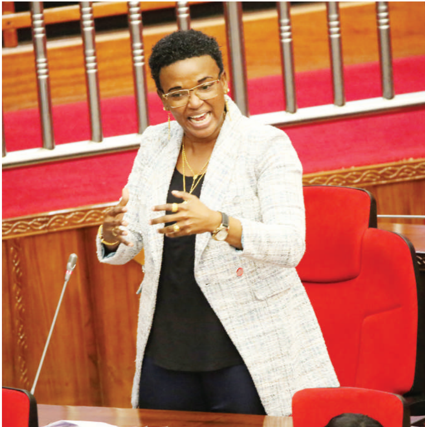
Mbunge Viti Maalum, Halima Mdee akichangia hotuba ya mkadirio ya mapato na matumizi ya Ofisi ya Rais, Tawala za Mikoa na Serikali za Mitaa (TAMISEMI) kwa mwaka wa fedha wa 2023/2024, Bungeni jijini Dodoma jana.