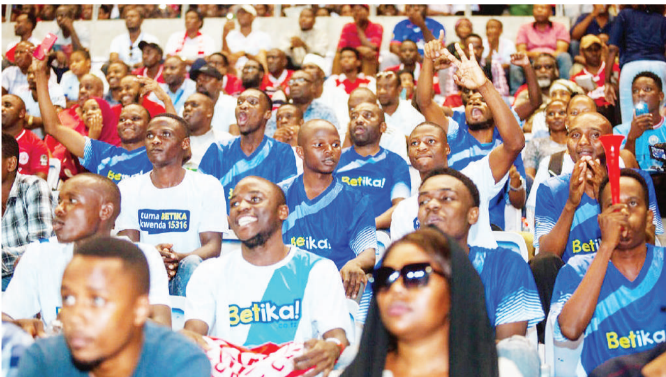
Mashabiki wa soka waliogharamiwa na Kampuni ya Betika wakifurahia mabao katika mechi ya Simba na Yanga iliyochezwa Uwanja wa Benjamin Mkapa, Dar es Salaam juzi. Simba ilishinda mabao 2-0.

"Tunapongelea utamaduni, sanaa za maonyesho na muziki kwa upana, ni tasinia inayoiwakilisha jamii, taifa katika tufe la dunia na hapa ndio pa kuitilia maanani tasinia hii na wasanii kwa ujumla wake," alisema.