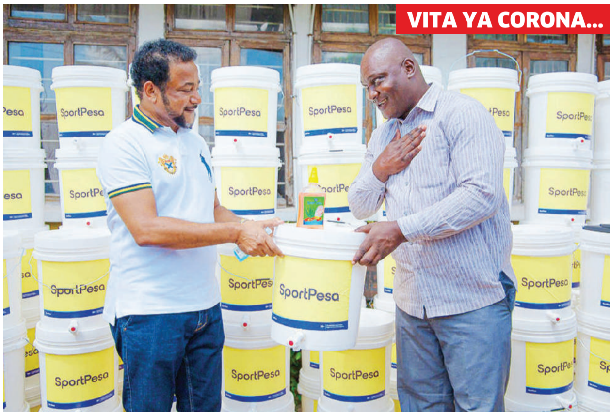
VITA YA CORONA...

Namungo FC inayotumia Uwanja wa Kassim Majaliwa ulioko Ruangwa mkoani Lindi, ni moja ya timu zilizoonyesha ushindani katika msimu huu ikiwa imepanga kwa mara ya kwanza, ambapo kwa sasa inashika nafasi ya nne ikiwa na alama 50 baada ya mechi 28.