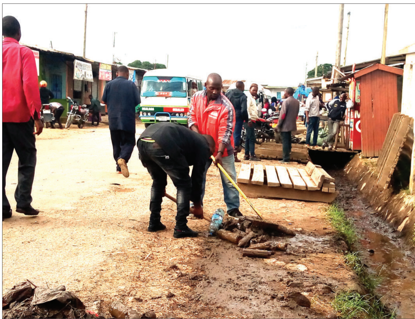
Baadhi ya madereva wa bodaboda wa Mji Mdogo wa Mbalizi mkoani Mbeya, wakizoa taka baada ya kufanya usafi kwenye moja ya mitaro iliyopo nje ya stendi ya mabasi ya mji huo, mwishoni mwa wiki.

Aliwataka kuzingatia kanuni bora za afya zinazoelekeza kunawa maji safi na salama yanayotiririka kwa kutumia vitakasa kabla na baada ya kutoka chooni sambamba na kuepuka misiongamano isiyokuwa ya lazima hasa kwenye magulio ya soko.