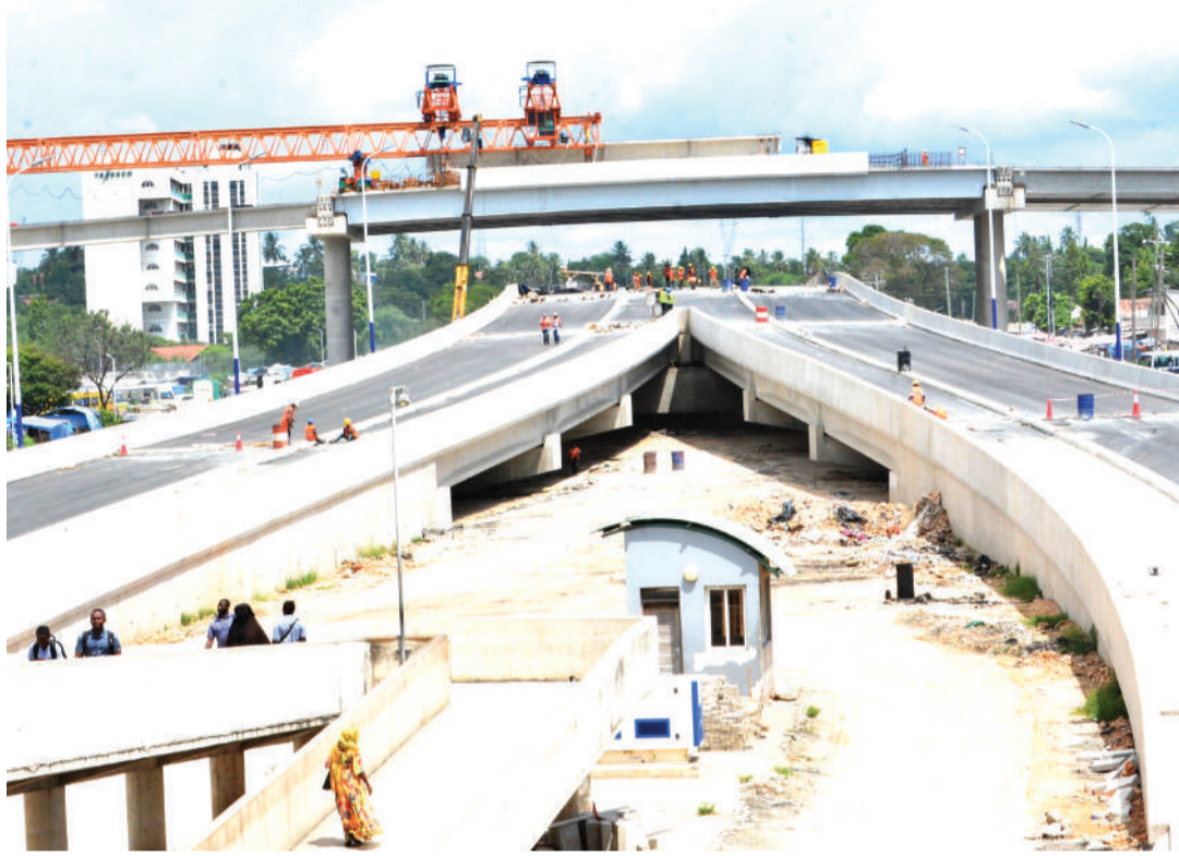
Mwonekano wa daraja la juu la Ubungo (Ubungo interchange), linaloendelea kujengwa katika makutano ya barabara ya Morogoro, Sam Nujoma na Mandela, jijini Dar es Salaam jana.