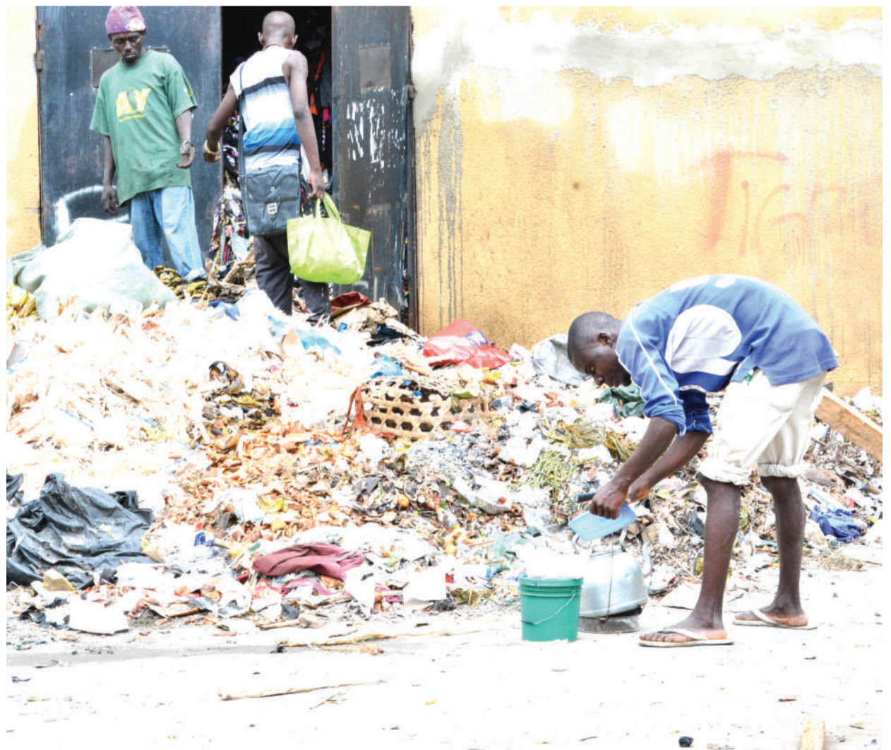
Mchuzi wa kahawa akiwahudumia wateja jirani na dampo la takataka katika eneo la Machinga Complex, Ilala, jijini Dar es Salaam hivi karibuni, kitendo ambacho ni hatari kiafya.

"Mimi na katibu wangu wa kanisa tulikuwa tukisuluhisha mgogoro wa ndoa yao mara kwa mara, juzi (Jumapili) tukitendelea na suluhu hiyo mwanaume alimtumumu mkewe kutoka nje ya ndoa huku mwanamke naye akidai yeye ni mfanyabiashara wa mahindi ya kupika hivyo mumewe alimkuta eneo la maegesho ya magari makubwa yanayokwenda Rwanda na Burundi akiwahudumia wanaume ndio chanzo cha mzozo wao," alidai.