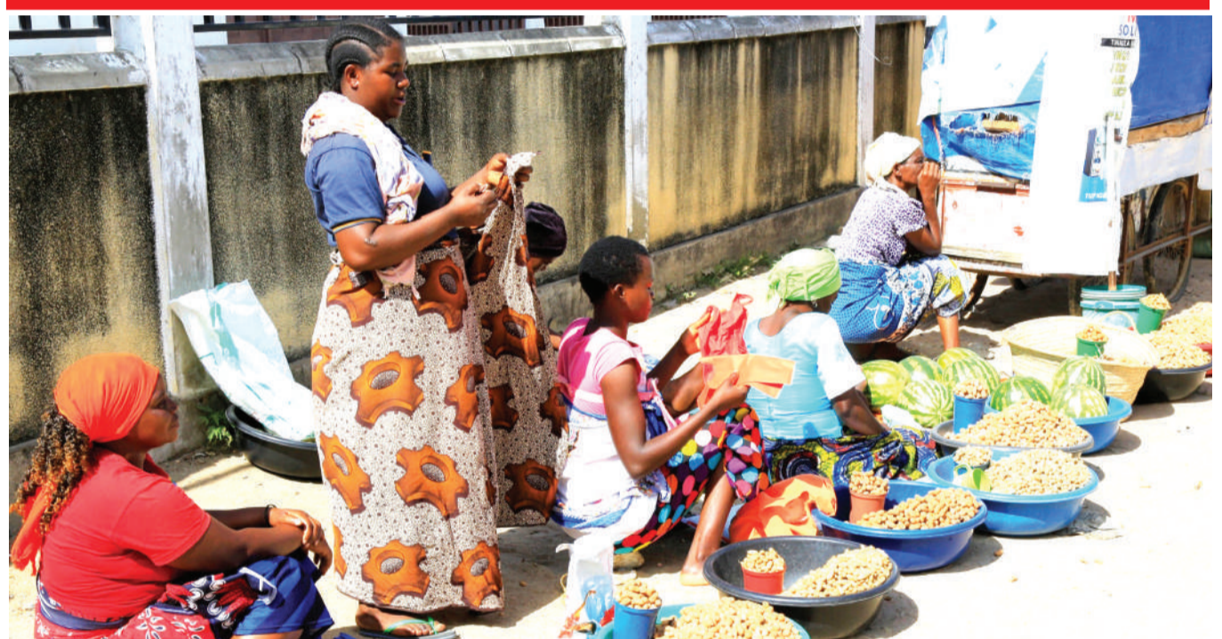
Wachuuzi wa karanga wakisubiri wateja katika eneo la Mji Mpya, jijini Dodoma jana, huku wakionekana kutochukua tahadhari ya kujikinga na maambukizi ya virusi vya corona, kutokana na kutoweka maji ya kunawa na sabuni au kitakasa mikono kwa ajili yao na wateja wao.

"Vitalu nyumba ni kiimo cha kisasa ambacho kina faida kubwa, mtu yeyote atakayekitumia atafanikiwa, na kukuza uchumi na kujipatia kipato," alisema.