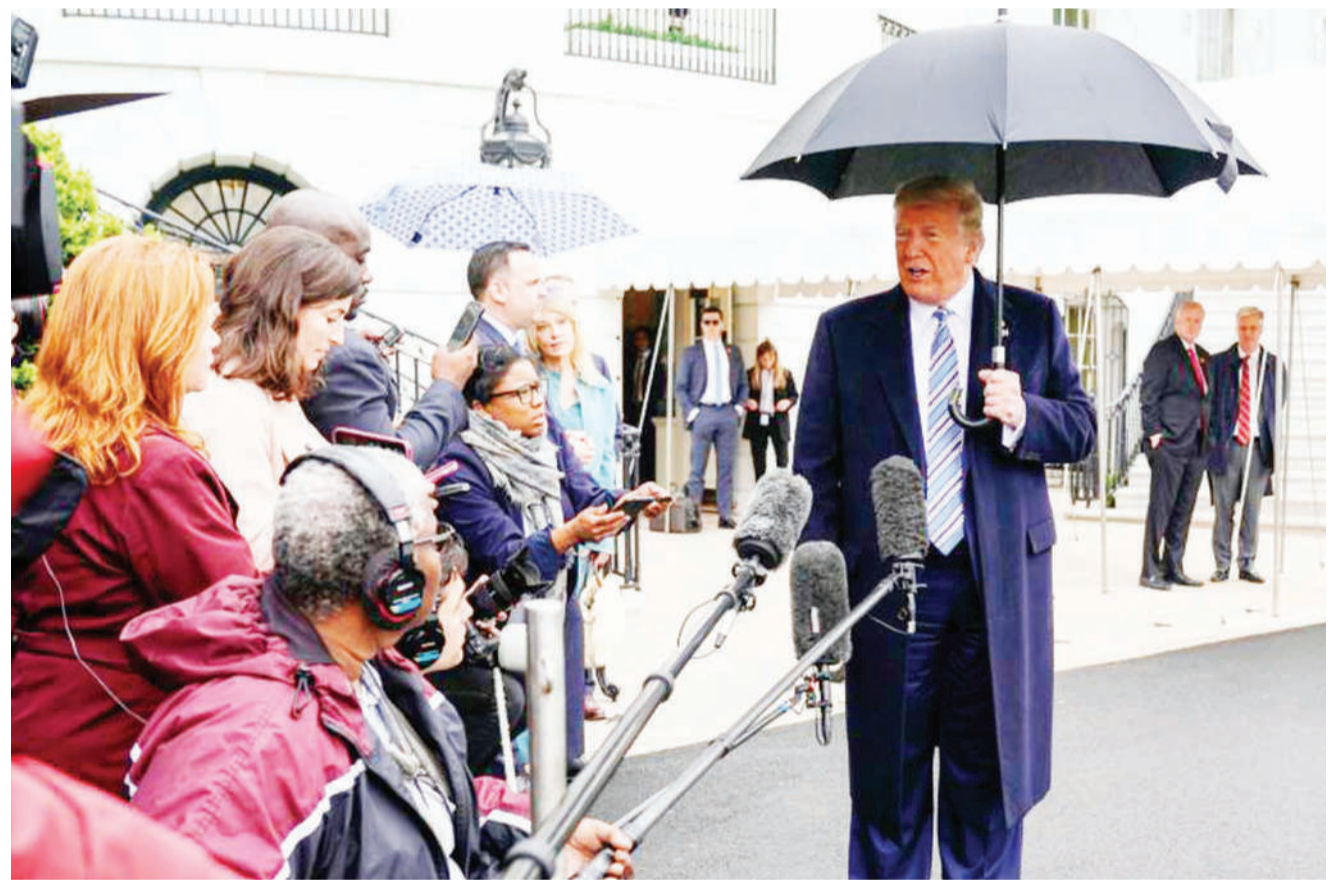
Rais Donald Trump akiongea na waandishi wa habari kabla ya kuondoka kuelekea Norfolk, Virginia.

Mwanzoni mwa wiki iliyopita, Rwanda ilitangaza kufunga mipaka yote ya nchi hiyo na watu kuamrisha kusalia majumbani mwao katika juhudi za kudhibiti maambukizi vya corona.