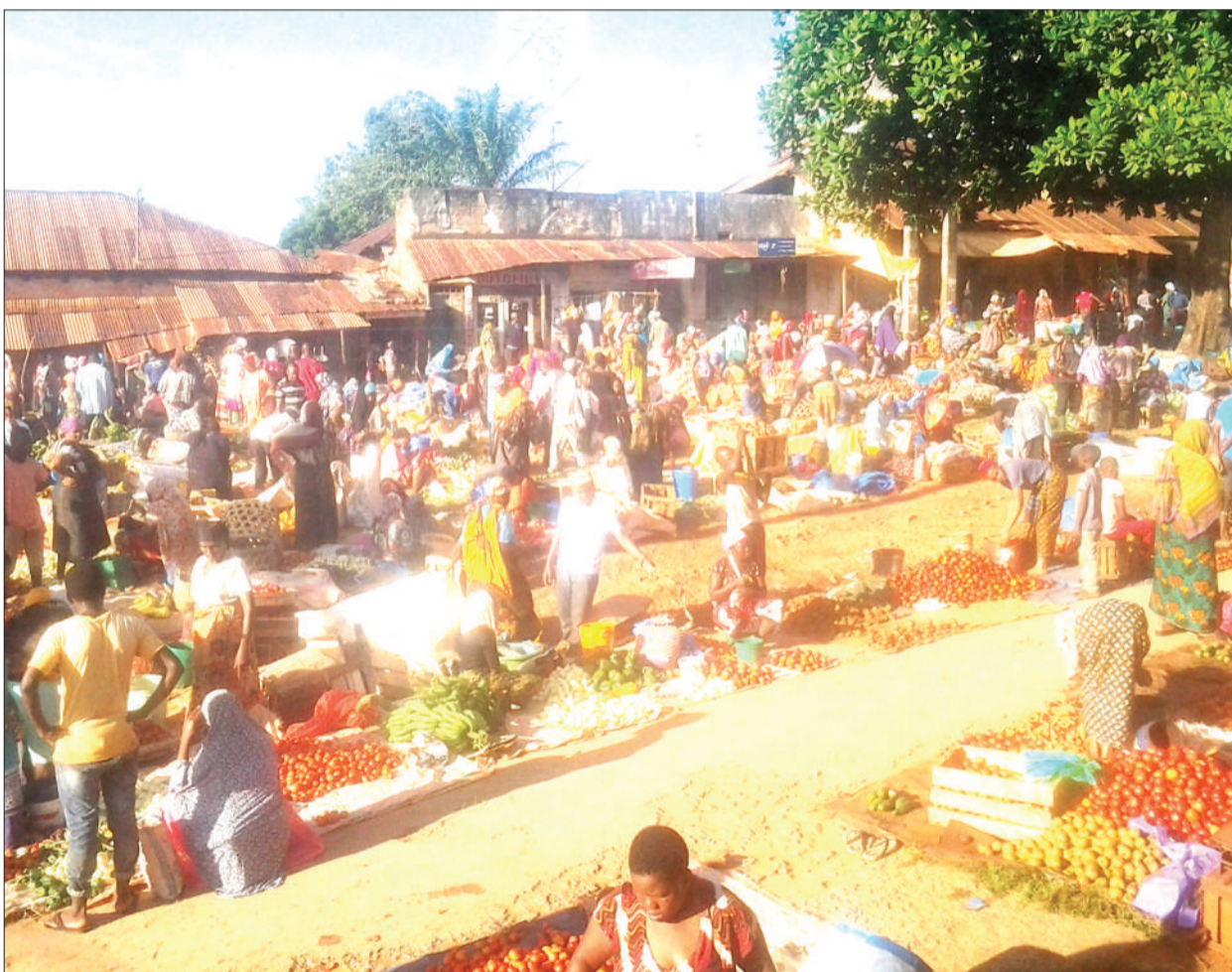
Wakazi wa Wilaya ya Muheza, mkoani Tanga, wakinunua mahitaji katika gulio la Jumatatu, eneo la Msikiti Mkuu wa Ijumaa, Muheza mjini jana, ambapo wakulima kutoka vijijini hupeleka mazao yao na kuyauza.

Pia alikagua Mahakama ya Hakimu Mkazi Kivukoni, Mahakama ya Wilaya Kinondoni na Mahakama za Mwanzo za Sinza, Kinondoni, Kawe, Kimara, Magomeni na Kariakoo.