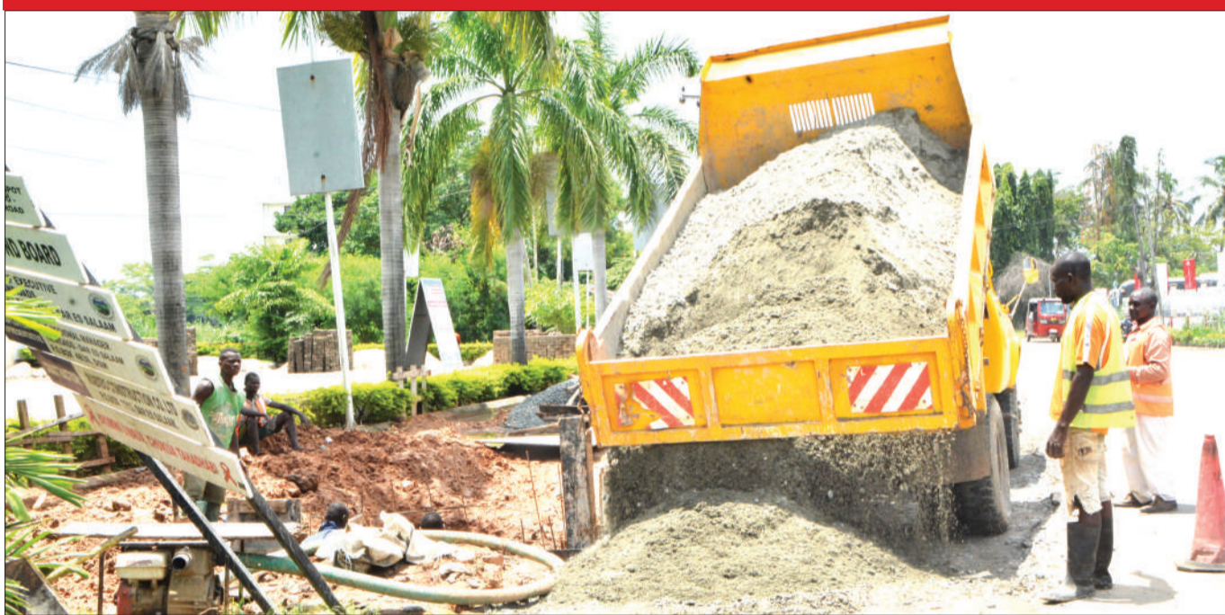
Mafundi wa kampuni ya Mabibo Construction Ltd, wakiendelea na ukarabati wa barabara ya Mwai Kibaki, eneo la Mikocheni Chama, jijini Dar es Salaam jana.