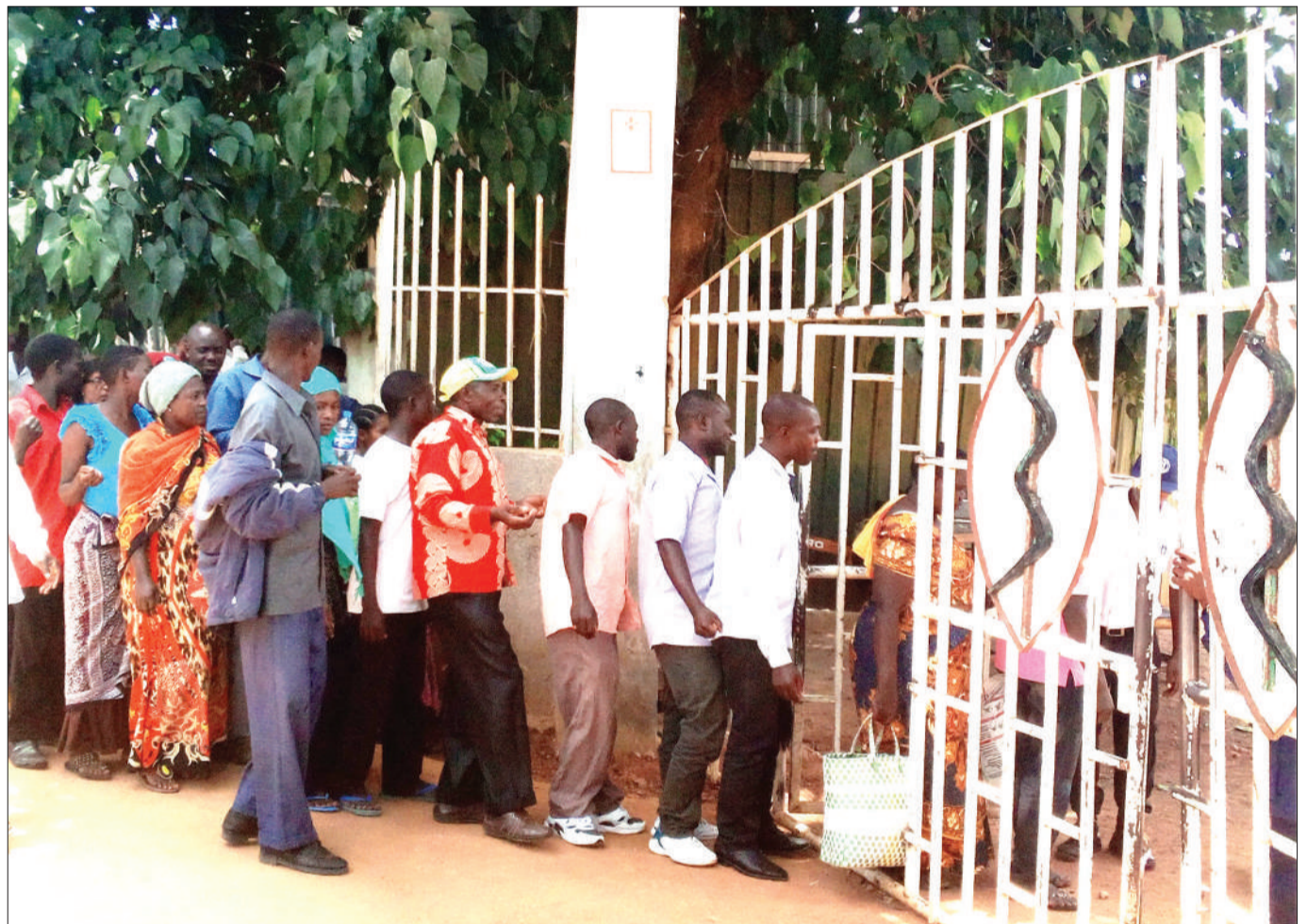
Baadhi ya wananchi wakiwa kwenye foleni ya kupimwa joto, kwa ajili ya kukabiliana na ugonjwa wa corona, ili waingie katika Hospitali ya Wilaya ya Kahama kuona na kusalimia wagonjwa waliolazwa katika hospitali hiyo, jana.