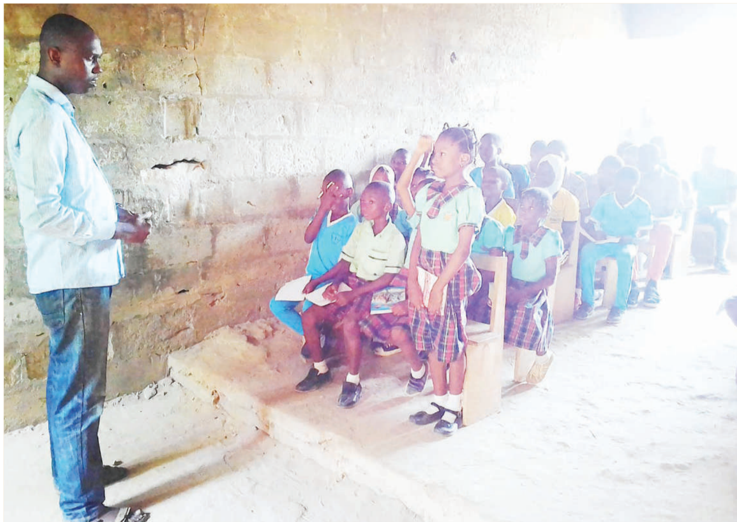
Katika mazingira haya ya kujisomea hata bila ya corona ni vigumu wanafunzi na walimu kutumia mitandao kwa vile hakuna miundombinu.

Kwanza jambo la awali ni kuhusu mpangilio wa kinachotakiwa kufundishwa au kuwahishwa kwa wanafunzi majumbani kwao kupitia mtandao. Mtaala hauwezi kuanza tu kupeleka majumbani au mtandaoni bila kujipanga utafanya hivyo kwa muda gani, na ni kwa kiwango gani wanafunzi watakuwa tayari kupokea masomo. Hata wanaolipiwa shule za binafsi