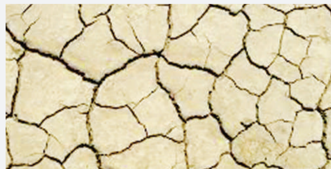
Mfinyanzi ni udongo unaomiza majengo pamoja na mazao hasa unapokauka.

Mbinu hii inatumika ili kuhakikisha msingi haugusani na udongo wa mfinyanzi. Ukishaondoa udongo wa mfinyanzi unaleta udongo mwingine mpya na kuweka kwenye eneo husika ambapo utajenga msingi huo. Njia hii inaweza ikaonekana ina gharama kubwa wakati unanza ujenzi, lakini ni mbinu ya uhakika kuhakikisha hukutani na changamoto za mipasuko na nyufa baada ya kumaliza kujenga.