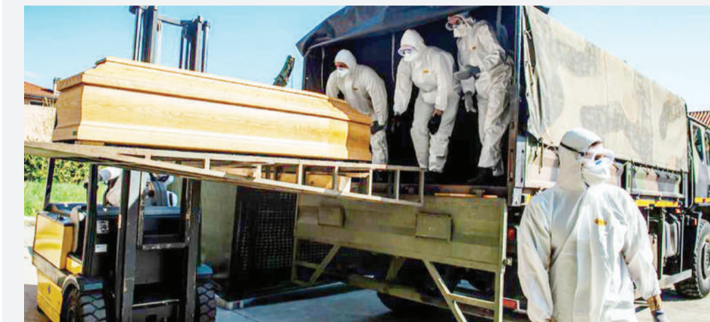
Mazishi ya waliokufa kwa corona nchini Italia.

WIKI imemalizika kwa corona kuingeza hofu zaidi, kwa upande wa Marekani madaktari na wauguzi wanaopambana na janga la virusi vya corona wameomba vifaa zaidi vya kujikinga ili kutibu idadi kubwa ya wagonjwa wanaotarajiwa kuongezeka.