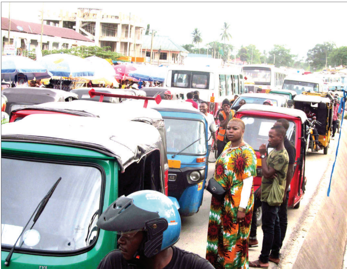
Wakazi wa Jiji la Dar es Salaam, wakijiandaa kuvuka barabara, huku bajaj 'zikitanua', pembeni na kusababisha foleni isiyo ya lazima na usumbufu kwa waenda kwa miguu katika eneo la Mbezi Mwisho, juzi.

"Mlangoni kabla ya kupanda basi kuna kifaa kwa ajili ya kunawa, tumeweka maji yenye tiba, hii ni moja ya tahadhari," alisema.