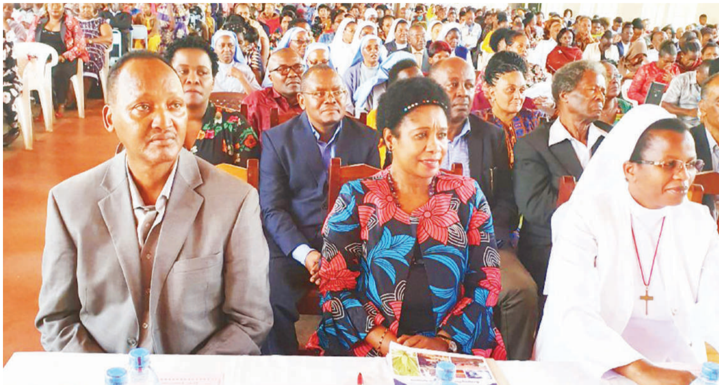
Wadau mbalimbali wa masuala ya ajira: PICHA ZOTE: MPIGAPICHA WETU

Gonsalves anasema ufanisi katika eneo hilo utapatikana kupitia uwekezaji mkubwa wa rasilimali,