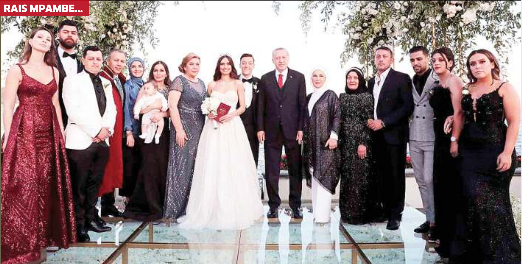
Kiungo wa Arsenal, Mesut Ozil, akipozi katika picha baada ya kufunga ndoa mwishoni mwa wiki na mpenzi wake, malkia wa urembo wa Uturuki, Amine Gulse, jijini Istanbul nchini Uturuki, huku akiwa na mpambe wake [Best Man] Rais wa nchi hiyo, Recep Tayyip Erdogan (wa saba kulia) na mkewe. Wengine ni ndugu jamaa na marafiki wa Ozil waliohudhuria shughuli hiyo.