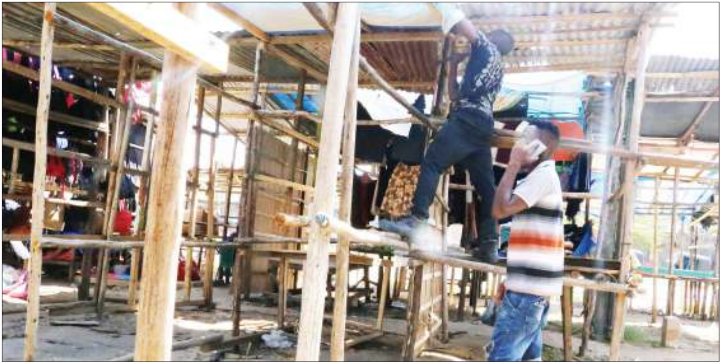
Wafanyabiashara wadogo wa Mwenge wilayani Kinondoni jijini Dar es Salaam wakiyaimarisha mabanda yao jana, baada ya kuhamishiwa eneo la Coca-Cola kupisha upanuzi wa Barabara ya Ali Hassan Mwinyi kutoka Mwenge-Morocco.