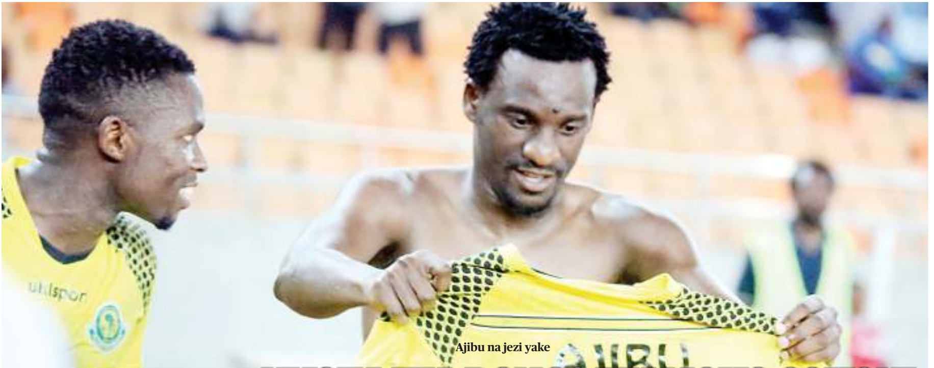
Ajibu na jezi yake