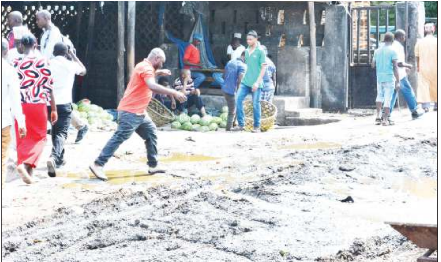
Wananchi wakipita kwa shida kwenye mlango wa kuingia katika Soko la Temeke Sterio, jijini Dar es Salaam jana, kutokana na maji machafu yanayotiririka kutoka kwenye taka.

Alisema mwananchi yeyote atakayekaidi agizo la serikali la kujenga karibu na barabara au kutupa taka kando ya barabara, achukuliwe hatua kwa mujibu wa sheria ili liwe fundisho kwa wengine.