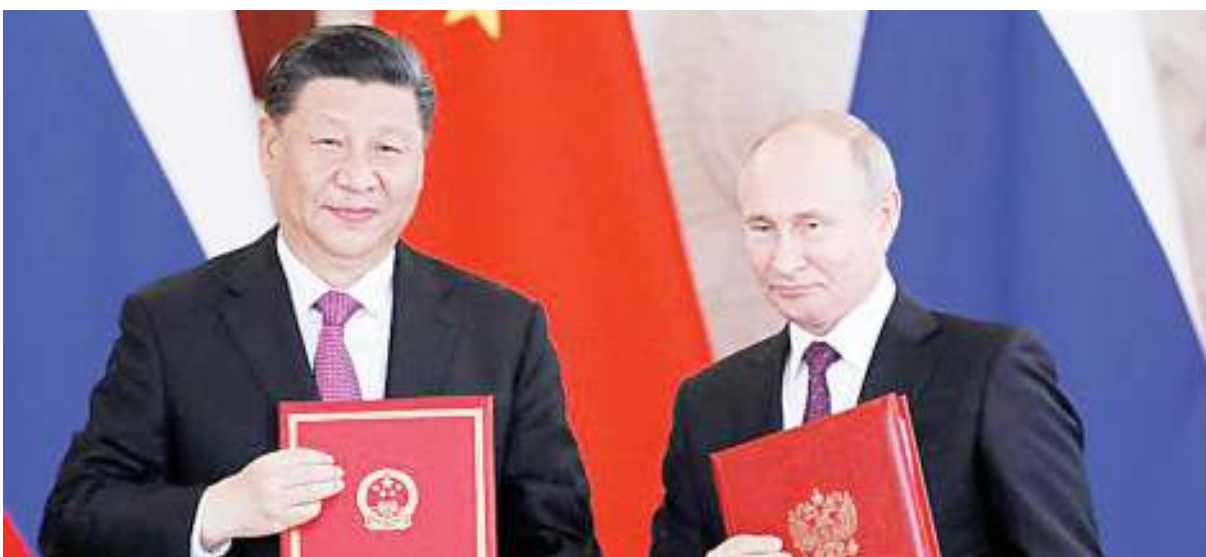
Rais wa China, Xi Jinping (kushoto) akiwa na Rais wa Urusi, Vladimir Putin, alipohudhuria kongamano la Kiuchumi la Urusi mjini St. Petersburg.