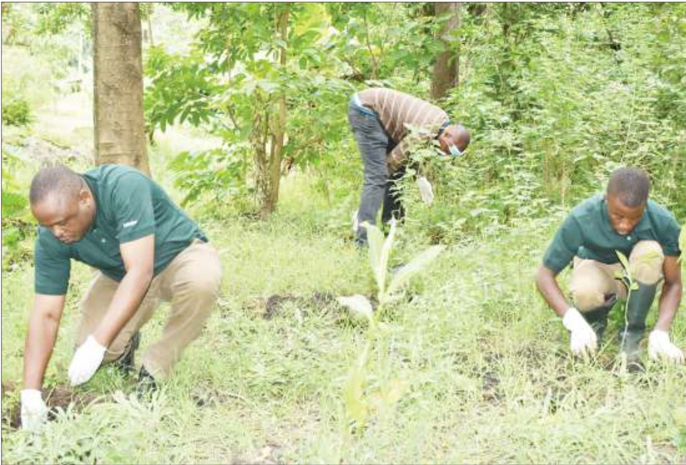
Baadhi ya wafanyakazi wa TBL Arusha, wakishiriki katika zoezi la upandaji miti katika Shule ya Sekondari Muriet iliyopo jijini humo, mwishoni mwa wiki, katika maadhimisho ya Siku ya Mazingira Duniani, ambapo walipanda zaidi ya miti 1,000 katika shule hiyo na chanzo cha maji kilichopo Mtaa wa Kambarage, Kata ya Them.

"Naomba niseme endapo itabainika kuna ubadhirifu wa fedha katika mradi huu, naomba sheria ichukue mkondo wake," alisisitiza.