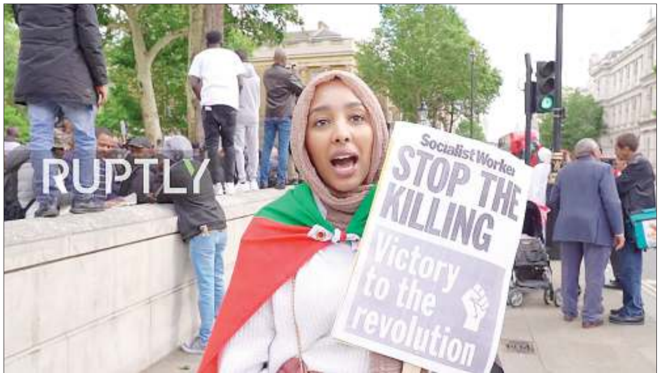
Mwanamke nchini Sudan akiwa ameshika bango lenye maandishi ya kuhamasisha jeshi kusitisha mauaji ya raia.