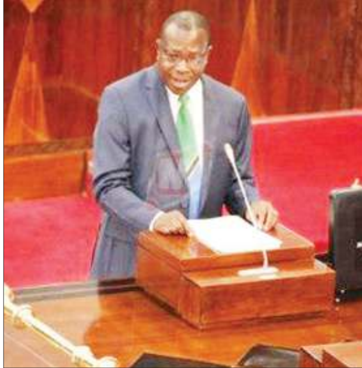
Waziri wa Fedha na Mipango, Dk. Philip Mpango

Mabilioni yaliyookolewa, yametumika kutekeleza miradi muhimu ikiwamo ya ujenzi wa madaraja, barabara za juu kwenye makutano ya barabara kuu jijini Dar es Salaam na Daraja la Furahisha jijini Mwanza, ukarabati wa shule kongwe zote nchini pamoja na zilizoharibiwa na