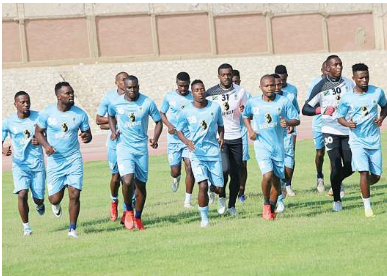
Wachezaji wa Timu ya Taifa ya Tanzania ‘Taifa Stars’ wakiwa mazoezini katika Uwanja wa Movenpick jijini Cairo, Misri jana asubuhi kujiandaa na fainali za Mataifa ya Afrika (Afcon) 2019.

Katika mechi za Afcon, Stars ambayo iko Kundi C itacheza mechi yake ya kwanza dhidi ya Segenal Juni 23, halafu itakutana na Kenya (Juni 27) na itamaliza hatua ya makundi Julai Mosi, mwaka huu kwa kupambana na Algeria.