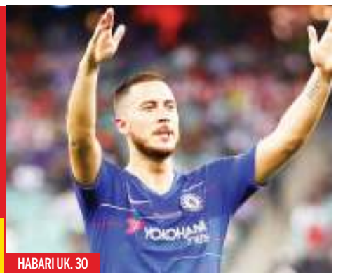
HABARI UK. 30