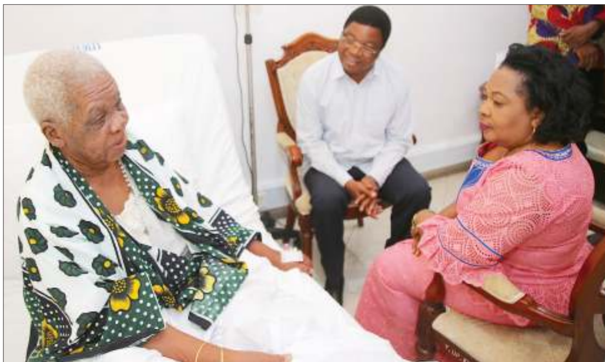
Waziri Mkuu, Kassim Majaliwa na mkewe Mary (kulia), wakimjulua hali Mama Maria Nyere-re anayepatiwa matibabu jijini Dar es Salaam, jana.