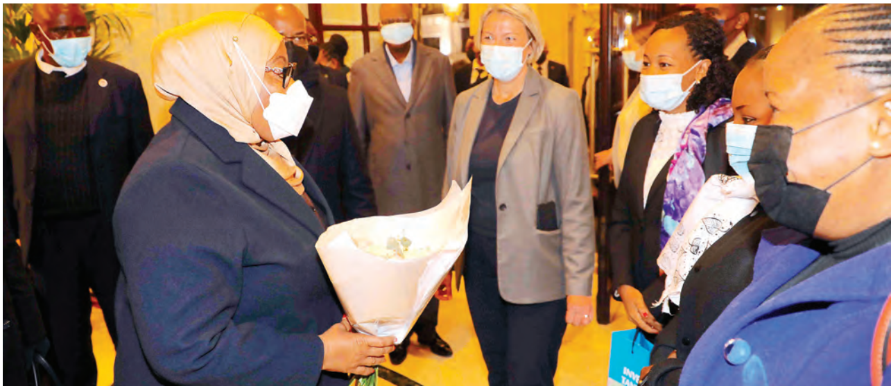
Rais Samia Suluhu Hassan, akizungumza na viongozi mbalimbali baada ya kuwasili jijini Paris, Ufaransa jana, kushiriki mkutano wa wakuu wa nchi na serikali utakaojadili rasilimali bahari duniani.