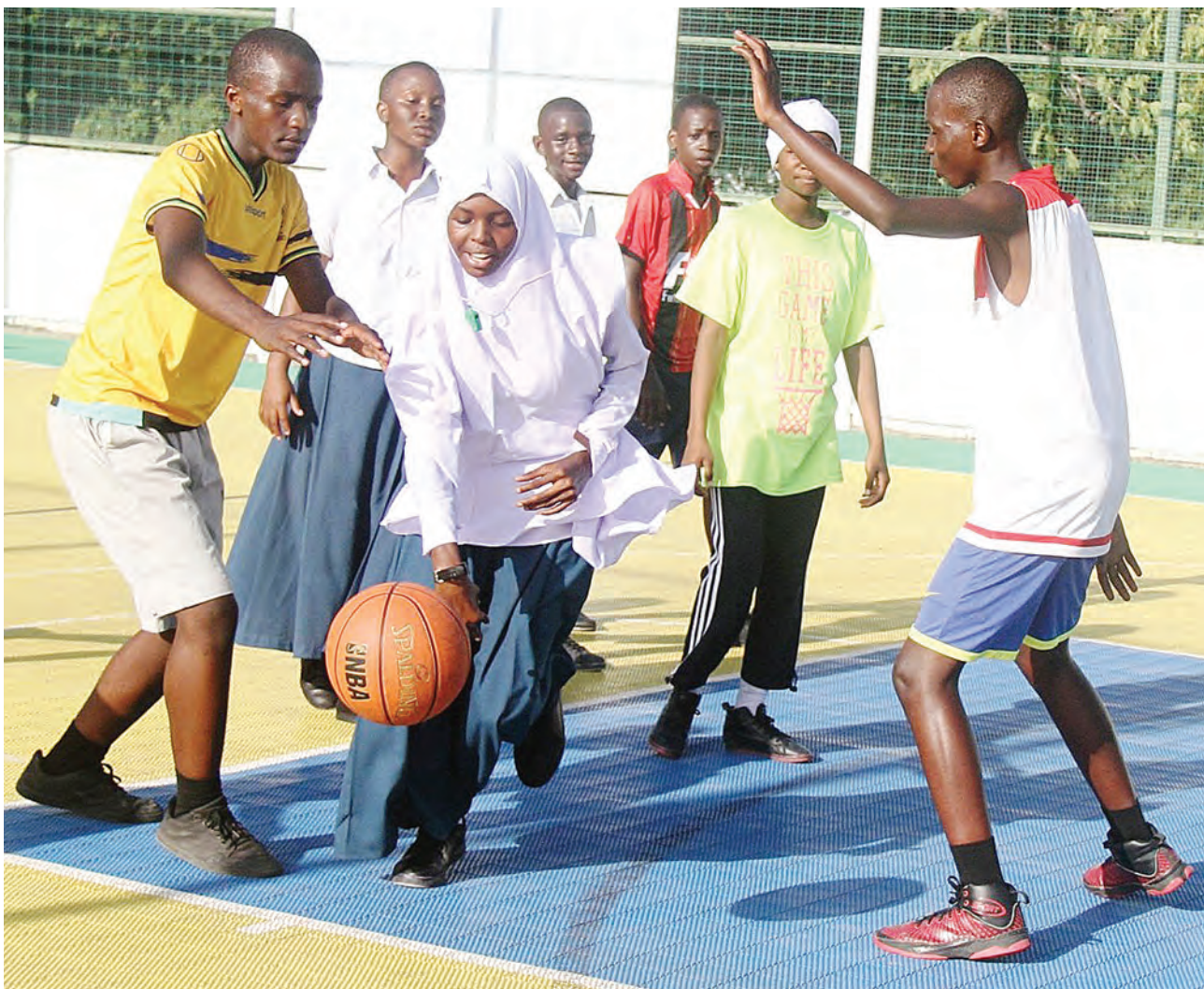
Wanafunzi wa shule mbalimbali za sekondari Dar es Salaam wakichuana katika mpira wa kikapu kwenye viwanja vya Jakaya Kikwete jijini juzi.

“Tunajua bado tuna michezo mingi mbele yetu, kwa sasa tunajipanga kuikabili Black Sailor, tutashuka dimbani katika mechi hiyo kwa kufuta makosa tuliyoafanya nyuma, tunajua kiu yetu ni kutetea tena ubingwa,” aliongeza Ame.