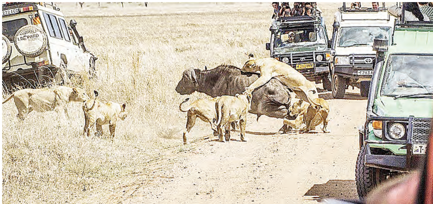
Namna ilivyo ustawi wa simba hifadhini na ongezeko la watalii nchini. PICHA: MTANDAO.

Eneo lingine analotaja waziri ni serikali kuitengea bajeti ya kuto-sha Wizara ya Maliasili na Utalii, inayotumika katika kuendesha operesheni za kukabiliana na ujangili, mazao yake yakionekana kwa ujangili kukomeshwa kwa zaidi