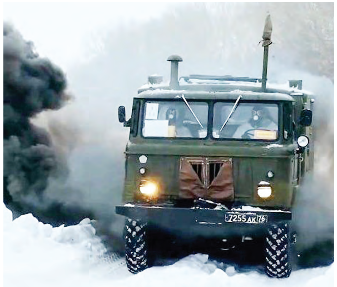
Gari la kijeshi ambalo limeonekana katika eneo la zamani la kivita tangu kutokea kwa vita baridi kati ya Urusi na Belarus. Umoja wa Kujihami wa Nchi za Magharibi (NATO), umedai Urusi imeanza 'chokochoko' jirani na mpaka wa Ukraine.