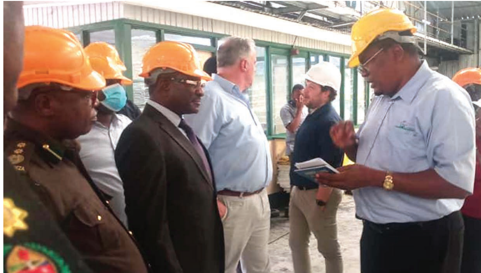
Uongozi wa serikali mkoani Kilimanjaro, ulipozuru kiwanda cha sukari TPC kupata ufafanuzi wa hali ya uzalishaji sukari.

Anawaonya wafanyabiashara wanaofanya hayo wabadilike haraka, akidodosa kuwa ameuunda kikosi kazi maalum kuibua undani wa tatizo lilipo na kuyapatia majawabu