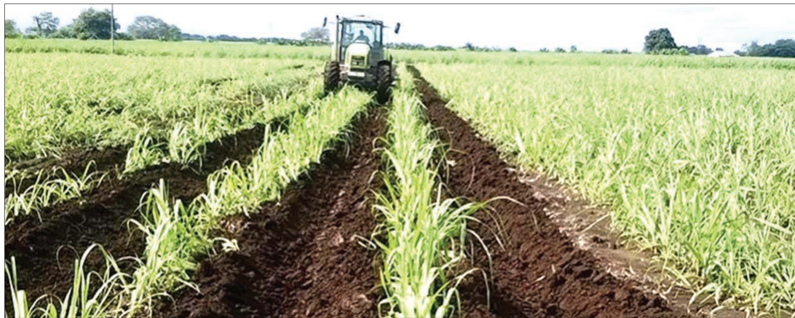
Shamba la miwa la kiwanda cha sukari TPC lililoko Moshi, ambayo ni malighafi yake.

“Kupanda kwa bei kiholela lazima tukomeshe. Nawaomba sana wafanyabiashara mnachofanya ni kosa kubwa, hivyo mnapaswa kubadilika na kufanya biashara kwa amani na utulivu,” anasema.