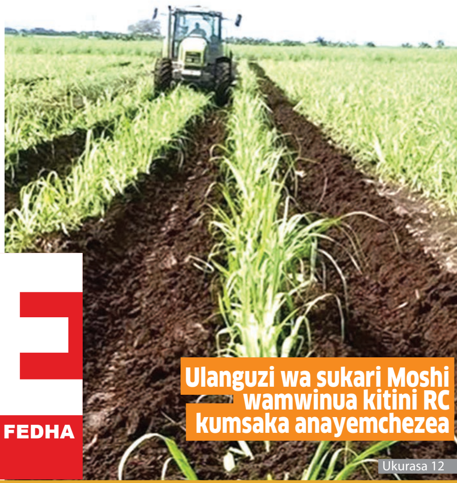
Ulanguzi wa sukari Moshi wamwinua kitini RC kumsaka anayemchezea