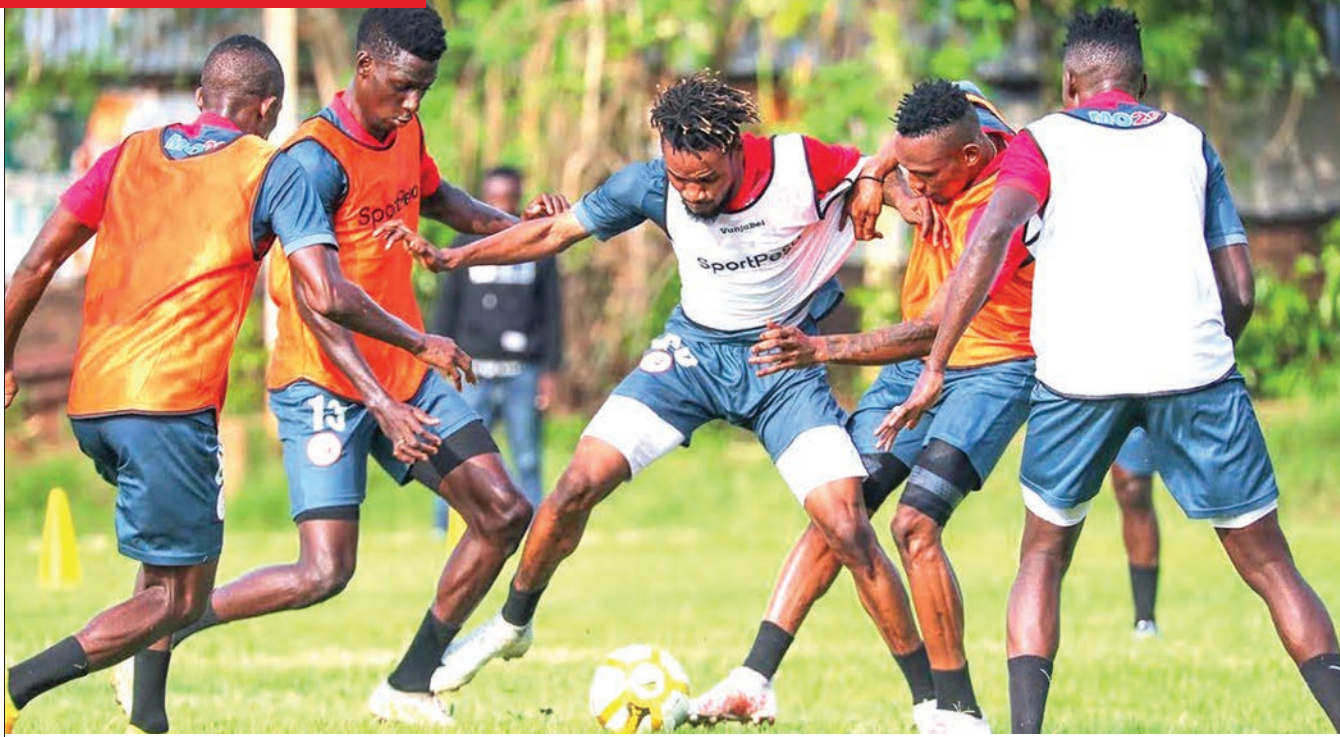
Wachezaji wa Simba wakiwa mazoezini. Timu hiyo itashuka Uwanja wa Benjamin Mkapa Jumapili saa 4:00 usiku kuikaribisha US Gendarmerie ya Niger kwenye mechi ya mwisho ya Kundi D ya Kombe la Shirikisho Afrika.