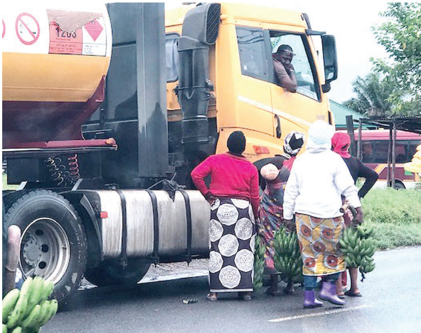
Wafanyabiashara wa ndizi katika Mji wa Ushirika wilayani Rungwe mkoani Mbeya, wakimshawishi dereva wa lori kununua bidhaa yao, jana.

"Halmashauri ya Wilaya ya Mbozi iliposikia nimenunua jengo hilo, mwaka 2008 waliniungulia kesi ya uvamizi," alisema.