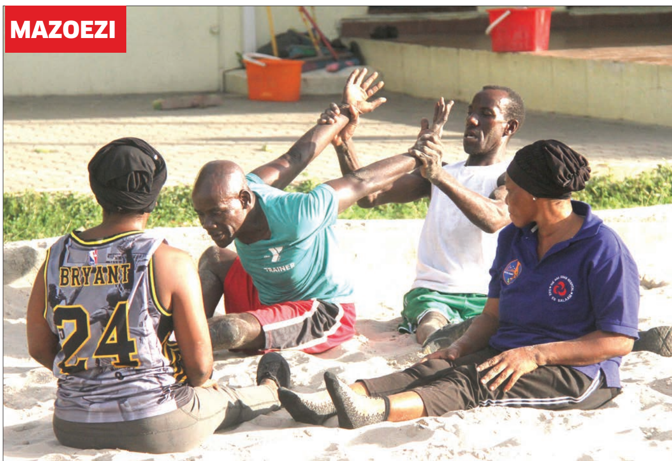
Wachezaji wa timu ya watu wenye walemavu, wakifanya mazoezi ya viungo katika viwanja vya Kituo cha Jakaya Kikwete (JMK), jijini Dar es Salaam jana.