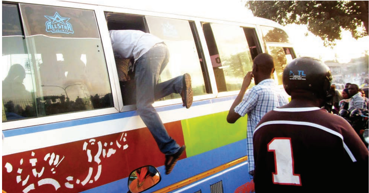
Abiria akiingi kwenye daladala kwa kupita dirishani katika kituo cha Mbezi Mwisho kuelekea Gongo la Mboto kupitia Barabara la Malamba Mawili, Manispaa ya Ubungo, mkoani Dar es Salaam mapema wiki hii.

Shauri alisema kwa sasa watu wake kwa kushirikiana na wenye bodaboda wanamalizia mchakato huo.