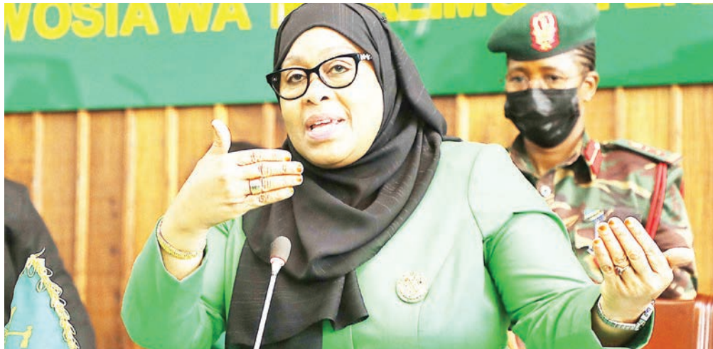
Mwenyekiti wa Chama Cha Mapinduzi (CCM), Rais Samia Suluhu Hassan, akiongoza Kikao cha Halmashauri Kuu ya CCM Taifa, jijini Doda jana.