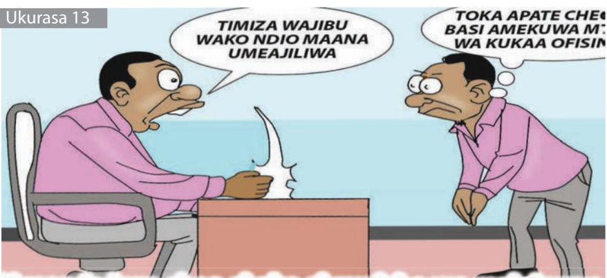
Kupanda kwa cheo chako si mwisho wa majukumu