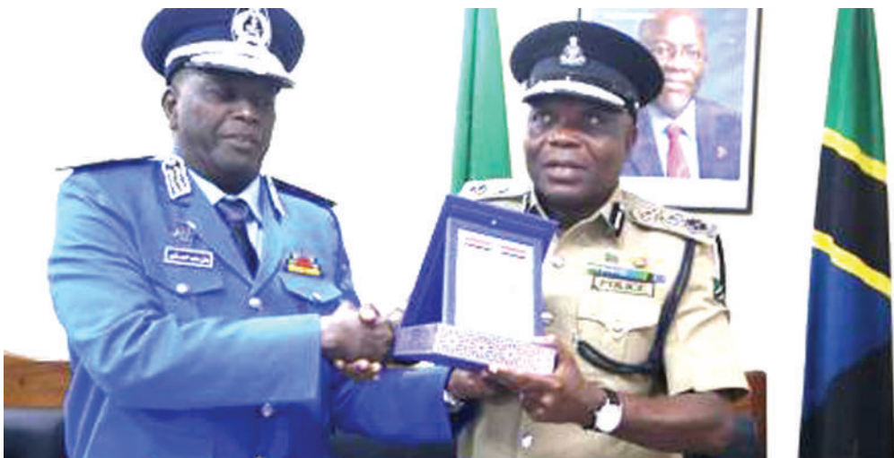
Alipokabidhiwa kuongoza Polisi Afrika Mashariki.