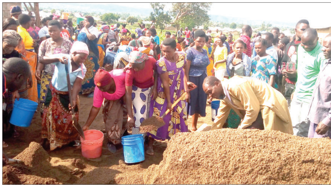
Wananchi wa Kata ya Uten-gule - Usongwe katika Mamlaka ya Mji Mdogo ya Mbalizi, wakishirikiana kusomba mchanga wakati wa ujenzi wa vyumba vya madarasa tisa katika Shule ya Sekondari Usongwe, wikiendi, ili kukabiliana na tatizo la uhaba wa vyumba hivyo uliosababisha wanafunzi 400 wa ki-dato cha kwanza wakose nafasi.

Awali Mshauri wa Kanisa hilo, Lehner alieleza kuwa viongozi hao walikata miti ya kanisa hilo iliyokuwa katika Wilaya ya Mbozi mkoani Songwe na Wilaya ya Mbeya lakini kanisa halikuambulia chochote.