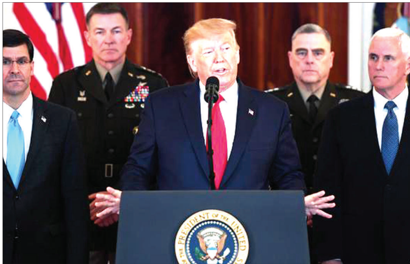
Rais wa Marekani, Donald Trump (Katikati) akiongea na vyombo vya habari wakati akiionya Iran kuacha kuwashambulia raia wa Marekani wanaoishi nchini humo.