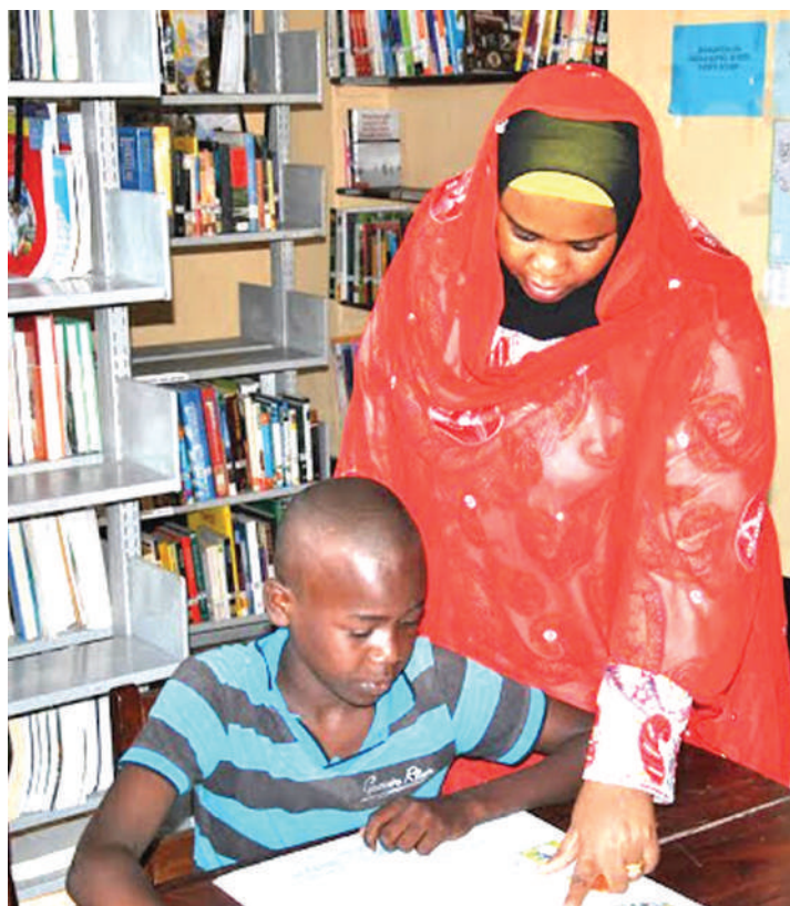
Mwanafunzi akiwa maktaba ya shule.