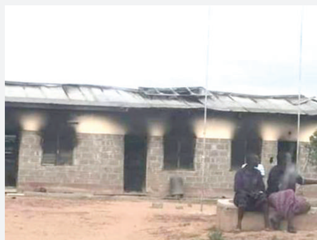
Shule na jengo jingine lililoathiriwa. PICHA ZOTE: MTANDAO Garissa, KENYA

N i shambulio la kigaidi liliyoishia walimu watatu ku-uawa, baada ya wanaoshukiwa kuwa wanamgambo wa Al Shabab kuvamia mji wa Garissa, Kaskazini mwa Kenya katika mpaka wa nchi hiyo na Somalia. Walimu hao watatu wakazi wa eneo hilo walipigwa risasi hadi kufa, huku kituo cha polisi kikichomwa moto na mfumo wa mawasiliano kuharibiwa katika eneo la Kamuthe, asubuhi ya jana.