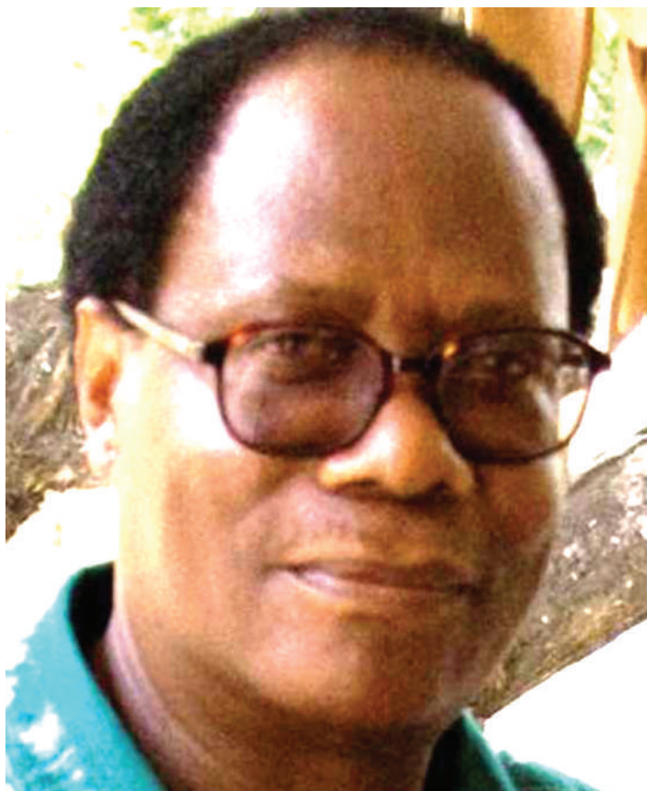
Marehemu Profesa Euphrase Kezilahabi.