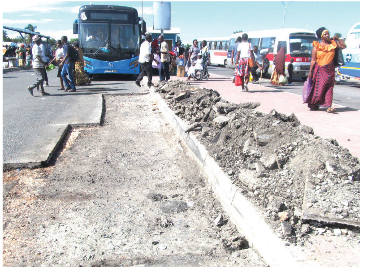
Lami ikiwa imebanduliwa bila ya kufanyiwa ukarabati katika kituo cha daladala cha Mbezi Mwisho, jijini Dar es Salaam na kusababisha usumbufu kwa mabasi yanayotumia kituo hicho.

"Serikali ilitoa muda wa kutosha kwa wananchi kujandikisha na kupata vitambulisho vya Taifa, na wengine tuliwafuata hadi kwenye kata zao, lakini kwa kupuuza zoezi hili hawakujitokeza kwa wingi na zimebaki siku chache ndio wanajitokeza na kujazana kwenye ofisi za Nida," alisema Ndan-ya.