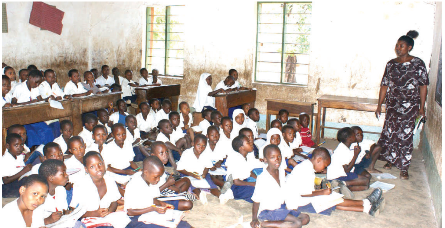
Aina ya madhila ya darasani, yanayozaa hatima kwenye chumba cha mitihani.

za uongozi na mizozo katika shule au inayogusa walimu kwa jumla wasifanye kazi yao vizuri. Kimantiki, itakuwa inagusa shule, kwani itaonekana kupitia ubora wa jumla wa elimu kitaifa, viwango vya kufundisha na mitaala inayooana na uwezo, au ari ya walimu.