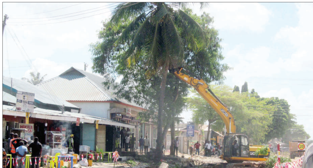
Katapila likikata miti katika eneo la Sinza kwa Remmy, jijini Dar es Salaam jana, kwa ajili ya kupisha ujenzi unaoendelea wa upanuzi wa barabara ya Shekilango.

Naibu Waziri akizungumza na watumishi walio chini ya wizara anayoiongoza, alizitaka halmashauri zote nchini kuhakikisha zinalipa serikali kuu kodi zinazohusu ardhi.