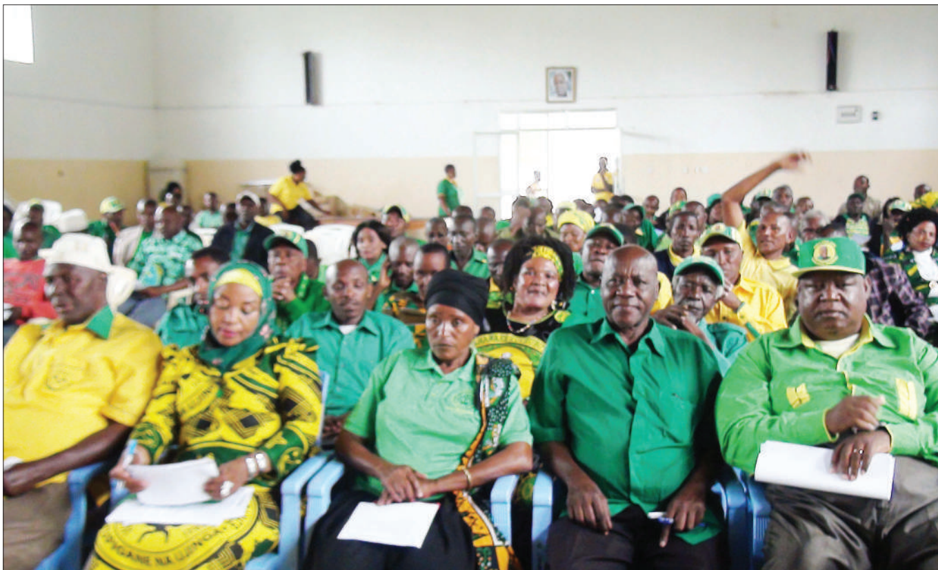
Baadhi ya wajumbe wa Kikao cha Halmashauri Kuu ya Chama Cha Mapinduzi (CCM), Wilaya ya Manyoni, jana, kwa ajili ya kupokea taarifa ya utekelezaji wa ilani ya uchaguzi wa mwaka 2015.

"Kupitia uchunguzi ule, tumebaini kwamba zaidi ya vyama 30 vya Msingi vya Ushirika (AMCOS) vya Mkoani Lindi viliwadhulumu wakulima wa ufuta kiasi cha zaidi ya Sh. bilioni Sh. 1.23. Kupitia uchunguzi huo tuliwakamata na kuwahoji zaidi ya viongozi 300 wa AMCOS zilizokuwa zinahusika katika dhuluma hii. Tulifanikiwa kuokoa zaidi ya Sh. bilioni 1.042. Fedha hizi zilikuwa ni mali ya wakulima wa ufuta ambao walidhulumiwa fedha hiyo na Viongozi wa Vyama vya AMCOS."