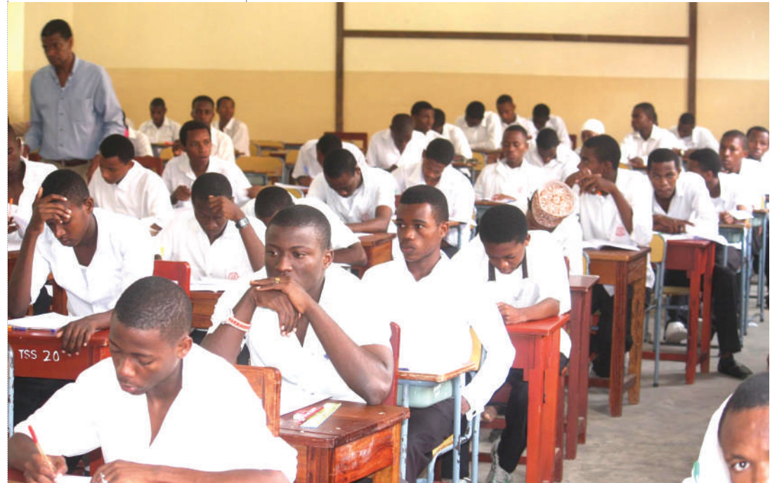
Wanafunzi wakiwa katika chumba cha mitihani.

kuwepo wafanyakazi hewa katika sekta hiyo. Ni mazingira yanayoongeza mzigo wa mishahara inayodakwa na watu wachache wanaochukua mishahara ya ziada na hivyo kukwamisha ununuzi wa vifaa, ujenzi wa shule, uharaka wa