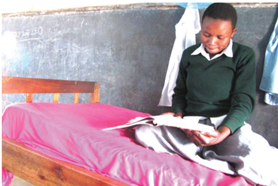
Mwanafunzi akijisomea.