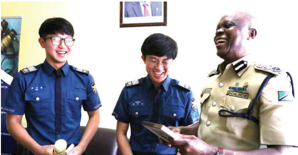
Alipokutana na wanafunzi wa kigeni wa upolisi.