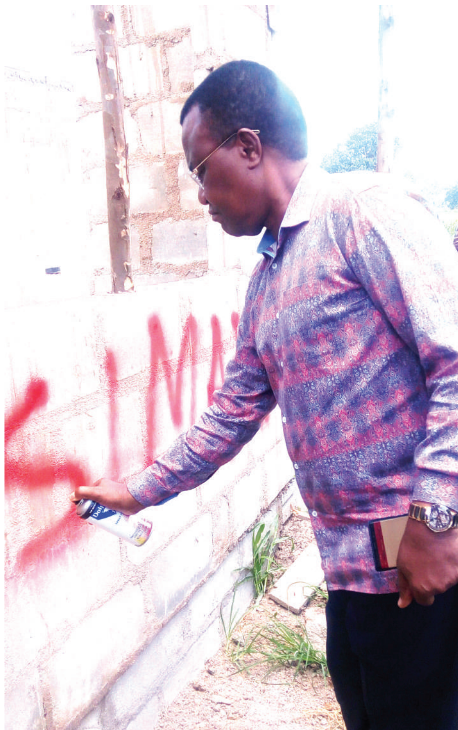
Waziri wa Ardhi, Nyumba na Maendeleo ya Makazi, William Lukuvi, akiandika maandishi ya kuzuia ujenzi wa nyumba iliyokuwa ikijengwa bila kibali eneo la Ndachi, Kata ya Mnadani, jijini Dodoma, juzi.