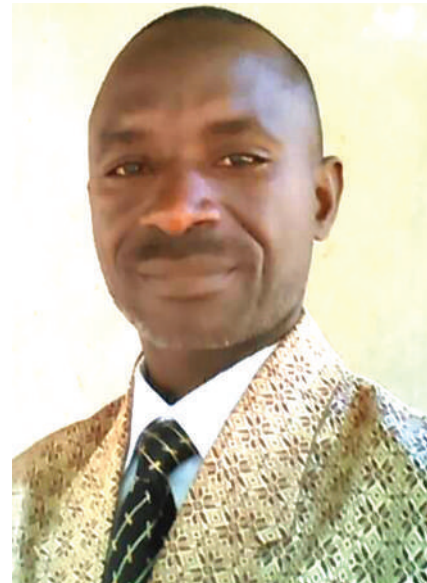
Mwalimu Mkuu wa Shule ya Msingi Kilindoni, ambayo ni Kioo cha mageuzi ya mafanikio Mafia.

U NAPOZUNGUMZIA Bunge la Wanafunzi Shuleni, si wanafunzi au walimu wote katika shule za msingi nchini wanafahamu nini maana yake? Kimsingi, ni chombo kilichoanzishwa na wanafunzi kwa kushirikiana na Shirika lisilokuwa la kiserikali la ActionAid Tanzania, lengo ni kuwasilisha kero wanazokutana nazo shuleni au katika jamii wanayotoka. Imegeuka kuwa chombo pekee kisiwani Mafia, hususan katika Shule ya Msingi Kilindoni, ambako ujumbe unakusudiwa umeifika jamii bila kikwazo chochote sasa.