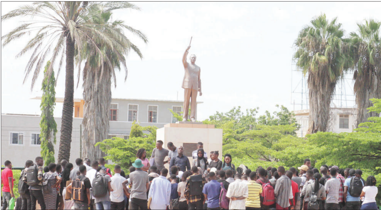
Baadhi ya wanachuo wa Chuo Kikuu cha Ardhi, wakiwa mbele ya sanamu ya Baba wa Taifa, katika eneo la Nyerere Square, jijini Dodoma jana, kujifunza mambo mbalimbali.