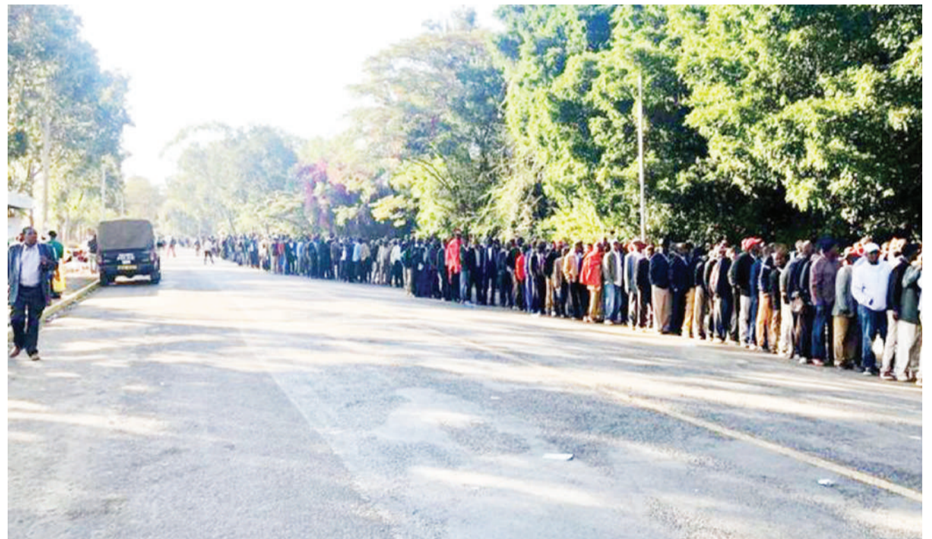
Umami ulioshuhudiwa nje ya Chuo Kikuu cha Kabarak huko Baringo, Kaunti ya Nakuru katika maziko ya Rais mstaafu wa Kenya, Daniel arap Moi, jana.

Amesema ni kutokana na hilo kwamba Wakenya wanafaa kusherehekea maisha yake. BBC