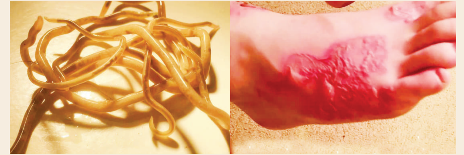
Ndivyo walivyo minyoo na athari zao.