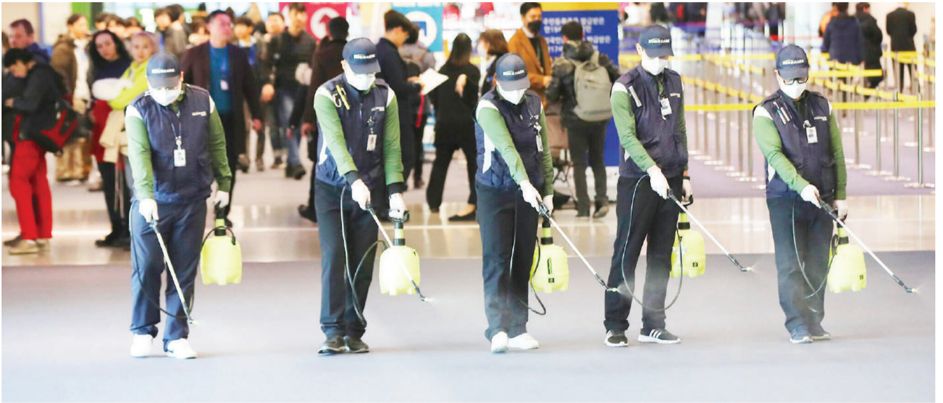
Harakati za kujihami na maradhi ya corona, katika uwanja wa ndege.