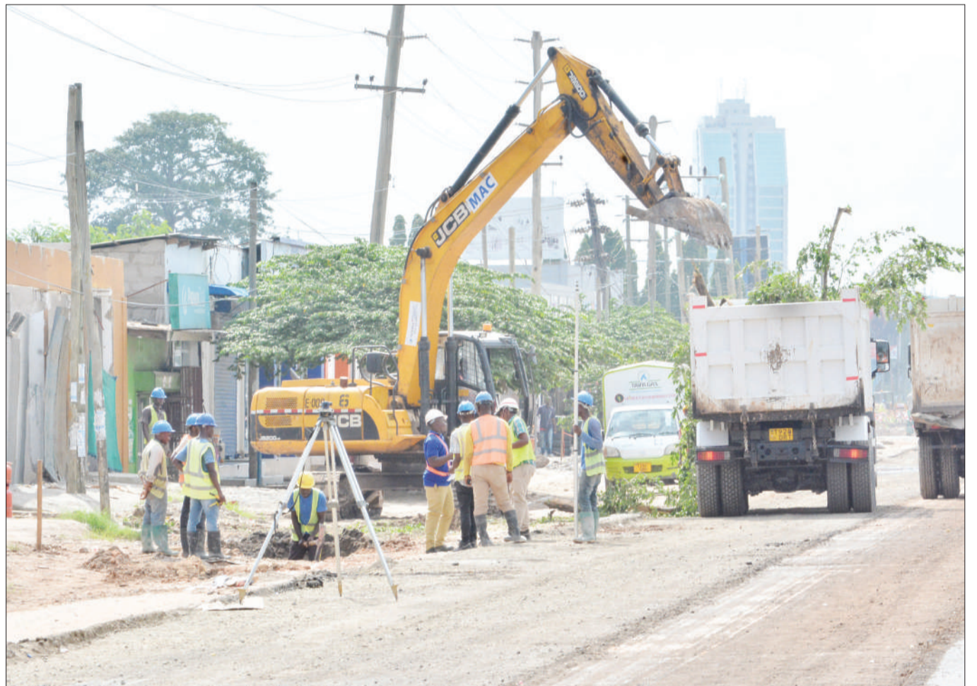
Mafundi wakiendelea na upanuzi wa Barabara ya Morocco-Mwenge, jijini Dar es Salaam jana.

Nzige hao walianza kusambaa wakitokea nchini Ethiopia na kwenda Somalia na baadaye waliingia Kenya na kuathiri majimbo matano, licha ya hatua mbalimbali kuchukuliwa.