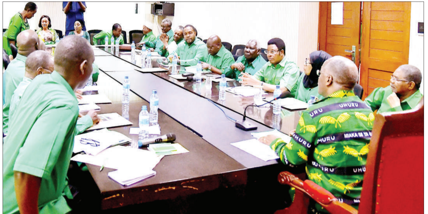
Mwenyekiti wa Chama cha Mapinduzi (CCM), Rais John Pombe Magufuli, akiongoza Kikao cha Kamati Kuu ya CCM, katika Ofisi Ndogo za chama hicho, Mtaa wa Lumumba, jijini Dar es Salaam jana.