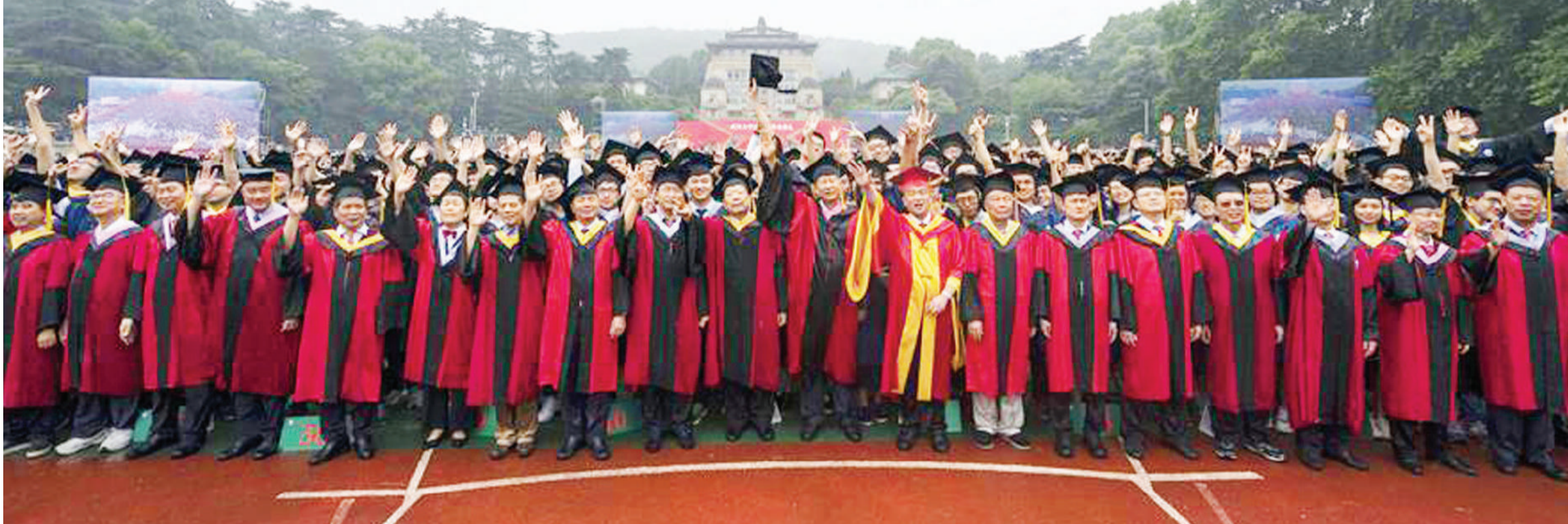
Wanafunzi wa Chuo Kikuu cha Wuhan, China, katika moja ya mahafali yao.

• Muhimu tahadhari, hakuna sababu ya kuhofu