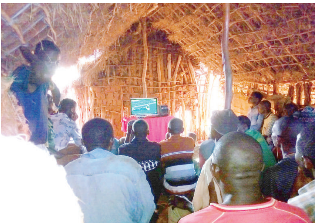
Wananchi wa Kijiji cha Mazingara Nkumba wilayani Handeni, Tanga, wakiangalia mechi kati ya Simba na JKT Tanzania iliyoisha kwa Simba kufungwa bao 1 -0 wiki iliyopita, katika banda la makuti.

Matokeo hayo yanaifanya Azam kuzidi kujiimarisha katika nafasi ya pili ya msimamo wa ligi hiyo, ikiwa na alama 44 baada ya mechi 21 huku Polisi Tanzania ambao Ijumaa watakuwa wageni wa KMC FC wakibaki na pointi zao 30.