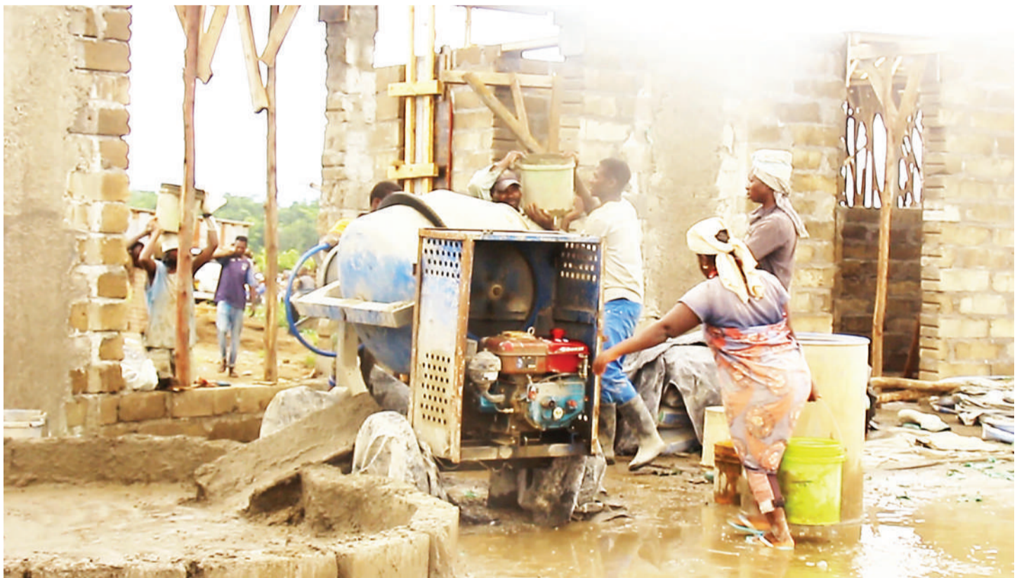
Mafundi ujenzi wakiendelea na ujenzi wa vyumba vya madarasa katika Shule ya Sekondari ya Wasichana ya Mkoa wa Mbeya inayojengwa wilayani Kyela, juzi.

Vilevile aliomba wananchi waliovunjiwa nyumba zao walipwe fidia ili waendeleo na majukumu yao na ujenzi wa makazi mapya.