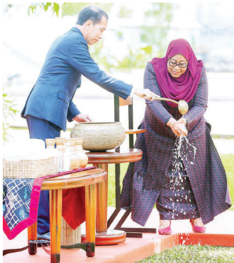
Rais Samia Suluhu Hassan akinawishwa mikono na Rais wa Jamhuri ya Indonesia, Joko Widodo baada ya kupanda mti wa kumbukumbu katika viwanja vya Makazi ya Rais huyo Bogor jana.