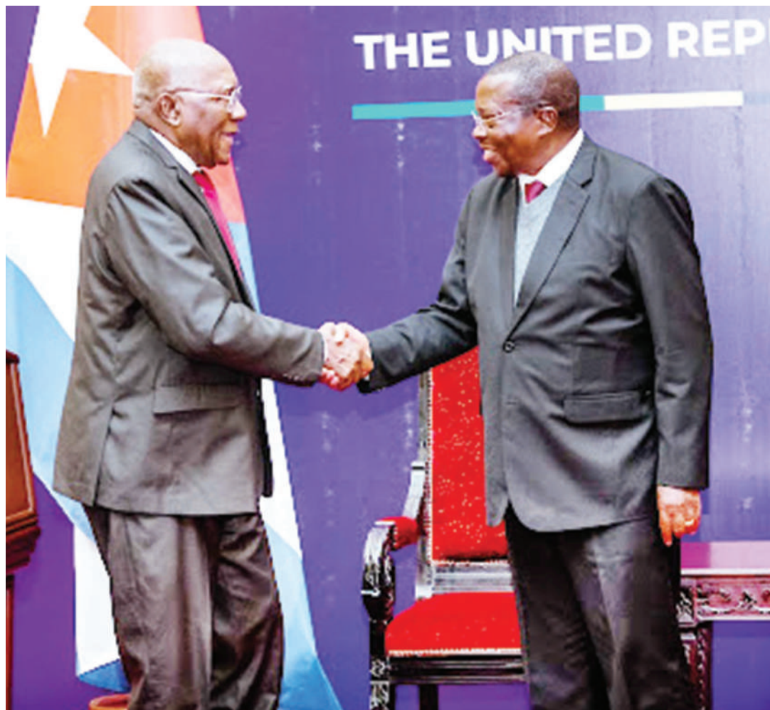
Makamu wa Rais wa Tanzania, Dk. Philip Mpango akisalimiana na Makamu wa Rais wa Cuba, Salvador Mesa, baada ya kuwasili Ikulu Jijini Dar es Salaam juzi.

Ni tafiri kutoka kwa Rais wa Zanzibar Dk. Hussein Ali Mwinyi, pale alipomwakilisha Rais Dk. Samia Suluhu Hassan, kufungua Mkutano wa Kimataifa wa Tathmini ya Muda wa Kati wa Mzunguko wa 20 wa Benki ya Dunia (IDA20 Mid-Term Review) unao-husisha wakopaji, nchi Wahisani na Menejimenti ya Benki ya Du-