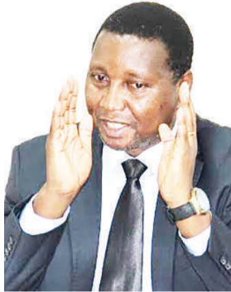
Prof. Adolf Mkenda, Waziri wa Elimu, Sayansi na Teknolojia

"Wasichana waliofaulu ni 257,892 sawa na asilimia 86.17 wakati wavulana waliofaulu ni 226,931 sawa na asilimia 89.40. Mwaka 2022 watahiniwa waliofaulu walikuwa 476,450 (asilimia 86.78), hivyo ufaulu wa