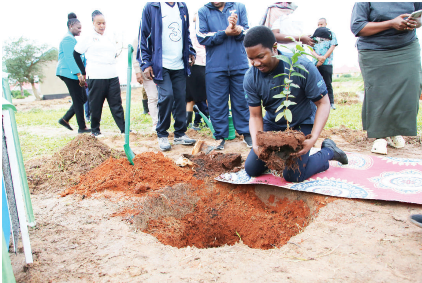
Waziri wa Nchi, Ofisi ya Makamu wa Rais (Muungano na Mazingira), Dk. Selemani Jafo akipanda mti kwenye eneo la shule ya msingi ya serikali ya mchepuo wa Kiingereza Dodoma, jijini Dodoma jana, kuashiria uzinduzi rasmi wa zoezi la upandaji miti kitaifa kuelekea maadhimisho ya miaka 60 ya Muungano wa Tanganyika na Zanzibar.