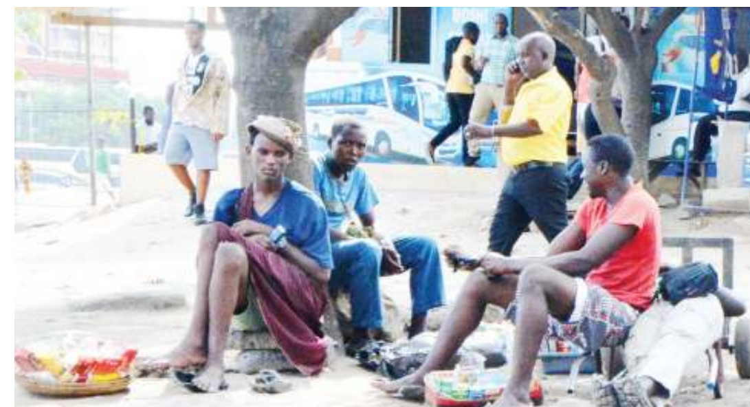
Wachuuzi wa pipi wakiwa wamepumzika baada ya piliikipika za kusaka wateja katika eneo la stendi kuu ya mabasi ya Ubungo, jijini Dar es Salaam jana.