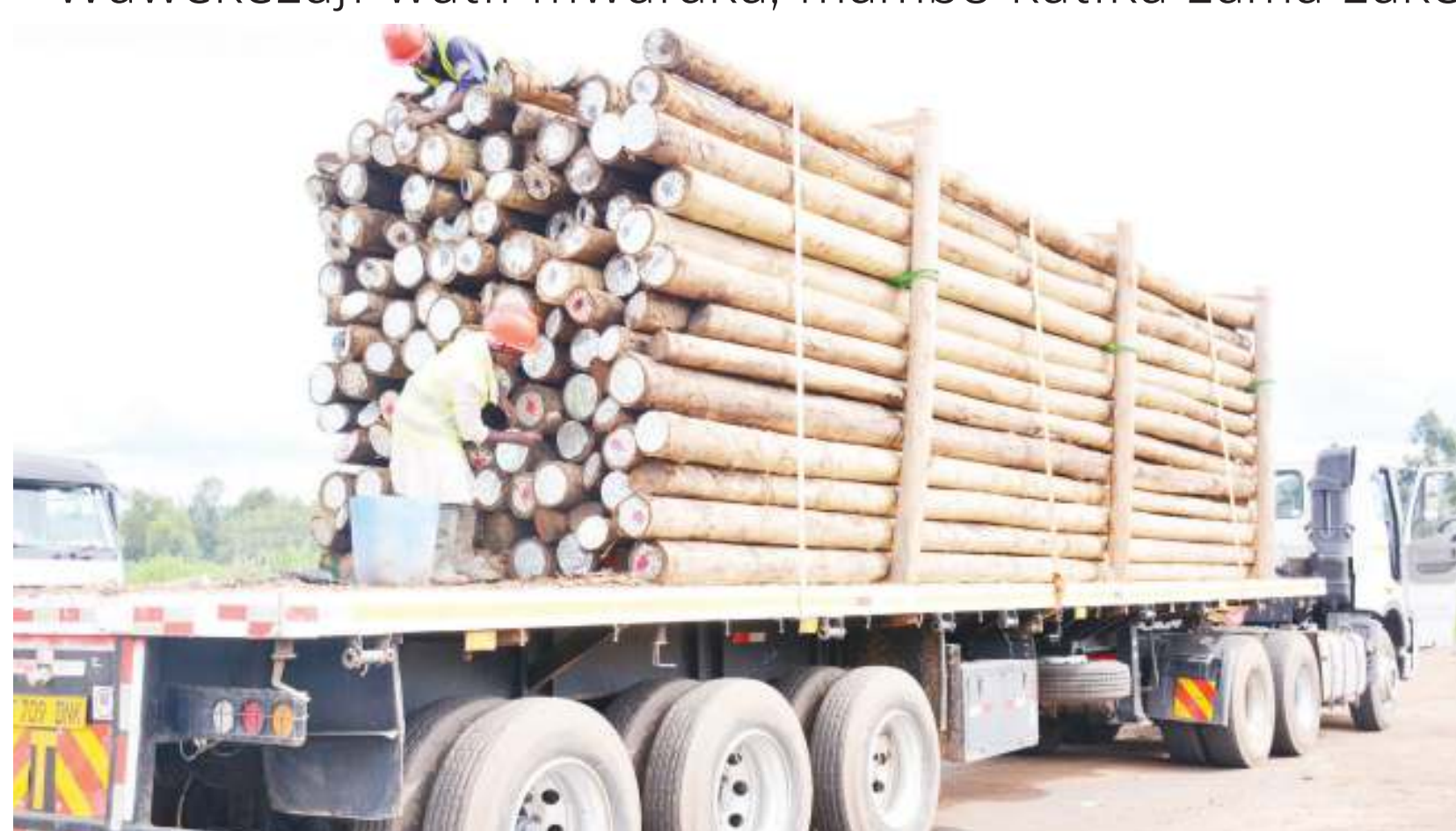
Magari yakipakia nguzo kwa ajili ya kupelekwa sehemu mbalimbali za nchi, kukidhi mahitaji ya umeme.

Katika kuboresha mazingira nchini, serikali kwa kushirikiana na wadau wa maendeleo, wakwamo wawekezaji wa ndani na