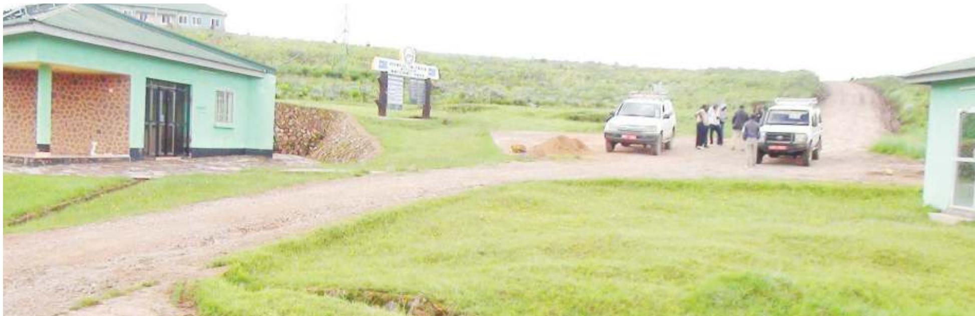
Sehemu ya ofisi za Hifadhi ya Taifa Kitulo.

• Waongozaji: Neema, kazi zatuelemea • DC, Diwani wawapigia debe wakazi wao • Bidhaa yaipa jina 'Bustani ya Mungu'