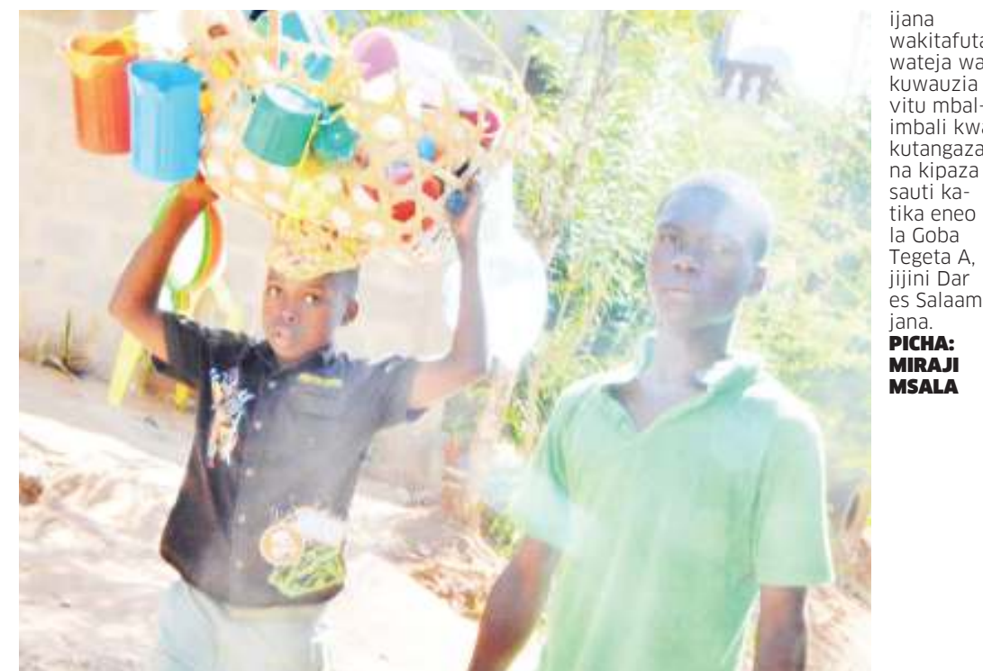
ijana wakitaifuta wateja wa kuwauzia vitu mbalimbali kwa kutangaza na kipaza sauti katika eneo la Goba Tegeta A, jijini Dar es Salaam jana.