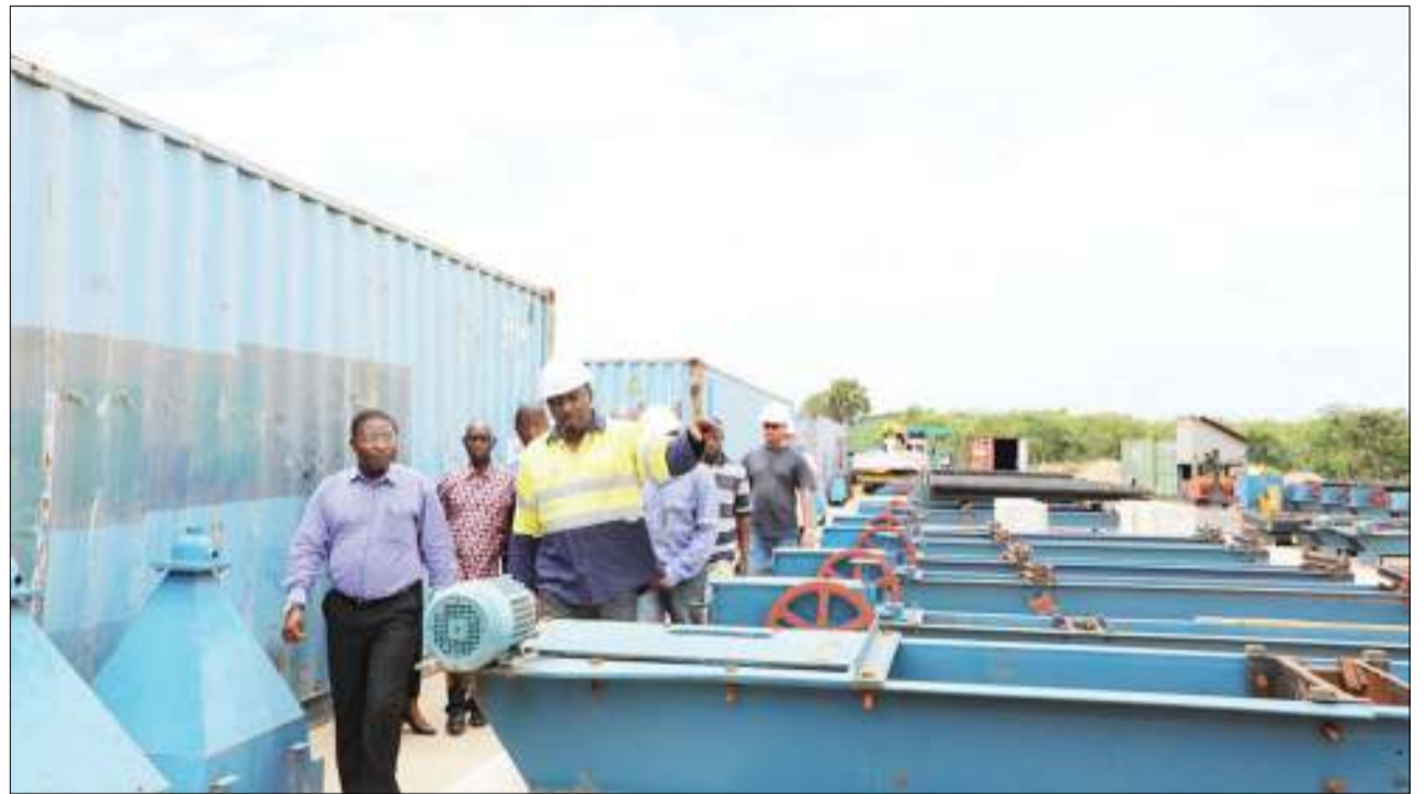
Waziri wa Nishati, Dk. Medard Kalemari (kushoto), akikagua mitambo ya kisasa ya kuchenjulia madini tani 10 kwa saa ambayo iko katika Kijiji cha Shenda, wilayani Mbogwe Mkoa wa Geita jana, na kuahidi kupeleka umeme hivi karibuni.