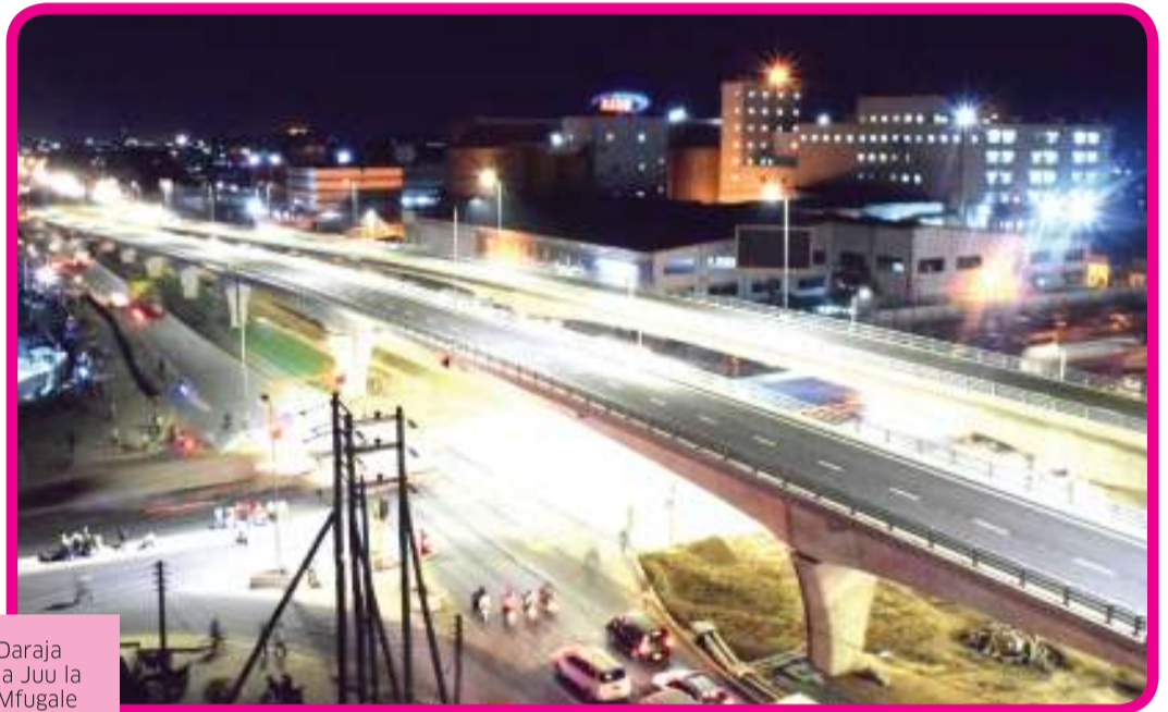
Daraja la Juu la Mfugale kama linavyoonekana wakati wa usiku

Mkandarasi wa mradi huu yaani Sumitomo-Mitsui Construction Company (SMCC) ni mkandarasi mashuhuri kutoka Japani alifanikiwa katika mambo matatu kwa kushirikiana na wafanyakazi wa Kitanzania waliokuwa katika eneo la kazi. Eneo la kwanza la mafanikio ni kumaliza kazi bila ajali yeyote. Tangu mwanzo hadi mwisho wa ujenzi wa Daraja hilo jumla ya saa za kazi milioni 250 zilitimika bila ajali yeyote ile. Hii ni rekodi ya kupigiwa mfano kwani si tu kwa ukanda huu wa Afrika kutokea kwa jambo hilo bali hata nchini Japani si rahisi kufikia rekodi hiyo. Usalama katika eneo la kazi huchangia katika usalama wa wafanyakazi husika na pia katika