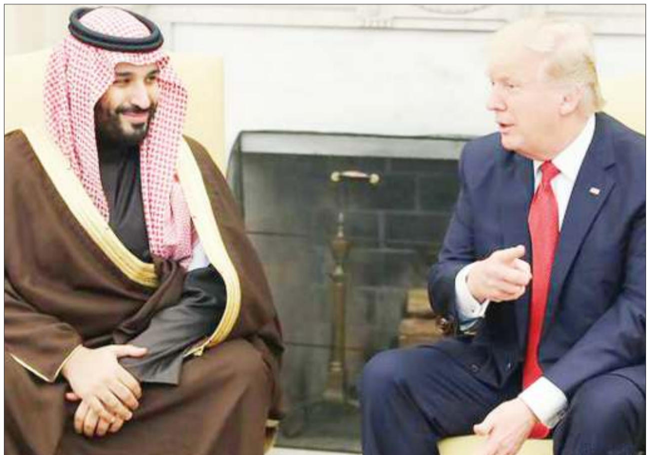
Rais wa Marekani, Donald Trump (kulia), akiwa na mtoto wa Mfalme wa Saudi Arabia, Salman bin Abdelaziz, wakati wa ziara yake katika taifa hilo la kifalme.

Vyama viwili vikuu vya siasa vinaishtumu INEC kushindwa kuandaa uchaguzi huru, wa kuaminika na wa wazi.