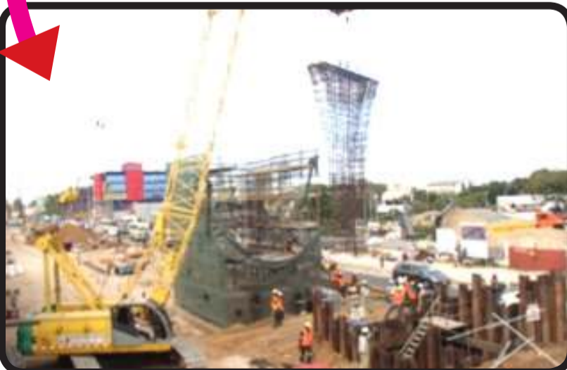
Wakati wa ujenzi wa Daraja la Juu la Mfugale: Watanania na Mkandarasi wa Kijapani wanafanya kazi kwa pamoja

Ni Shirika la Umma la Serikali ya Japani linalosimamia misaada yote inayofadhiliwa na Serikali ya Japan (Official Development Assistance). JICA ni miongoni mwa mashirika makubwa sana duniani linalosaidia katika maendeleo ya kiuchumi na kijamii katika nchi mbalimbali zinazoendelea. Nchini Tanzania, JICA imekua mshiriki mwaminifu kwa Tanzania katika nyanja mbalimbali kwa zaidi ya miaka 50 kuanzia mwaka 1962. Katika uendelezaji wa miundombinu mijini ushirika wa JICA ulianza mwaka 1980 kwa kufadhili ujenzi wa Daraja la Selandar jijini Dar es salaam.