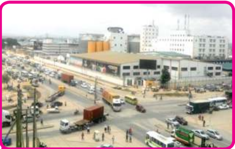
Muonekano wa Makutano ya Tazara kabla ya Ujenzi wa Daraja la Juu la Mfugale

Taa hizi maalum zinatarajiwa kupunguza ajali za barabarani kwa kua zinatoa mwanga mkali katika eneo husika. Aidha taa hizi hung'arisha Tanzania ijayo. JICA hufanya kazi kama mwenza mwaminifu wa maendeleo ya Tanzania. Tunafanya kazi kwa pamoja na Serikali ya Tanzania na pia na Watanania wote bega kwa bega.