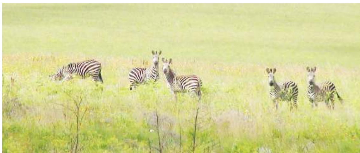
Pundamilia wapya waliofikishwa katika Hifadhi ya Taifa Kitulo, baada ya kutoweka kwa nusu karne.

Katika kikundi chao wanatarajia kuboresha huduma kwa watalii wanaowaongoza, ili nao kuchangia ongezeko la watalii, wao pia wakinu-faika kwa kipato.