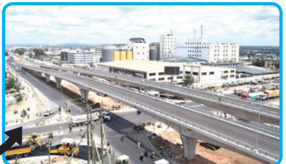
Muonekano wa Daraja la Juu la Mfugale: Barabara 4 sasa zinatumika kwa umma