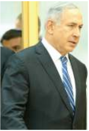
Uchaguzi mpya Israel Netanyahu akishindwa kuunda serikali