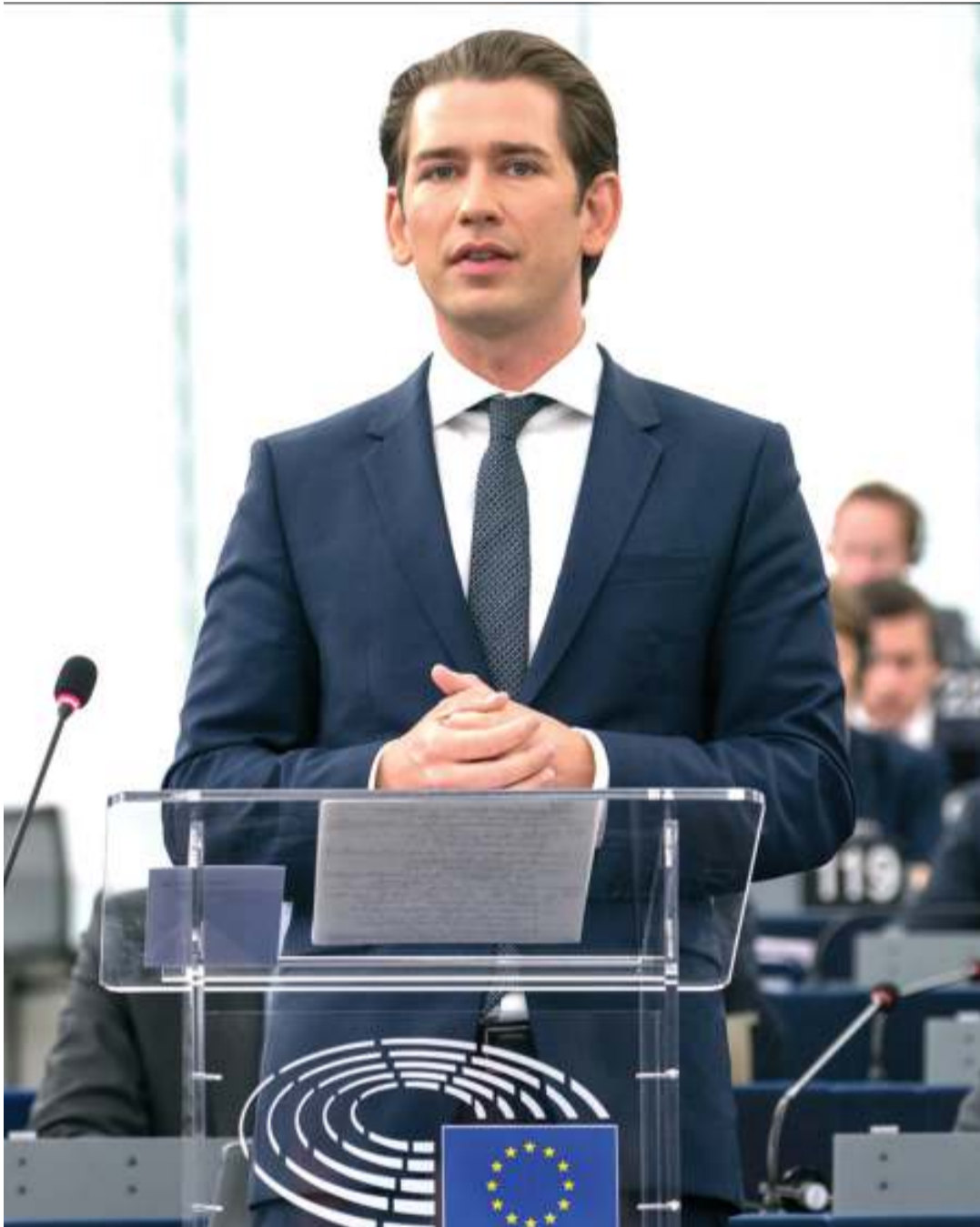
Chansela wa Austria, Sebastian Kurz.