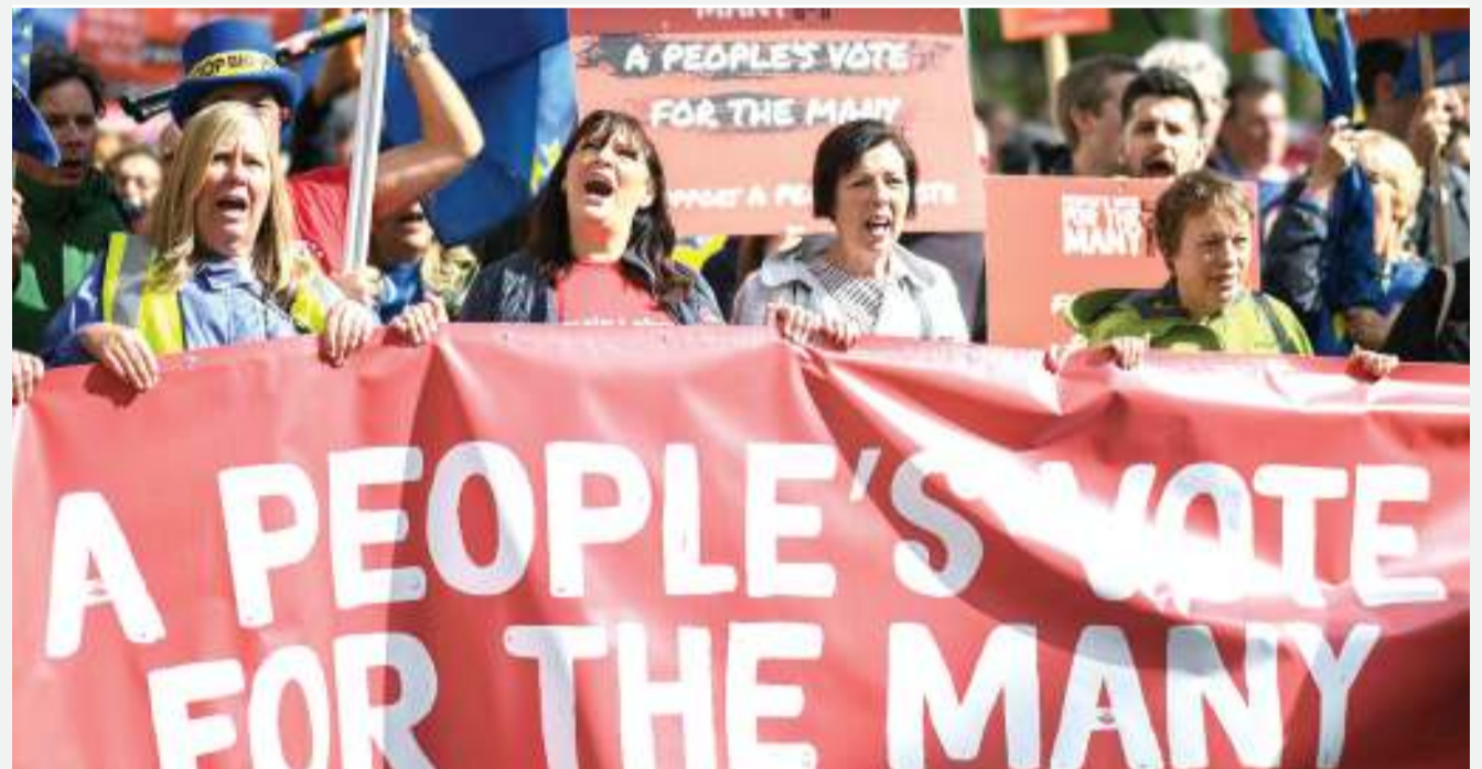
Waandamanaji wakionyesha hisia zao juu ya Uingereza kujitoa Umoja wa Ulaya.

Jeremy Hunt naye anagombea, na baadhi wanadhani kuwa ana nafasi kubwa zaidi. Yuko mwanamama mmoja, aliyekuwa Waziri wa Kazi na Mafao ya Kustaafu, Esther McVey na Waziri wa Maendeleo ya Kimataifa, Rory Stewart.