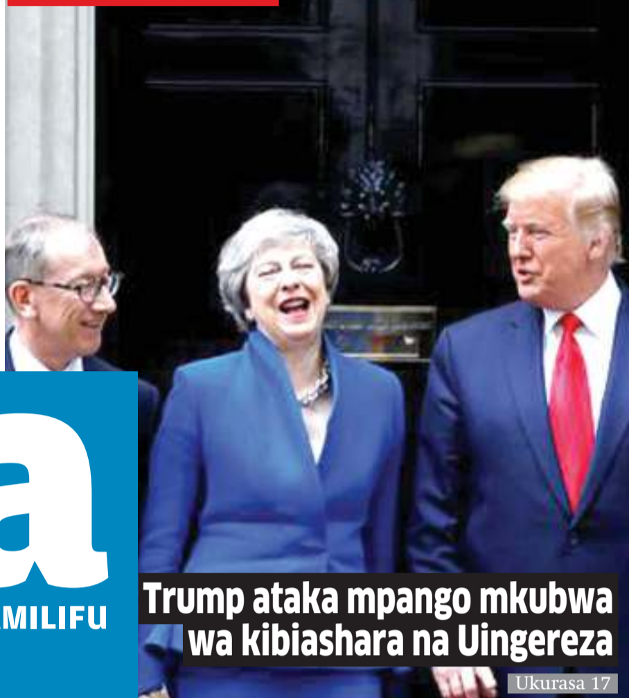
Trump ataka mpango mkubwa wa kibiashara na Uingereza