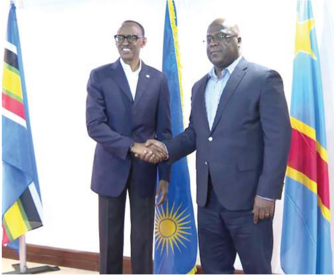
Rais Paul Kagame wa Rwanda (kushoto) akiwa na Rais Felix Tshisekedi wa DRC.

da na kuwashirikisha viongozi wa kisiasa na wafanyabiashara wa kimataifa, lengo likiwa ni kuchagiza kasi ya uwekezaji wa sekta binafsi na ushirikiano wa kikanda.