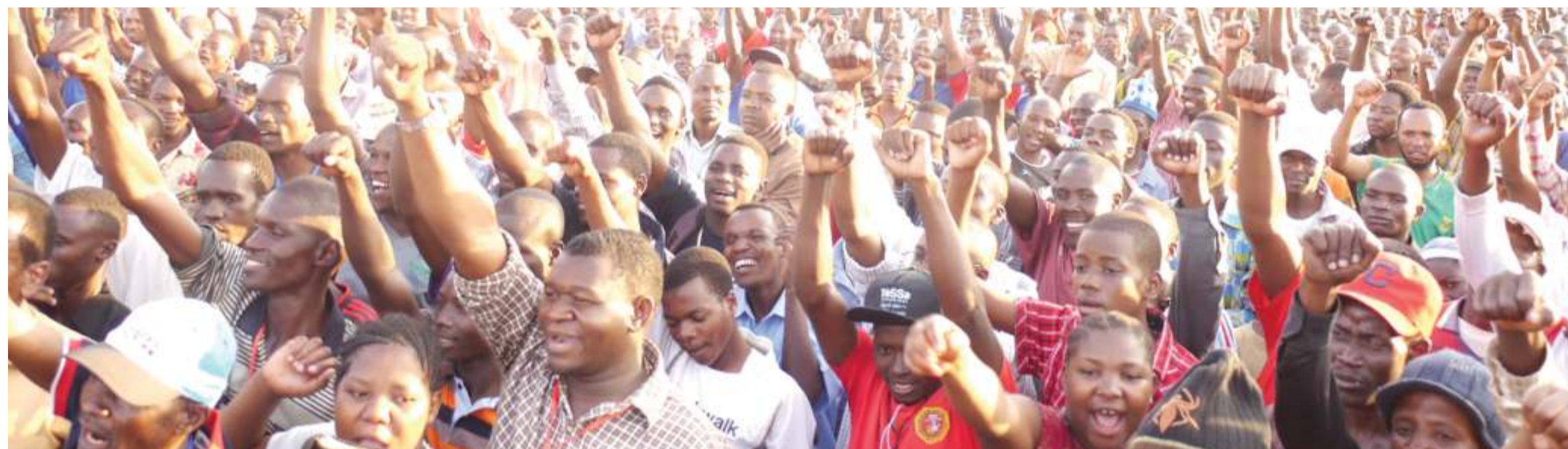
Baadhi ya wafuasi wa vyama vya siasa wakiwa kwenye mkutano wa hadhara.

Hivyo basi, mtu anayelalimika kuvunjiwa haki zake, anapojaribu kuiomba mam-laka husika kumtekeleza matakwa yake, mamlaka hiyo nayo itarejea katika kumuuliza wajibu wake kama ameutimiza. Sasa tuiridie hali yetu ya kisiasa na kijamii hapa nchini. Siku hizi kulisikia neno 'haki' ni jambo la kawaida sana. Kila unapopita unasikia watu wakidai haki, si wanasiasa, si watoto, si wafanyakazi, si madereva, si wafanyabiashara, yaani kila mtu ni haki haki haki. Kwa upande mwingine ni