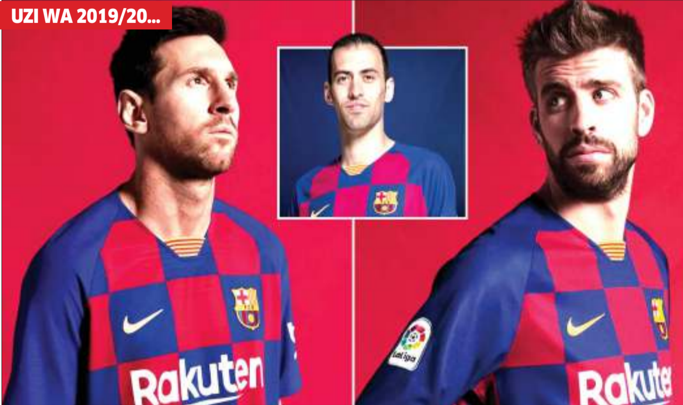
Wachezaji wa Barcelona, mshambuliaji Lionel Messi wa beki wa kati, Gerard Pique (kulia), wakiwa ndani ya uzi mpya utakaotumiwa na klabu hiyo kwenye mechi za nyumbani kwa msimu mpya wa 2019/2020.