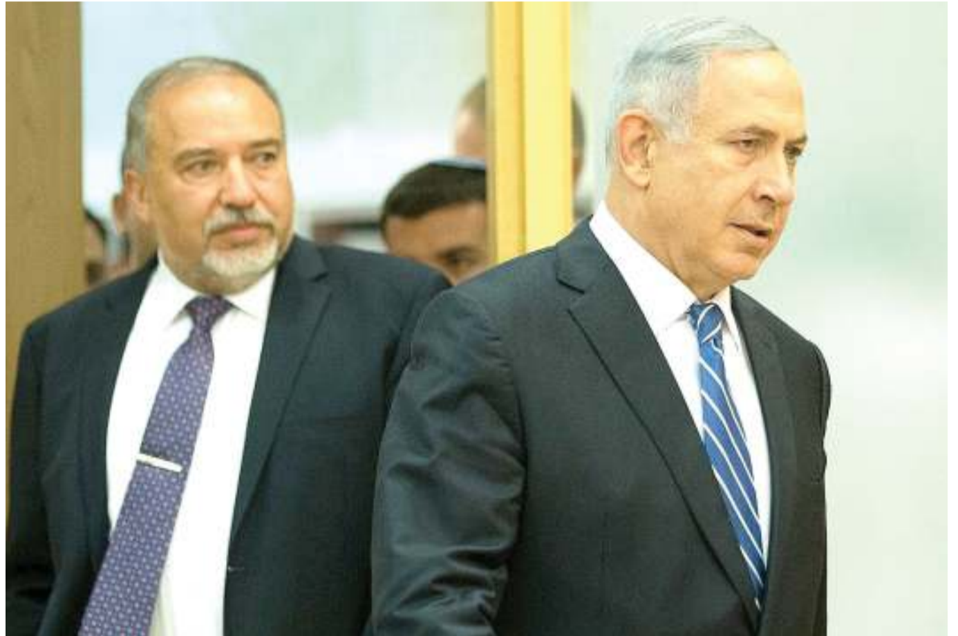
Waziri Mkuu Benjamin Netanyahu (kulia), akiwa na aliyekuwa mpinzani wake kwenye uchaguzi uliopita Jenerali Avigdor Lieberman.

ine ufanyike ndani ya mwaka mmoja lakini mwelekeo uliochukuliwa bungeni na kundi la Netanyahu (vyama vya mrembo wa kulia) havikumpa nafasi kufanya maamuzi.