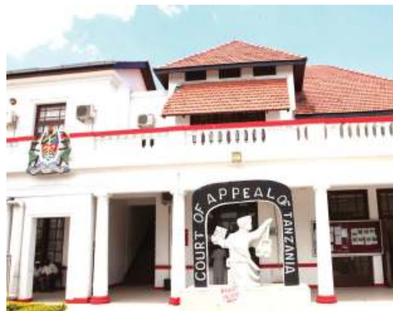
Jengo la Mahakama ya Rufani nchini, katika jiji la Dar es Salaam.