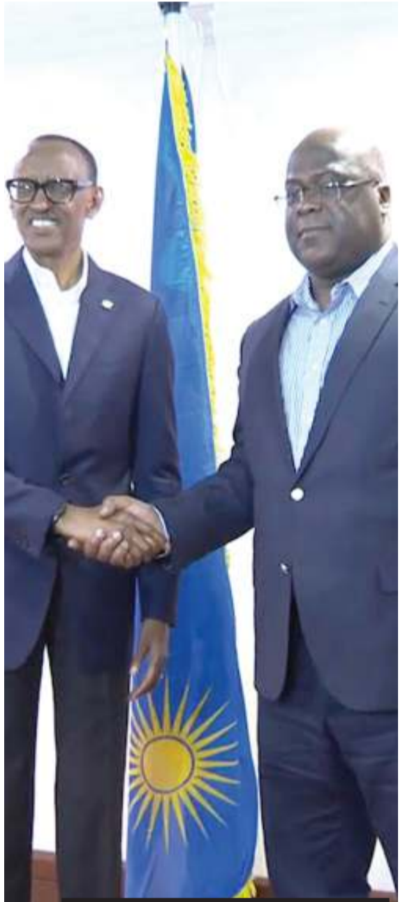
EAC na changamoto za Rwanda 'kujiekeleza' DRC