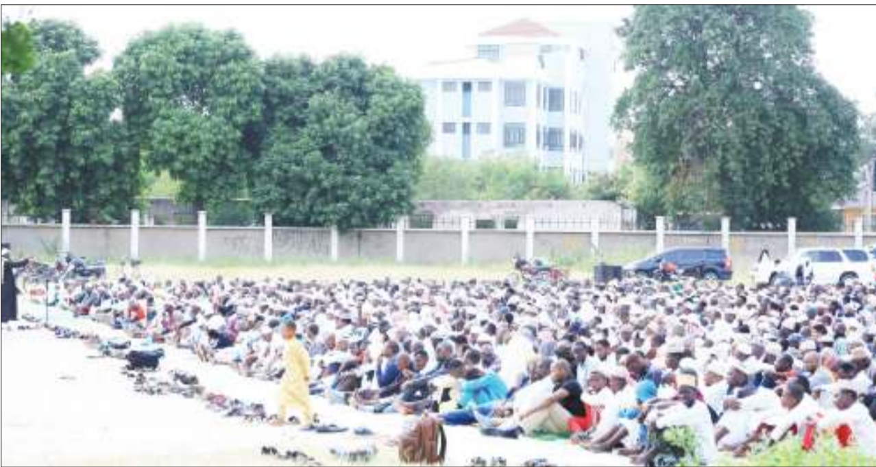
Baadhi ya waumini wa dini ya kiislamu wa madhehebu ya Answari Sunni, Mkoa wa Dodoma, wakiwa kwenye Swala ya Eid El Fitri, iliyoswaliwa viwanja vya Shule ya Central Sekondari, jijini Dodoma jana.