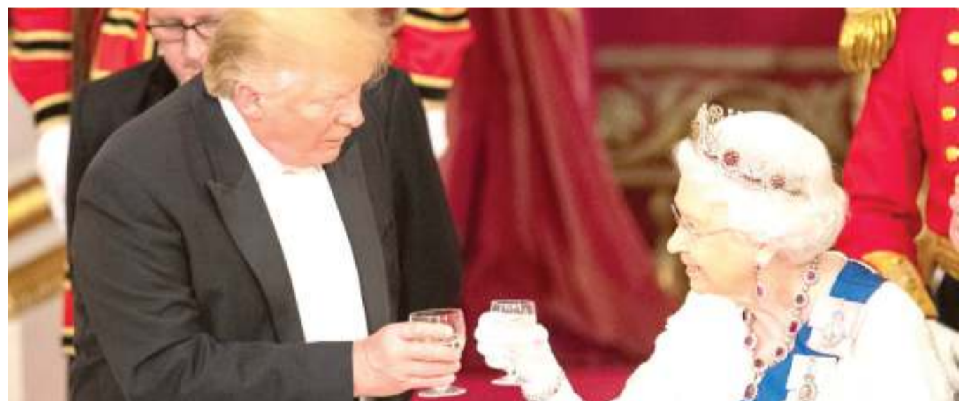
Rais wa Marekani, Donald Trump (Kushoto) akiwa na Malkia wa Uingereza, Elizabeth II, alipokaribishwa jana.