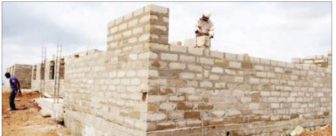
Kazi ya ujenzi wa majengo ya hospitali yenye hadhi ya wilaya ikiendelea katika kijiji cha Suguti, Musoma Vijijini mkoani Mara jana. Serikali imetoa Sh. bilioni 1.5 kwa ajili ya ujenzi wa hospitali hiyo, huku wananchi nao wakijitolea kwa hali na mali ili kuufanikisha.

Aliliomba Jeshi la Polisi kuwasaidia ulinzi wa familia ili wasije wakadhuriwa na watu hao wanaotoa vitisho.