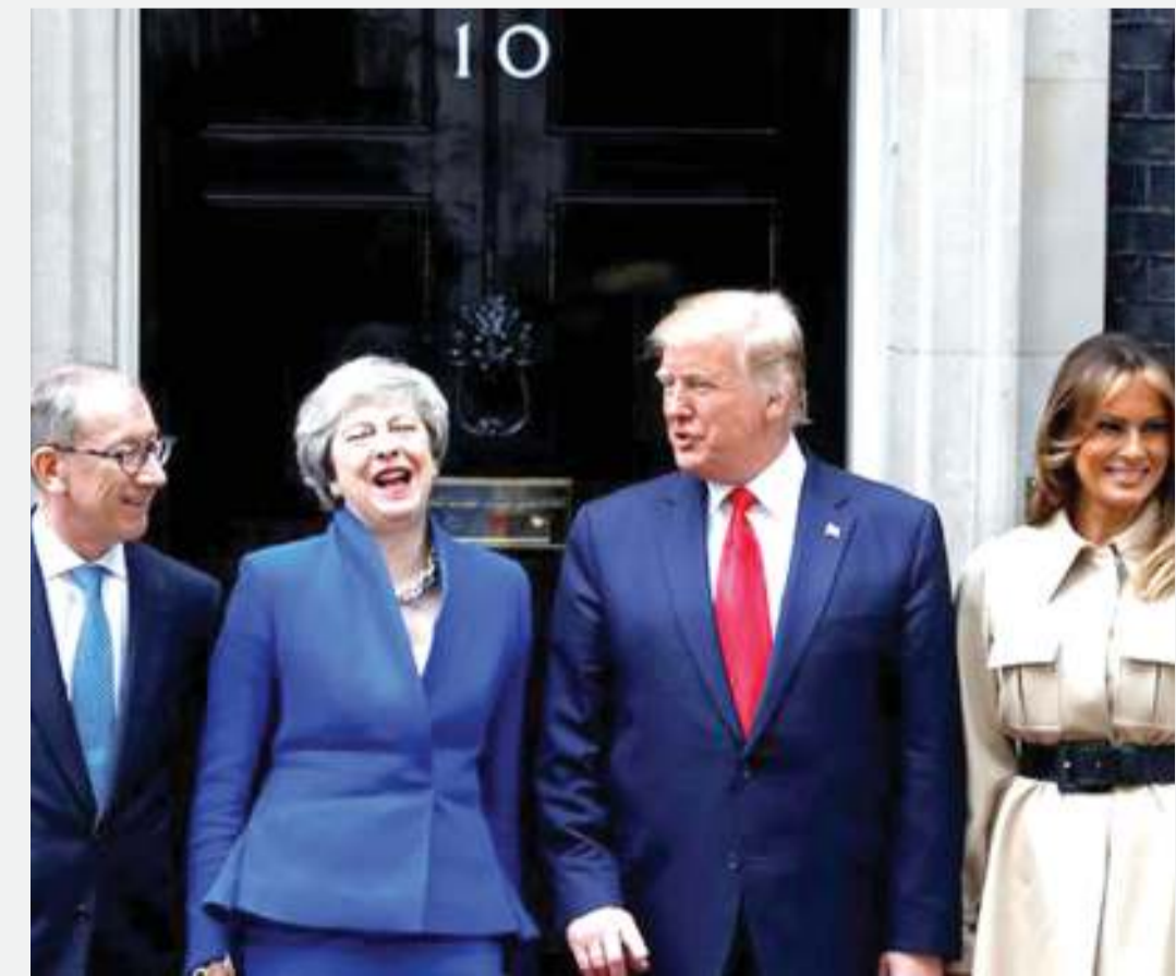
Waziri Mkuu wa Uingereza, Theresa May (wa pili kushoto), akiwa na Rais Donald Trump wa Marekani (wa pili kulia). Trump yuko ziarani kwa sasa nchini Uingereza.

May na Trump watakamiliha ziara hiyo watakapoungana na viongozi wengine duniani leo katika bandari ya Uingereza ya Portsmouth kwenye kumbukumbu ya miaka 75 tangu wanajeshi wa Uingereza, Marekani na washirikia wengine walipoanza operesheni ya kuikombua Ulaya mnamo Juni 6, 1944 kutoka mikononi mwa Manazi. DW