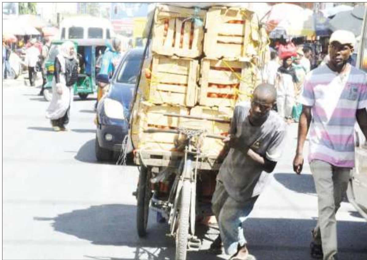
Mkazi wa Jiji la Dar es Salaam akilikokota guta lililosheni mzungu mkubwa katika Barabara ya Uhuru, jana, hivyo kushindwa kuona nyuma kitendo ambacho ni hatari kwa usalama barabarani.