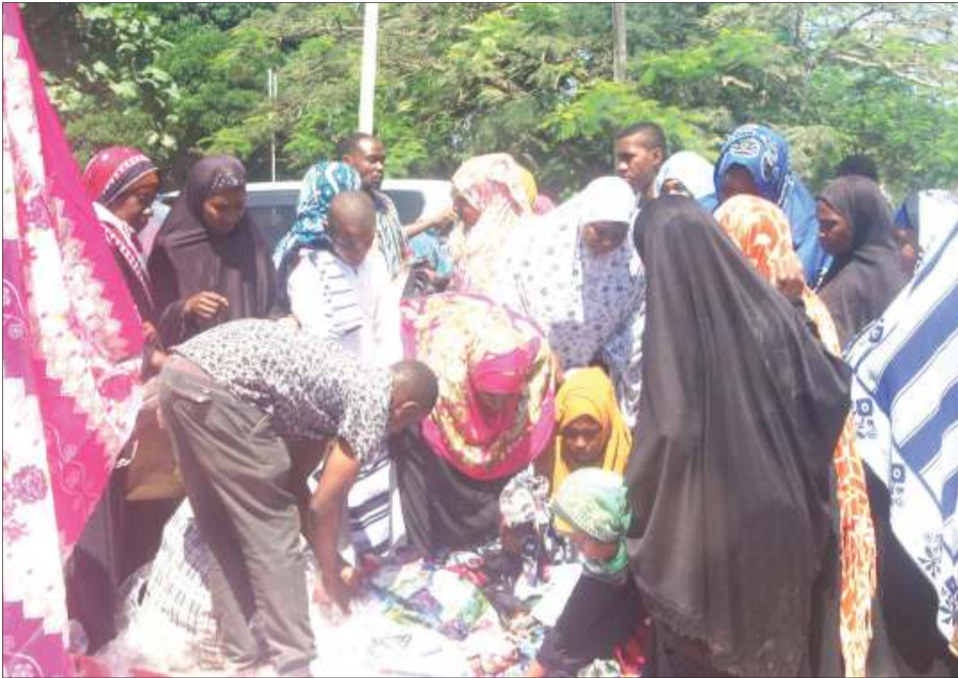
Wananchi wakitafuta mahitaji kwa ajili ya sikukuu ya Eid el Fitr, katika eneo la Darajani, mjini Unguja jana.