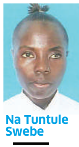
Na Tuntule Swebe