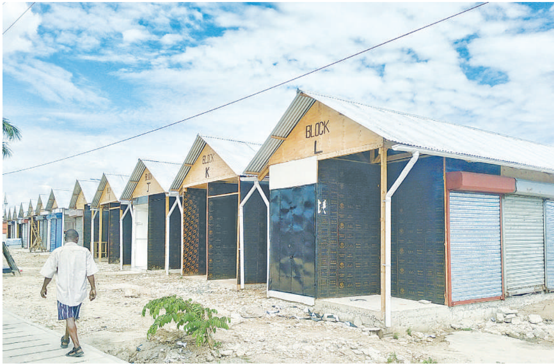
Vibanda vya kisasa kwa ajili ya wafanyabiashara wa mitumba, vinavyojengwa na Manispaa ya Ubungo katika soko la Mawasiliano (Simu 2000), Sinza, Dar es Salaam, vikionekana kwenye hatua za kukamilika jana.