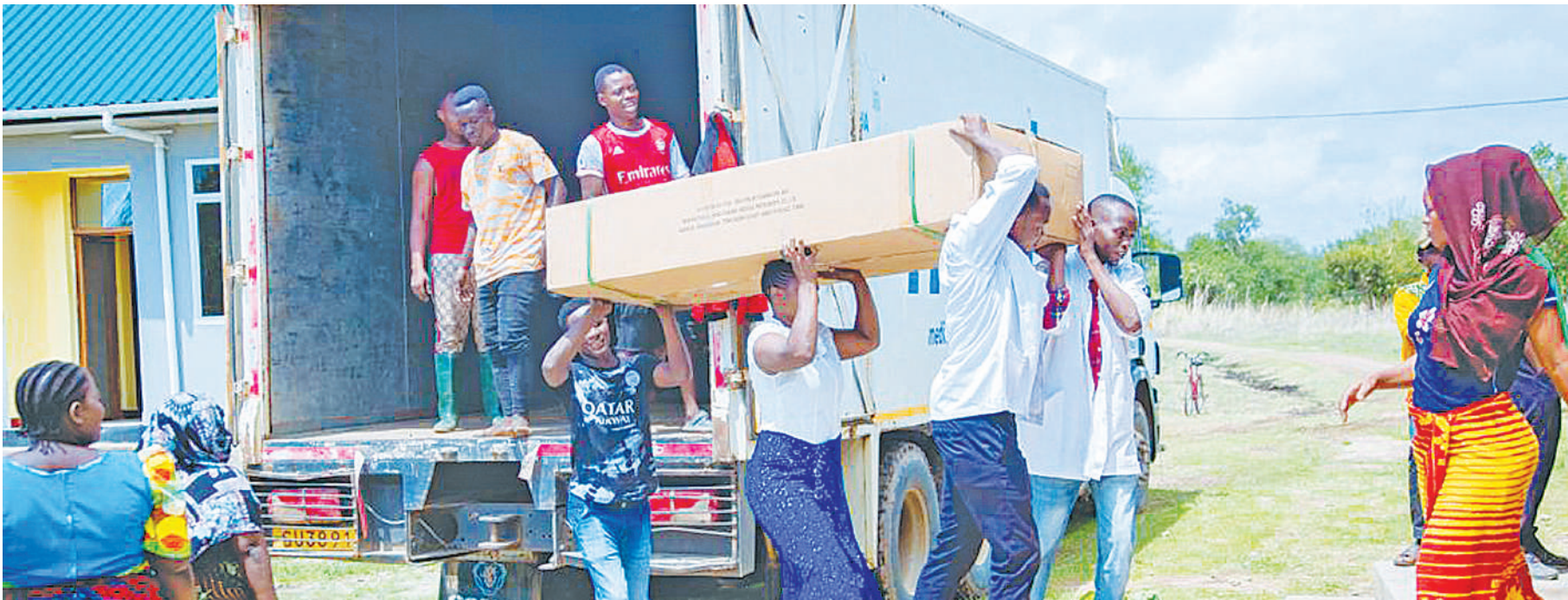
Wananchi wakipokea vifaa tiba kutoka MSD kwa ajili ya Halmashauri ya Ifakara.