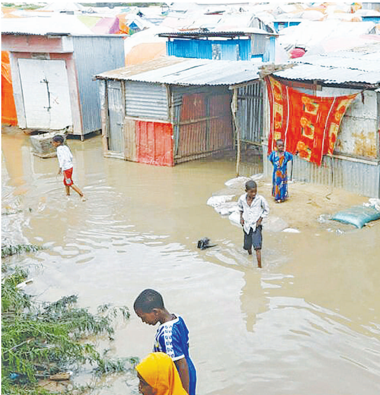
Mafuriko yanavyoendelea kuwaathiri wakazi Somalia, ikibainishwa kuwa zaidi ya watu 113,000 wamepoteza makazi yao kutokana na mvua kubwa inayoendelea kunyesha nchini humo.

Taarifa zilisema mapigano makali yalielea siku chache zilizopita, huku M23 wakichukua tena baadhi ya maeneo kilomita chache kutoka mji wa Goma, mji mkuu wa jimbo la Kivu Kaskazini, mashariki mwa DRC. BBC