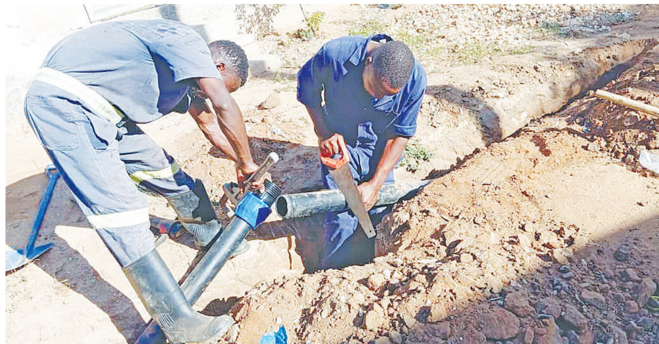
Mafundi wa Mamlaka ya Majisafi na Usafi wa Mazingira Mkoa wa Dar es Salaam (DAWASA), wakiunganisha mtandao wa majisafi kwenye bomba la inchi 3 kutoka kwenye bomba la inchi 4 kwa umbali wa mita 800 katika eneo la njia panda, Tegeta A, kwa lengo la kusogeza huduma kwa wakazi wa maeneo hayo, mkoani humo jana.

Lema alisema: "Siwezi kutamka neno kama hilo. Nimesema muoeni, yaani fungeni naye ndoa. Ni neno tu la kisiasa nilikuwa namaanisha mdhibitini."