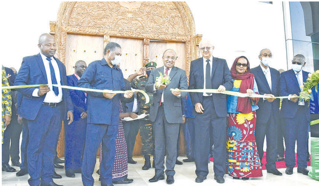
Rais wa Zanzibar, Dk. Hussein Ali Mwinyi, akikata utepe kufungua Mahakama Kuu iliyoko Tun-guu, Unguja.

"Hata hivyo watu ambao walisema hawakuridhishwa na hu-