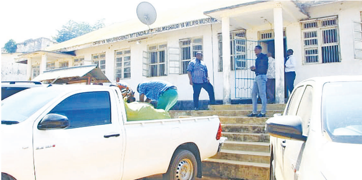
Mkuu wa Mkoa wa Mara (wa pili kushoto), akisimamia uhamaji wa watumishi wa halmashauri hiyo kutoka Kijiji cha Mugango.

• Awaambia kazi bado, sasa kutinga wilayani Bunda