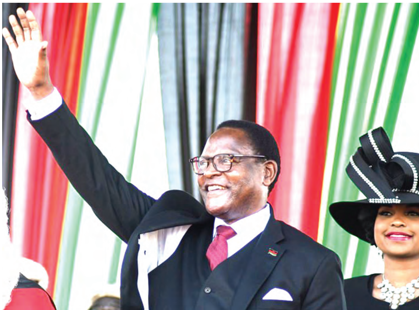
Rais Lazarus Chakwera akiwasalimia wafuasi wake baada ya kuapishwa mjini Lilongwe, Malawi, jana.