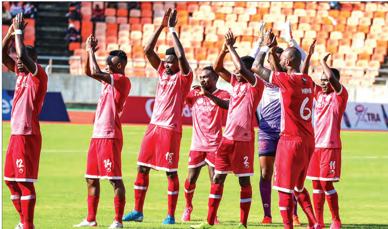
Wachezaji wa Simba wakiwapungia mikono mashabiki.