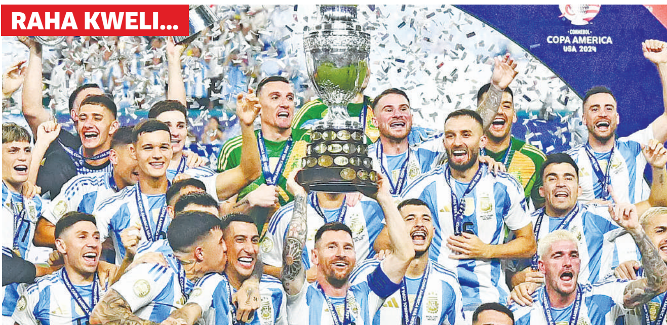
Nahodha na mshambuliaji wa Argentina, Lionel Messi, akinyanyua kombe juu huku akisherehekea na wachezaji wenzake baada ya kutwaa ubingwa wa Copa America kwa kuifunga Colombia bao 1-0 kwenye mechi ya fainali iliyo-pigwa jana katika Uwanja wa Hard Rock, Miami nchini Marekani. HABARI UK. 22.