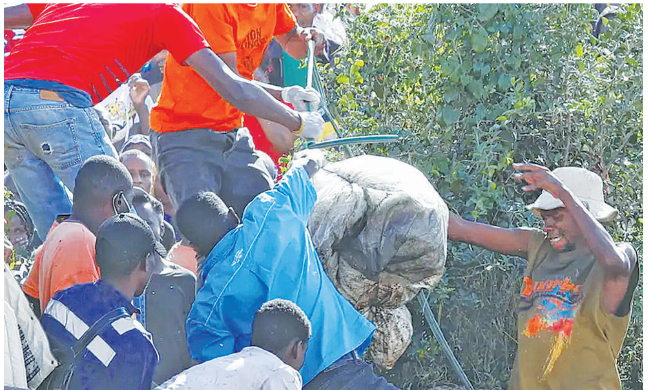
Wananchi wa Mukuru, Kitongoji cha Nairobi, wakiopoa miili ya watu waliokatwakatwa na kufungwa kwenye nailoni na kutupwa juzi.

Jaribio hilo la mauaji limezidisha machungu yaliyopo baina ya pande zinazohasimiana kisiasa Marekani. Huku Trump na Rais Biden wote wakitoa wito wa utulivu. DW