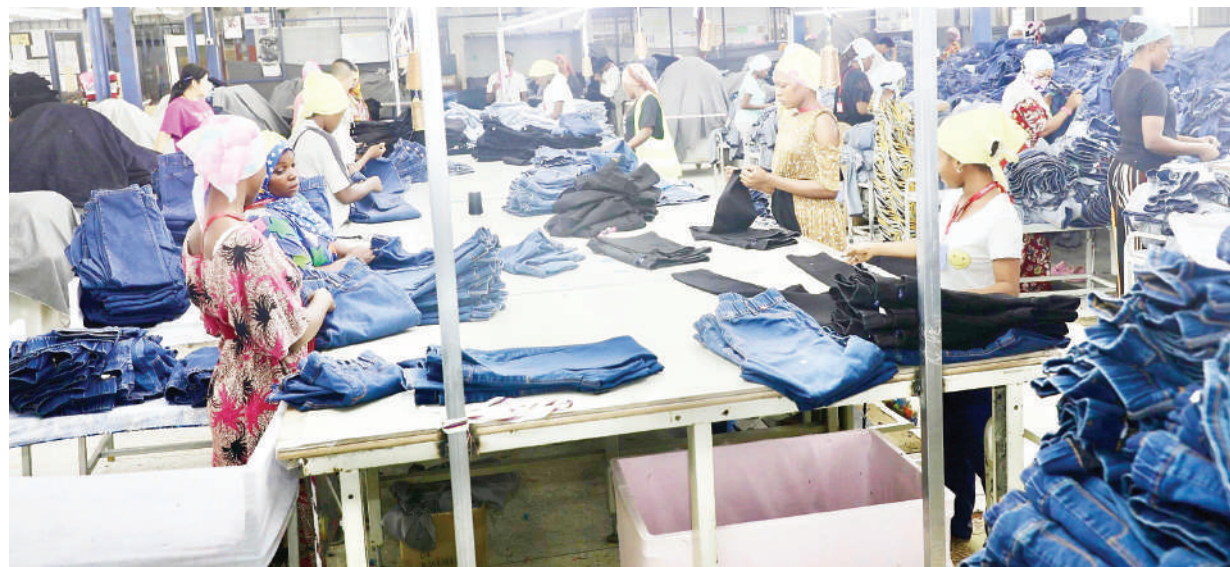
Wasichana wakiwa kazini katika kiwanda cha kutengeneza suruali za 'jeans' jijini Dar es Salaam. Kamati ya Kitaifa ya Ushauri ya Utekelezaji wa Programu ya Kizazi Chenye Usawa (GEF), ambayo ilitembelea kiwanda hicho mwishoni mwa wiki ilikipongeza kwa kuzingatia usawa wa kijinsia kwenye ajira.

Ili kuepuka udanganyifu na kuhakikisha TASAF inapata watu sahihi, alisema walengwa wanachaguliwa na wananchi katika maeneo yao katika ngazi ya kijiji.