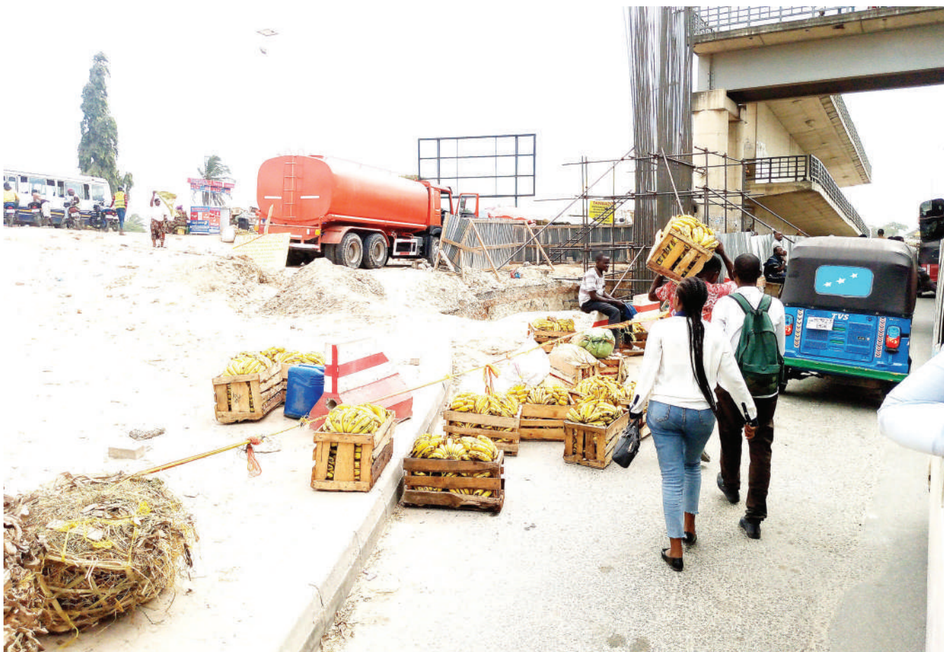
Wafanyabiashara wa ndizi eneo la Kimara Mwisho wakitoa bidhaa zao baada ya kutangaziwa kuondoka eneo hilo ili kupisha kazi ya upanuzi wa ujenzi wa barabara ya Morogoro unaoendelea jijini Dar es Salaam juzi.

"Nikiwa kwenye mkutano huu huu nimetumiwa ujumbe na mwananchi analalamika kwamba mifuko hii imejaa kila kona, lakini sisi tupo kwanini tusichukue hatua kwa wanaozalisha. Kama ilizuiwa kwanini inarudi tena wakati sheria zipo na tuliipiga marufuku," alisema.