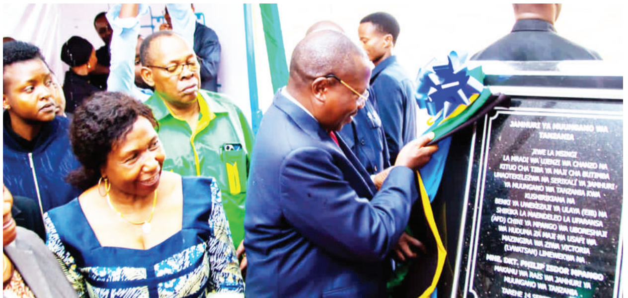
Makamu wa Rais, Dk. Philip Mpango akiweka jiwe la msingi la mradi wa ujenzi wa chanzo na kituo kipya cha kusafisha na kutibu maji Butimba, mkoani Mwanza juzi, utakaogharimu Sh. bilioni 69 unatarajia kuwanufaisha wananchi 450,000.

Alisema usajili na utoaji wa vyeti vya kuzaliwa bila malipo unaendelea katika vituo vyote vinavyotoa huduma ya afya ya mama na mtoto pamoja na vituo vya kata.