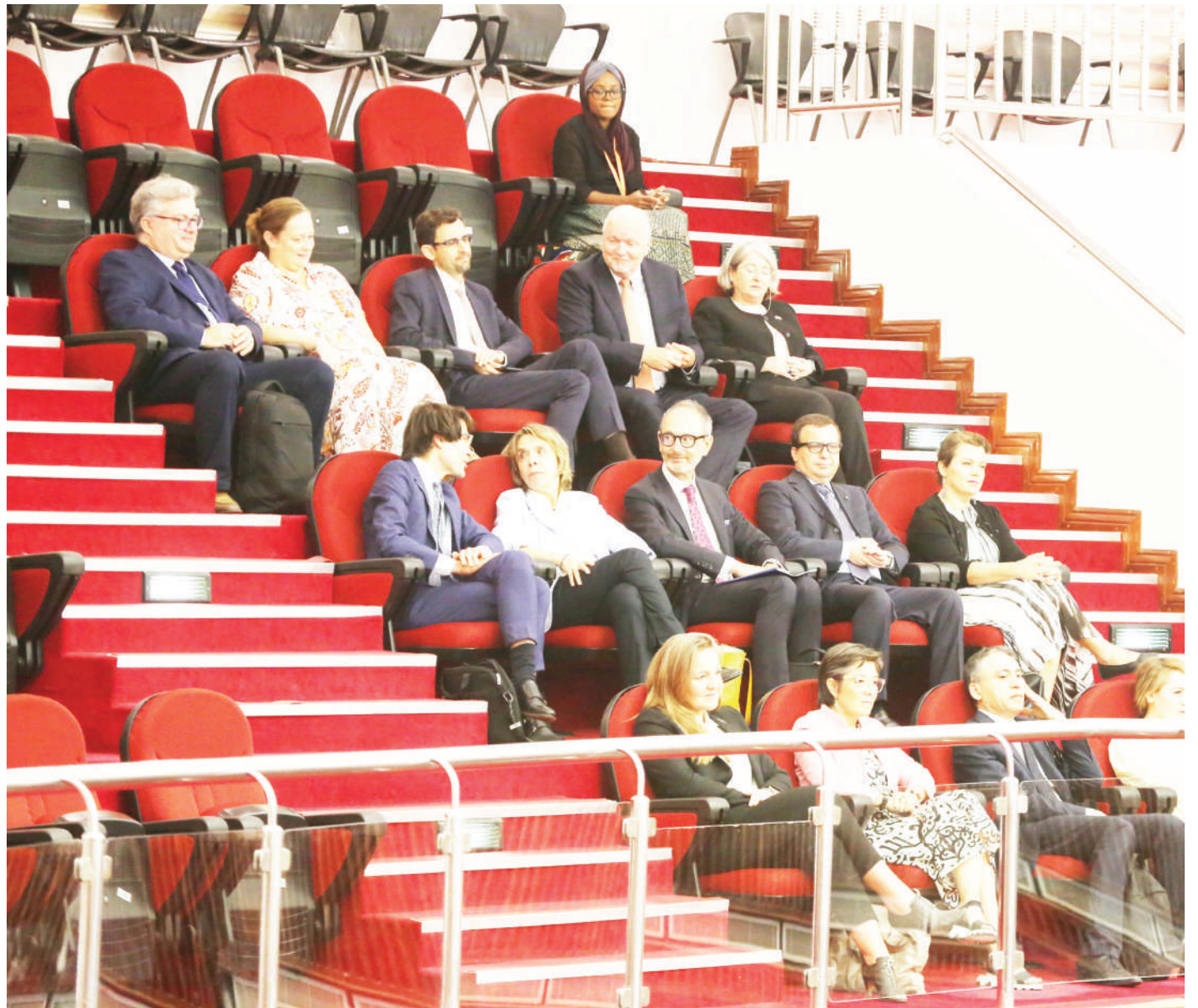
Baadhi ya mabalozi wa Umoja wa Ulaya (UE), wanaoziwakilisha nchi zao hapa nchini, wakiwa kwenye ukumbi wa Spika, wakifuatilia shughuli za Bunge, jijini Dodoma jana.

Alitaja nyaraka hizo ni Sera ya Menejimenti na Ajira katika Utumishi wa Umma ya mwaka 2008 inayotaka kila mamlaka ya ajira kuhakikisha uwiano wa kijinsia kwenye uteuzi na ajira zote, Sheria ya Utumishi wa Umma, 2019, Kanuni za Kudumu katika Utumishi wa Umma za mwaka 2009 na Kanuni za Uendeshaji wa Shughuli za Sekretarieti ya Ajira katika Utumishi wa Umma za mwaka 2021.