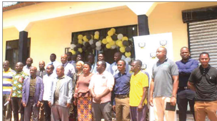
Ofisi mpya za TRA Kata ya Mtemang'ombe, wilayani Mlele, Katavi katika siku ya ufunguzi.

"Kuna wakati tulilazimika pia kwenda mkoani tulale hukohuko, hivyo ilituchukua gharama kubwa sana, lakini kwa sasa tumeokoa muda na tumeokoa fedha zetu, ha-