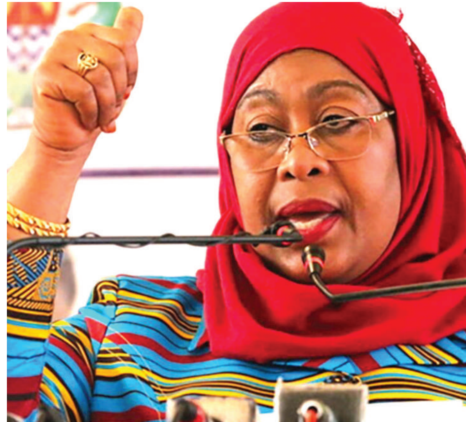
Rais Samia Suluhu Hassan.