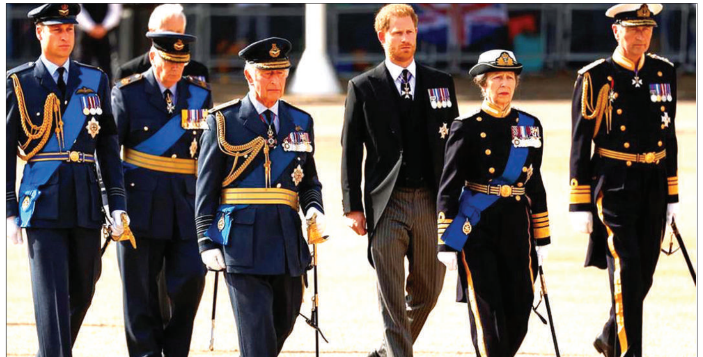
Mfalme Charles wa Uingereza akiambatana na familia yake ya kifalme William, Sir Timothy Laurence, Harry, Peter Phillips, Anne, wakati wakisindikiza jeneza la Malkia Elizabeth kwa ajili ya kuagwa na raia wa nchi hiyo jijini London.