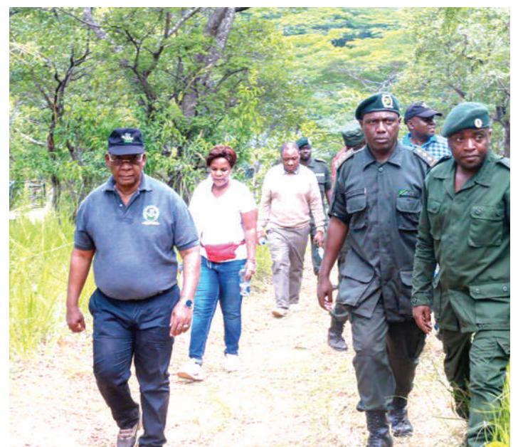
Askari wa wanyamapori wakiwa kazini.