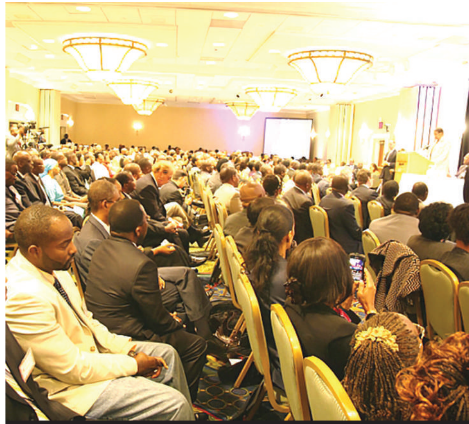
Rais Jakaya Kikwete, alipokutana na Watanania walishio Marekani, katika mkutano jijini Dacota, Marekani mwaka 2011.

• Zama bado ziko jikoni zinafanyiwa kazi