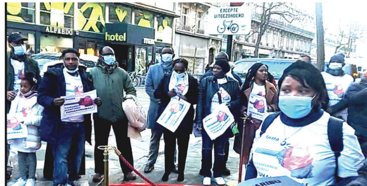
Watanania waishio jijini Brussels, Ubelgiji, wakimlaki Rais Samia Suluhu Hassan.

nchini muda mrefu uliopo, wanaamua kubaki