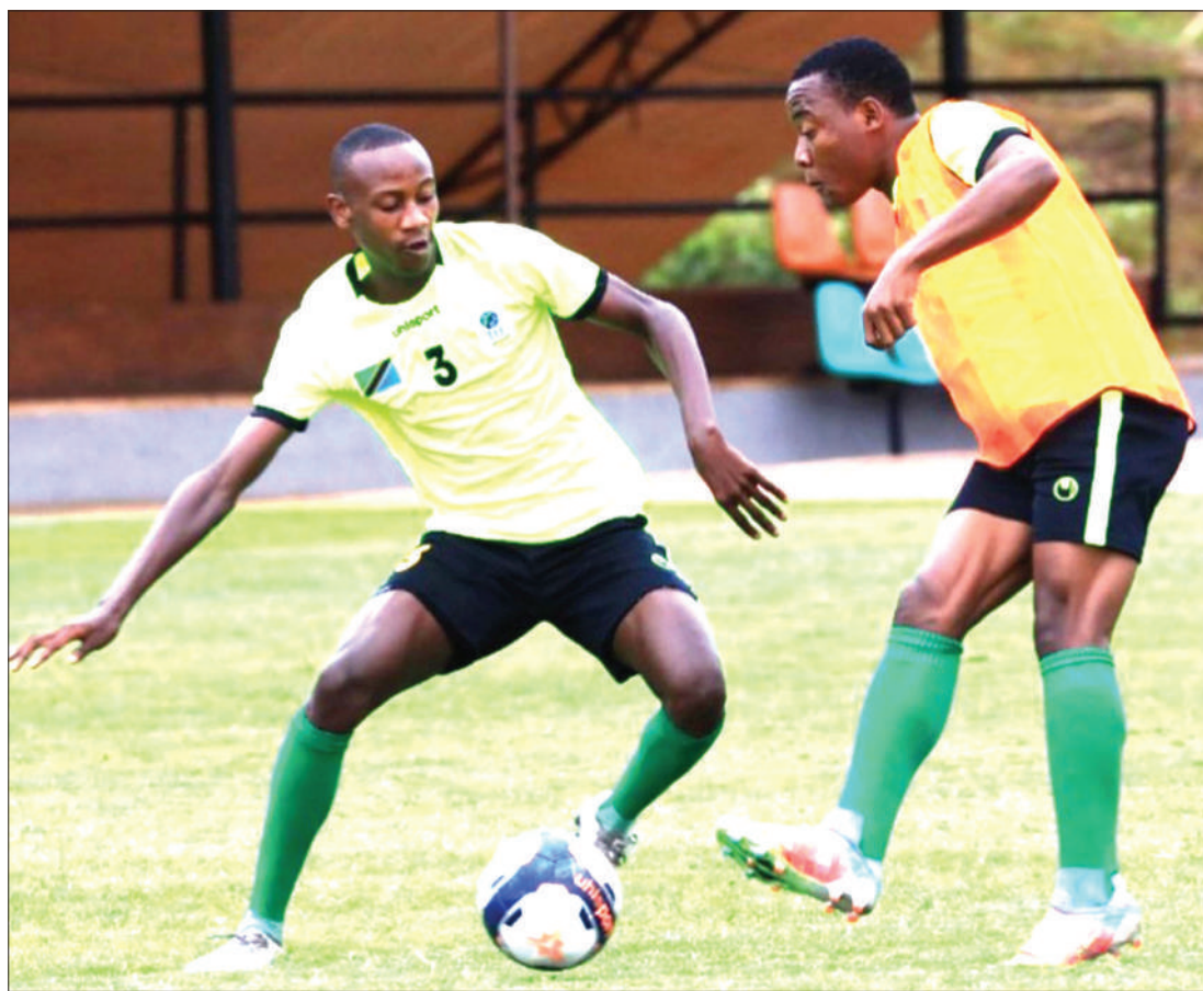
Wachezaji wa Timu ya Soka ya Vijana ya Taifa ya umri chini ya miaka 17 (Serengeti Boys), wakifanya mazoezi kwenye Uwanja wa Black Rhino ulioko Karatu mkoani Manyara kwa ajili ya kujiandaa na mashindano ya Afrika Mashariki na Kati (CECAFA U-17), yatakayofanyika hivi karibuni nchini Ethiopia.

Aliwaomba mashabiki wa timu hiyo kujitokeza kwa wingi ili kuhakikisha wanawaongezea morali wachezaji wakati wote wa mchezo.