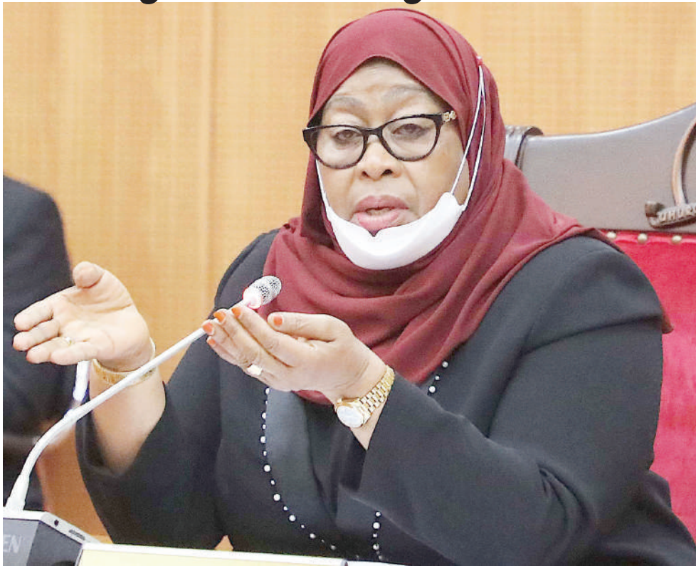
Rais Samia Suluhu Hassan.

Pamoja na kwamba kwa mwaka huu 2022, Umoja wa Mataifa umejielekeza kuzungumzia demokrasia kwa vyombo vya habari na kwa kuwa hakuna mfumo mmoja wa kuendesha demokrasia duniani, kwa upande wetu, tunajielekeza kuzungumzia jambo ambalo limekuwa likidaiwa sana na vyama vya