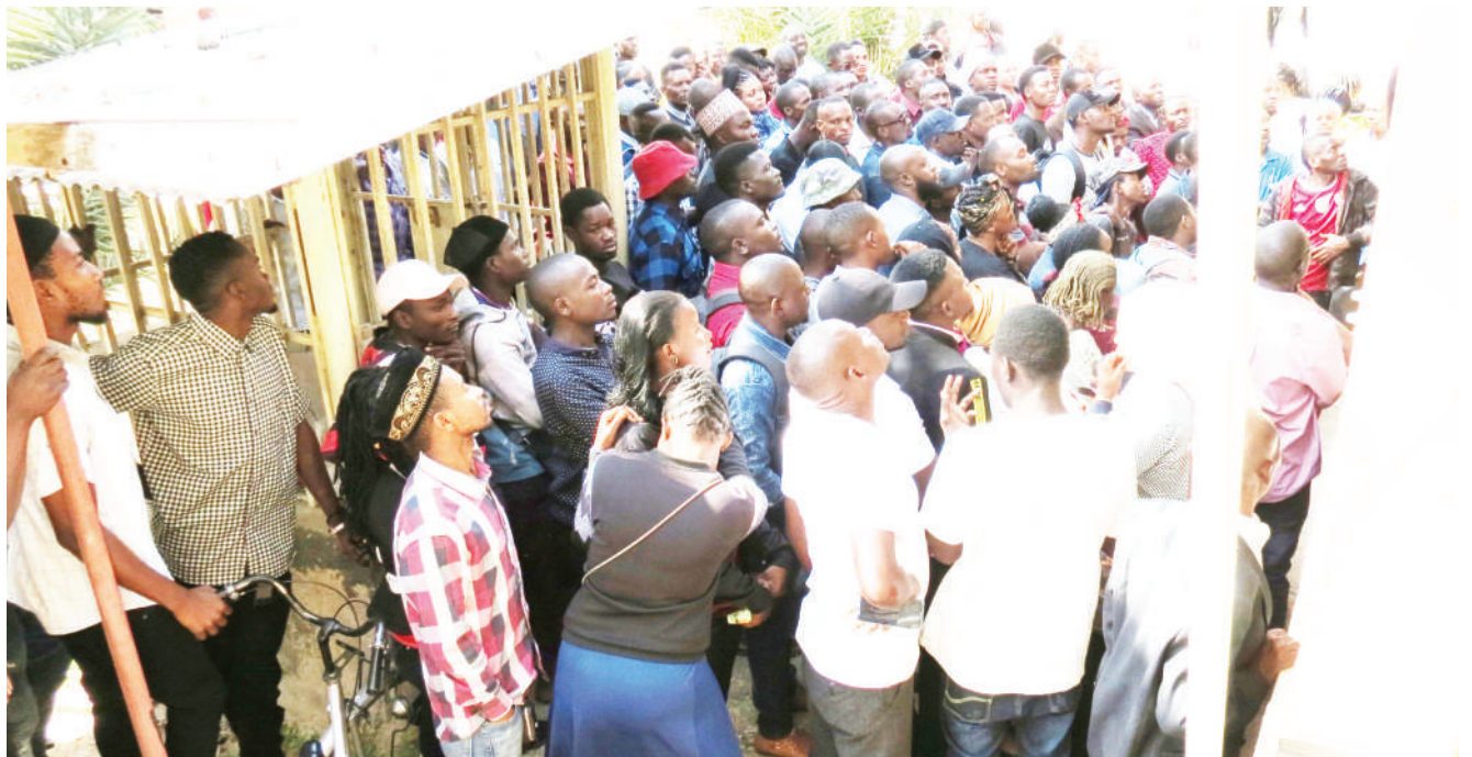
Wauza mitumba wa eneo la Nyerere Square katika Jiji la Dodoma, wakiwa wamekusanyika jana, wakisubiri kupatiwa vitambulisho kutoka kwa viongozi wao, vitakavyowawezesha kufanya biashara kwenye soko jipya la wazi la Machinga Complex, lililoko Barabara ya Bahi, jijini humo.

Alisema kwa sasa anamiliki saluni na kusaidia kukidhi mahitaji ya familia yake na kumlea mtoto wake.