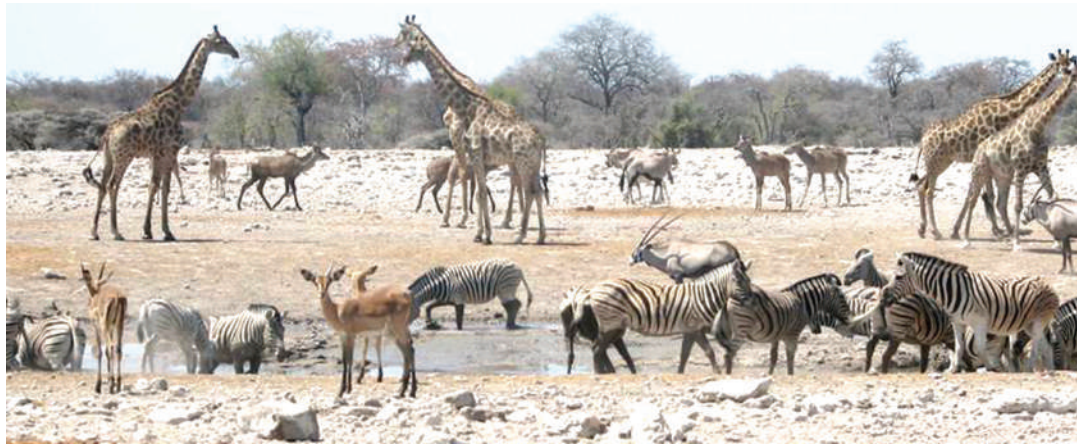
Wanyama wakiwa katika mandhari ya porini, ambako wako chini ya uangalizi wa TAWA.