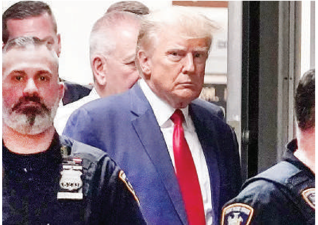
Rais wa zamani wa Marekani, Donald Trump (katikati).