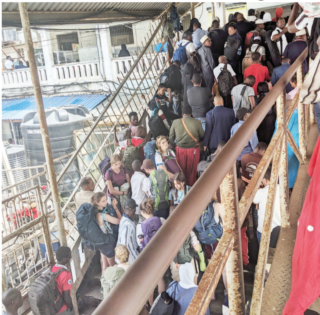
Msongamano forodhani, sehemu ya Bandari ya Dar es Salaam kulivyo katika uhalisi wake sasa.

Walichokuwa wanaashiria hapa inaelekea ni uwezo wa kitaaluma na siyo fedha za uwekezaji na kuboresha kila aina ya miundombinu ya bandari, iendane na viwango vya kimaitaifa