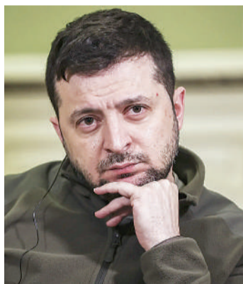
Rais wa Ukraine, Volodymyr Zelensky

Tunapaswa kuendeleza utaratibu wa kidemokrasia zaidi wa kidunia kwa kuhakikisha ushiriki kamili wa nchi zinazoendelea katika vyombo vya maamuzi.