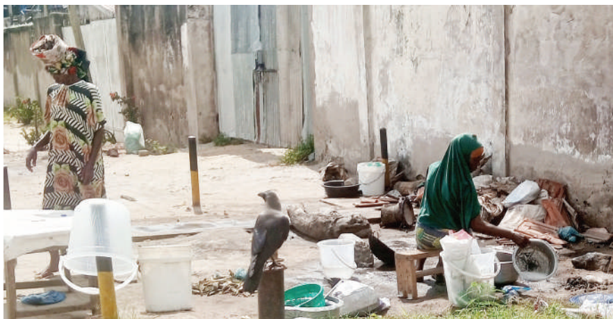
Mamalishe wakifanya biashara katika mazingira machafu kando ya barabara ya Soldering, Mikocheni Viwandani, Dar es Salaam jana kitendo kinachohatarisha afya za walaji.