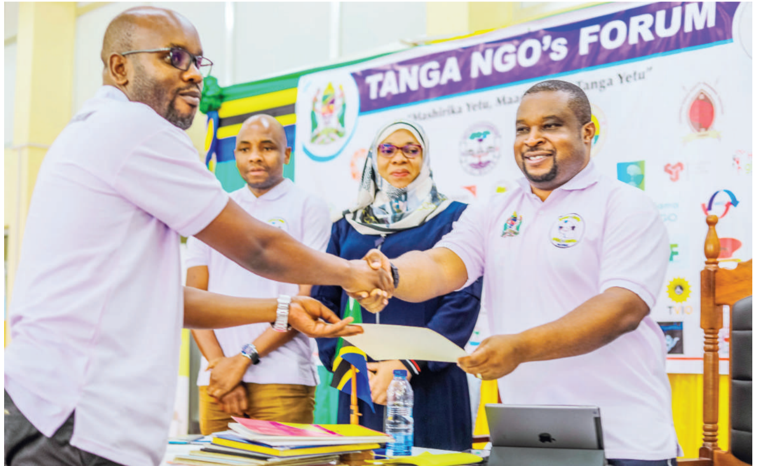
Mkuu wa Mkoa wa Tanga, Waziri Kindamba (kulia), akikabidhi hati kwa mshiriki wa Mkutano Mkuu wa AZAKI.

• Zinapokumbushwa kodi, TAKUKURU kuzibana