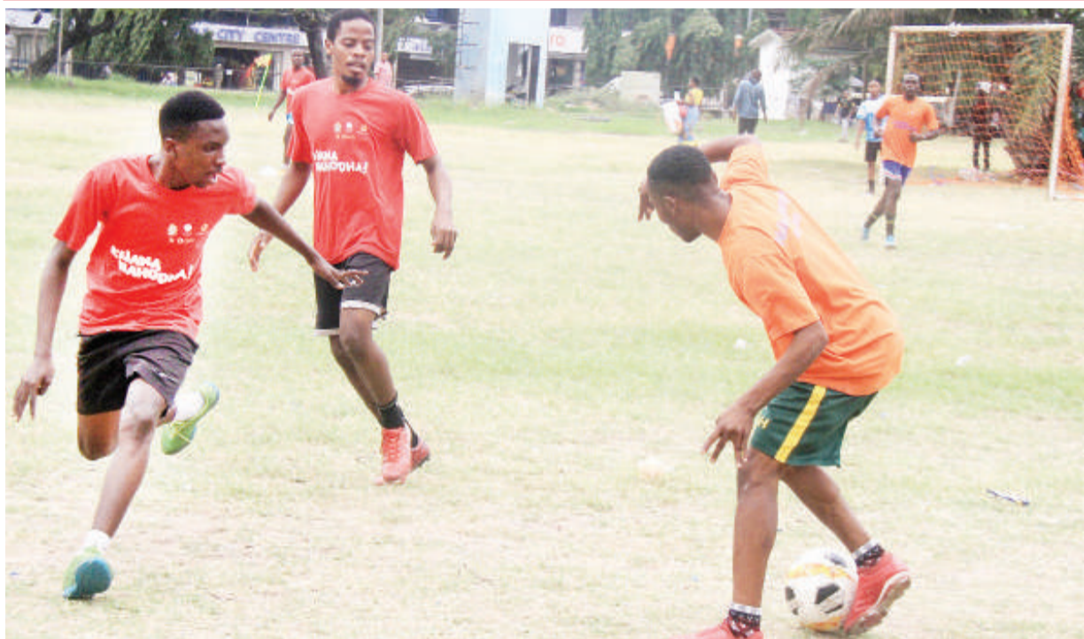
Vijana wakicheza mpira katika viwanja vya Mnazi Mmoja jijini Dar es Salaam juzi.

KMKM itashuka dimbani ugenini nchini Ethiopia Jumatano wiki hii, ikihitaji kupata ushindi kuanzia mabao 2-0 ili kuweza kutinga raundi ya kwanza ya michuano hiyo inayoongoza kwa utajiri barani Afrika kwa ngazi ya klabu.