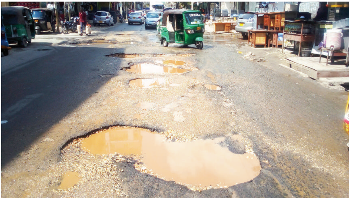
Vyombo vya moto vikipita kwa shida kutokana na barabara kuharibika katika mkutano ya Mtaa wa Swahili na Faru jijini Dar es Salaam jana.