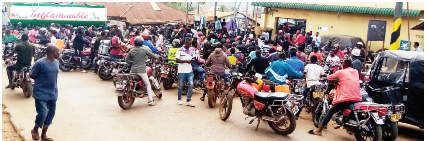
Msongamano wa madereva wa pikipiki na bajaji wakisubiri kujaza mafuta katika kituo cha Mnyamuru wilayani Muheza mkoani Tanga jana, kutokana na uhaba wa bidhaa hiyo.

Taarifa hiyo ilisema miradi hiyo, itatekelezwa kwa muda wa miezi mitatu kwa kutumia utaratibu uliowekwa na serikali wa kuwatumia mafundi jamii (force account).