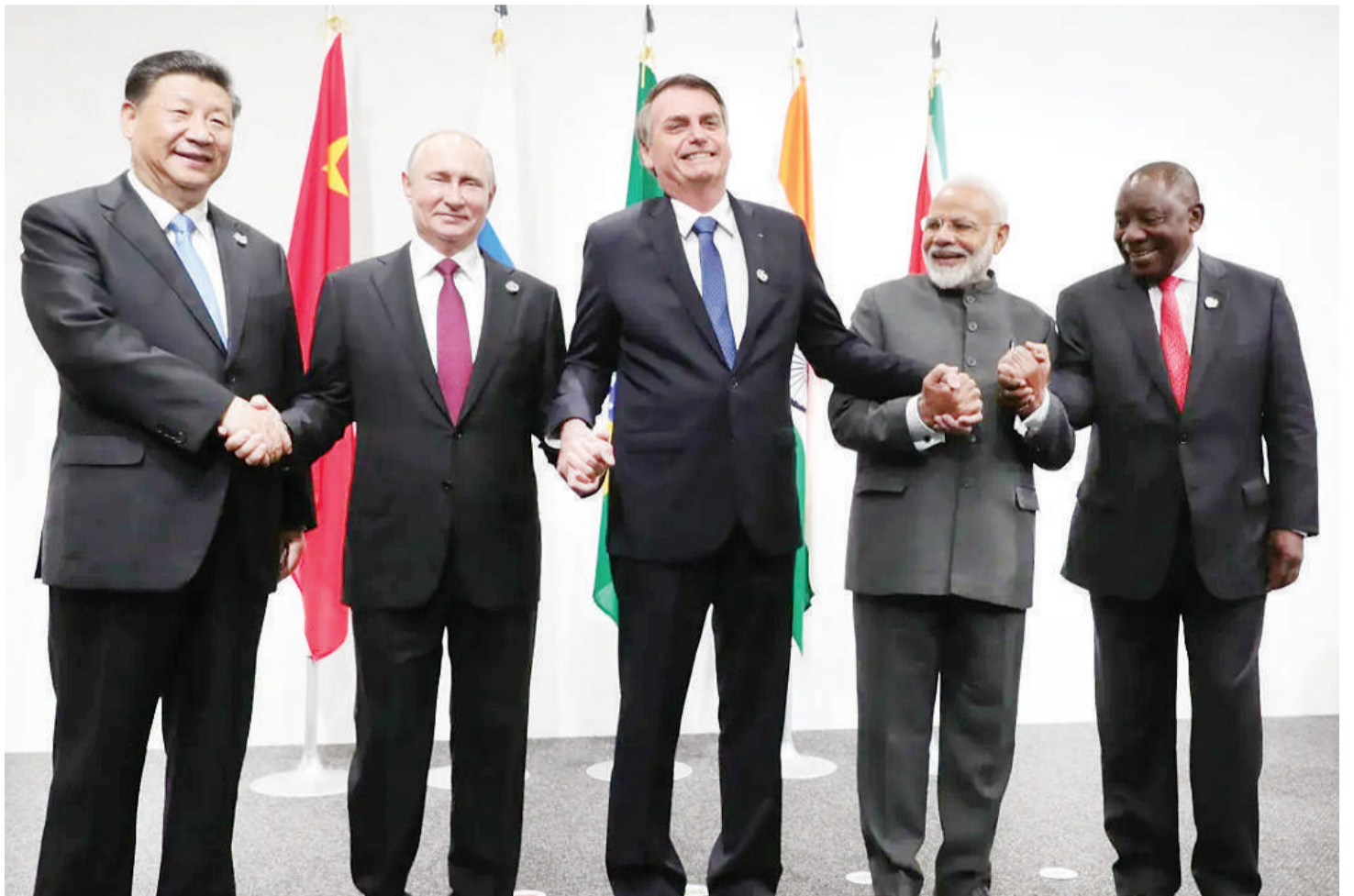
Baadhi ya marais wa BRICS, kushoto ni Xi Jinping wa China, Vladimir Putin, Urusi na Cyril Ramaphosa wa Afrika Kusini (kulia).

• Licha kutoshiriki wajumbe waikubali, kuitetea Moscow