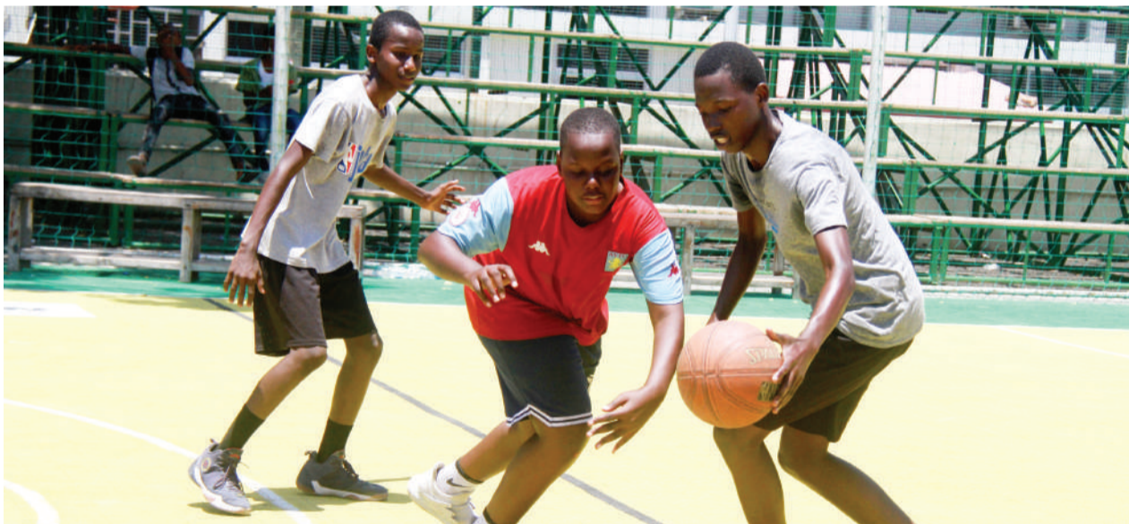
Vijana wakiwania mpira wakati walipokuwa wakifanya mazoezi ya mpira wa Kikapu katika viwanja vya michezo vya Jakaya Kikwete jijini Dar es Salaam jana.

Aliongeza kwa kuwataka Bodi kuanzalia mambo mengi ya kujenga soka, kutokana na chombo hicho kuwa na dhama kubwa, utendaji wa waamuzi kwa kulalamikiwa na baadhi ya timu na wengine kufunguwa waamuzi kwa sababu ya kutofuata sheria za soka hasa wanapocheza timu kubwa.