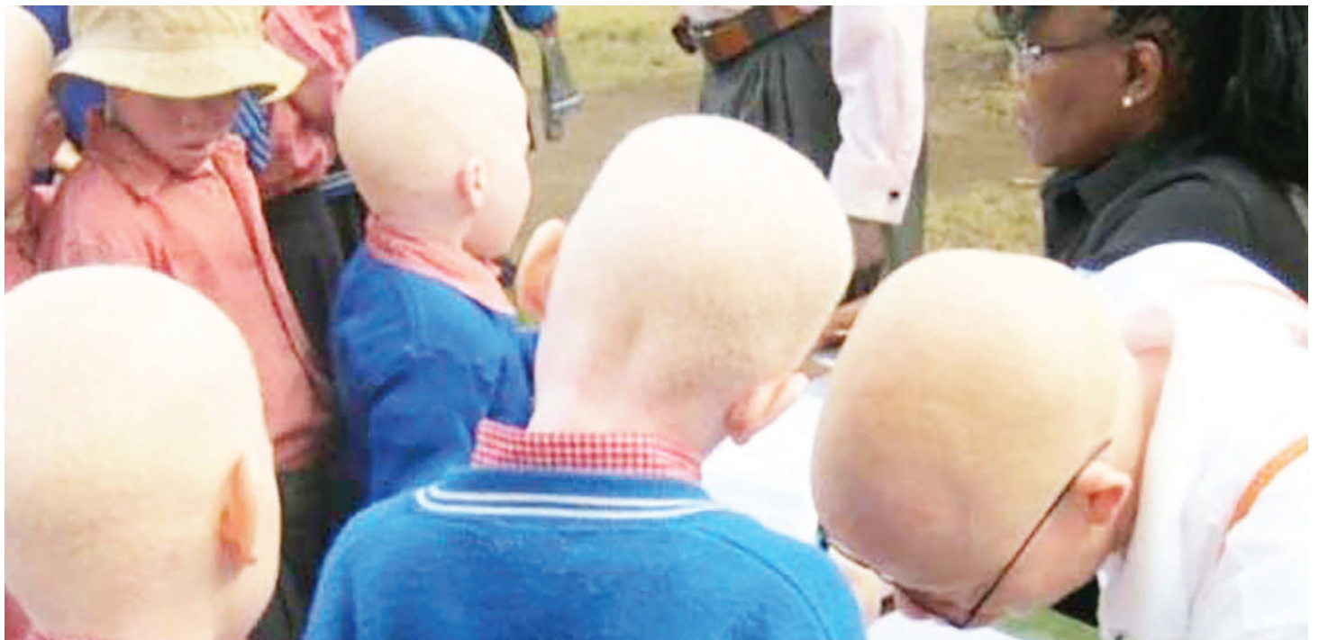
Baadhi ya watoto wenye ulemavu wa ngozi.