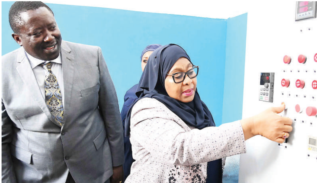
Rais Samia Suluhu Hassan, akibonyeza kitufe kuwasha mtambo wa kutoa maji chini ya ardhi kwenye kisima kirefu cha mita 450 kwa ajili ya kuyapeleka kwenda kwenye tanki kubwa la maji katika eneo la Kigamboni, jijini Dar es Salaam jana.