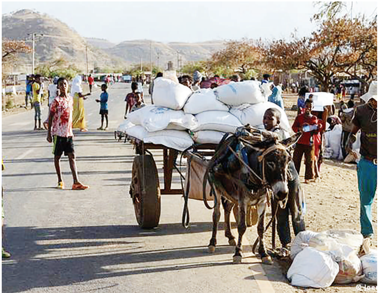
Mtoto akimuongoza punda aliyebeba mizigo katika jimbo la Tigray hivi karibuni. Eneo hilo linakabiliwa na ukosefu wa chakula kutokana na vita.

Washington ilisema mazungumzo hayo yatagusia njia za kuimariisha ushirikiano kati ya China na Marekani pamoja na kuyatafutia majibu masuala yanayotatiza uhusiano baina ya madola hayo mawili ikiwemo hadhi ya kisiwa cha Taiwan. DW