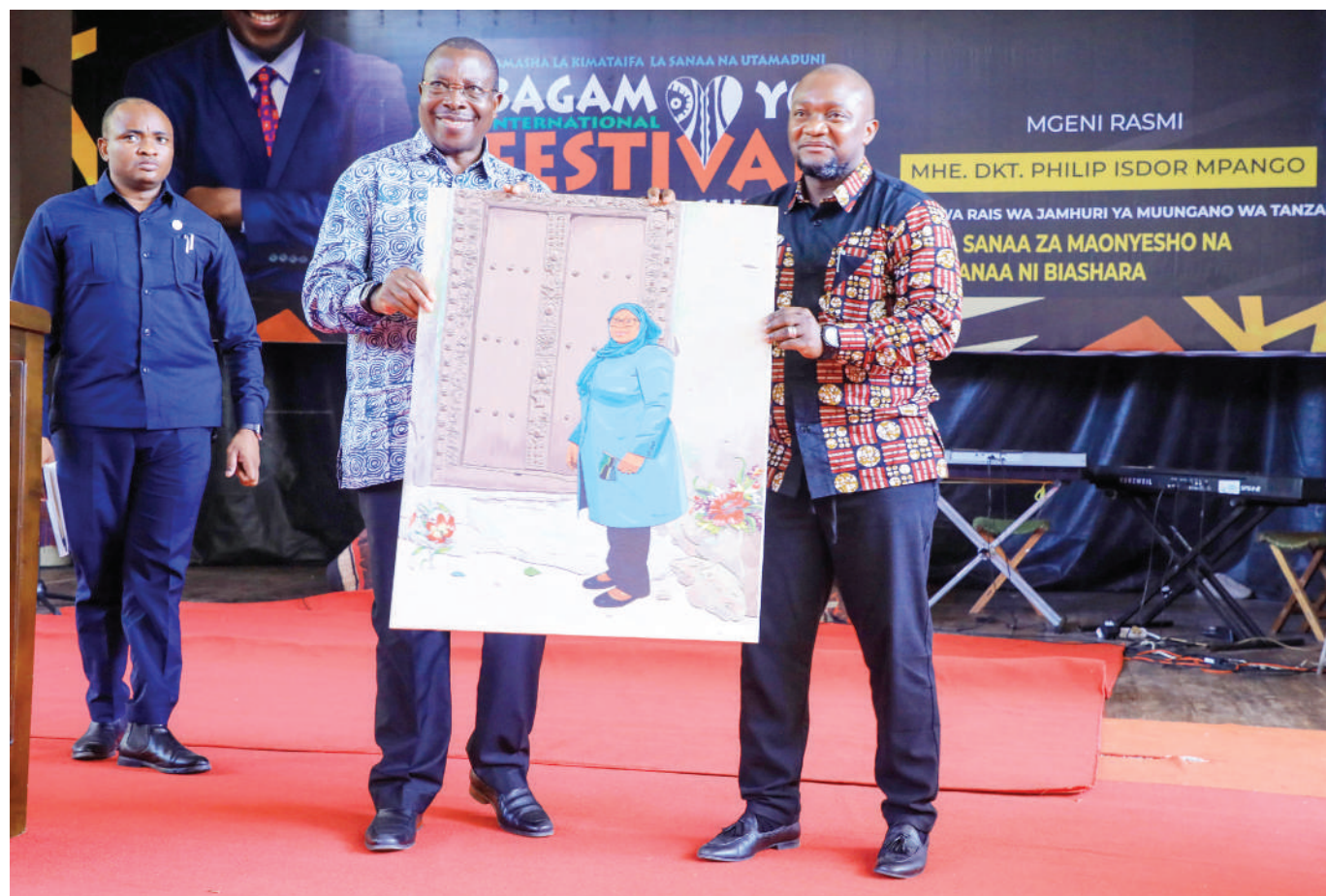
Makamu wa Rais, Dk. Philip Mpango (kushoto) akikabidhiwa picha maalumu ya Rais, Samia Suluhu Hassan na Waziri wa Utamaduni, Sanaa na Michezo, Mohamed Mchengerwa iliyoandaliwa na wasanii walioshiriki Tamasha la 41 la Kimataifa la Sanaa na Utamaduni la Bagamoyo lililofanyika katika Taasisi ya Sanaa na Utamaduni Bagamoyo (TaSUBa), mkoani Pwani jana.

Alisema mashindano yata-shirikisha wanaume na wanawake na watacheza kwa mifumo tofauti.