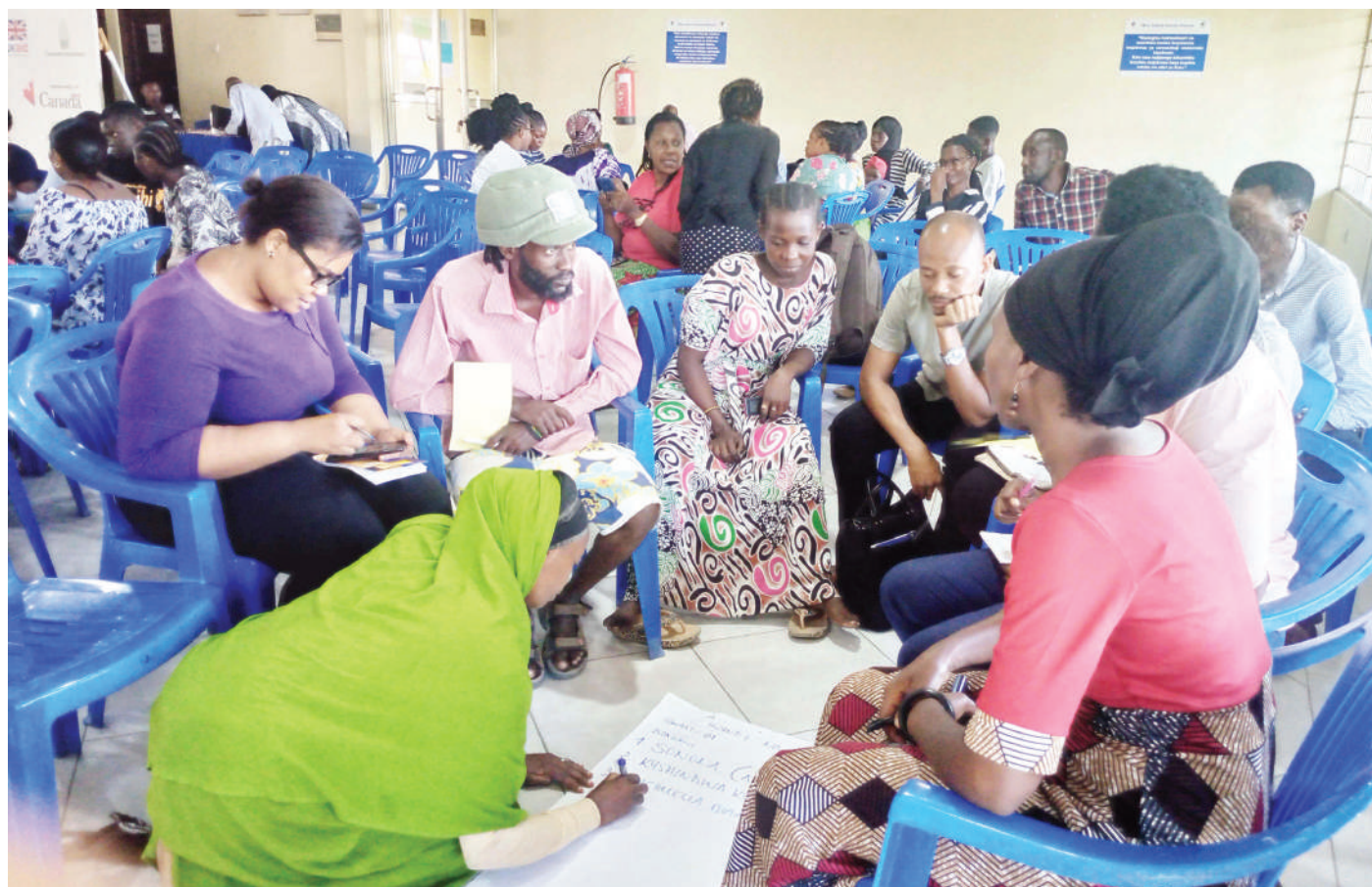
Baadhi ya washiriki wa Semina ya Jinsia na Maendeleo (GDSS), iliyoandaliwa na Mtandao wa Jinsia Tanzania (TGNP), wakiwa katika vikundi vya kujadili mikakati ya kutokomeza ukatili wa jinsia, jijini Dar es Salaam juzi.

“Na kwa mteja ambaye hadai risiti faini yake inaanzia shilingi 30,000 mpaka milioni 1.5 au kifungo kwa mfanyabiashara au mteja aliyeshindwa kudai risiti,” alisema.