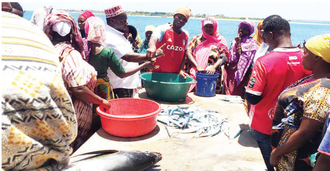
Wachuuzi wakiwa kwenye mnada wa Soko la Samaki Feri mkoani Mtwara wiki iliyopita.