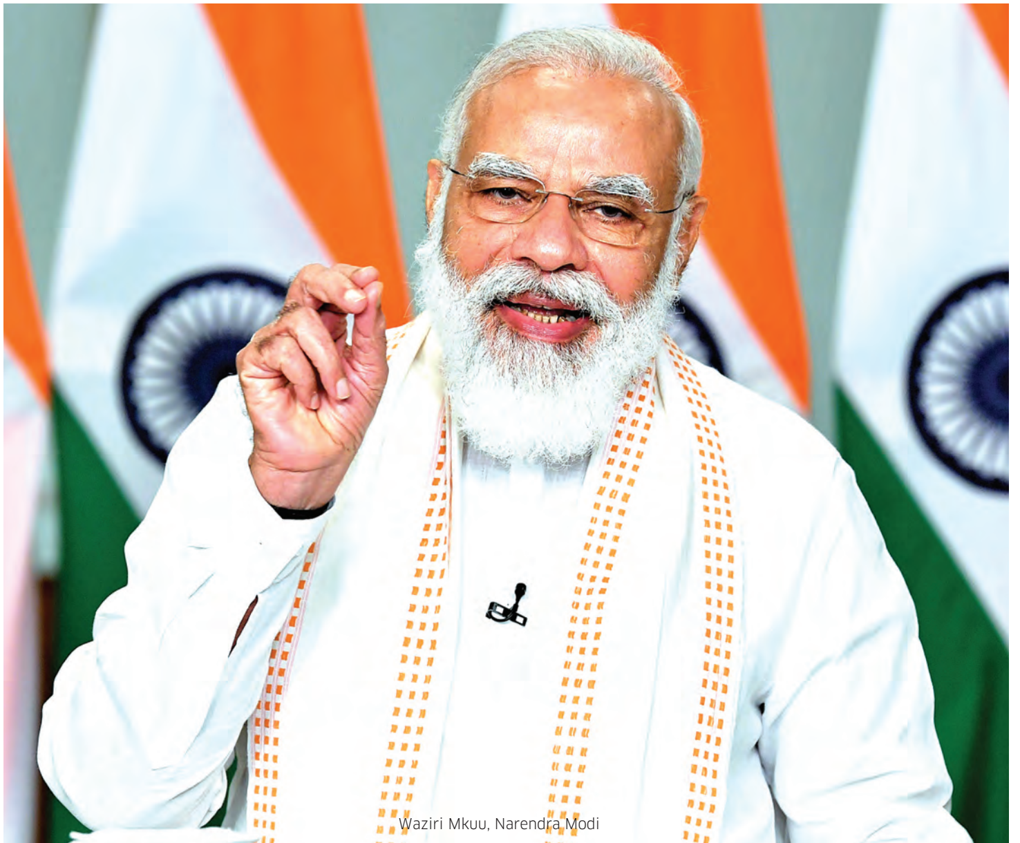
Waziri Mkuu, Narendra Modi

Tunakusudia kuendelea kuvuna hazina ya nishati mbadala ya India. Uwezo wetu wa nishati mbadala ni wa nne kwa ukubwa duniani na uongezaji wa uwezo unaofanywa sasa ni miongoni mwa uongezaji uwezo mkubwa pia duniani. Sehemu kubwa ya nishati hii itatoka katika chanzo cha nishati safi zaidi, yaani jua.