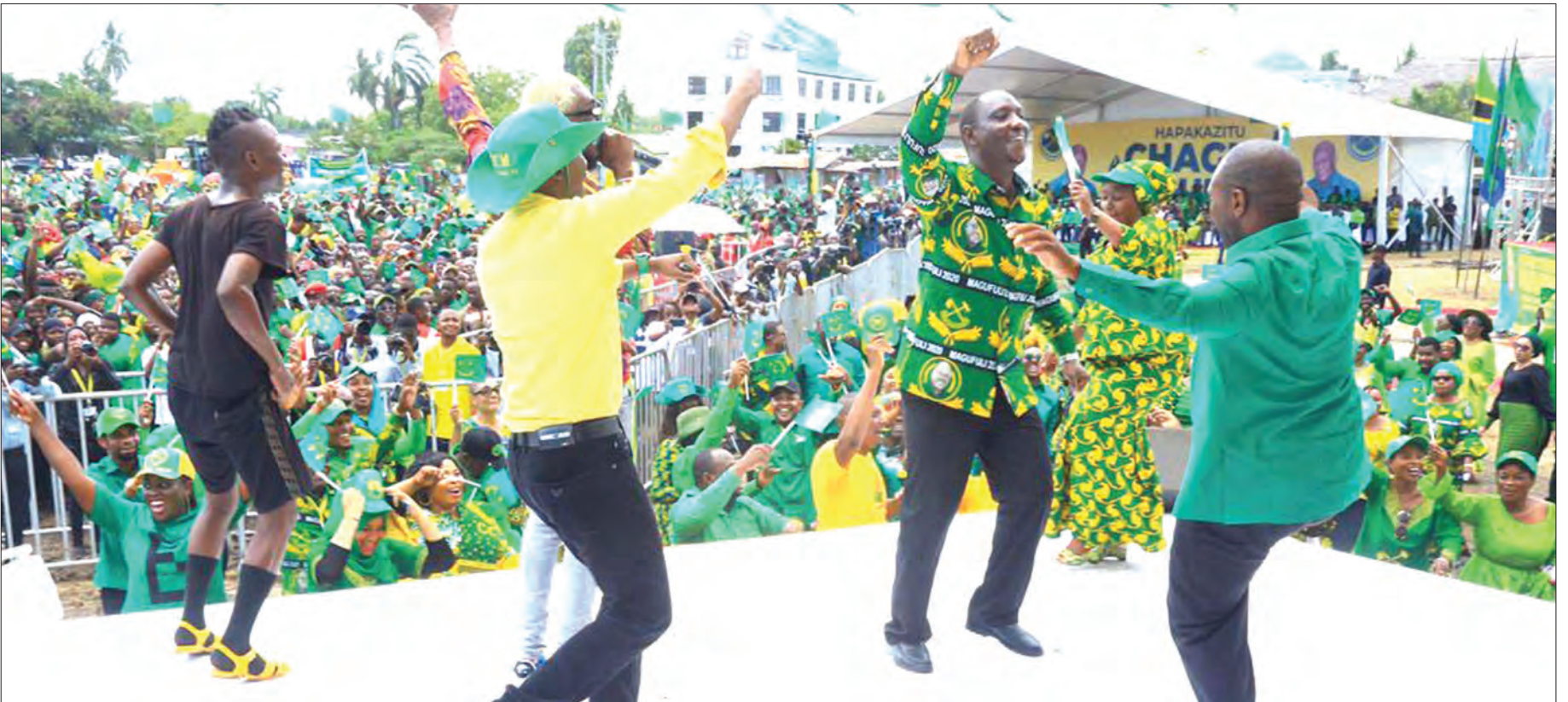
Katibu Mkuu wa CCM, Dk. Bashiru Ally (wa tatu kulia) akiwa kwenye moja ya kampeni za chama hicho.