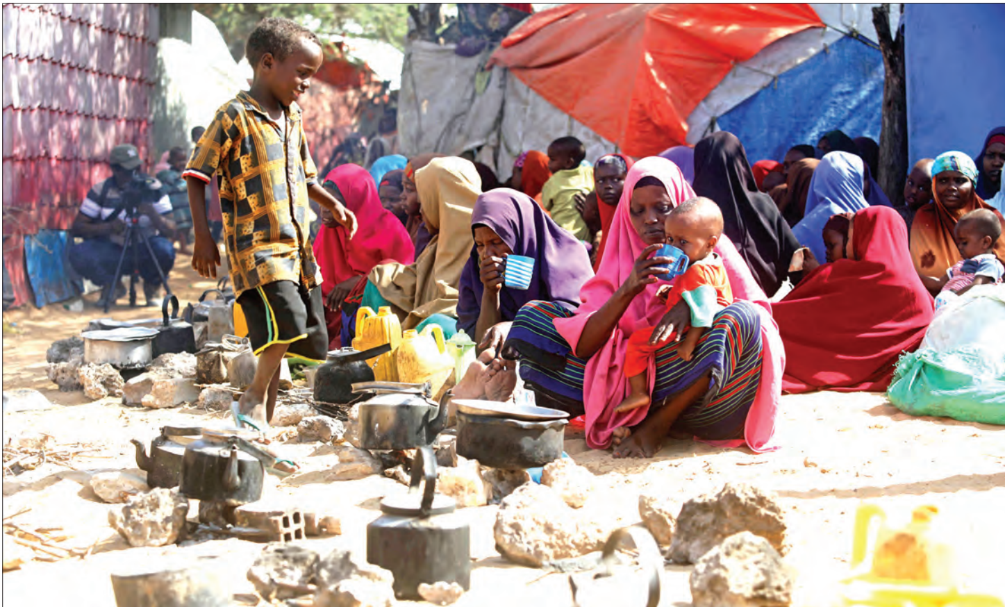
Mamia ya Wasomali wakiwa kambini kutokana na ukosefu wa amani katika taifa hilo.