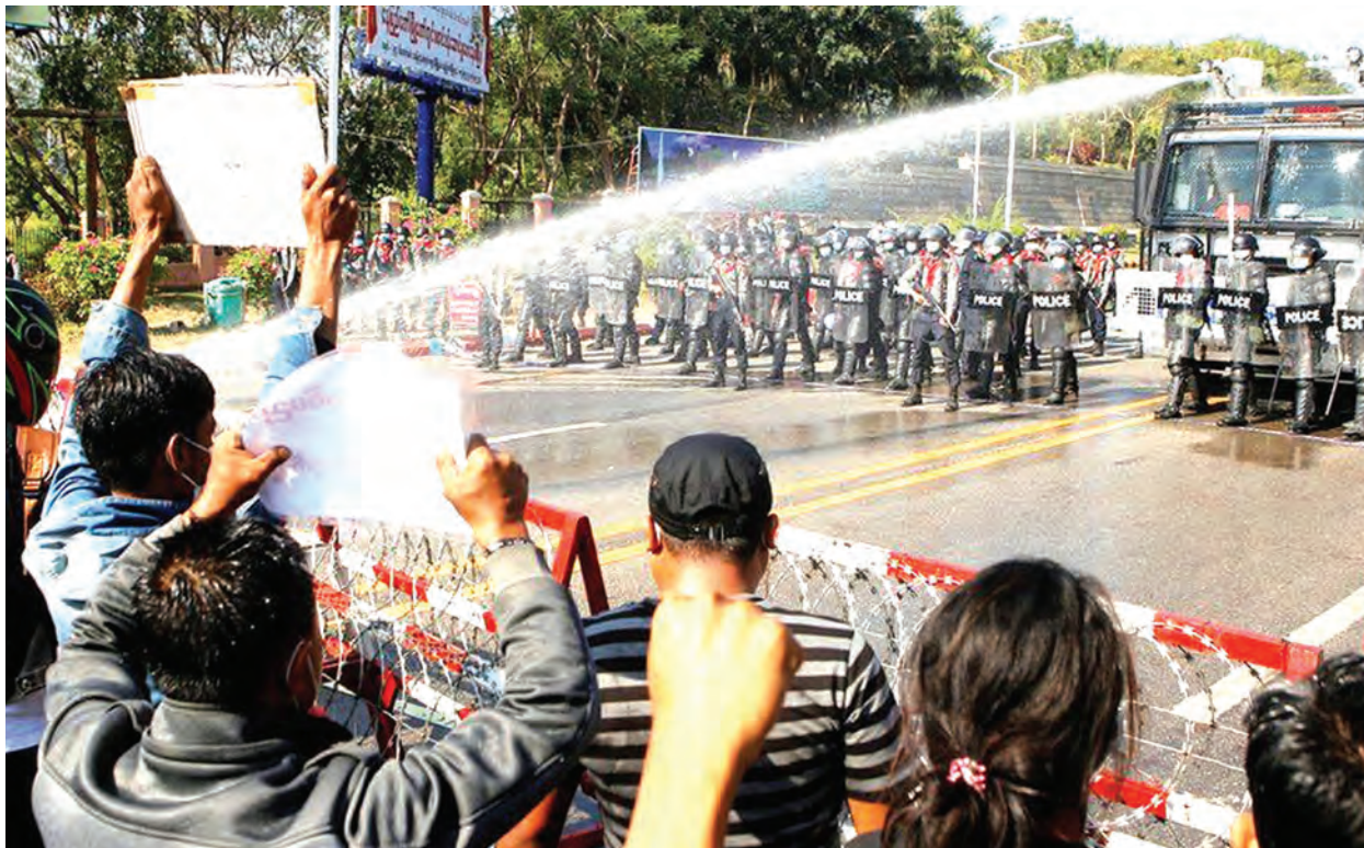
Mwanamke mmoja inadaiwa alijeruhiwa kichwani wakati wa maandamano, Polisi wakilazimika kutumia risasi za mpira na maji ya kuwasha kudhibiti maelfu ya waandamanaji ikiwa ni siku ya tatu ya maandamano, mjini Nay Pyi Taw, nchini Myanmar.