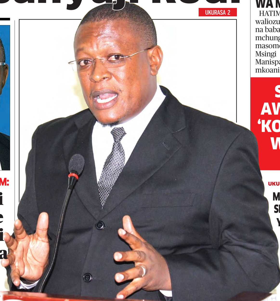
Mbunge wa Mtama, Nape Nnauye