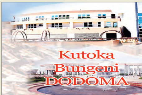
Habari na Augusta Njoji

“Utekelezaji wa mradi wa maji kutoka Ziwa Victoria utahudumia maeneo yote ya mji wa Tarime kwa kuzalisha wastani wa lita 6,500 kwa siku ambazo ni zaidi ya mahitaji,” alisema.