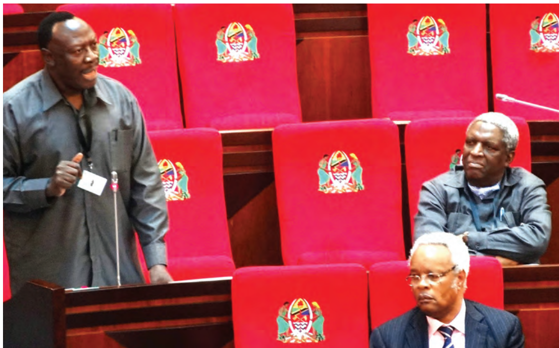
Prof. Lipumba akichangia mijadala ya Bunge Maalumu la Katiba lililofanyika Dodoma mwaka 2014.