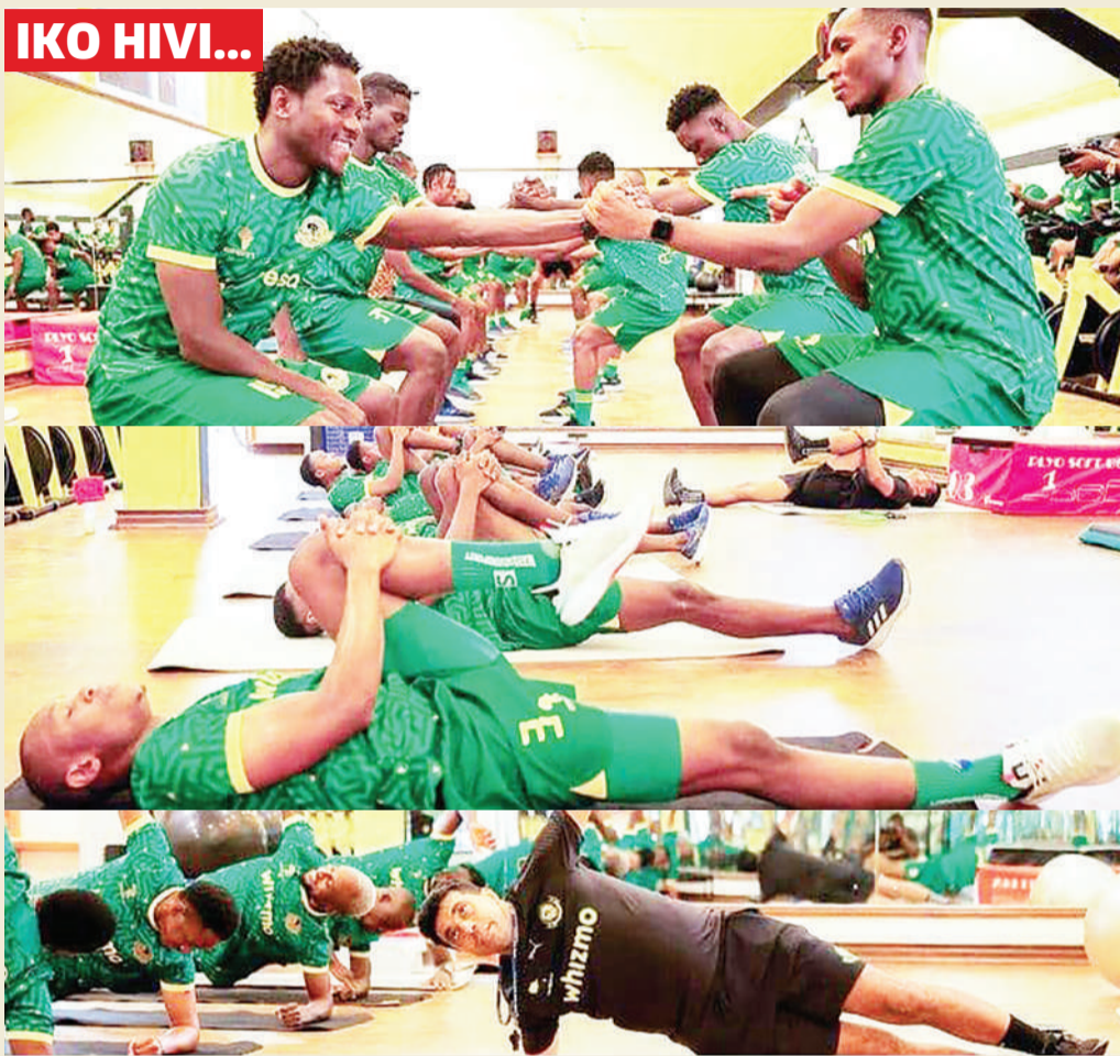
Wachezaji wa Yanga wakifanya mazoezi ya viungo kujiandaa na mechi ijayo ya Ligi ya Mabingwa Afrika ugenini dhidi ya Medeama ya Ghana itakayopigwa nchini humo Ijumaa wiki hii.