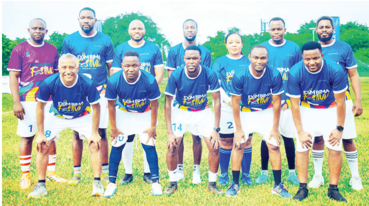
Kikosi cha Timu ya Benki ya Exim kilichoibuka mshindi wa jumla kwenye mashindano ya mpira wa miguu yali-yohusisha wadau wote wakati wa Tamasha la Exim Bima Festival lililoratibiwa na benki hiyo mwishoni mwa wiki jijini Dar es Salaam.

Kanuni iliyotumika ni Bara kuwa na kadi chache za njano, huku kila timu ikiwa imecheza mechi tatu, ikishinda moja, sare moja na kupoteza moja, mabao matatu ya kufunga na kufungwa, zote pia zikimaliza na pointi nne.