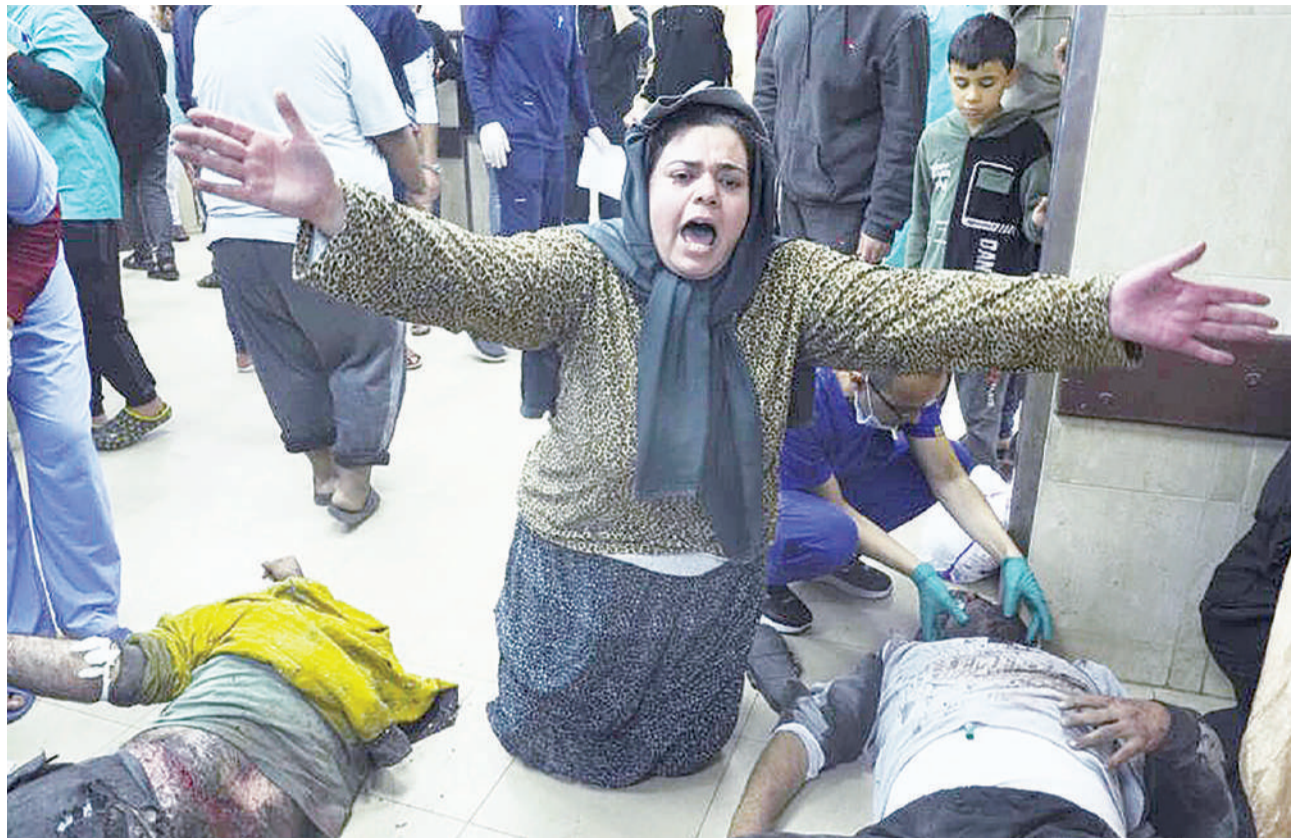
Wananchi wa Palestina wakihuzunika baada ya kupoteza ndugu zao kutokana na shambulizi la Israel, jana.