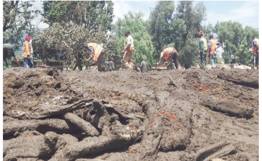
Wakazi wa Kijiji cha Gendabi Katesh mkoani Manyara wakisafisha barabara iliyofunikwa na tope baada ya mvua kubwa iliyonyesha Jumapili na kuharibu nyumba na miundombinu mbalimbali jana.

"Mimi ninakaa upande wa pili wa juu (kuelekea Mlima Hanang). Haya mafuriko yalinikuta nikiwa kule juu, nikasikia kelele watu wanapiga nikajitokeza nikaja hapana nyumbani kwa