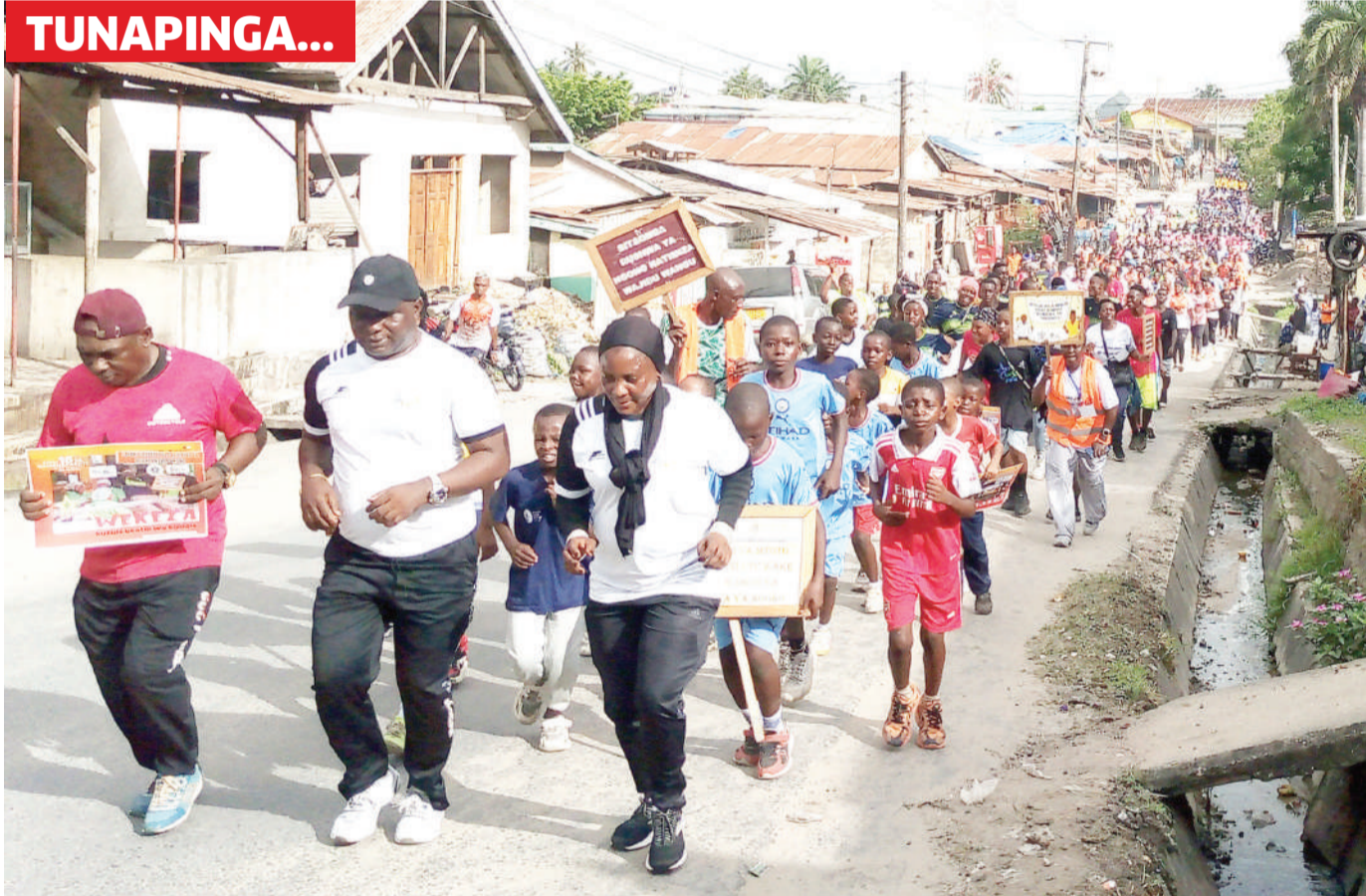
Wanamichezo wa jogging wakiwa katika mbio za uzinduzi wa siku 16 za kampeni ya kupinga ukatili wa kijinsia Tandale maeneo ya Manzese, Dar es Salaam jizi.