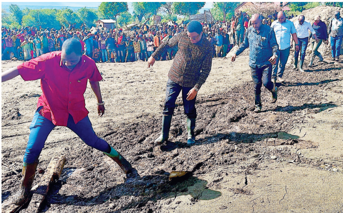
Waziri Mkuu, Kassim Majaliwa, akikagua maeneo yaliyoathirika na mafuriko katika Kijiji cha Gendabi wilayani Hanang' jana.

• Kanisa labaki, babu asimulia alivyonusuru wajukuu wanne, mkwe; mzee mwenzake aokoa mke, watoto... Endelea Uk. 2&3