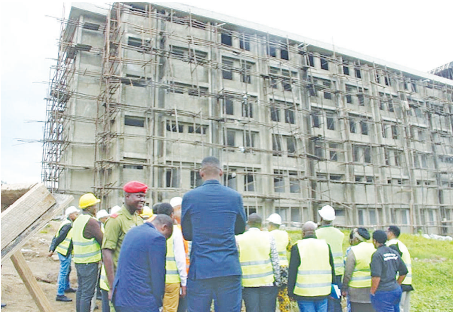
Mwonekano wa upande mmoja wa jengo jipya la upanuzi wa Hospitali ya Meta jijini Mbeya, likiwa na vyumba 223, vikiwamo vitatu vya upasuaji na huduma za dharura wakati ikijengwa PICHA: MTANDAO.

Hapo ni sawa na ongezeko la vituo 1,061, inayojumuisha zahanati; vituo vya afya; hospitali zenye hadhi za wilaya na rufani ngazi ya mkoa na kanda; hospitali maalum na taifa.