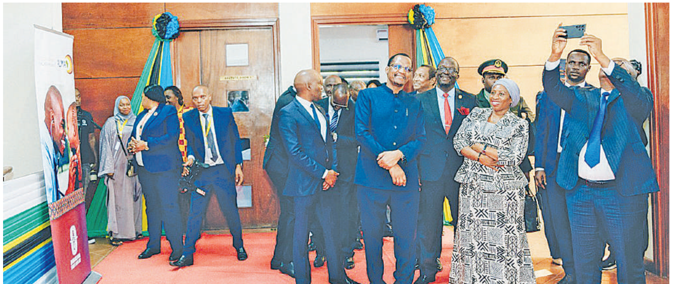
Mwenyekiti wa Umoja wa Viongozi wa Afrika katika Mapambano dhidi ya Malaria (ALMA), Sissoco Embaló ambaye ni Rais wa Guinea Bissau (kulia), akijipiga picha alipotembelea ofisi za ALMA, jijini Dar es Salaam hivi karibuni. Wa pili kulia ni Waziri wa Afya, Umyy Mwalimu.

Aliongeza kuwa Serikali ya Rais Samia Suluhu Hassan pia inahimiza matumizi ya nishati safi ya kupikia, ikiwekeza Sh. bilioni 2.2 ili kuinua jamii hususan wanawake ambao ndio wahusika wakuu wa masuala ya upishi.