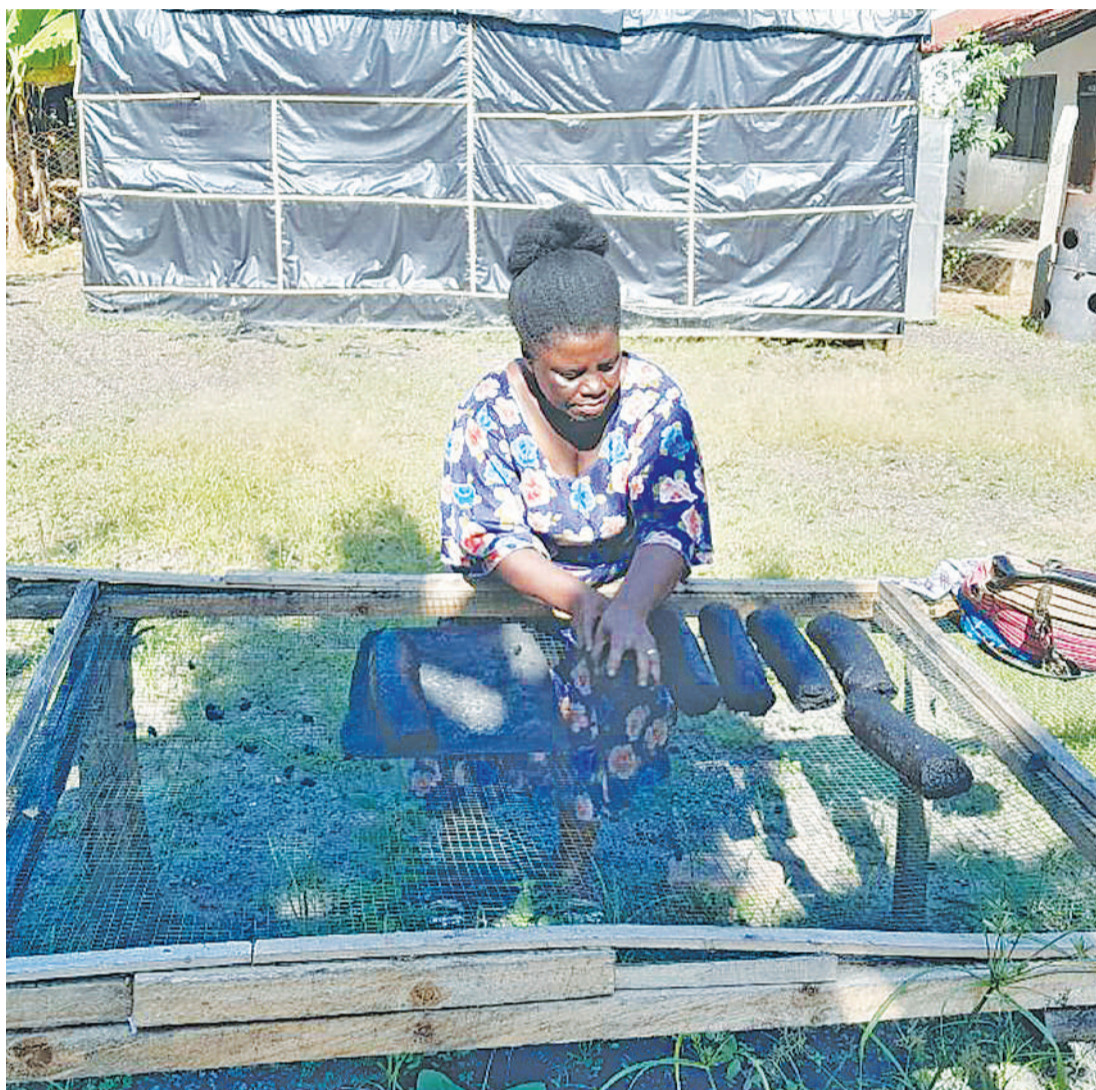
Mkaa utokanao na taka ukiandaliwa.

Restuta anasema, baadaye shirika lisilo la kiserikali la Associazione Mazingira, liliwatafuta na kuwapatia mafunzo ya kutengeneza mkaa huo kitaalam na kuwapa