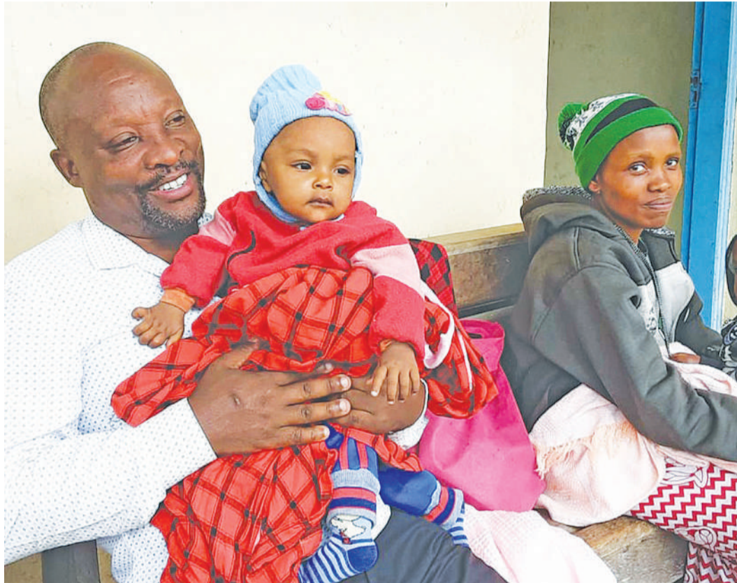
Baba na mama wakiwa kliniki, mkoani Arusha.

kwa binadamu yapo manne; A, B, AB na O. Pia, yamegawanyika katika sehemu kuu mbili zilitwazo 'rhesus factors' au inatamkwa 'rizasi fakta'. Rizasi fakta hizi zipo za aina mbili ambazo ni hasi na chanya.