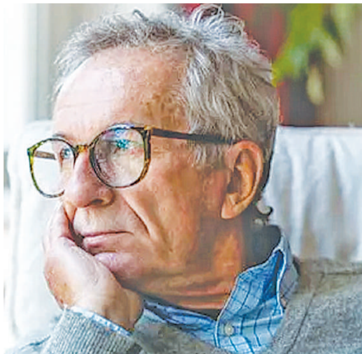
Mwenye tatizo la kumbukumbu.

Muda mfupi baada ya kuhudhuria kliniki, Hospitali ya Taifa Muhimbili (MNH), Frank, anazungumza na Nipashe, mwishoni mwa wiki.