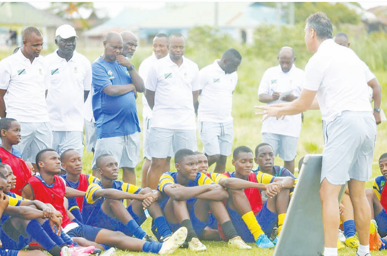
Washiriki wa Kozi ya CAF B Diploma (waliosimama), wakimsikiliza Mkufunzi kutoka Shirikisho la Soka Afrika (CAF) katika mafunzo yanayoendelea jijini Tanga.

"Kumwacha Chama si uamuzi mzuri, kwa upande wangu naona bado ana nafasi na mchango mkubwa katika kikosi chetu, kwa sasa unaweza kuleta mtu mpya, je kama atashindwa kuonyesha uwezo wake au kuingia katika mfumo itakuaje, itaigharimu timu," alisema shabiki huyo.