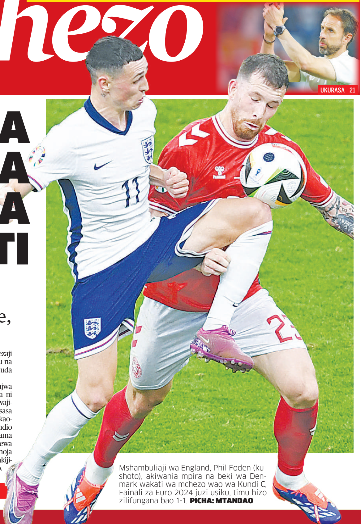
Mshambuliaji wa England, Phil Foden (ku- shoto), akiwania mpira na beki wa Denmark wakati wa mchezo wao wa Kundi C, Fainali za Euro 2024 juzi usiku, timu hizo zilifungana bao 1-1.