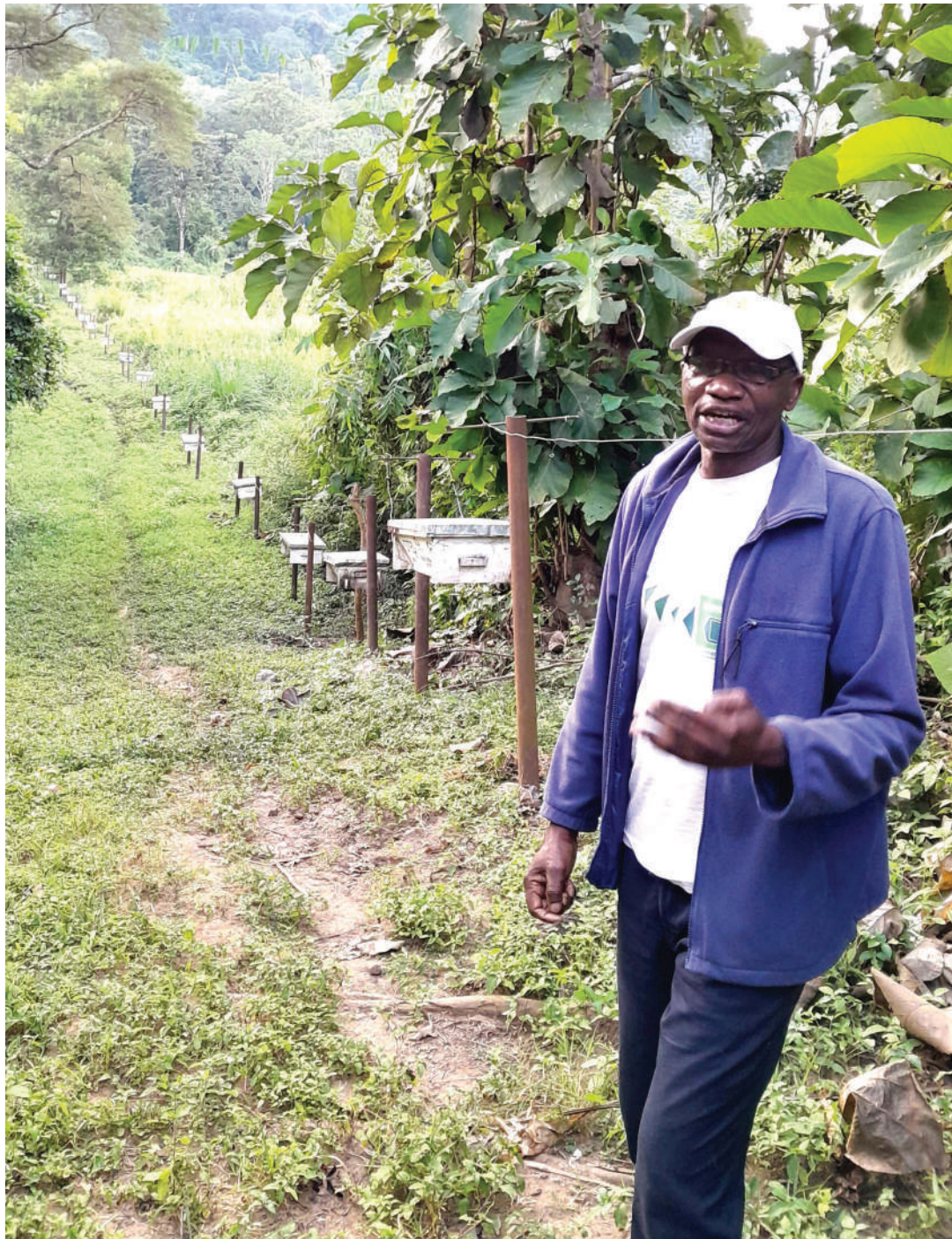
Uzio wa mizinga kuwadhiti tembo umefanikisha kulima maeneo ambayo kwa miaka mingi hayakulimwa kutokana na kupakana na Hifadhi ya Mwalimu Nyerere.

Kuhusu mizinga Lim anasema wana kikundi wamepewa elimu na kuwawezesha na sasa wanauza asali na kupata fedha ambazo hugawana kwa kadri ya makubaliano.