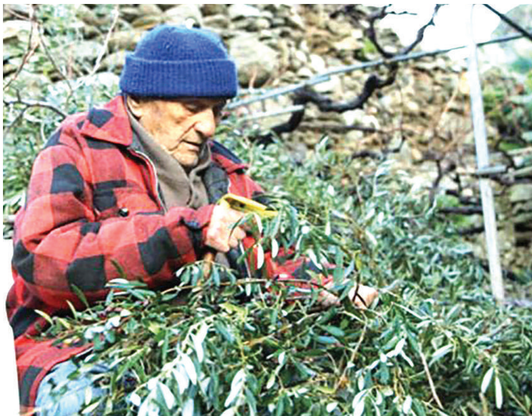
Mzee aliyeishi karibu muongo mmoja akifurahia maisha wakati zabibu zikitajwa kuwa dawa ya kurefusha maisha kisiwani Ikaria. PICHA: BBC

Anasema na kushangazwa na swali na kueleza kuwa anakunywa na marafiki zake na kwamba hunywa zabibu na kupumzika na marafiki na familia.