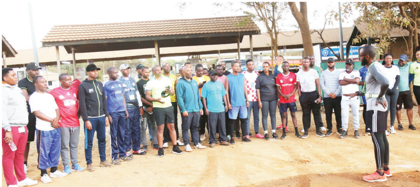
Baadhi ya wafanyakazi wa mgodi wa Barrick Bulyanhulu uliopo mkoani Shinyanga wakipata mawaidha ya kulinda afya zao kabla ya kuanza kukimbia mbio za uzinduzi wa kampeni maalumu ya kutokomeza ugonjwa wa malaria uliofanyika mgodini hapo mwishoni mwa wiki.

Alisema eneo hilo ni miongoni mwa maeneo yenye vyanzo vingi vya maji na hivyo hakuna sababu ya wananchi kuendelea kupata shida ya upatikanaji wa huduma hiyo muhimu.