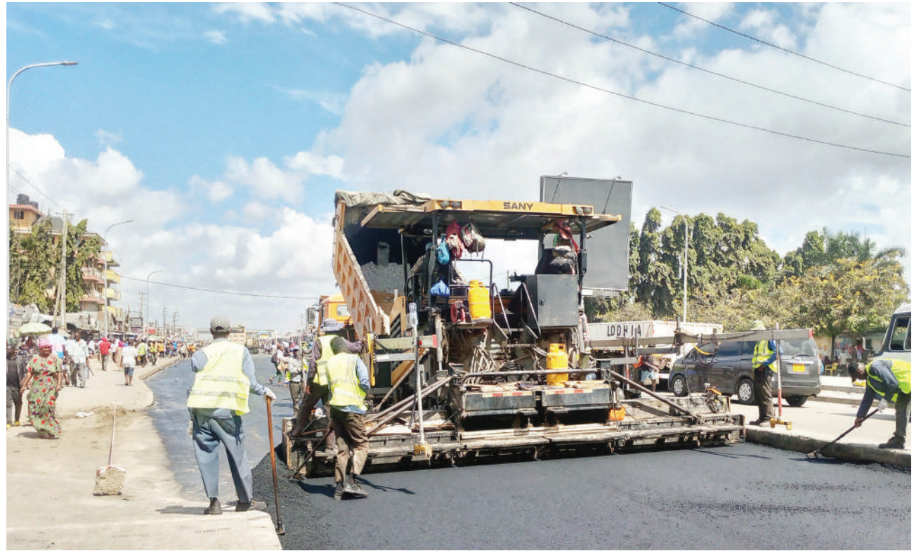
Mafundi wakiweka lami kwenye Barabara ya Kilwa, eneo la Mbagala Zakhem jijini Dar es Salaam, mwishoni mwa wiki.

Vile vile, alisema Tanzania ni nchi ya nne duniani kwa kuwa na wagonjwa wa selimundu, hivyo ni vema jamii ikajua hilo na kuzingatia maelekezo wanayopewa na wataalamu wa afya ili kudhibiti ugonjwa huo.