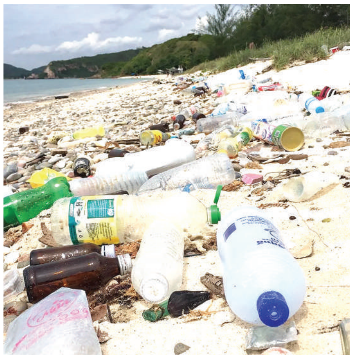
Taka za plastiki zikitapakaa kwenye fukwe. PICHA: MTANDAO

Mashine hiyo, inafanya kazi pale unapochukua chupa za plastiki ukaziwasha moto zinapoyeyuka