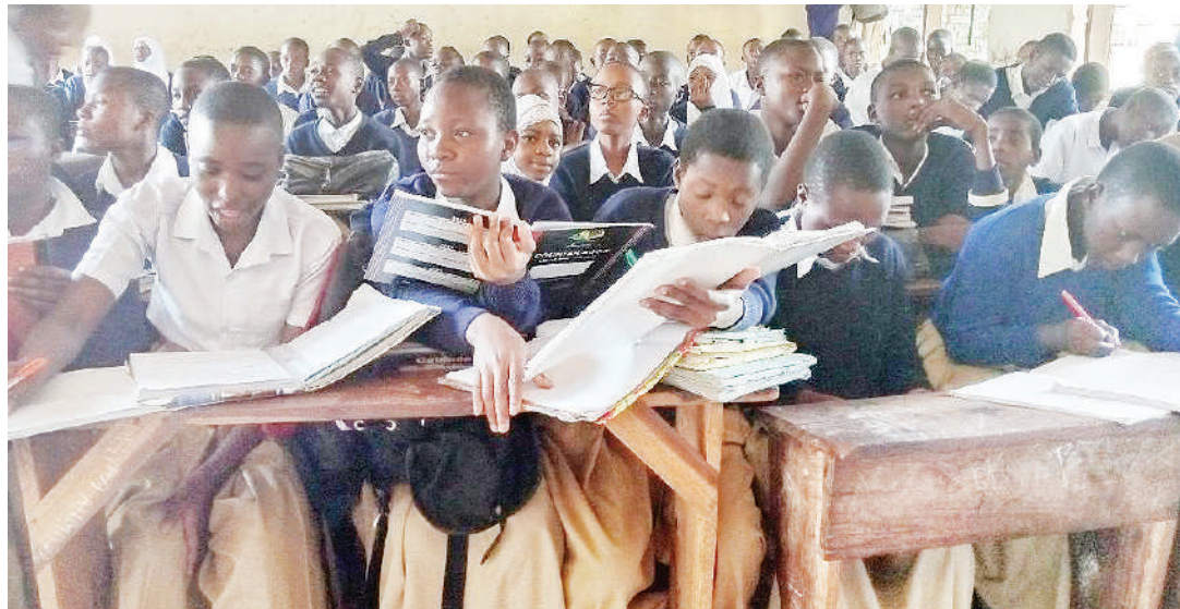
Wanafunzi wa kidato cha pili wakiwa darasani, Manispaa ya Mpanda.

• Wakuu shule wabuni staili yao kuwarejesha