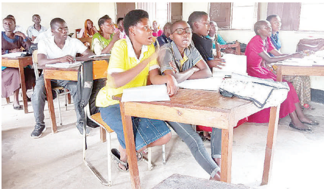
Wanafunzi wa Kituo maalum cha walioacha masomo kwa sababu tofauti, mjini Mpanda.

“Tayari huyo mwanafunzi ameenda pale ameripoti na anaendelea na masomo, lakini taarifa za huyo mwanafunzi mzazi alikuja na tukamwambia aende Polisi,” anasema, akimtakia