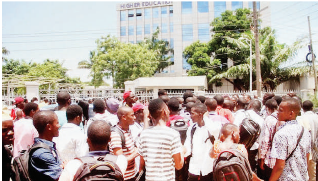
Wanafunzi wa elimu ya juu katika moja ya nyendo za kushinikiza kupatiwa fedha za mikopo.

• Ilianza kuhudumia 20,000 sasa wako 70,000