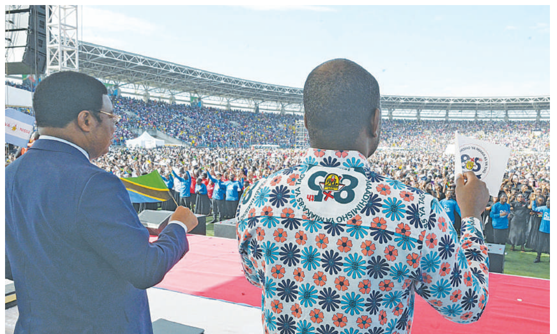
Waziri Mkuu, Kassim Majaliwa, akisikiliza wimbo wa kuabudu wakati alipomwakilisha Rais Samia Suluhu Hassan katika Maadhimisho ya Miaka 85 ya Kanisa la Tanzania Assemblies of God (TAG) Uwanja wa Uhuru jijini Dar es Salaam jana.