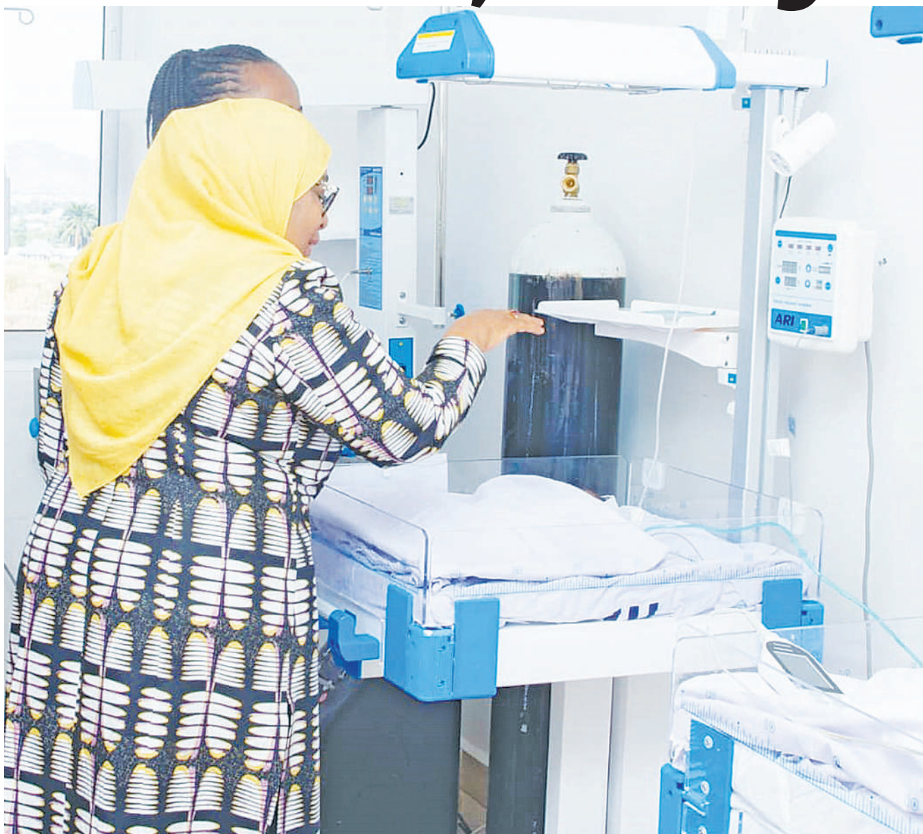
Rais Samia Suluhu Hassan akiangalia watoto njiti waliowekwa katika chumba maalum ili wakue na kuimarika alipotembelea Hospitali ya Rufani ya Mkoa wa Katavi jana.