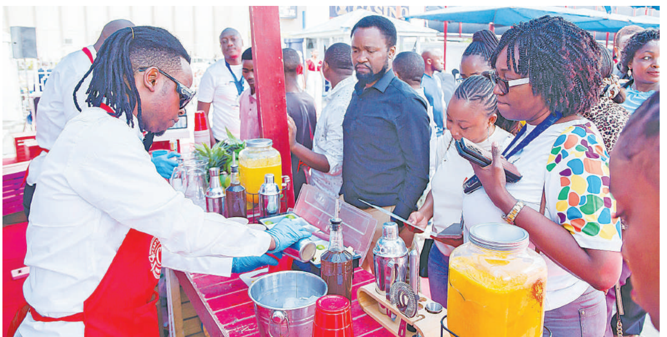
Baadhi ya wageni waalikwa wakipata vinywaji mbalimbali kutoka kwa wahudumu wakati wa hafla ya utambulisho wa jezi zitakazotumika kwenye mbio za Dodoma Marathon 2024 jijini Dar es Salaam jana. Mbio hizo zitafanyika jijini Dodoma Julai 28.

Aidha, aliwashukuru wadau mbalimbali yakiwamo mashirika na kampuni zilizoshiriki kufanikisha mbio hizo.