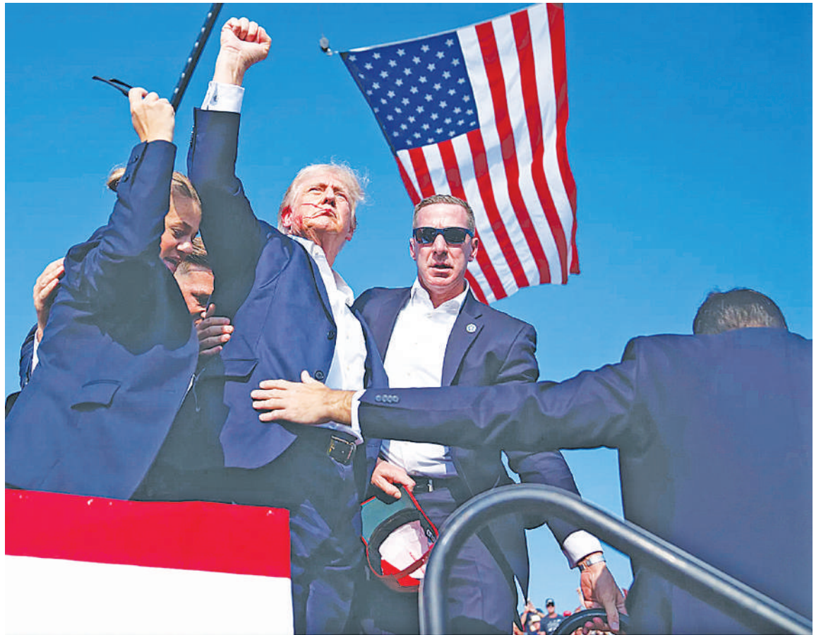
Aliyekuwa Rais wa zamani wa Marekani, Donald Trump, akilindwa na maafisa wa Idara ya ujasusi wa taifa hilo baada ya shambulio la risasi dhidi yake juji.

Tume ya haki za binadamu ya Kenya, asasi isiyo ya kiserikali, ilisema ilikuwa pia inahimiza uchunguzi wa kina ufanyike kubaini chanzo cha vifo hivyo na kuwatambua waliohusika.