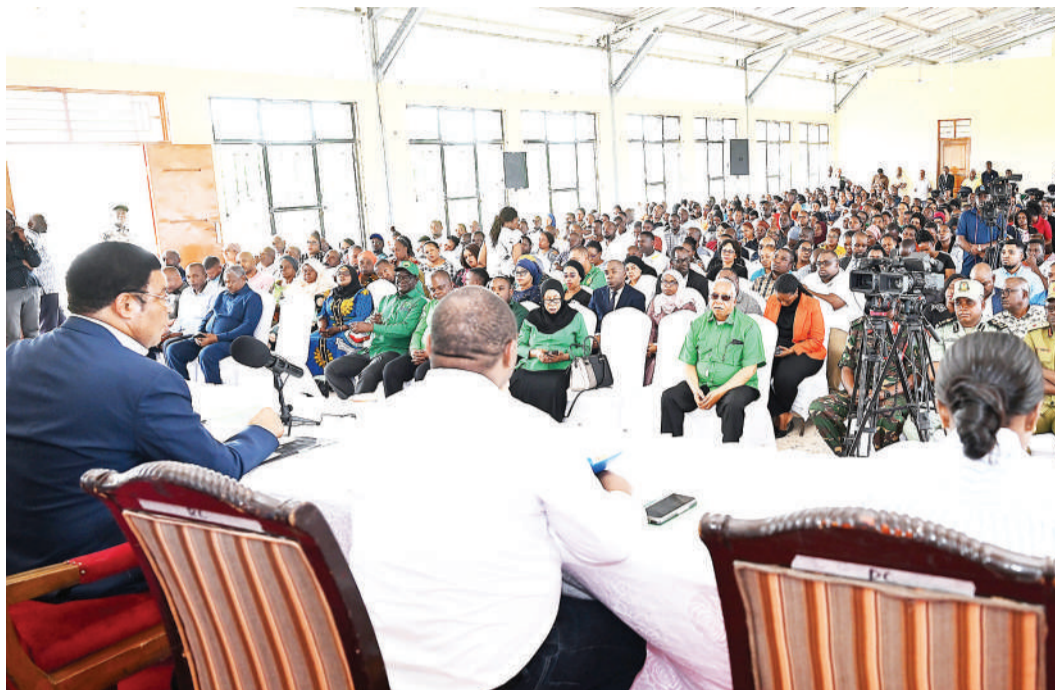
Waziri Mkuu, Kassim Majaliwa (kushoto), akizungumza na watumishi wilayani Kigamboni kwenye ukumbi wa Chuo cha Maendeleo ya Wananchi, jana ikiwa ni ziara yake ya kikazi mkoani Dar es Salaam.

Wote kwa pamoja walikuwa wanakabiliwa na mashtaka ya kubaka kwa kundi na kumwingilia kinyume cha maumbile binti wa Yombo Dovya, jijini Dar es Salaam aliyetambulishwa kwa jina la XY.