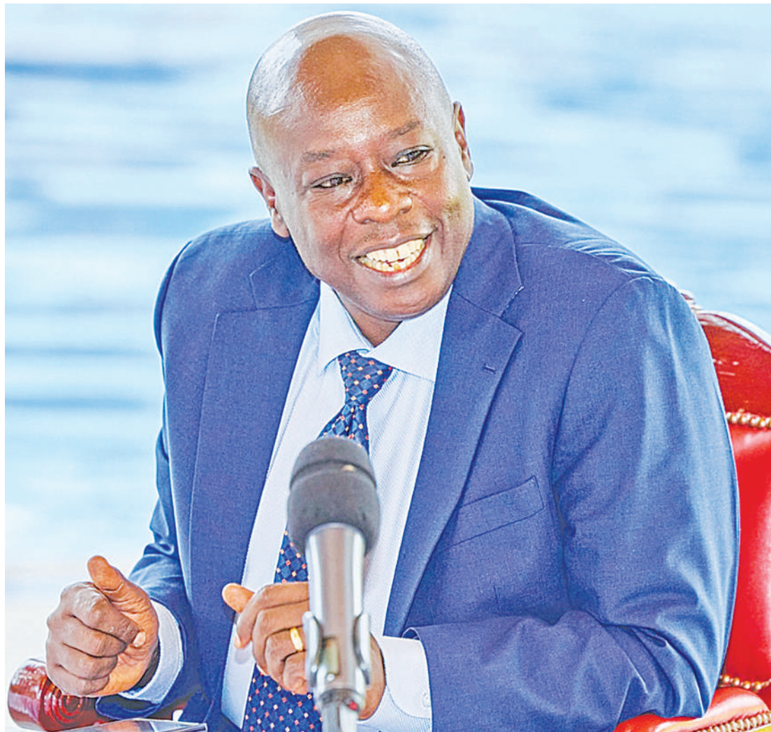
Naibu Rais wa Kenya, Rigathi Gachagua.

Mtu mmoja alisema kitendo cha kumshtaki mmoja wao hakutakuwa na maana, kwani