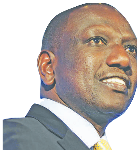
Rais William Ruto,

taka Gachagua kuomba msamaha kutoka kwa Rais William Ruto ili kutatua tofauti zozote baina yao.