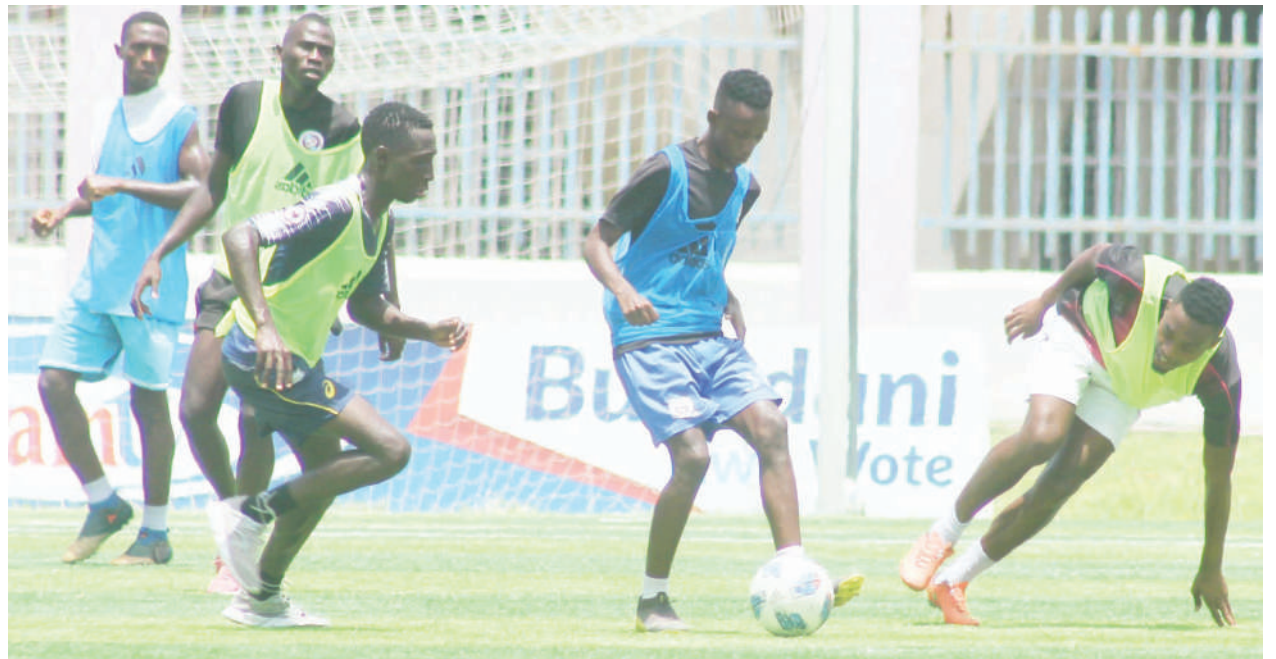
Wachezaji wa timu ya African Lyon, wakifanya mazoezi katika Uwanja wa Uhuru jijini Dar es Salaam jana kujiandaa na mchezo wa Ligi Daraja la Kwanza dhidi ya Mbeya Kwanza unaotarajiwa kucheza Jumamosi wiki hii.