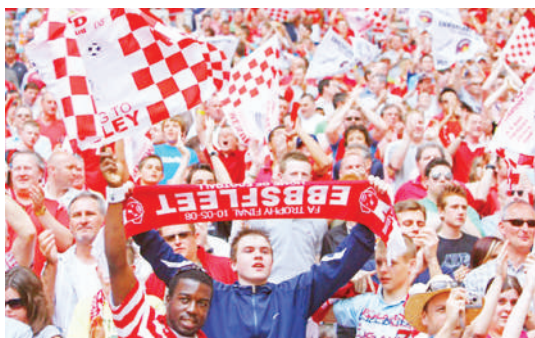
Mashabiki waliotekwa na mechi uwanjani.