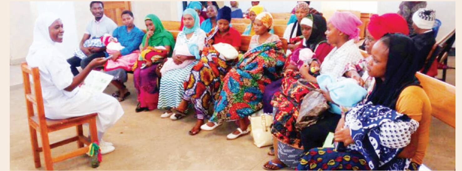
Kinamama wa Arusha wakipata huduma za kliniki ya wazazi.