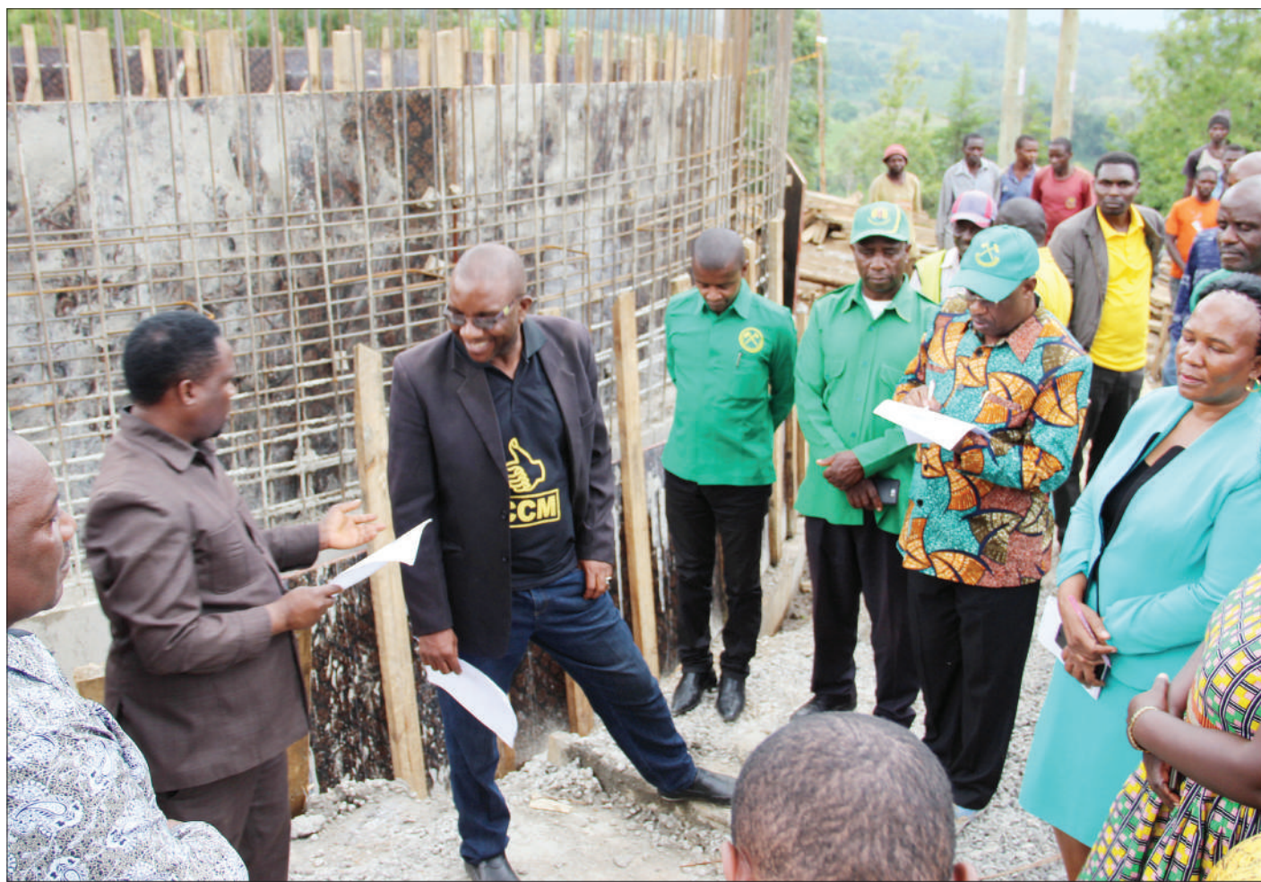
Wajumbe wa Kamati ya Siasa ya Chama Cha Mapinduzi (CCM), mkoa wa Mbeya, wakikagua mradi wa maji katika Halmashauri ya Busokelo, wilayani Rungwa, hivi karibuni.

Alisema NHC limekuwa likiwaanzia na kuwapangisha wananchi nyumba kwa bei ya chini kwa lengo la kukidhi mahitaji ya Watanzania kupanga katika shirika ambalo lipo nchini la serikali.