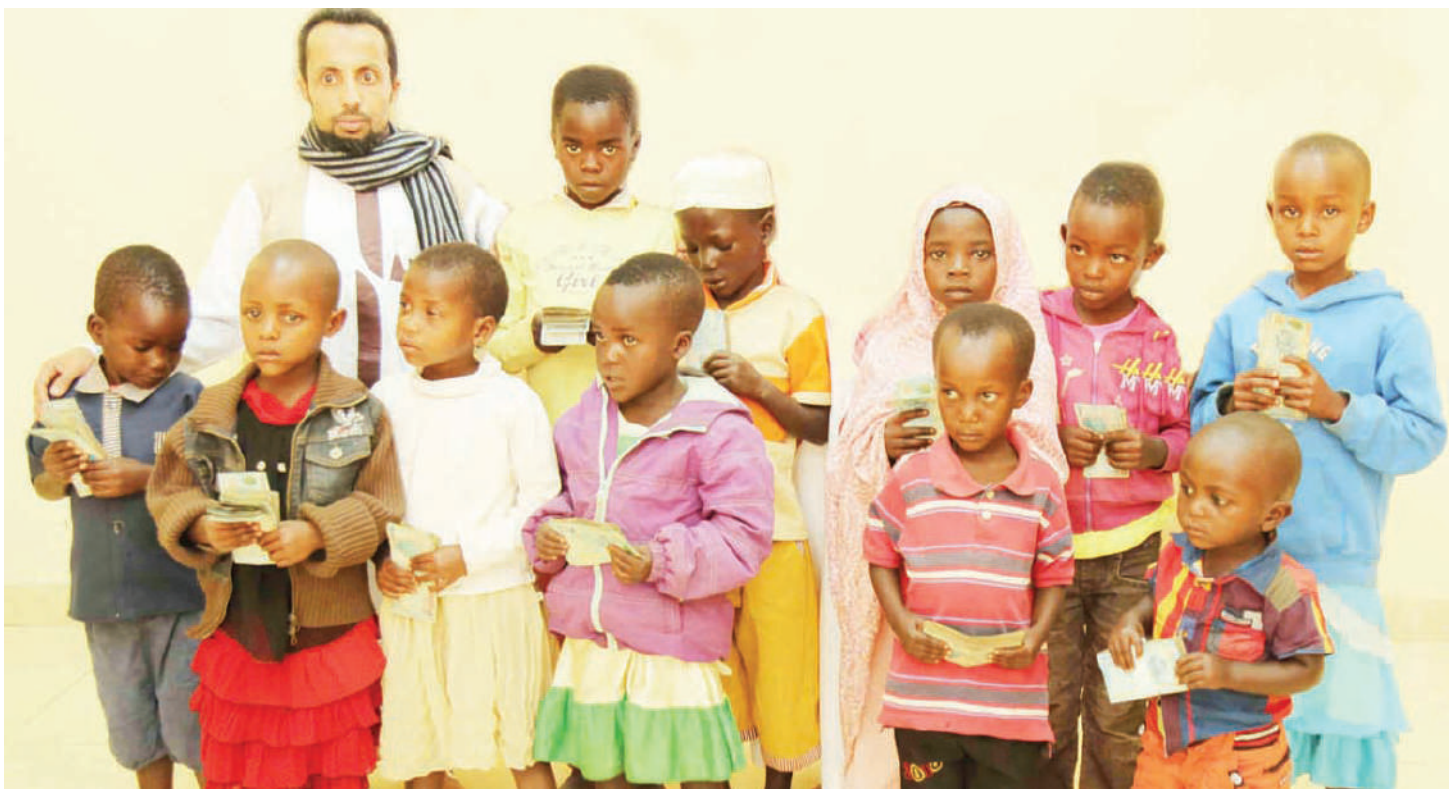
Watoto waliopo katika hatua za makuzi, ambao lishe bora ni sehemu ya hitaji muhimu.

• Kiwango afya duni kushushwa • Wazazi nao kuan-gukia afya njema • Ubia na wazalishaji mafuta kula