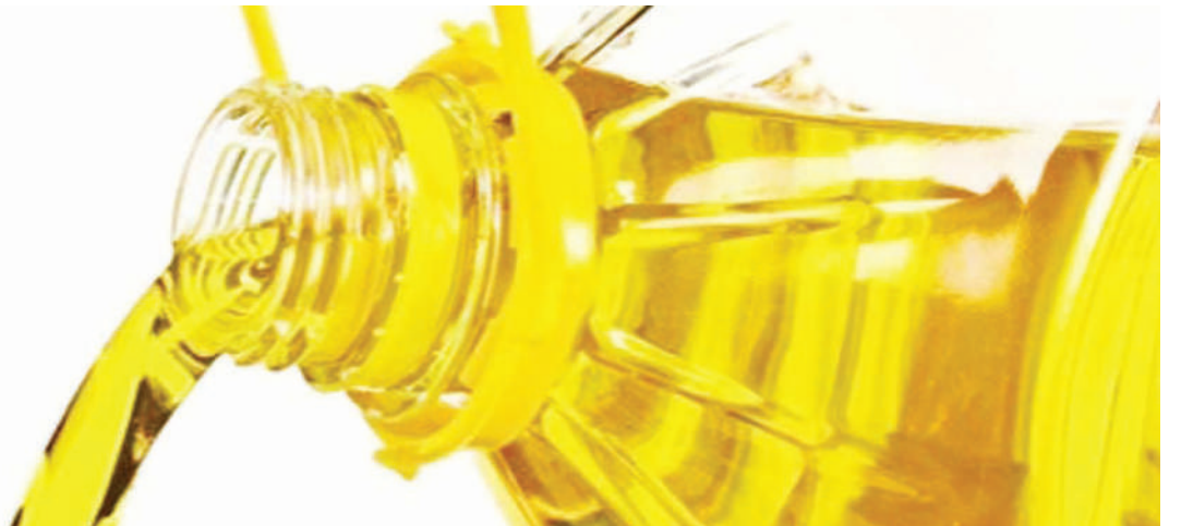
Mafuta ya kula, ambayo sasa yanafanyiwa mpango toka kiwandani kuwa na virutubusho.

Baada ya kufanyika tathmini, ilibainika sekta ya afya inachangia asilimia 20 katika kukabiliana na tatizo ya lishe, wakati sekta nyinginezo zinachangia asilimia 80.