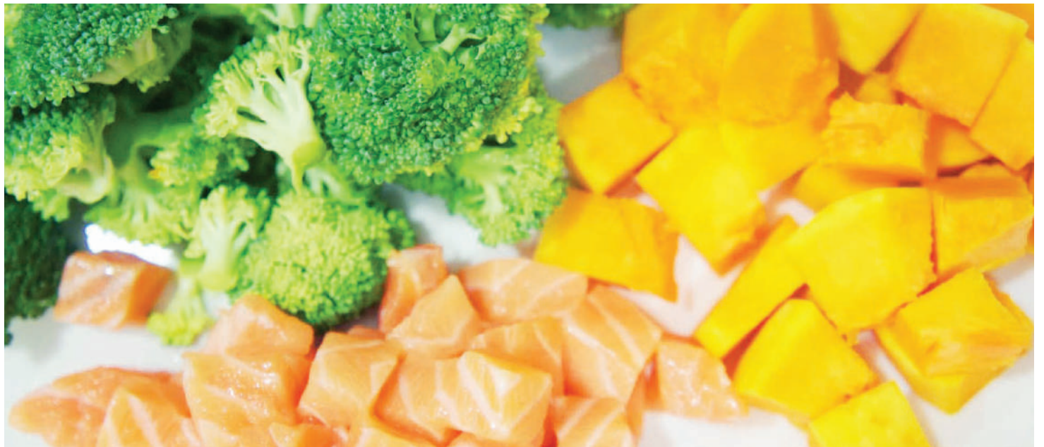
Baadhi ya mahitaji muhimu katika lishe ya mtoto.

Anasema, wameendelea kusimamia utekelezaji wa Programu ya Mwezi wa Afya na Lishe ya Mtoto (CHNM), kwa kufanya maboresho ya kuongeza kipengele cha ufuatiliaji maendeleo ya mtoto katika vituo vya kutoa huduma za