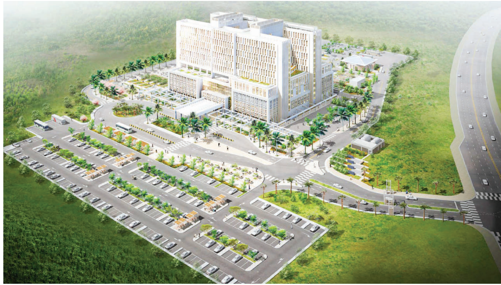
Mandhari ya Hospitali ya Taifa Muhimbili -Mloganzila. PICHA ZOTE: MTANDAO.

Wengi hawajitokezi kiasi cha kushindwa kujihudumia kwa lolote,