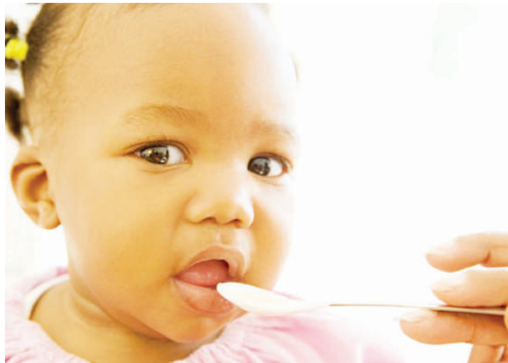
Mtoto akiilishwa.