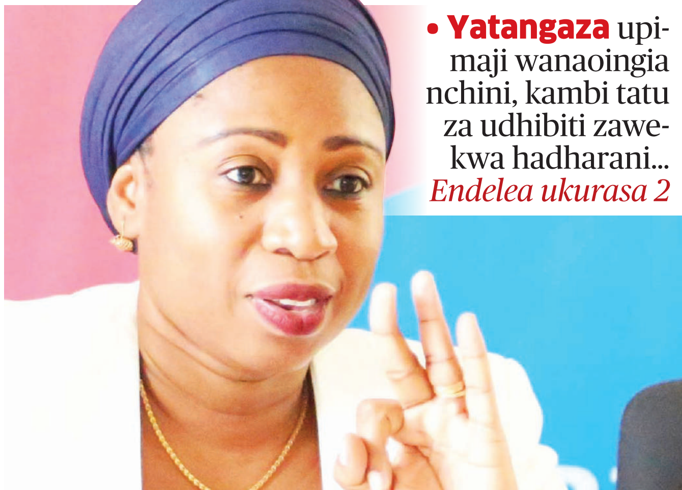
Waziri wa Afya, Maendeleo ya Jamii, Jinsia, Wazee na Watoto, Umyi Mwalimu.

• Yatangaza upimaji wanaoingia nchini, kambi tatu za udhibiti zawe kwa hadharani... Endelea ukurasa 2