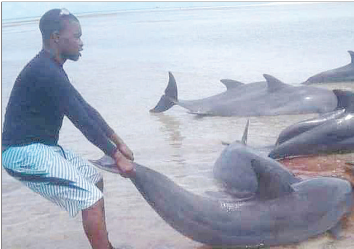
Mtumishi wa kampuni ya utalii ya Coastal Fanjove Ltd, inayojihusisha na shughuli za utalii katika Kisiwa cha Fanjove, Kata ya Songo Songo, wilayani Kilwa, mkoani Lindi, Kudeme Hakimu, akiwasaidia kuwarejesha baharini samaki sita aina ya Dolphine, waliosukumwa na maji ufukweni juzi.

Kwa mujibu wa Waziri Ummu, dalili za ugonjwa huo huanza kuonekana kati ya siku moja hadi 14 tangu kupata maambukizo.