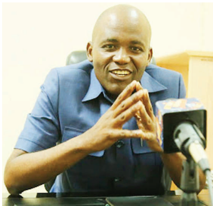
Naibu Waziri, Dk. Faustine Ndugulile.

Kuna haja ya kutoa elimu ili tunusuru ndoa hizi, kwa sababu mimi kama mshauri, naletewa matatizo makubwa zaidi na wanawake wanafanya hivyo wakiogopa kupelelewa talaka.