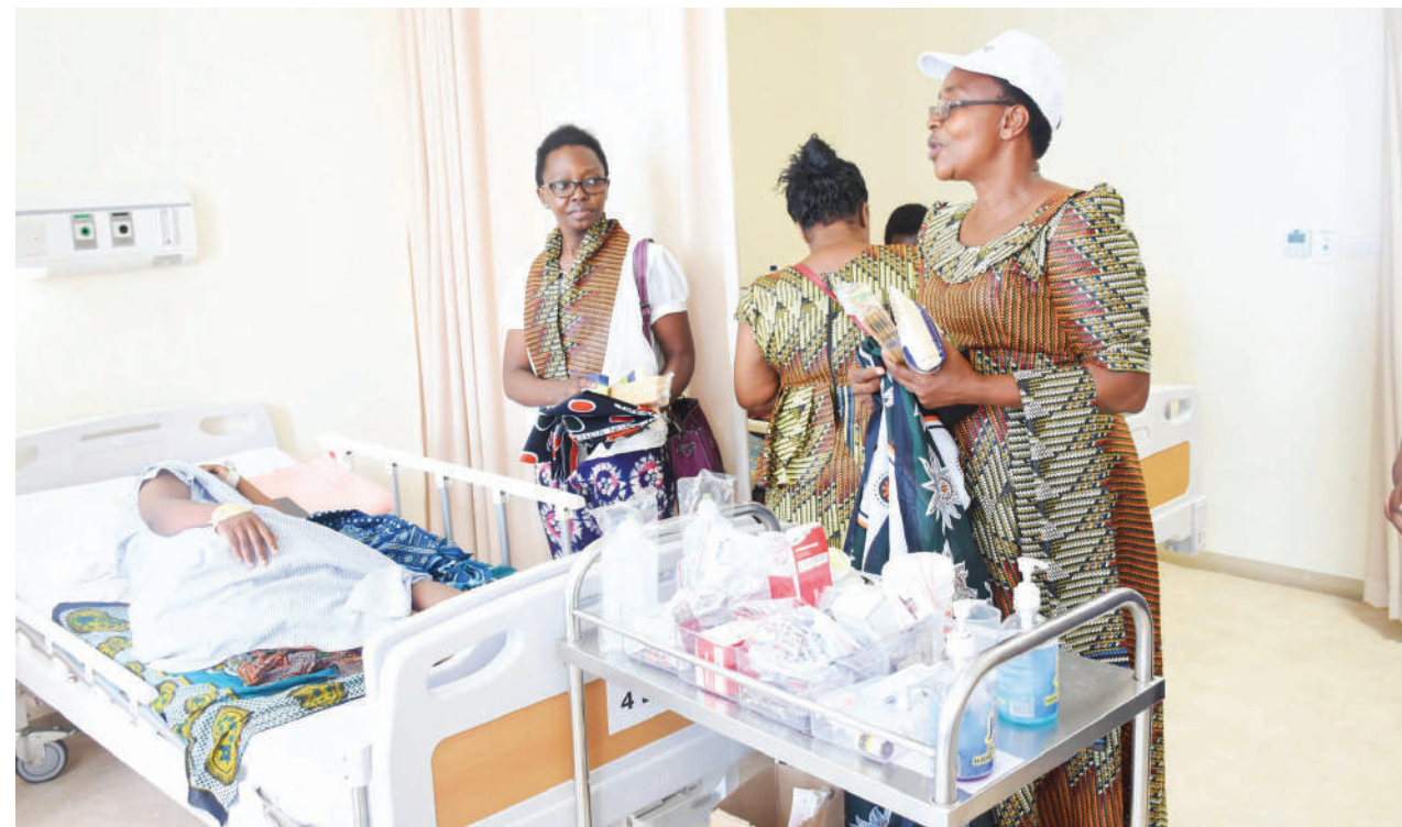
Sehemu ya wodini Mloganzila.

Vilevile katika kipindi cha Julai hadi Septemba 2019 MNH Upanga ililaza wagonjwa 17,230 na kati ya hao vifo vilikua 1,673 ambayo ni asilimia 9.7.