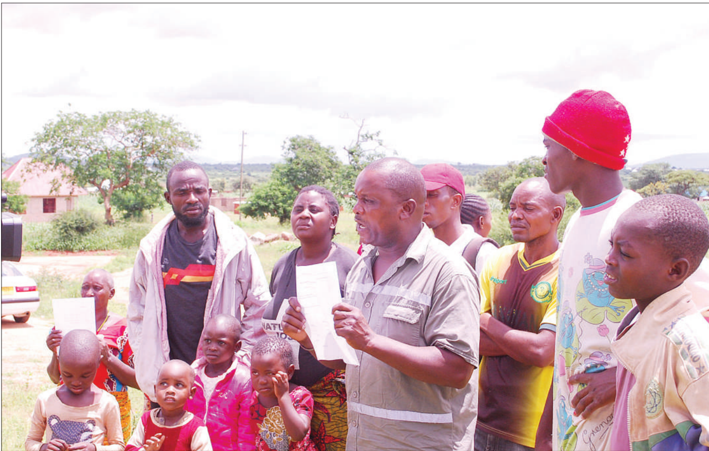
Wakazi wa Mtaa wa Vikonje 'B', Kata ya Mtumba, jijini Dodoma, wakizungumza na waandishi wa habari jana, wakiwalalamikia viongozi wa kata hiyo kwa kutaka kuwaondoa kwenye maeneo wanayoishi kupisha mradi wa ujenzi wa nyumba za serikali.

Pamoja na kuambiwa juu ya jengo kutokamilika, alisema alishangaa alipofika kuona limekamilika na kuanza kuamini kuwa taarifa hizo zilikuwa majungu ya watu wenye kutamani vyeo vya wengine kwa kupandikiza maneno ya uongo.