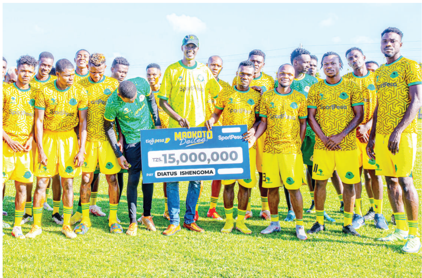
Mshindi wa 'Promotion' ya Maokoto Deilee kutoka SportPesa na tigo Pesa akikabidhiwa mfano wa hundi ya Sh. milioni 15 na wachezaji wa Yanga, jijini Dar es Salaam wiki iliyopita.

Kikosi cha Singida Fountain Gate FC kimeweka kambi ya siku nne Mtwara na Ijumaa hii kitafunga safari kuelekea Lindi kukabiliana na wenyeji wao, Namungo FC, katika Uwanja wa Majaliwa, uliopo Ruangwa.