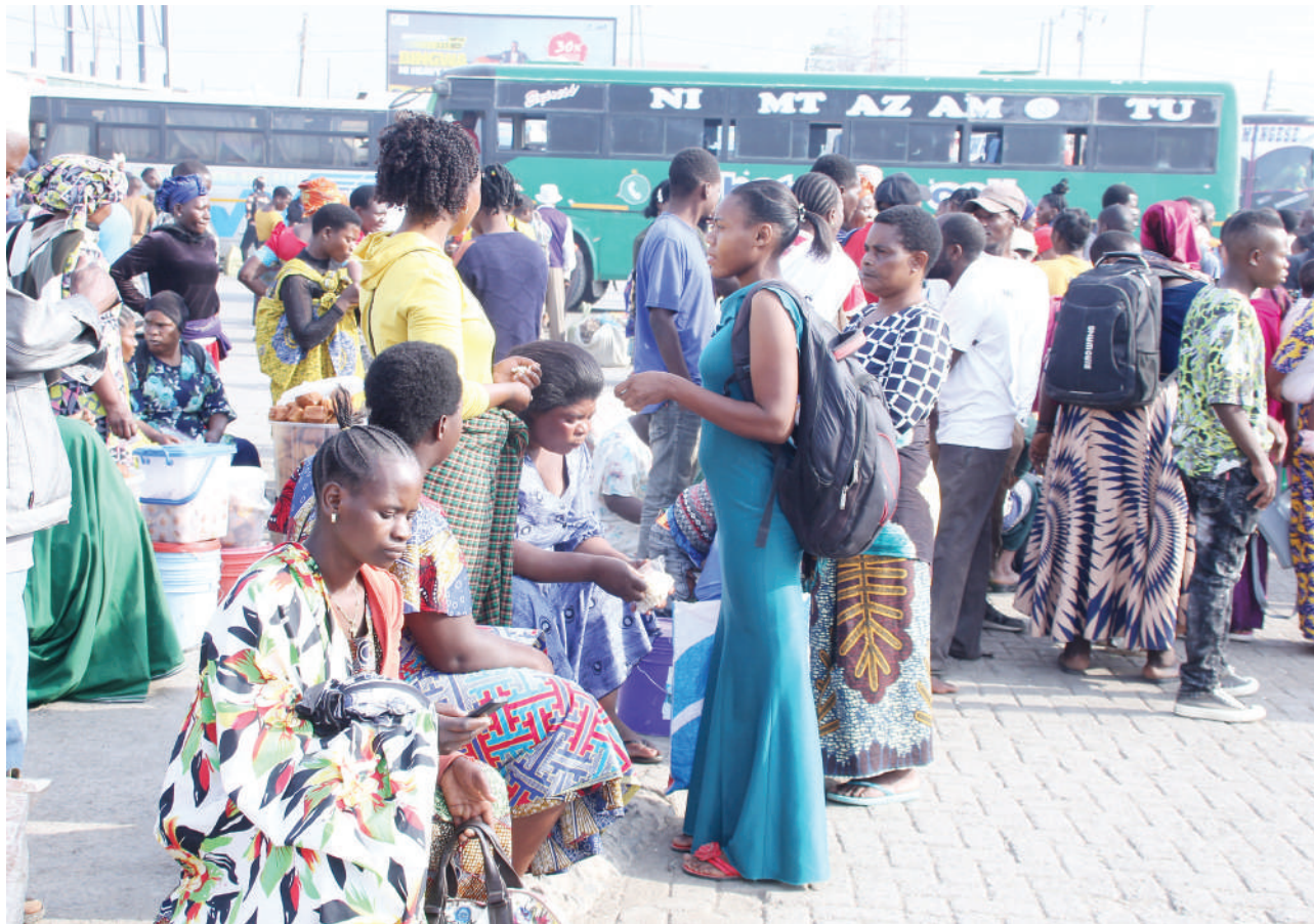
Baadhi ya abiria wakiwa wamekwama katika stendi ya mabasi ya Tarafani Mamlaka ya Mji Mdogo wa Mbalizi jana kutokana na mgomo wa daladala zinazofanya safari zake katikati ya Jiji la Mbeya na wilayani.

Aliagiza mabasi yote kuhakikisha yanatoa tiketi halali kwa abiria huku akiwataka abiria kuhakikisha wanatunza tiketi hizo kama ushahidi na kuziwasilisha kwenye ofisi za mamlaka hiyo ili hatua zichukuliwe.