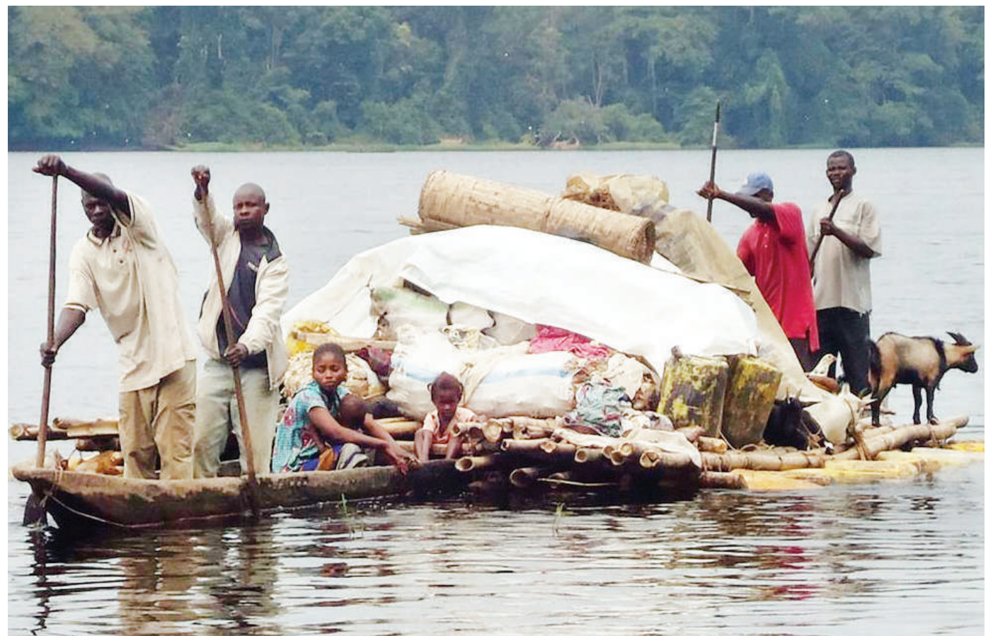
Miongoni mwa safari hatarishi za majini huko nchini DRC.

Maraia wa Uganda na DR-Congo hapo awali wamelalimika kuhusu kulipa ada kubwa ya visa katika vivuko vya mpakani. BBC