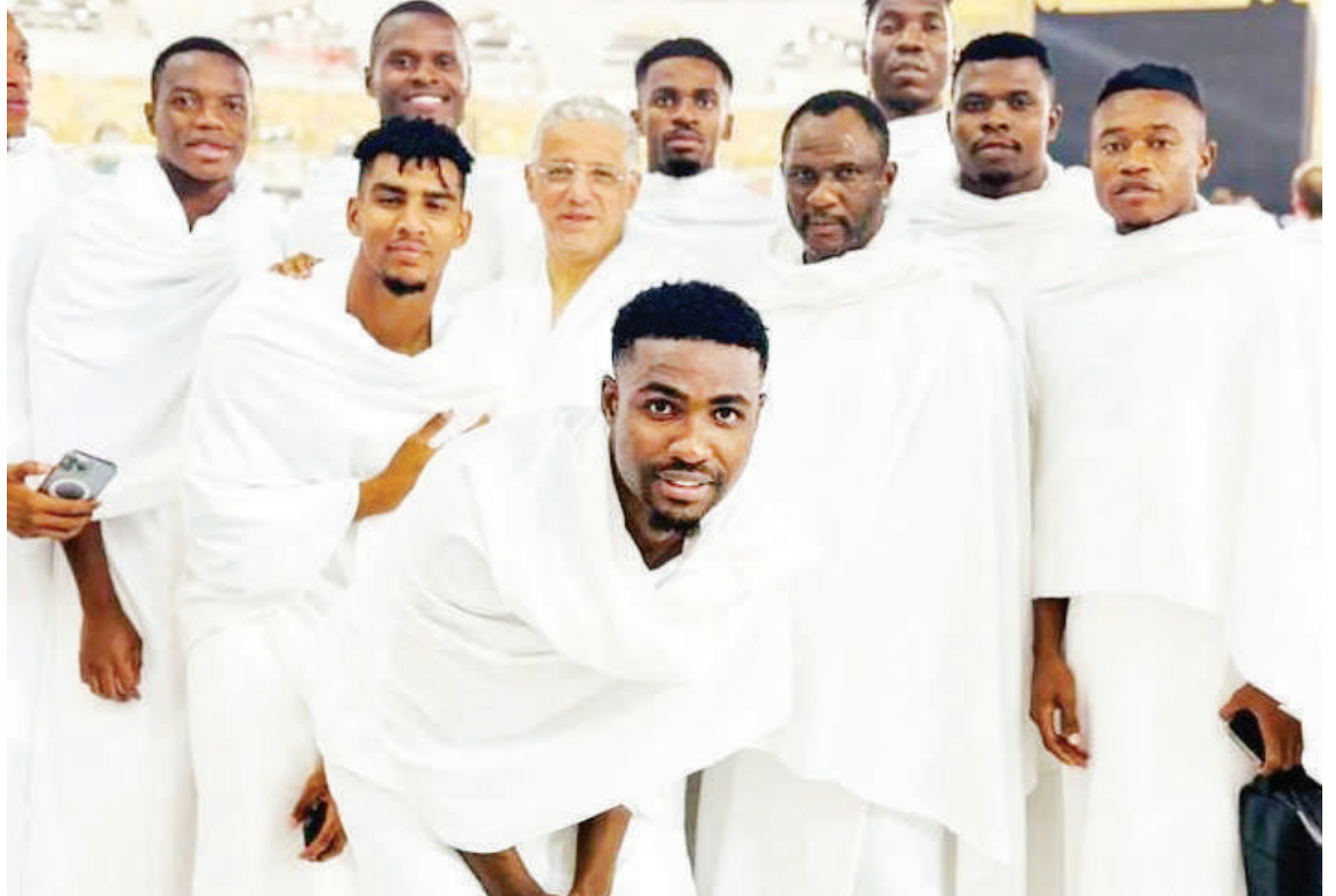
Baadhi ya wachezaji wa Taifa Stars na benchi lake la ufundi, ambao baada ya mechi ya kirafiki dhidi ya Sudan iliyochezwa juzi nchini Saudi Arabia, walienda kufanya ibada katika Msikiti wa Makkah uliopo nchini humo.