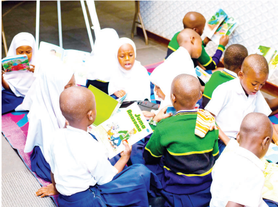
Wanafunzi wakiendelea kufurahia kusoma vitabu mbalimbali vya hadithi mkoani Pwani.

tojua KKK hupunguza ari ya kusoma na kujifunza kwa mtoto, humfanya kuwa na mahudhurio hafifu na hata kuacha chule hivyo kukatisha ndoto zake,” anasema.