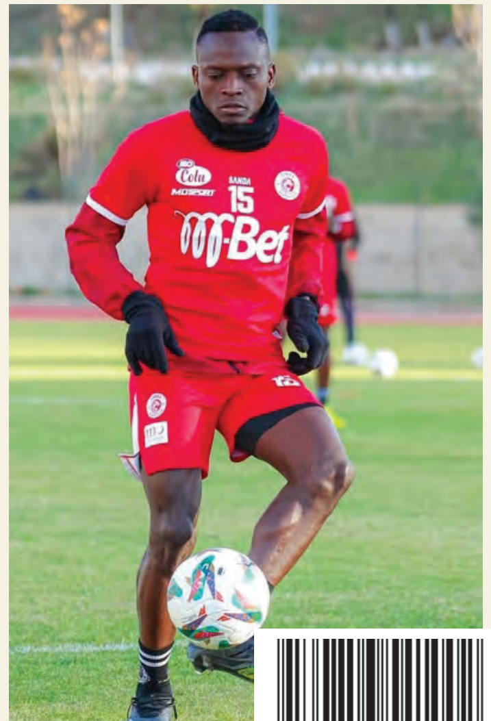
Zimbwe Jr akijifua