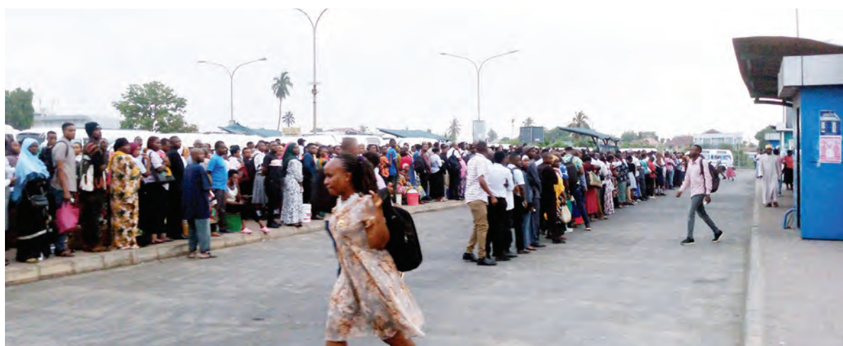
Abiria wa mabasi yaendayo haraka (BRT), wakiwa kwenye foleni kubwa ya kusubiri usafiri huo, katika kituo cha daladala cha Mbezi Mwisho, Manispaa ya Ubungo, Dar es Salaam jana asubuhi. Kwa mujibu wa abiria hao, foleni hiyo inatokana na mabasi hayo kukwama kuingia kituoni hapo, kwa sababu ya msongamano wa daladala.

Kwa maoni: +255 677 020 701 Email: customerrelations@guardian.co.tz