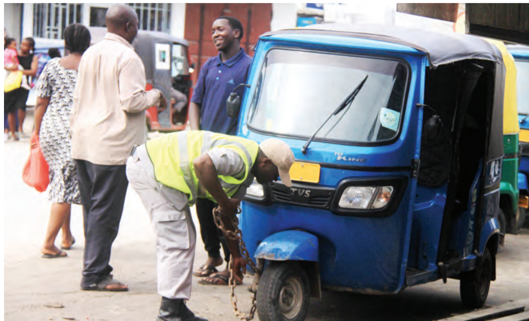
Askari mgambo ambaye ni mlinzi wa Kituo cha Bajaji cha Kitunda, Jijini Dar es Salaam, akiifunga moja ya bajaji iliyokuwa imeegeshwa kwa kukiuka taratibu katika kituo hicho, juzi.

Balozi Young akiteuliwa kuwa Balozi wa Uingereza nchini Tanzania Agosti, mwaka huu.