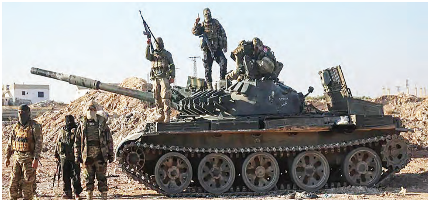
Waasi wa Syria wakiwa kwenye viunga vya mji wa Homs jana baada ya wanajeshi wa serikali kuondoka.