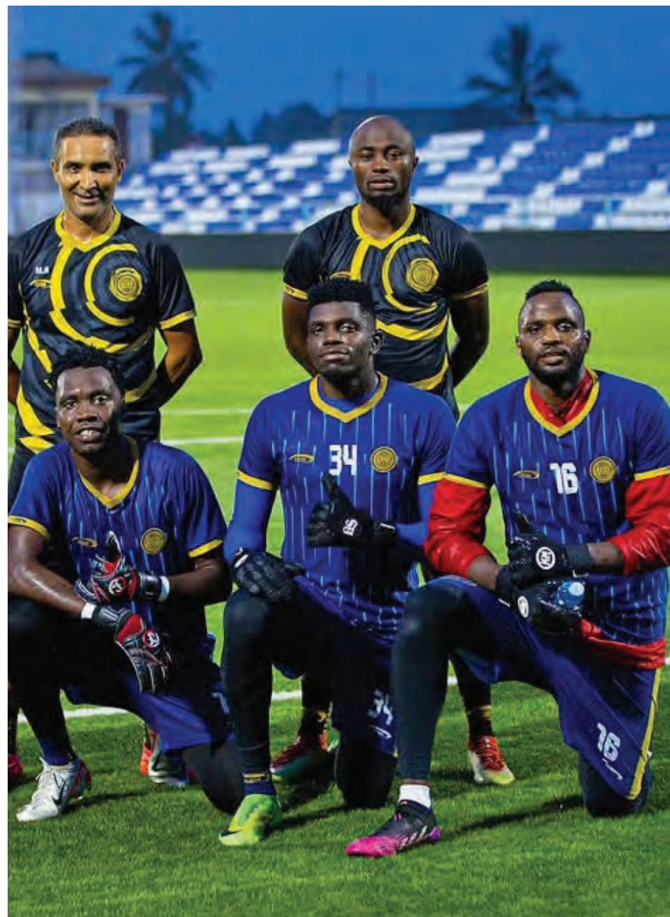
Magolikipa wa Azam FC (waliopiga magoti), wakiwa na makocha wao baada ya kumaliza mazoezi ya kujiandaa na mechi ya raundi ya tatu ya mashindano ya Kombe la FA dhidi ya Iringa Sports itakayochezwa leo kwenye Uwanja wa Azam Complex, Dar es Salaam.

Azam FC itakuwa mwenyeji wa Iringa Sports kwenye Uwanja wa Azam Complex, Coastal Union itavaana na Stand United jijini Arusha huku Kagera Sugar na Rhino Rangers wakichuana kwenye Uwanja wa Kaitaba, Bukoba na Dodoma Jiji itacheza dhidi ya Leo Tena.