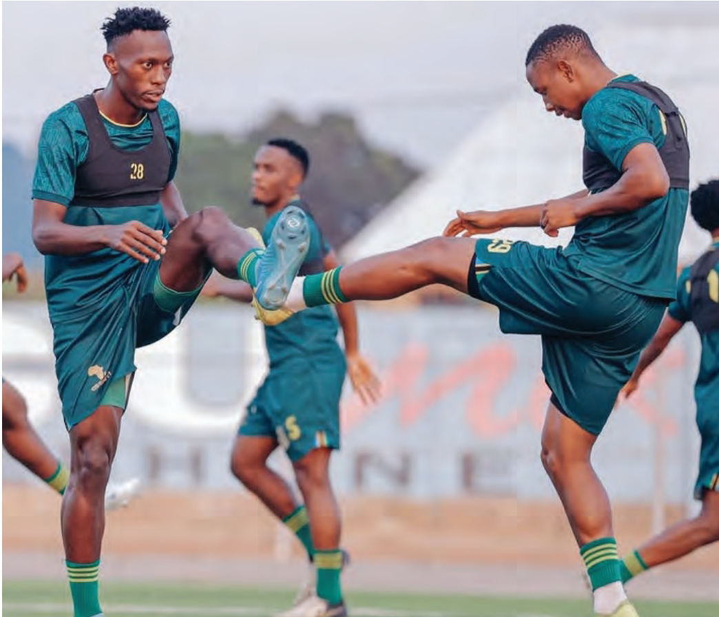
Wachezaji wa Yanga wakifanya mazoezi ili kujiimarisha kabla ya kusafiri kuifuta MC Alger katika mechi ya Kundi A ya mashindano ya kimataifa ya Ligi ya Mabingwa Afrika itakayochezwa leo jijini Algiers, nchini Algeria.