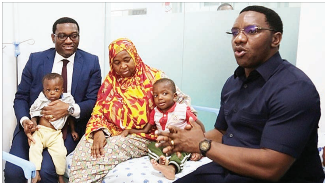
Mkuu wa Mkoa wa Dar es Salaam, Paul Makonda, akizungumza na wazazi wa baadhi ya watoto kati ya 20 wanaotarajiwa kufanyiwa upasuaji wa moyo katika Taasisi ya Moyo ya Jakaya Kikwete (JKCI), jijini Dar es Salaam jana.