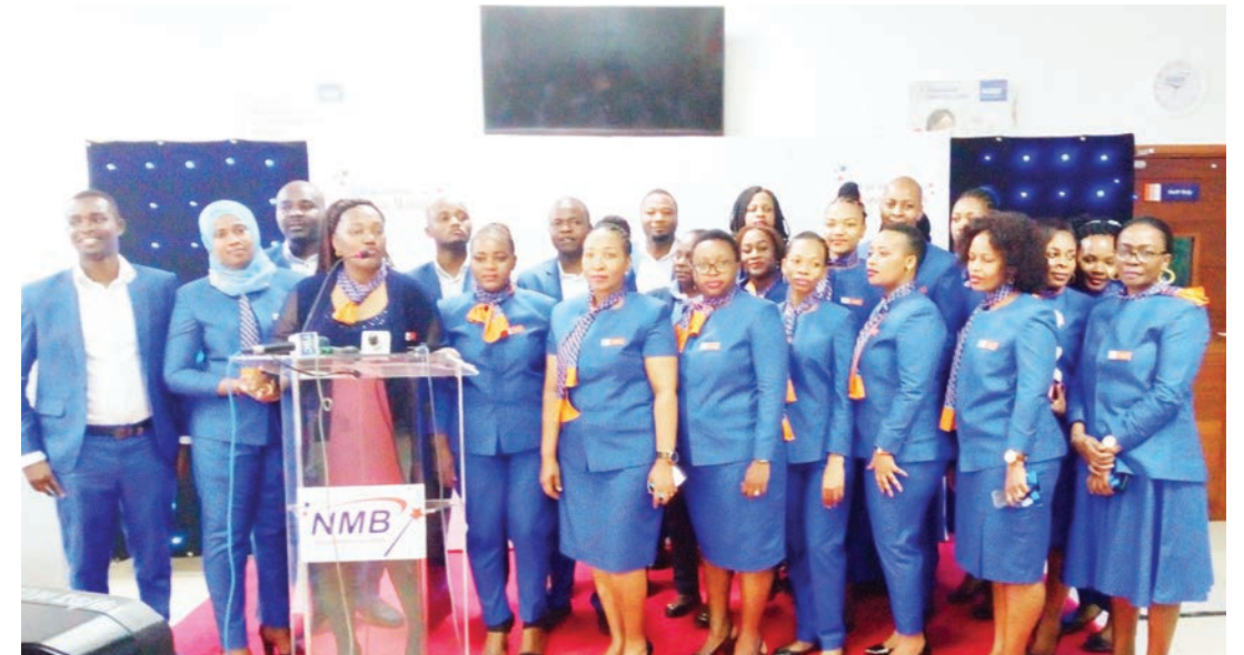
Wafanyakazi wa benki ya NMB, wakipizi kwa picha katika uzinduzi wa wiki ya huduma kwa wateja wa benki hiyo, jijini Dar es Salaam juzi.