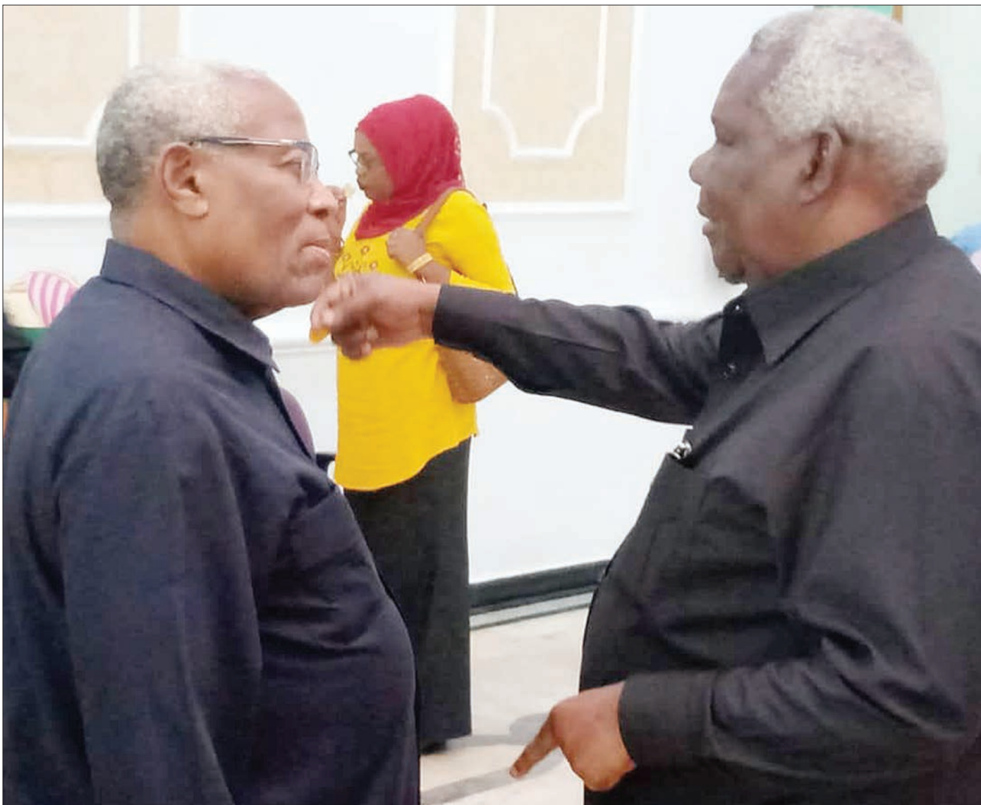
Makamu wa Pili wa Rais Zanzibar, Balozi Seif Ali Iddi (kulia), akizungumza na Waziri wa Fedha na Mipango, Balozi Muhamed Ramia, nje ya ukumbi wa Baraza la Wawakilishi, Chukwani Zanzibar jana.