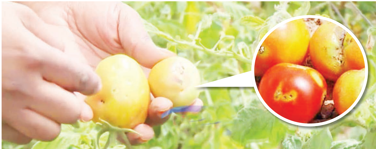
Nyanya zilizoathiriwa shambani na mdudu 'Kantagaze,'