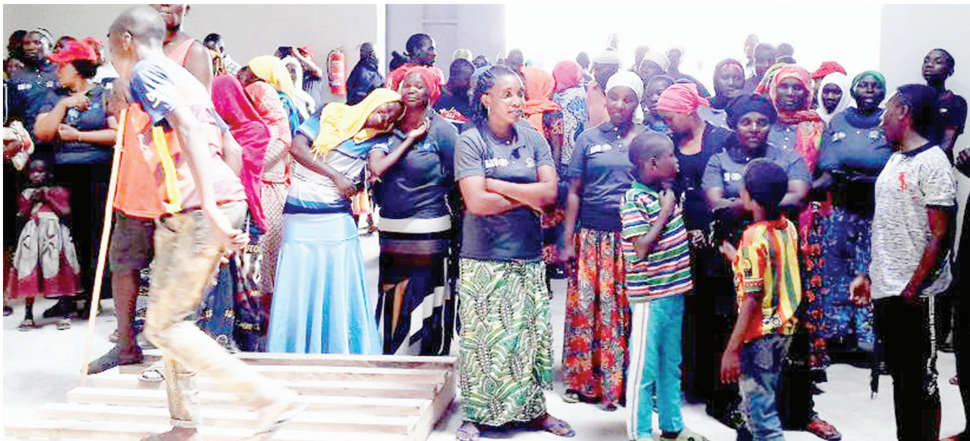
Wakulima na wanavikundi wanaolima mpunga katika kata ya Kilangali, Kilosa wakiangalia ghala la kuhifadhi mpunga, lililofanyiwa ukarabati kupitia mradi wa Ripoma, PICHA ZOTE: ASHTON BALAIKWA, MOROGORO