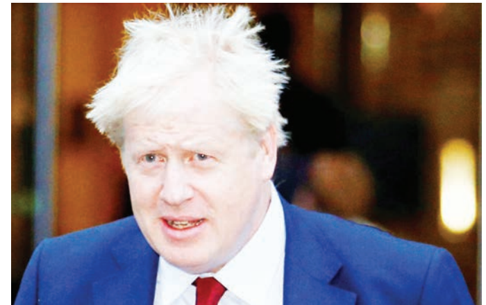
Waziri Mkuu wa Uingereza, Boris Johnson.