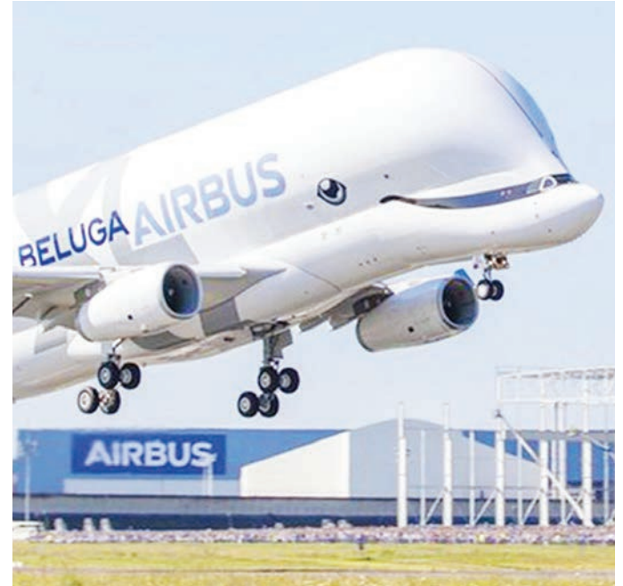
Ndege ya Air Bus, iliyoleta msuguano wa Marekani na Umoja wa Ulaya.