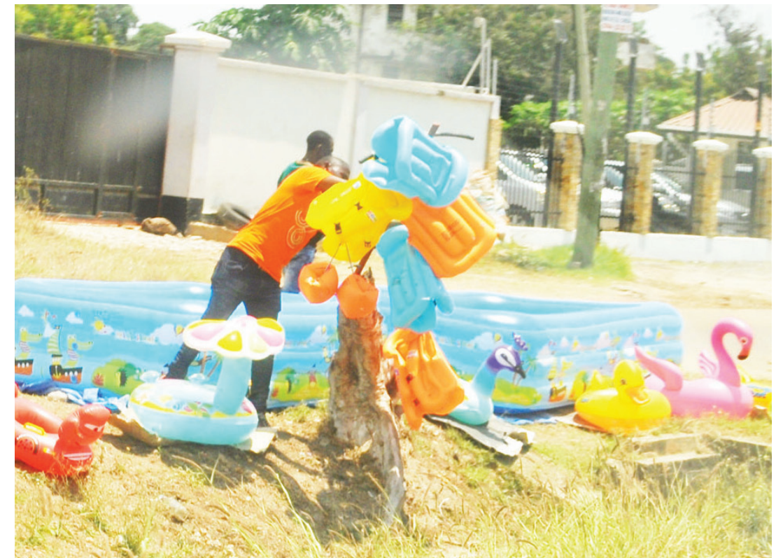
Machinga wakiwa wametandaza bidhaa zao kando ya Barabara ya Bagamoyo, eneo la Sayansi Kiji-tonyama, jijini Dar es Salaam jana.