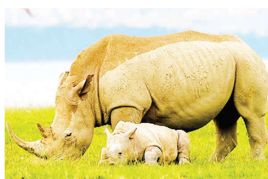
Faru mweupe na mtoto wake wakiwa mbugani.

NDAMA WA FARU Ndama wa faru anapozaliwa mwili wake huwa umefunikwa na manyoya ya kahawia. Man-