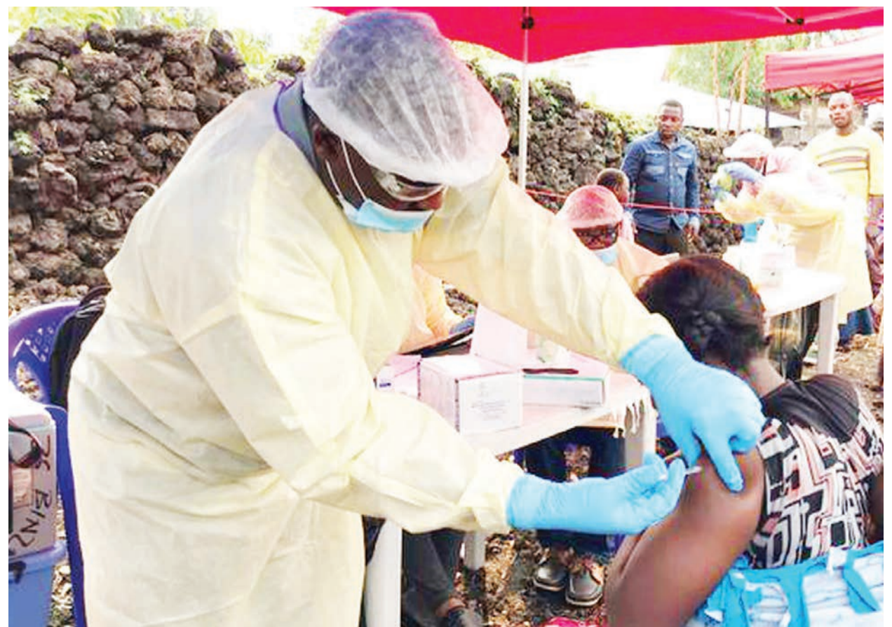
Raia wa Congo akipatiwa chanjo ya ugonjwa wa Ebola.

Kadiri ninavyopata kufahamu mambo mengi zaidi kila siku, ninafikia kuhitimisha kuwa kile kinachofanyika siyo kuniondoa madarakani kisheria bali ni mapinduzi.