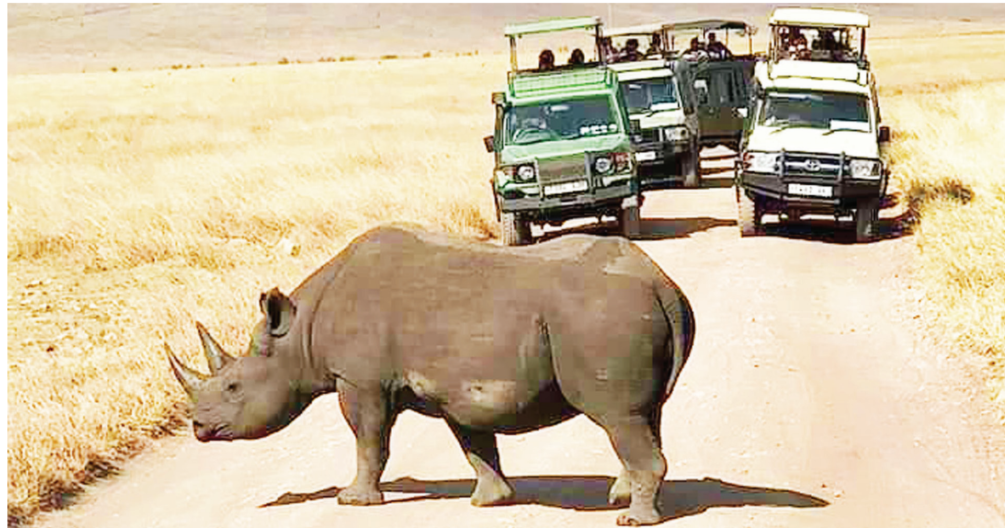
Watalii walioko katika Hifadhi ya Ngorongoro wakimuangalia faru mweusi.

• Miaka 4 hajauawa, ulinzi saa 24 • Watalii wanawapenda kupitiliza