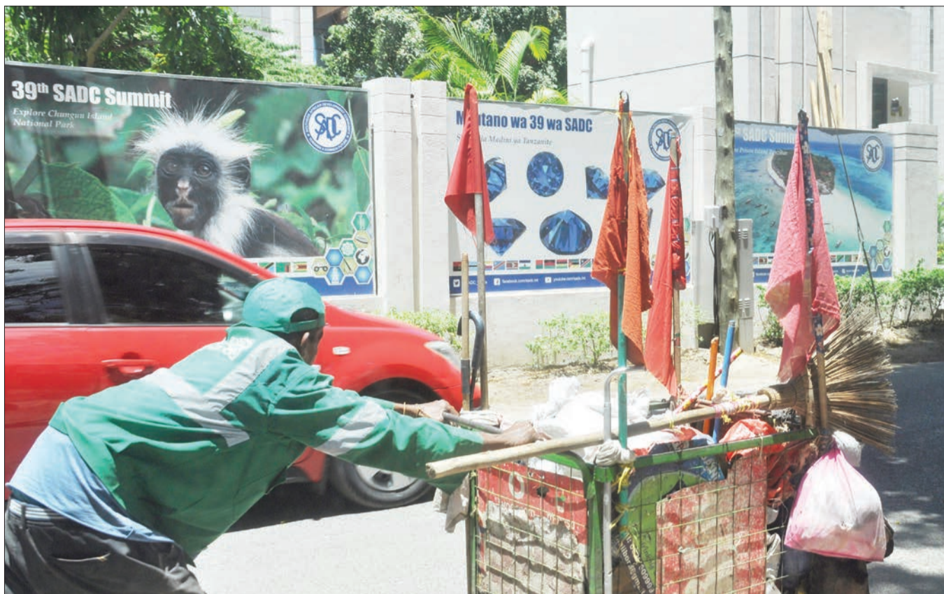
Mfanyausafi akisukuma toroli lililojaa takataka baada ya kusafisha katika Barabara ya Shaaban Robert, Kata ya Kivukoni, jijini Dar es Salaam jana.