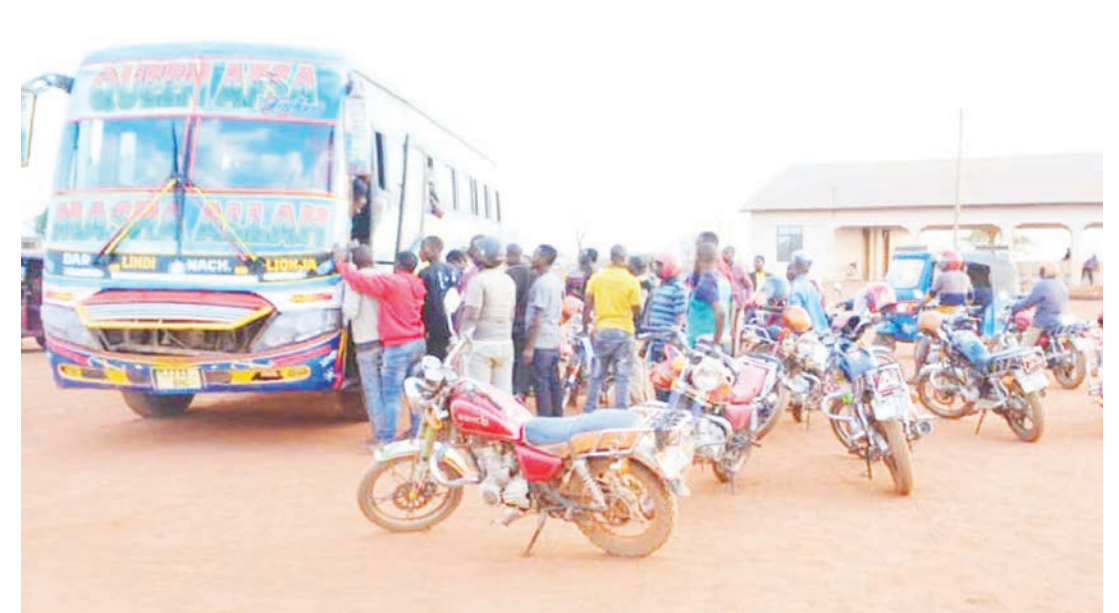
Madereva wa bobaboda wakiwa wameziegesha kwenye stendi mpya ya mjini Nachingwea mkoani Lindi hivi karibuni, wakisubiri abiria wanaoshuka kwenye mabasi ili kuwapeleka maeneo mbalimbali ya mji huo.