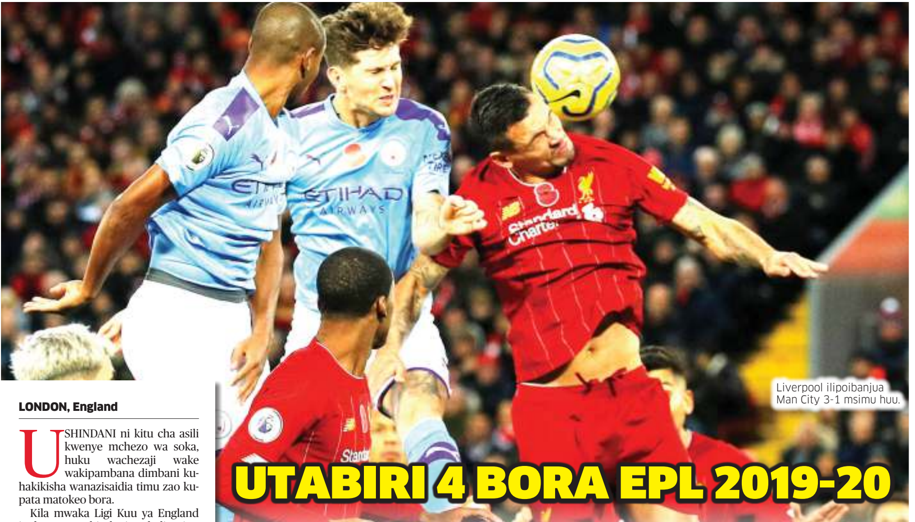
Liverpool ilipoibanjua Man City 3-1 msimu huu.