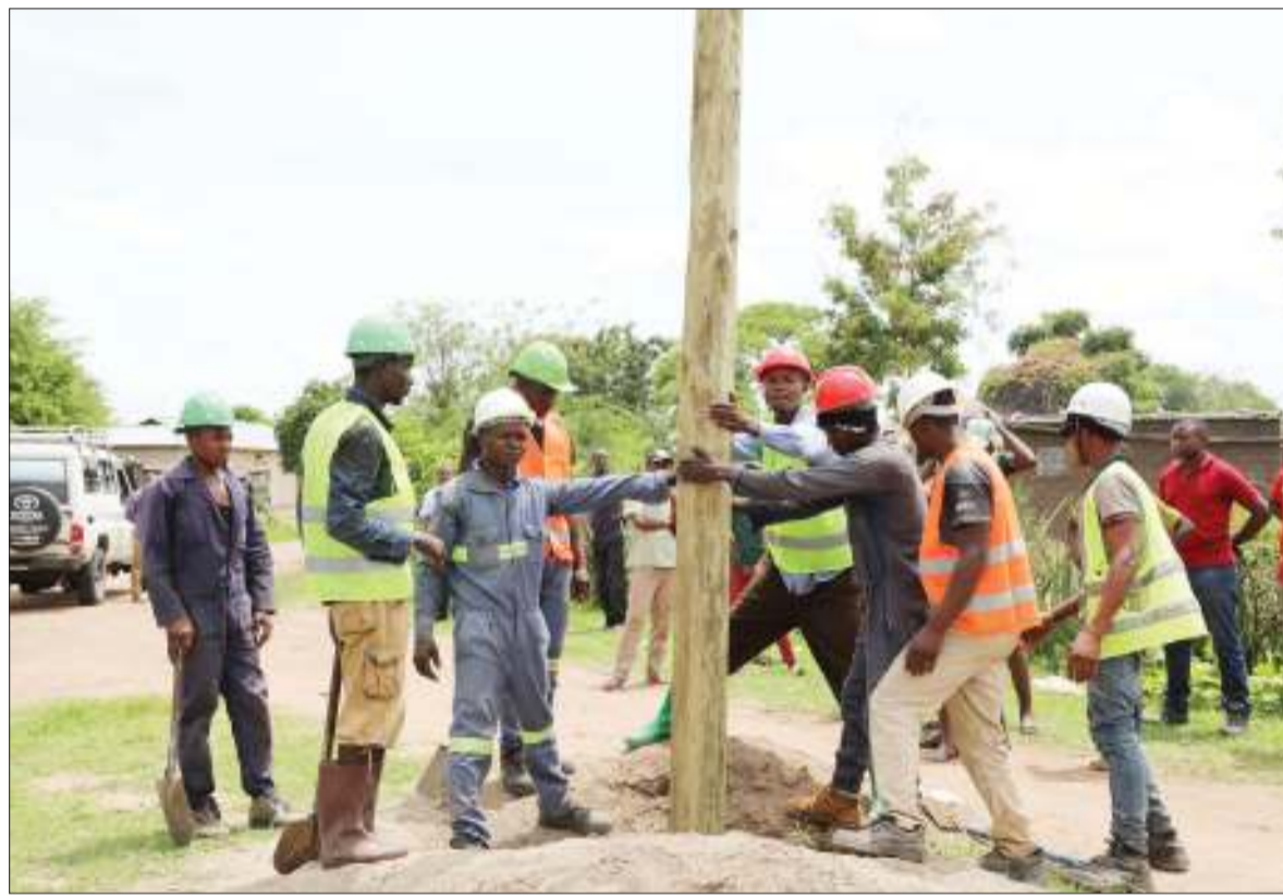
Kazi ya usimikaji nguzo ikifanyika katika Kijiji cha Mwasubuya wilayani Bariadi, Mkoa wa Simiyu kupitia mradi wa usambazaji umeme vijijini wa Awamu ya Tatu, mzunguko wa kwanza (REA III).

Kampeni ya huduma na elimu kwa mlipakodi imemalizika jana na ilifanyika katika mikoa ya Morogoro na Pwani kwa wafanyabiashara kupata fursa ya kutembelewa katika maduka yao na wengine kuhudhuria semina kwa ajili ya kuelimishwa masuala mbalimbali yanayohusu kodi.