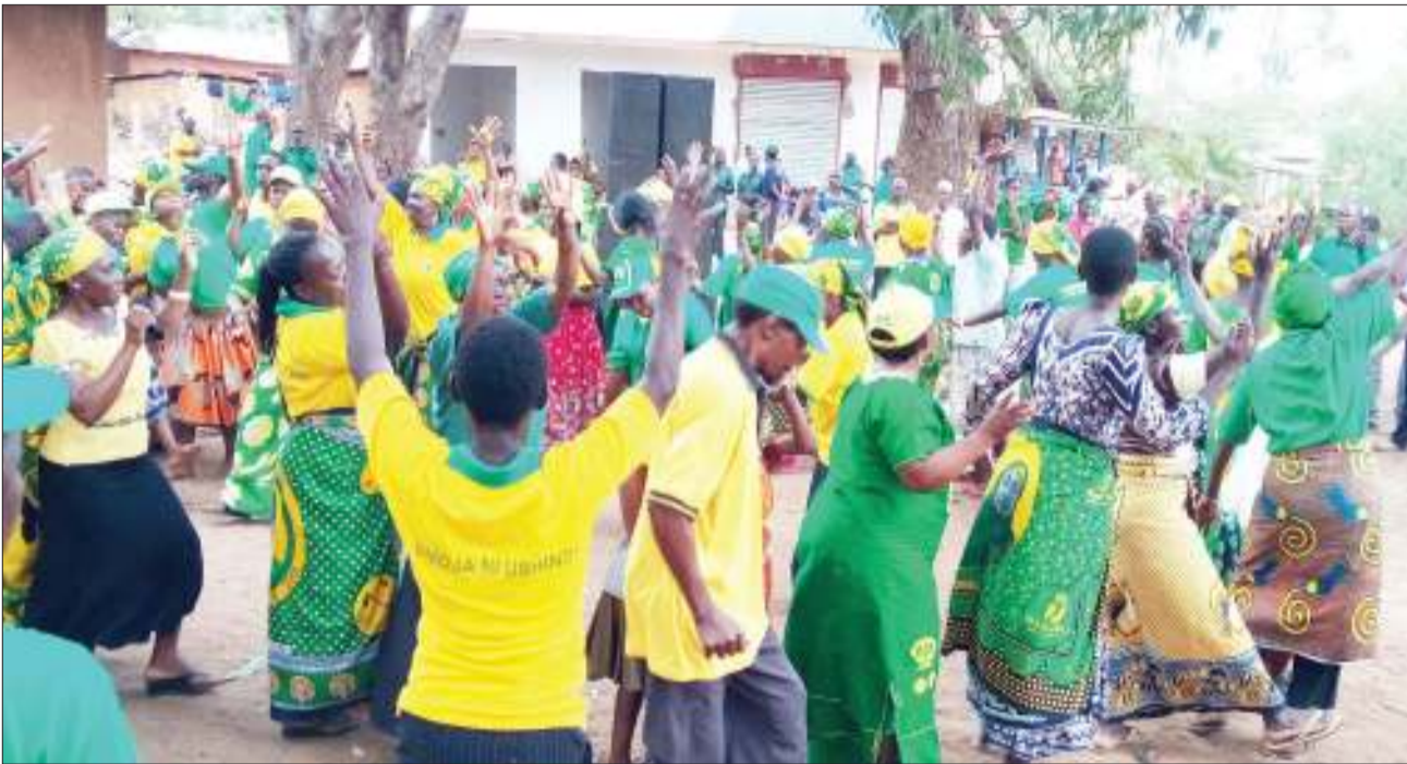
Wanachama wakareketwa wa Chama Cha Mapinduzi (CCM) Wilaya ya Masasi mkoani Mtwara, wakisherehekea uzinduzi wa kampeni za uchaguzi wa serikali za mitaa jana, katika Kata ya Ndanda mjini Masasi.