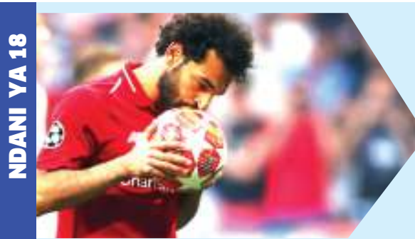
NDANI YA 18

Hata hivyo, Spurs imeonekana kutokuwa kwenye kiwango chake bora tangu kuanza kwa msimu mpya wa ligi hiyo mwaka huu na tayari wamepitwa pointi 10 na Chelsea.