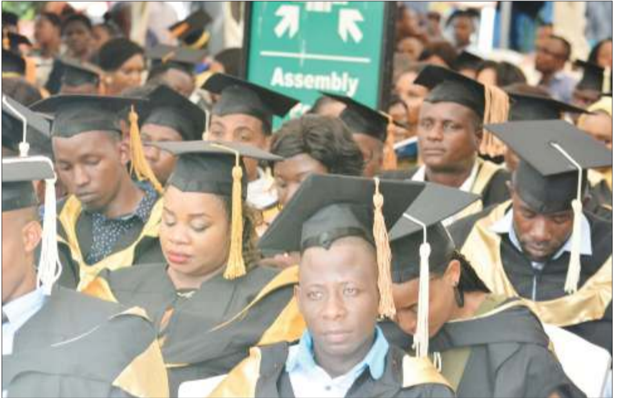
Whitimu wa fani mbalimbali katika Chuo cha Elimu ya Biashara (CBE) Kampasi ya Dar es Salaam wakimsikiliza Naibu Waziri wa Viwanda na Biashara, Mhandisi Stella Manyanya kwenye mahafali ya 54 ya chuo hicho mwishoni mwa wiki.

Alisema fedha hizo zinatokana na mrahaba kwa serikali pamoja na ada ya ukaguzi kwa kipindi cha miaka sita 2014 hadi 2019, hali inayoonyesha Wilaya ya Same ina madini mengi ya vito na ‘metal’.