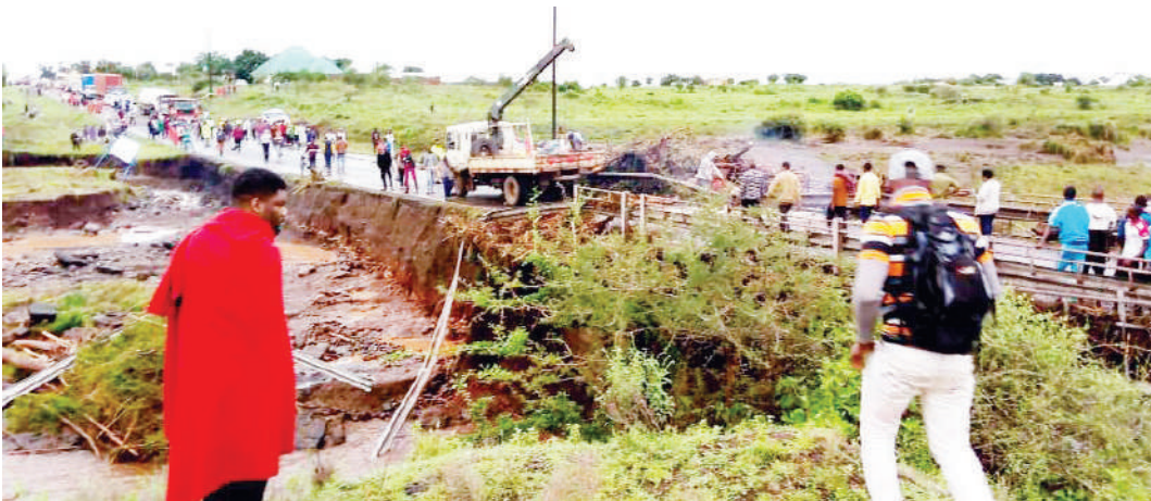
Moja ya gari la Wakala wa Barabara (TANROADS) likitumika kuondoa magogo makubwa yaliyojaa juu ya daraja la Mto Sanya, linalotenganisha Wilaya za Hai na Siha, mkoa wa Kilimanjaro jana, katika barabara kuu ya Moshi-Arusha iliyofungwa kwa muda na serikali ili kuepusha maafa yasiitokee, baada ya mvua kubwa iliyonyesha kusababisha magogo makubwa kujaa juu ya daraja.