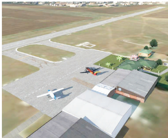
Picha ya Uwanja wa Ndege wa Moshi, kutoka angani.

Mlima Kilimanjaro na kutembelea vivutio vya asili.