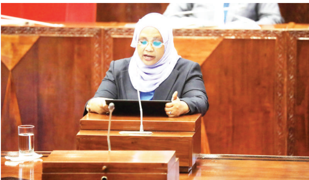
Waziri wa Uwekezaji, Viwanda na Biashara, Dk. Ashatu Kijaji, akiwasilisha makadirio ya mapato na matumizi ya wizara hiyo kwa mwaka wa fedha wa 2023/2024, Bungeni jijini Dodoma jana.

Endapo muunganisho huo utakubaliwa, Twiga Cement na Tanga Cement zitakuwa na 42.27 ya hisa zote za biashara ya saruji nchini, kitu ambacho kinatajwa kuwa ni kinyume na sheria ya ushindani.