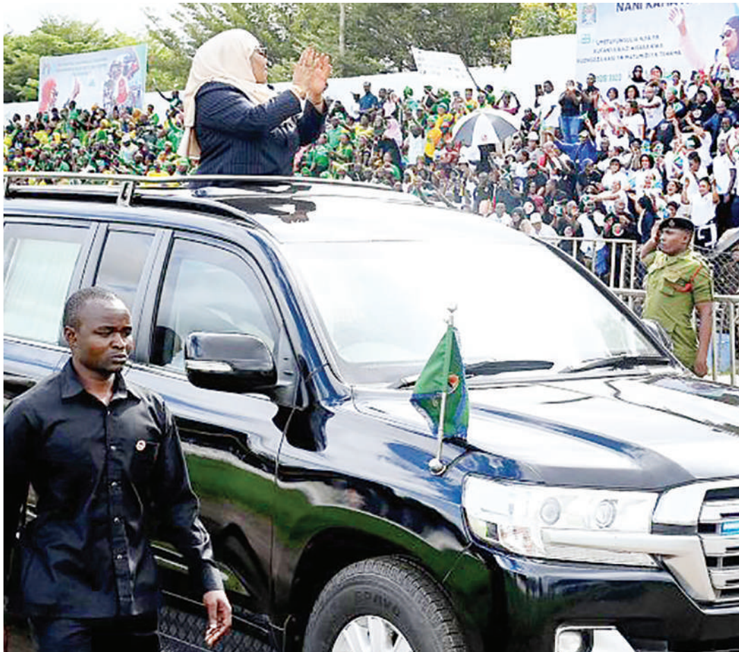
Rais Dk. Samia Suluhu Hassan, akiwasalimia wafanyakazi katika Uwanja wa Jamhuri mjini Morogoro katika siku ya Mei Mosi wiki hii.

Rais Dk. Samia akaweka bayana kuhusu utekelezaji wa madai ya malimbikizo ya wafanyakazi, akisema jumla yake yalikuwa 14,516 na kwamba tayari serikali imeshafanyia kazi madai 13, 523, huku akifafanua kwamba yamebaki machache.