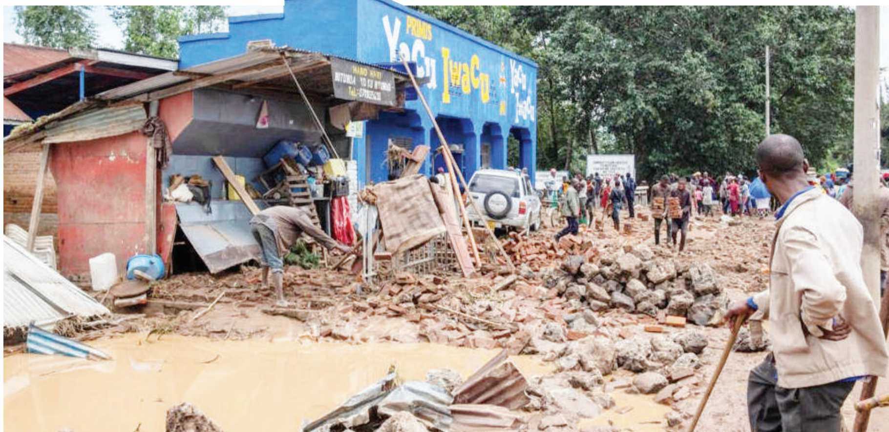
Wananchi wakiopoa vitu vyao baada ya mafuriko kuyakumba baadhi ya maeneo nchini Rwanda, juzi.

Wizara ya Mambo ya Nje mjini Juba, Sudan Kusini ilisema katika taarifa yake kwamba majenerali hao wawili wamekubaliana kimsingi kusitisha mapigano kwa siku saba kuanzia Mei 4 hadi 11 mwaka huu. VOA