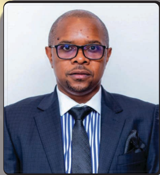
MHE. RIDHIWANI JAKAYA KIKWETE (MB.) NAIBU WAZIRI