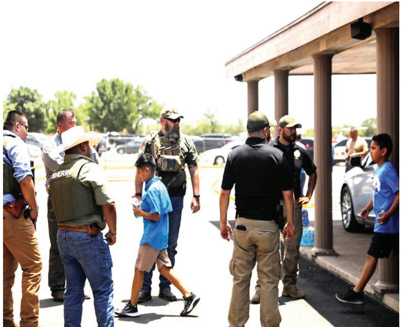
Baadhi ya wanafunzi walionusurika katika shambulio la risasi kwenye Shule ya Msingi Uvalde nchini Marekani wakiondolewa katika eneo la tukio juzi.

Gaidai alionya kuwa vikosi vya Russia vimeharibu daraja lote isipokuwa moja katika mto Donets na kusema kuwa jiji hilo liko katika hatari ya kukatwa. BBC