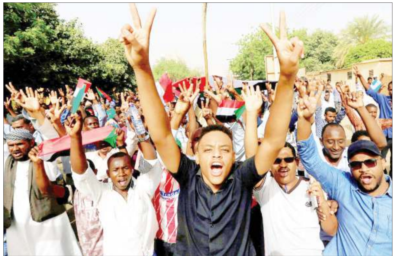
Waandamanaji Sudani wakishangilia baada ya makubaliano kufikiwa baina yao na Jeshi la kuundwa kwa serikali ya mpito itakayoongoza kwa miaka mitatu, kisha madaraka kukabidhiwa kwa wananchi.

Siku ya Jumatatu, WhatsApp ilipendekeza wateja zaidi ya bilioni 1.5 duniani wanaotumia mtandao huo waimarisha programu hiyo baada ya kusambaza mfumo huo mpya ulionuiwa kulinda vifaa vinyavyotumia mtandao huo dhidi ya uduku. BBC