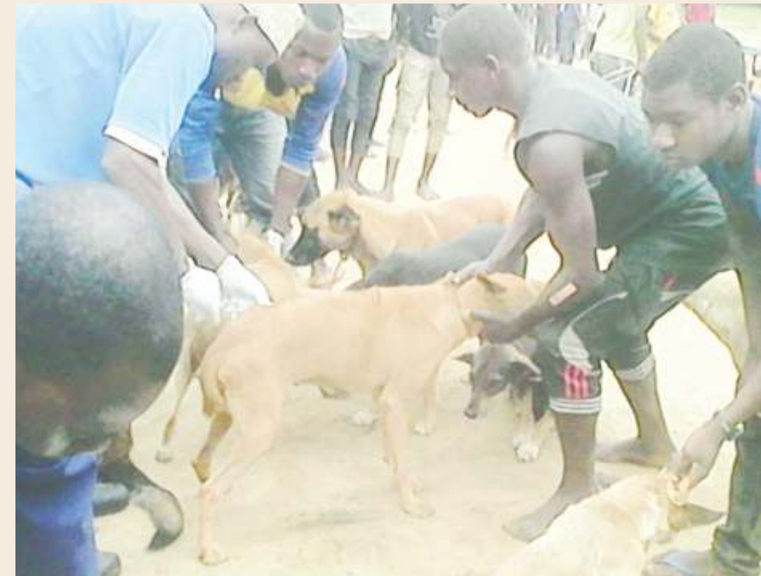
Huduma ya tiba na kinga dhidi ya kichaa cha mbwa ikiendelea.

Inaeleza, mara dalili hizo zinapoonekana, maana yake ugonjwa umeshaanza kuharibu ubongo na mishipa midogo, hatua ya mwisho ikiwa ni kifo cha mgonjwa.