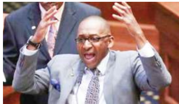
Seneta wa Chama cha Democratic, akiing'aka kupinga sheria hiyo.

Mapema mwaka huu, Mahakama Kuu nchini Marekani ilizuia utekelezaji wa sheria moja inayopinga kutoa mimba jimboni Louisiana, wakati ikiendelea kusikiliza shauri lililofunguliwa .