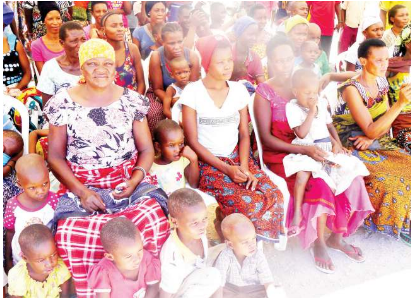
Wanawake wa Kishapu kwenye tamasha la Mwanaume Jasiri, linalopinga mimba na ndoa za utotoni kwa mabinti.

"Nawaombeni wana- Kishapu tubadilike, tuachane na masuala haya ya mila na desturi kandamizi, tusomeshe watoto wetu wa kike bila ya ubaguzi," anasema mkuu wa wilaya huku akiwaasa