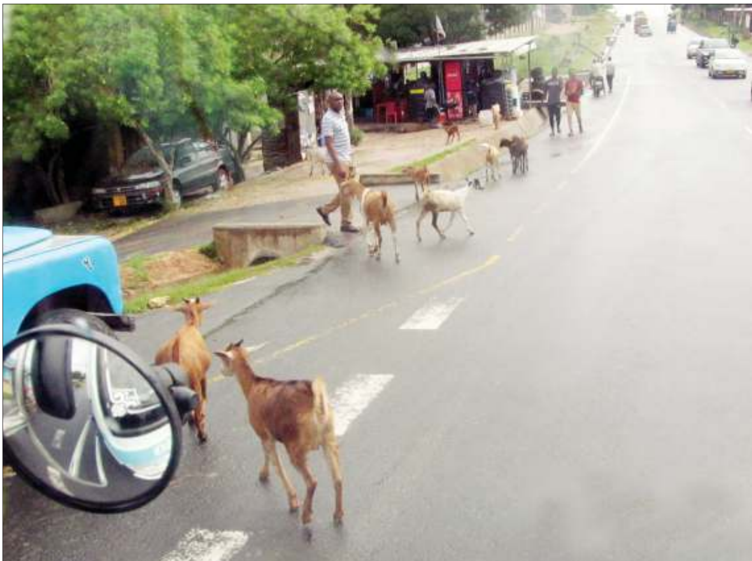
Mbuzi wakizurura eneo la Goba jijini Dar es Salaam juzi, bila uangalizi wa mmiliki wake.

"Wakandarasi wa kutekeleza mradi watakiwa wawe eneo la kazi ifikapo Septemba 2019. Mradi wa maji wa miji 29 unatarajia kuhudumia zaidi ya wananchi milioni mbili," ilisema taarifa iliyotolewa na kitengo cha Mawasiliano, Wizara ya Maji.