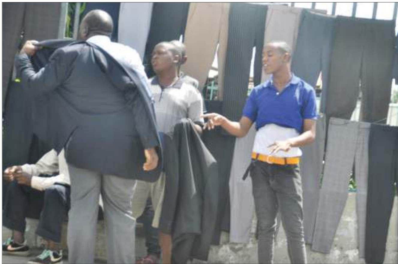
Mkazi wa jiji akijaribi-sha koti la mtumba, kabla ya kulinunua kando ya Barabara ya Uhuru, eneo la Ilala TBL, jijini Dar es Salaam jana.