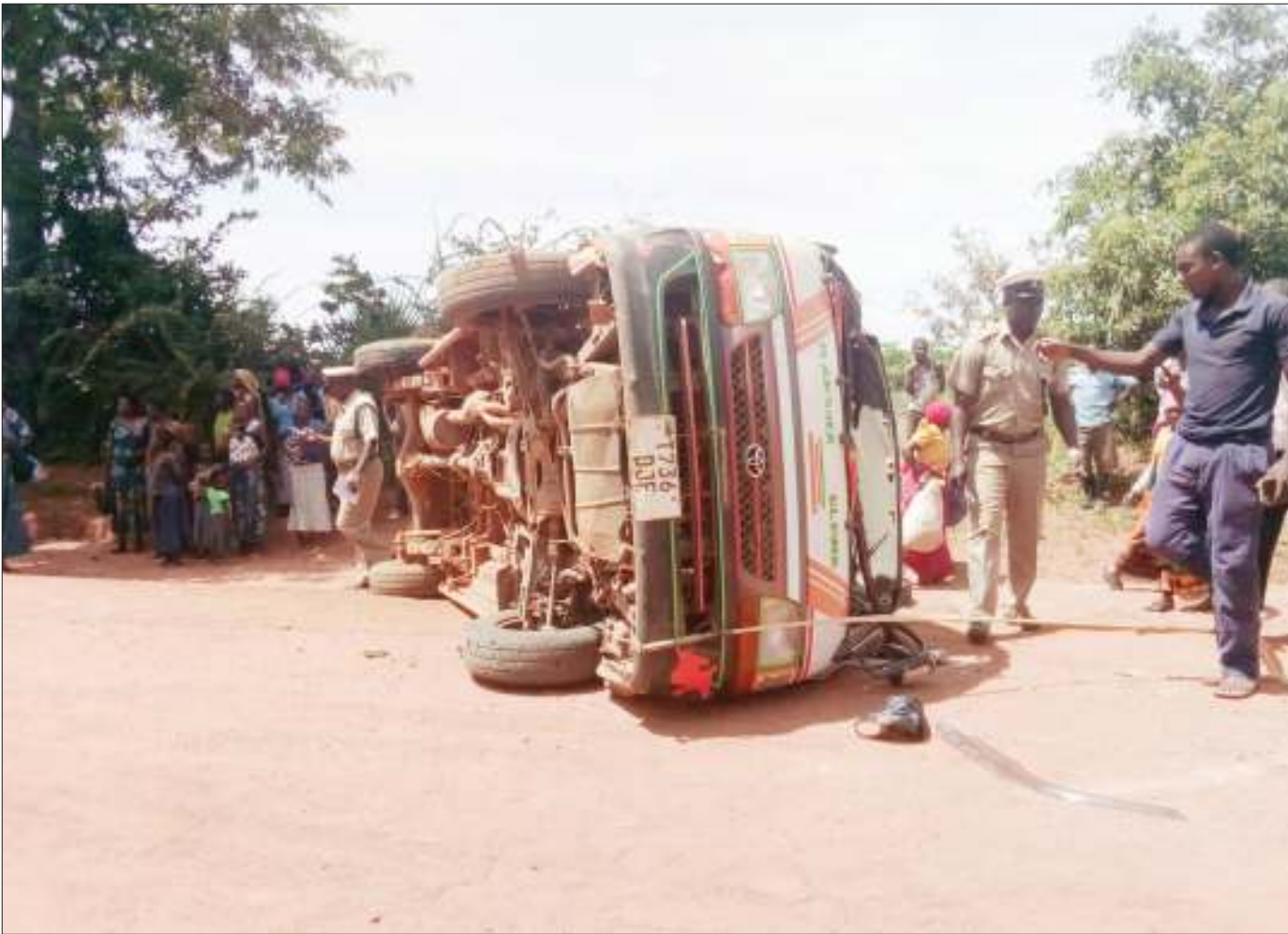
Wananchi wakiangalia gari aina ya Hiace yenye namba za usajili T 736 DJF, baada ya kupinduka katika kijiji cha Kisuke lilipokuwa linatoka Ulowa kwenda Kahama Mjini mkoani Shinyanga. Abiria 30 walijeruhiwa, huku chanzo kikielezwa ni kupasuka tairi na nyuma.