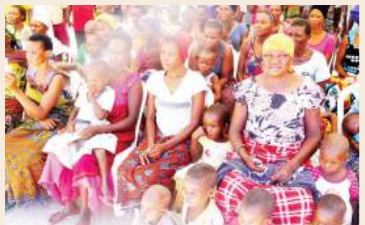
Wanawake wa Kishapu kwenye tamasha la Mwanaume Jasiri, linalopinga mimba na ndoa za utotoni kwa mabinti. NA MPIGAPICHA WETU

Rai ya hakimu huyo, ni kwamba jamii inapaswa kupewa elimu ya madhara wanafunzi kupewa ujauzito au kuolewa katika umri mdogo na kuacha tabia ya kumaliza kesi kimya kimya, ndiyo majibu ya utokomezaji