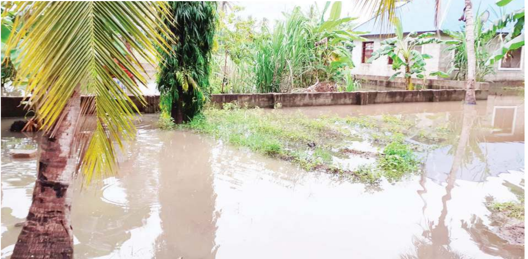
Picha zinazoonyesha mandhari ya makazi ya Mji Mwema Ungindoni, Kigamboni, katika msimu wa mvua unaoendelea Dar es Salaam. Imekuwa hali ya kudumu mahali hapo kila mvua kubwa zinaponyesha.