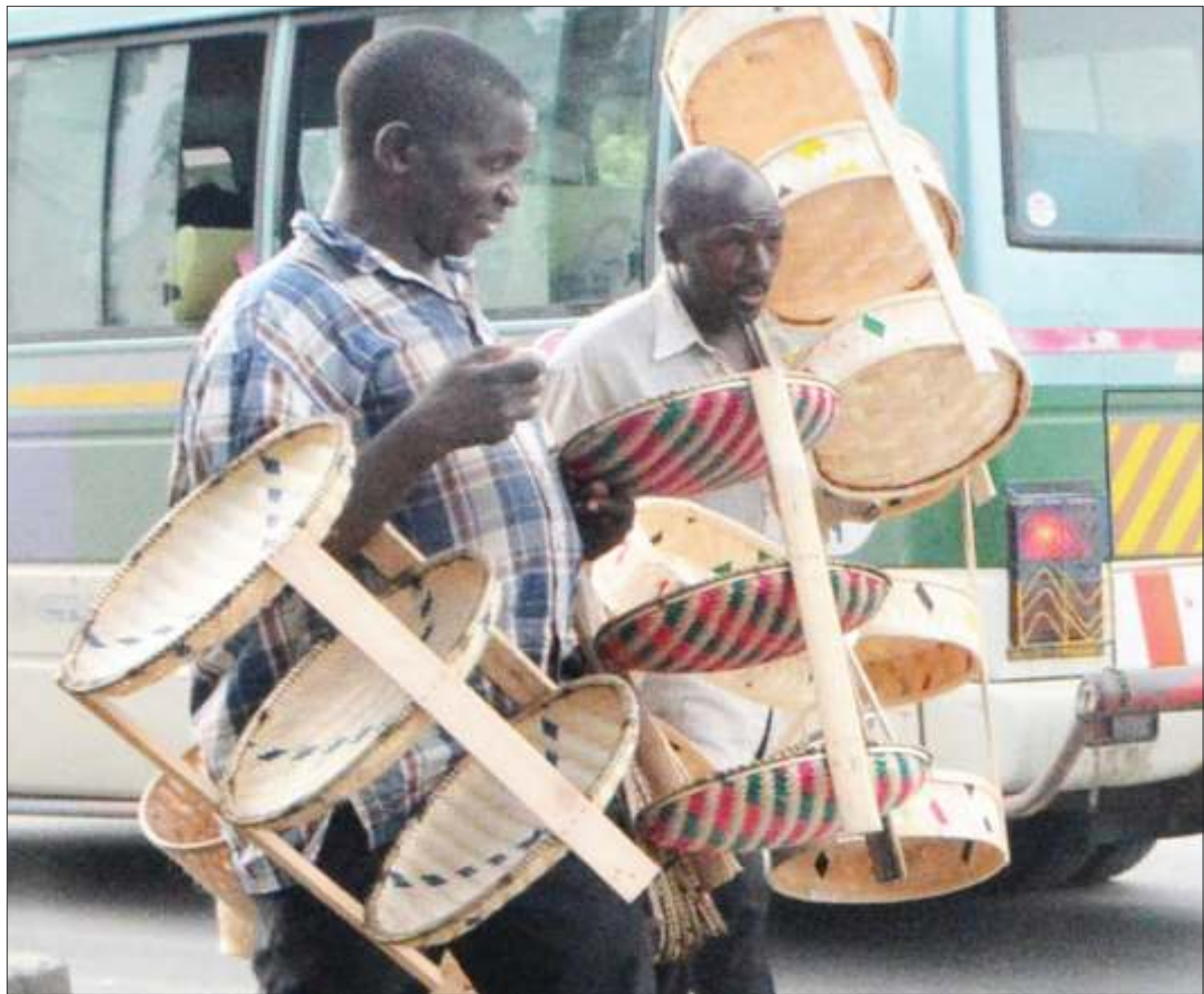
Wachuguzi wa vikapu wakisaka wateja katika eneo la Msimbazi centre, jijini Dar es Salaam jana.

Aisema ni vyema Nec ikaanza sasa kusimamia uchaguzi wa serikali za mitaa unaotarajiwa kufanyika Oktoba, mwaka huu.