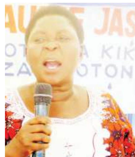
Mkuu wa Wilaya ya Kishapu, Nyabaganga Taraba, akiwakamea wanaume wilayani kwake wanaoendelea mila na desturi za kuozesha mabinti ndoa za utotoni.

“ Mwaka huu kwenye Kata yangu hii ya Shanghiliu tayari wanafunzi wanne wameshapewa ujauzito na kuacha masomo. ”