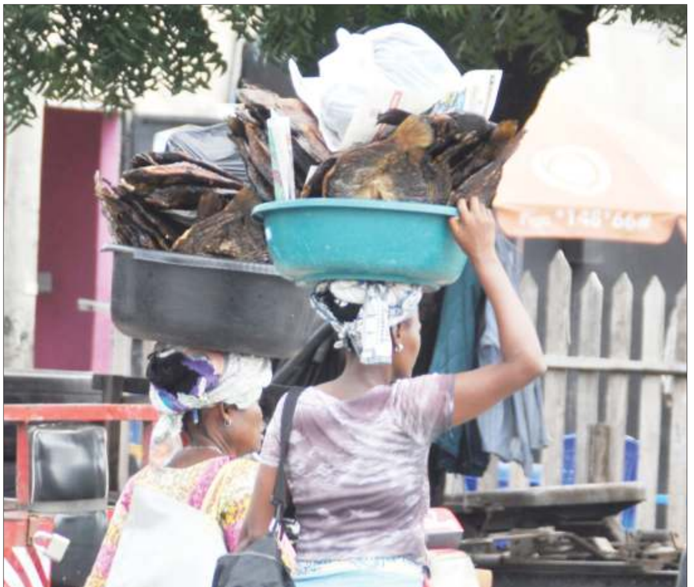
Kinamama wachuuzi wa samaki waliokaushwa aina ya Kambale, wakisaka wateja katika eneo la Tabata Matumbi, jijini Dar es Salaam jana.