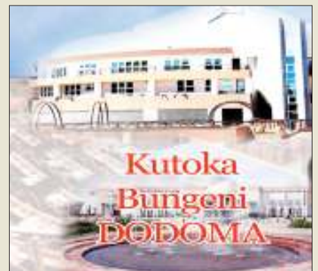
Habari zote na Augusta Njoi, DODOMA

Alisema vijiji na vitongoji vilivyopitiwa na miundombinu ya umeme katika Wilaya ya Mkalama vimejumuiwa katika mpango wa kupatiwa umeme kupitia mradi wa ujazilizi awamu ya pili unaotarajiwa kuanza Julai mwaka huu. Aidha, alisema mradi huo utahusisha pia kuvipatia umeme vitongoji vyote vya Wilaya ya Mkalama vilivyopitiwa na njia za umeme kupitia utekelezaji wa mradi wa REA III mzunguko wa kwanza unaoendelea na utakamilika mwezi Juni mwaka 2020.