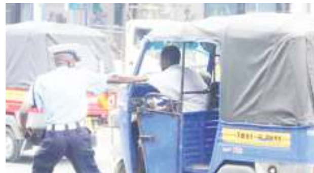
Polisi wa Usalama Barabarani, jijini Nairobi, wakimkamata dereva.

Hukumu hiyo ilisisitiza kwamba, kuendesha gari kama mtu hajaathirika na pombe sio makosa.