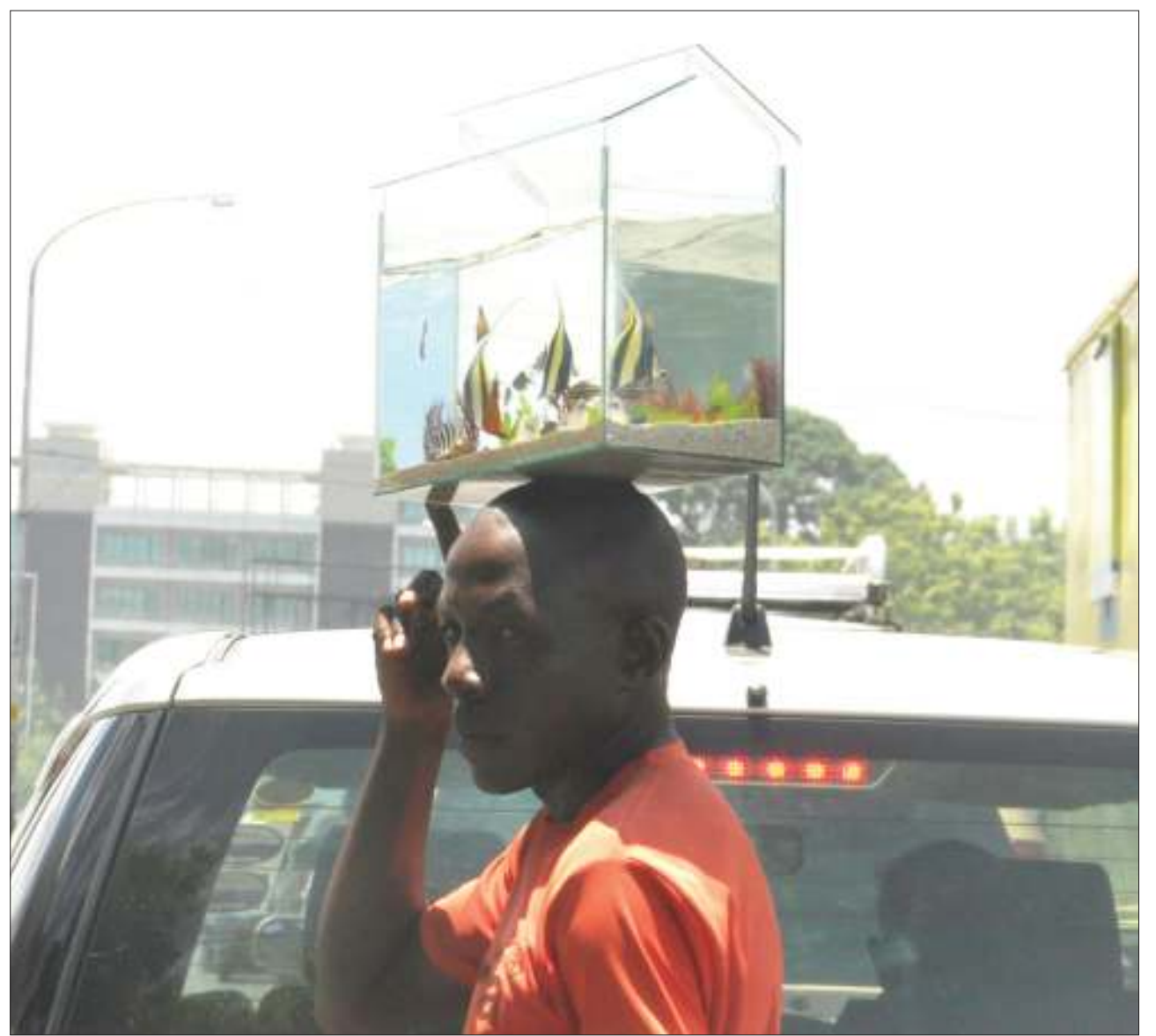
Mkazi wa Jiji la Dar es Salaam akisaka wateja wa kizimba cha kufugia samaki wa mapambo katika Barabara ya Ali Hassan Mwinyi, eneo la Morocco, jana.

Aliwataka wananchi kutoa taarifa kwa jeshi la Polisi kila wanapowabaini wabakaji na waharifu wengine ili kuhakikisha wahusika wanakamatwa na vitendo hivyo vya unyanyasaji wa watoto vinakoma.