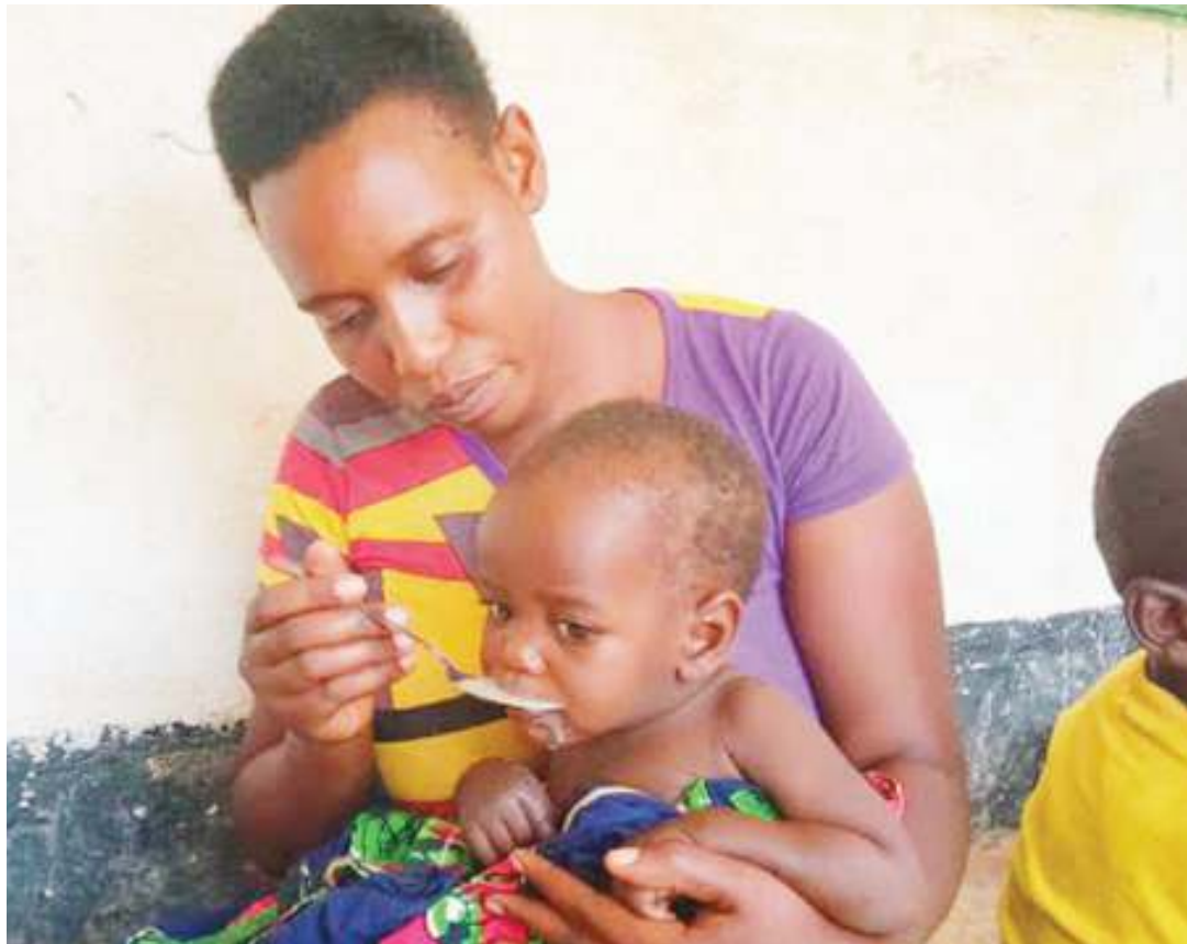
Mkazi wa Minziro, wilayani Misenyi, akimnywesha uji mwanawe, baada ya kupata mafunzo ya upikaji lishe ya watoto.

Mtaalamu lishe huyo anazidi kueleza kwamba kumpa mtoto vyakula vya nyongeza, kunaweza kumfanya mama aridhike kuwa mtoto wake ana afya nzuri, ku-