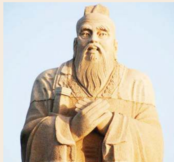
Sanamu ya Mfalme wa Kale China.

Kupitia mpangilio huo wa kimahehabu, anakutana na Malkia; wapenzi wakuu watatu; wake wadogo 27; na