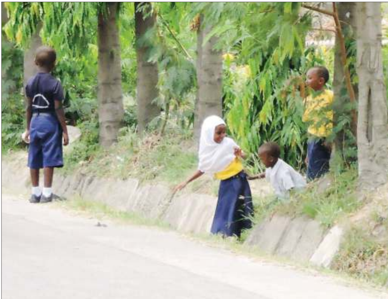
Watoto wakicheza kwenye mtaro wa maji ya mvua kando ya Barabara ya Shekilango jijini Dar es Salaam jana, kitendo ambacho ni hatari kwa usalama wao.

"Tukutane tena Mahakama Kuu tarehe 22 Februari 2019, siku ya Ijumaa. CUF mpya, CUF moja, CUF imara, CUF yenye nguvu inaenda kurejeshwa katika mstari wake," alisema Maharagande.