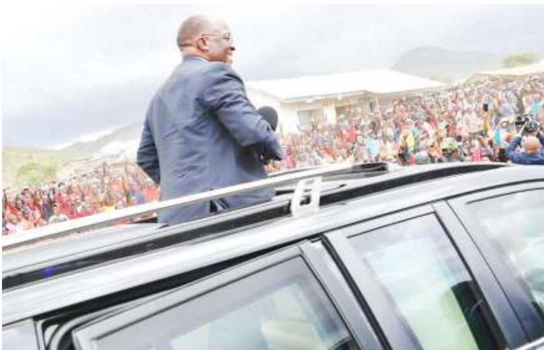
Rais Dk. John Magufuli, akizungumza na wakazi wa Oldonyosambu, wilayani Arumeru.

• Wakazi washangilia, wengine hoi majumbani