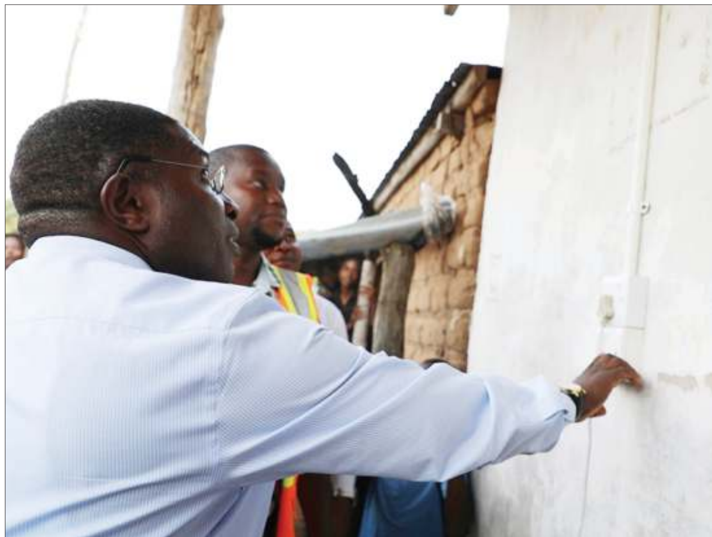
Waziri wa Nishati, Dk. Medard Kalemani, akiwasha umeme katika kijiji cha Lwezera wilayani Geita, ambacho kimepata umeme kupitia mradi wa usambazaji umeme vijijini wa awamu ya tatu mzunguko wa kwanza (REA III) juzi.

Kili Water ilikuta mtandao wa usambaji maji, ulikuwa kilometa 700, lakini sasa umeongezeka hadi kufikia 1,200, huku vyanzo vya maji vikiongezeka kutoka vyanzo 24 hadi 30.