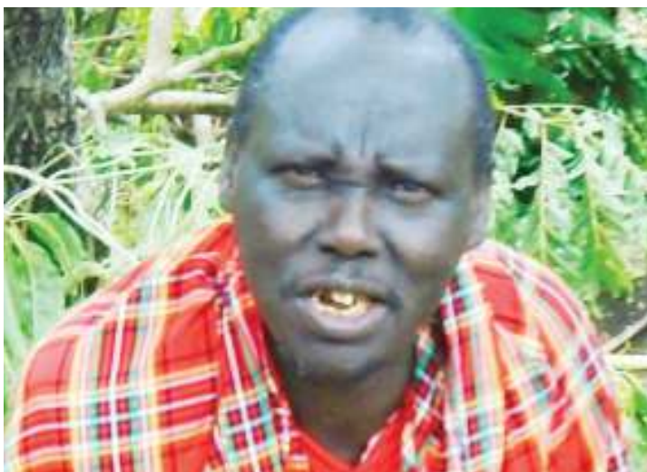
Mkazi wa Odonyosambu, Mkoa wa Arusha aliyeathiriwa meno na maji.

Kuna watoto miguu imejikunja (pinda), mingine inaonekana kama pasi na wakuwa na vichwa vikubwa.