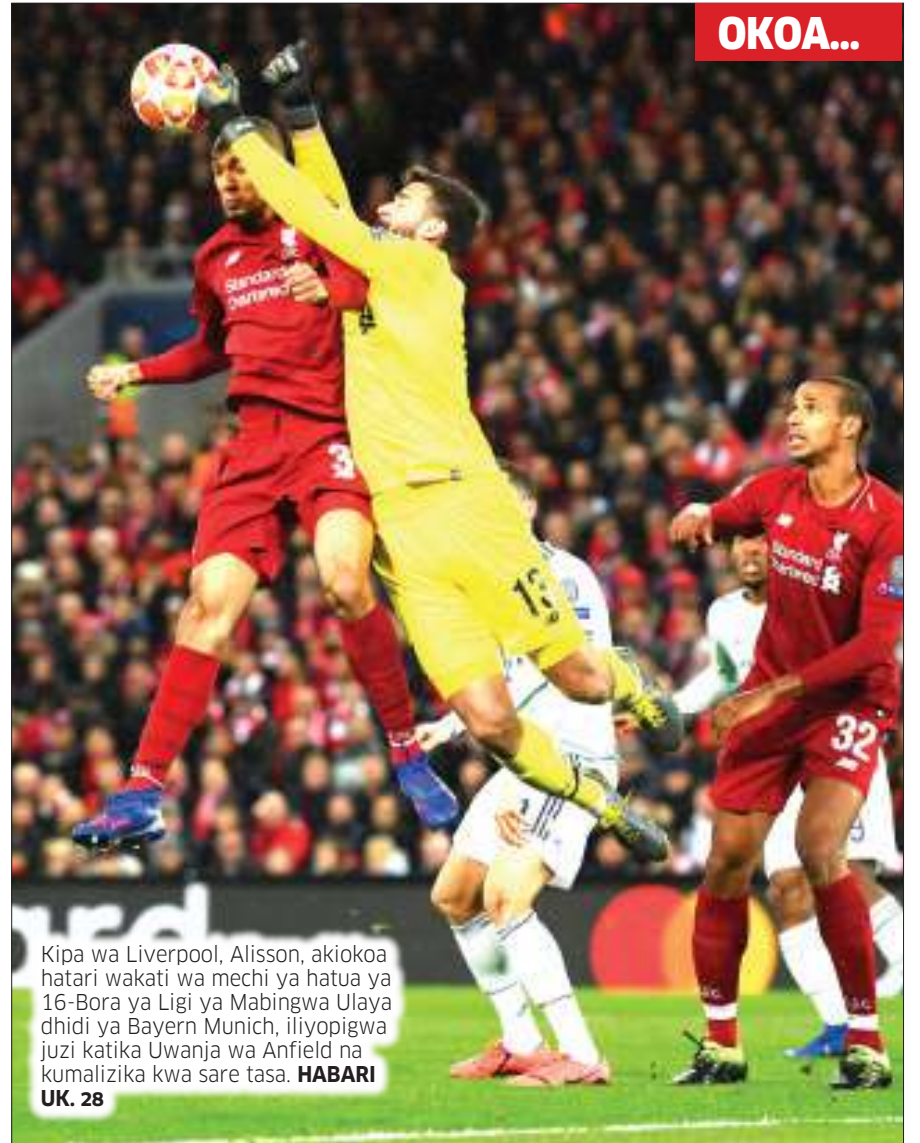
Kipa wa Liverpool, Alisson, akiokoa hatari wakati wa mechi ya hatua ya 16-Bora ya Ligi ya Mabingwa Ulaya dhidi ya Bayern Munich, iliyopigwa juzi katika Uwanja wa Anfield na kumalizika kwa sare tasa. HABARI UK. 28