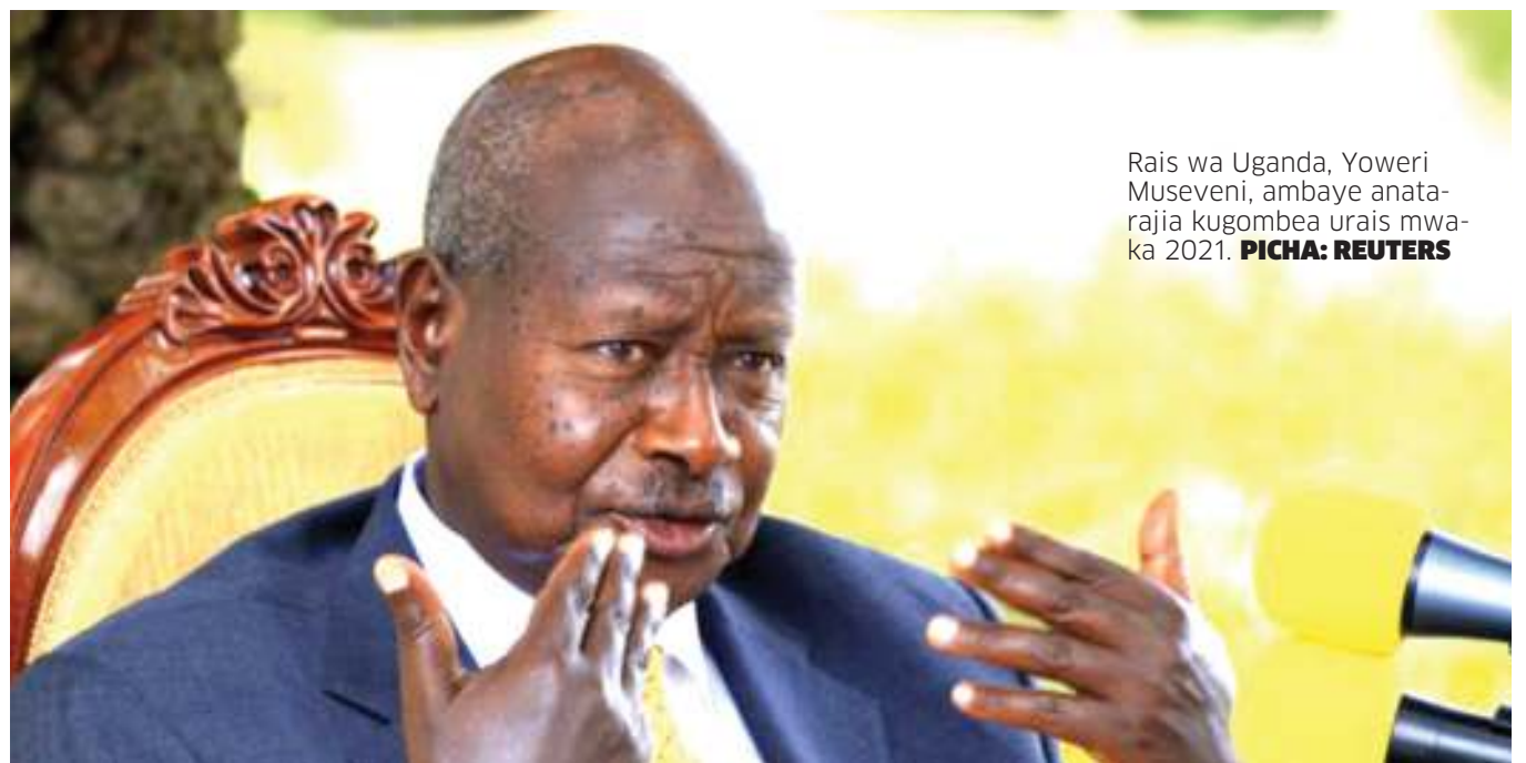
Rais wa Uganda, Yoweri Museveni, ambaye anatarajia kugombea urais mwaka 2021.

Alipoulizwa na mahakama iwapo angethubutu kufanya makosa kama hayo tena, licha ya kupewa kifungo cha nyumbani cha miezi mitatu, Murage alikiri na kusema kuwa yeye sio muhalifu. Baada ya kuachiwa huru, Murage alisema anatamani kumuona mwanaye anakuwa daktari kwa lengo la kuwasaidia watu wenye shida ambao wapo katika hospitali hiyo. BBC