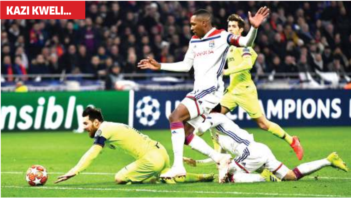
Lionel Messi (chini mbele), katika harakati za kuipa ushindi Barcelona wakati wakilazimisha sare tasa dhidi ya Lyon, kwenye mechi ya Ligi ya Mabingwa Ulaya hatua ya 16-Bora katika Uwanja wa Groupama, Ufaransa juzi.