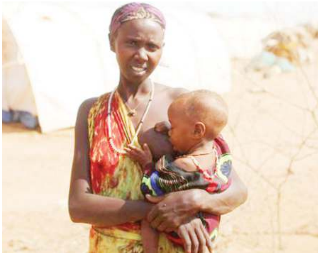
Mama akimnyonyesha mwanawe..

• Azaliwaye aishia kupewa maji vuguvugu • Watosa ya kliniki, mila zinachukua nafasi • Uelewa 'sifuri' maziwa ya titi kukaa siku na nusu