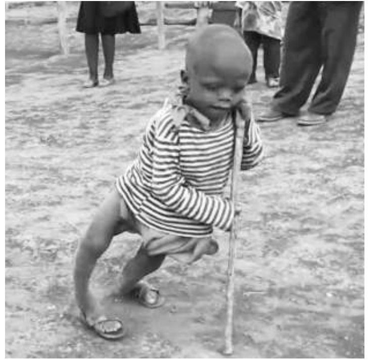
Watoto wa Oldonyosambu, Mkoa wa Arusha, walioathirika miguu kutokana na maji kuwa na athari ya madini.