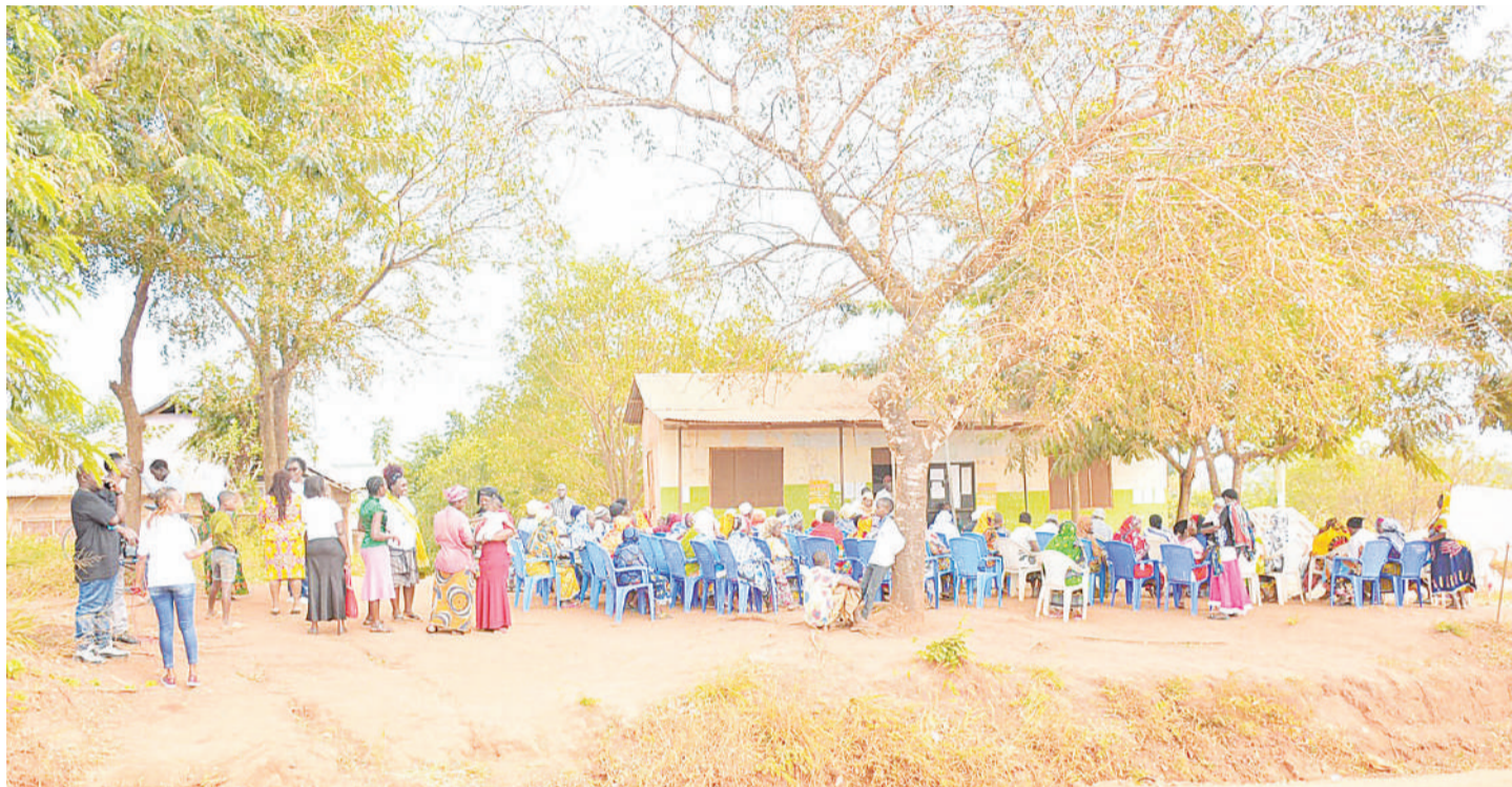
Moja ya ofisi ya serikali za mitaa jijini Dar es Salaam.