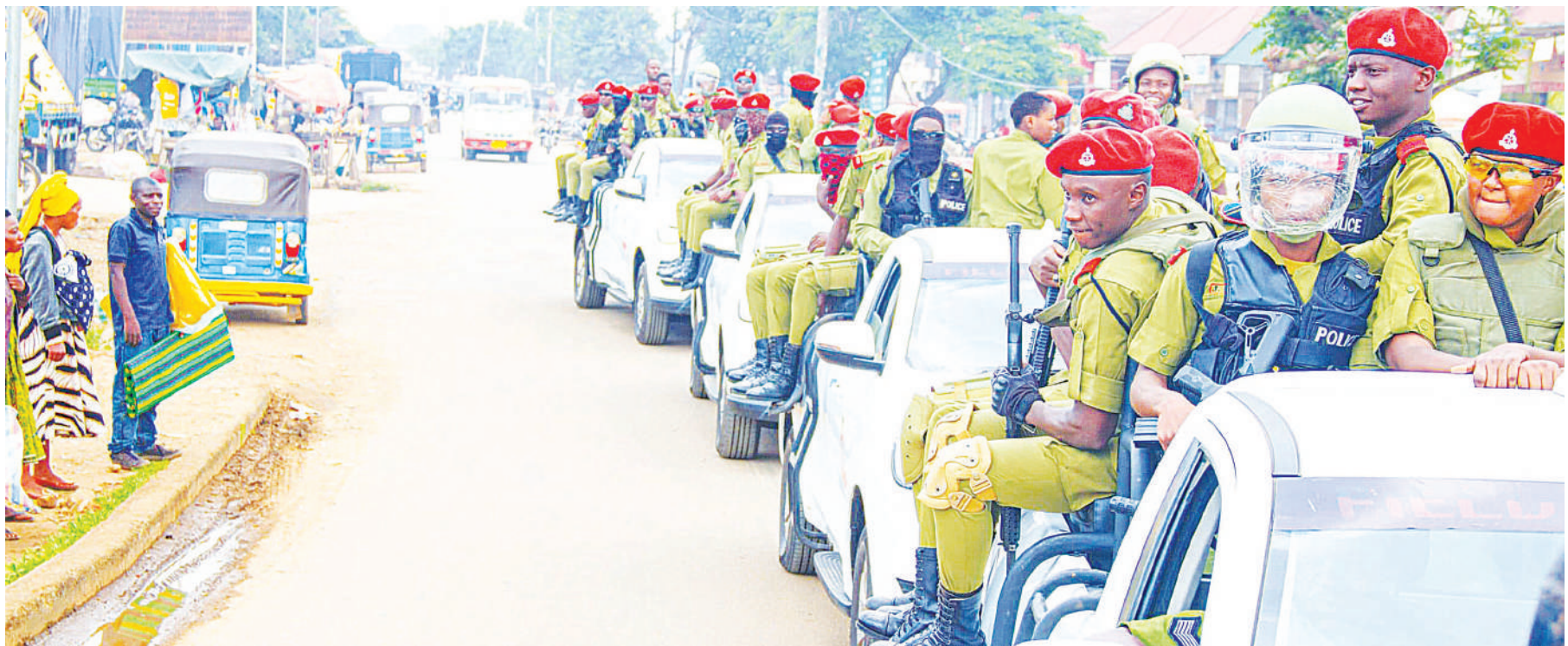
Polisi Mkoa wa Songwe wakiwa katika doria za magari na miguu mjini Tunduma jana, ikiwa ni sehemu ya kuimarisha ulinzi na usalama kuelekea Uchaguzi wa Serikali za Mitaa unaofanyika leo.

• Vigogo wahitimisha kampeni kila mmoja kwa staili yake, Rais Samia asema uamuzi wa wapigakura uheshimiwe... Endelea Ukurasa 2