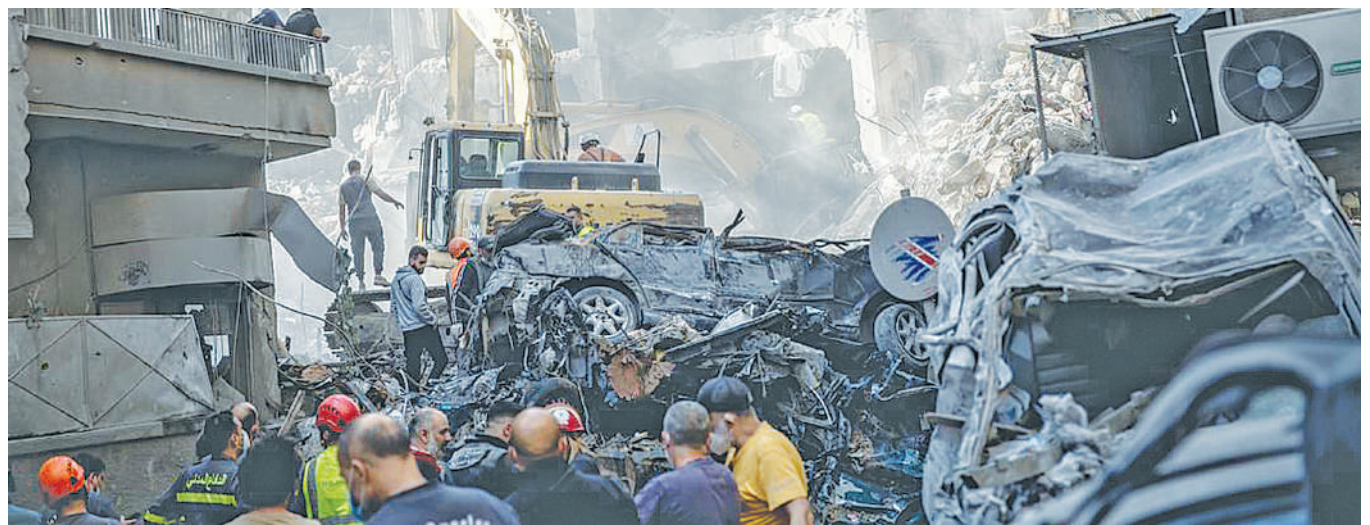
Zoezi la uokoaji likiendelea baada ya shambulizi la anga la Israel lililolenga jengo la makazi Lebanoni, huku ikielezwa kuwa masimuni hao wamekubaliana na masharti ya kusitisha vita.

Hata hivyo, mojawapo ya nchi iliyoonesha nia ya kujiunga na BRICS ni Bolivia ambayo imeona ni fursa ya kuongeza ushiriki wake katika biashara ya kimataifa.