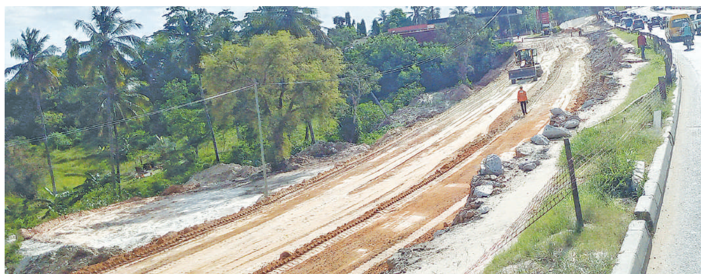
Upanuzi wa Barabara ya Morogoro kwa njia sita ukiendelea katika eneo la Kimara Resort, Dar es Salaam jana.

Kwa mujibu wa takwimu za TAMWA Zanzibar tangu mwaka 2016, matukio 29 ya mauaji ya wanawake na watoto yameripotiwa (wanawake 24 na watoto watano), huku yaliyofikishwa Mahakama Kuu ya Zanzibar yakiwa ni machache.