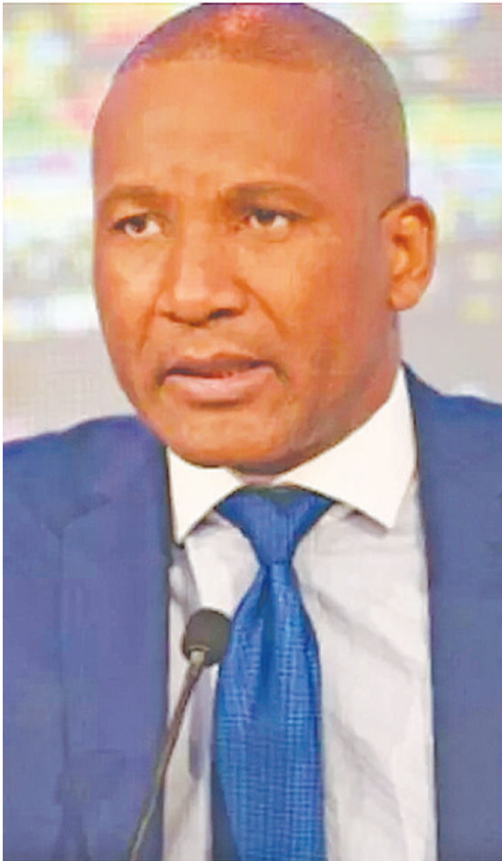
Rais mpya wa Botswana, Duma Boko.