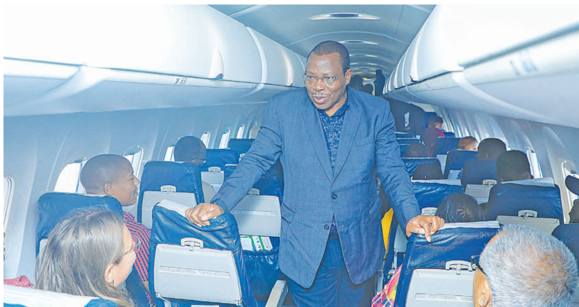
Makamu wa Rais, Dk. Philip Mpango, akizungumza na abiria alipokuwa safarini jana kutoka Dar es Salaam kuelekea mkoani Kigoma kushiriki Uchaguzi wa Serikali za Mitaa unao-fanyika leo, kwa ndege ya Shirika la Ndege Tanzania (ATCL).