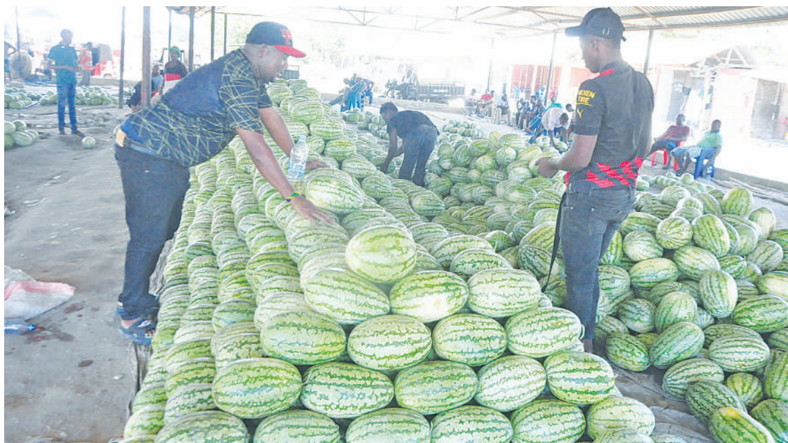
Wajasiriamali wa matunda wakipanga matikitimaji kwa ajili ya kuwauzia wateja wao katika Soko la Simu 2000 (Mawasiliano) Dar es Salaam jana ambapo tunda moja huuzwa kuanzia 1000 hadi 10,000 kulingana na ukubwa wake. Aidha wametaja kuwa msimu mzuri wa matunda hayo hawa ni kuanzia Februari.

"Tunawahimiza wanawake na wasichana wanaogombea nafasi za uongozi katika uchaguzi huu, kuwa wastahimilivu, ili kutimiza malengo yao na wasiogope kutoa taarifa kwa mamlaka, pindi wanapodhalilishwa mitandaoni au kwa namna yoyote.