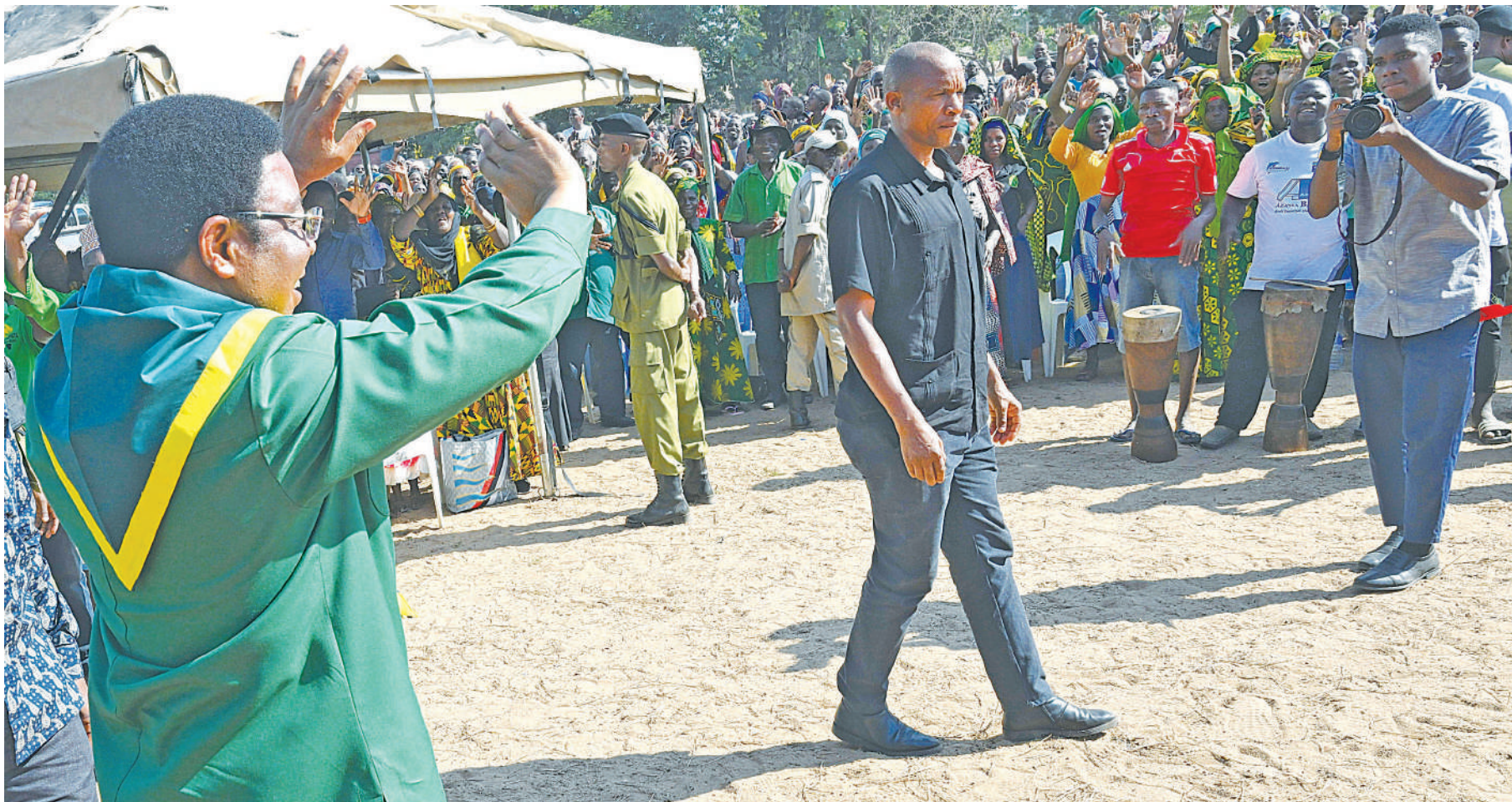
Mjumbe wa Kamati Kuu ya Halmashauri Kuu ya CCM Taifa, Waziri Mkuu, Kassim Majaliwa, akiwasalimia wananchi alipowasili katika mkutano wa kufunga kampeni za CCM uliofanyika uwanja wa Ujenzi wilayani Liwale, mkoani Lindi jana na kuhamasisha wananchi kupiga kura leo.