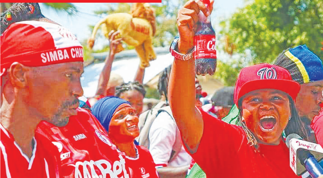
Mashabiki wa Simba wakihamasishana kununua tiketi Mbagala, Dar es Salaam jana, kuelekea mechi yao ya Kombe la Shirikisho Afrika dhidi ya Bravo do Maquis ya Angola, itakayopigwa Uwanja wa Benjamin Mkapa leo saa 10 alasiri.