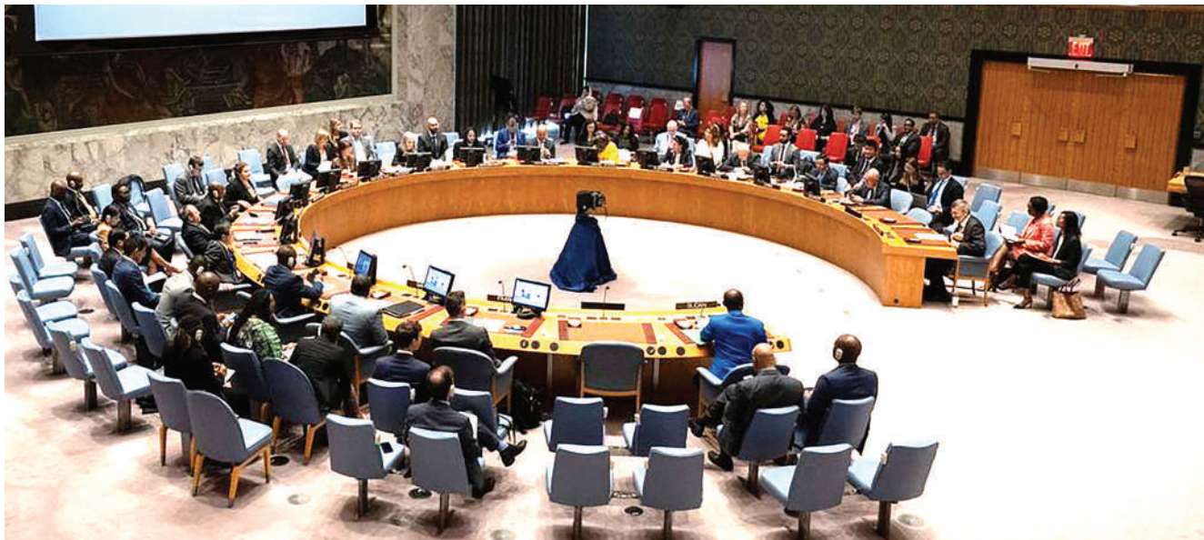
Viongozi wa ngazi za juu kutoka mataifa mbalimbali duniani wakishiriki katika mkutano wa Baraza Kuu la Umoja wa Mataifa, jana.