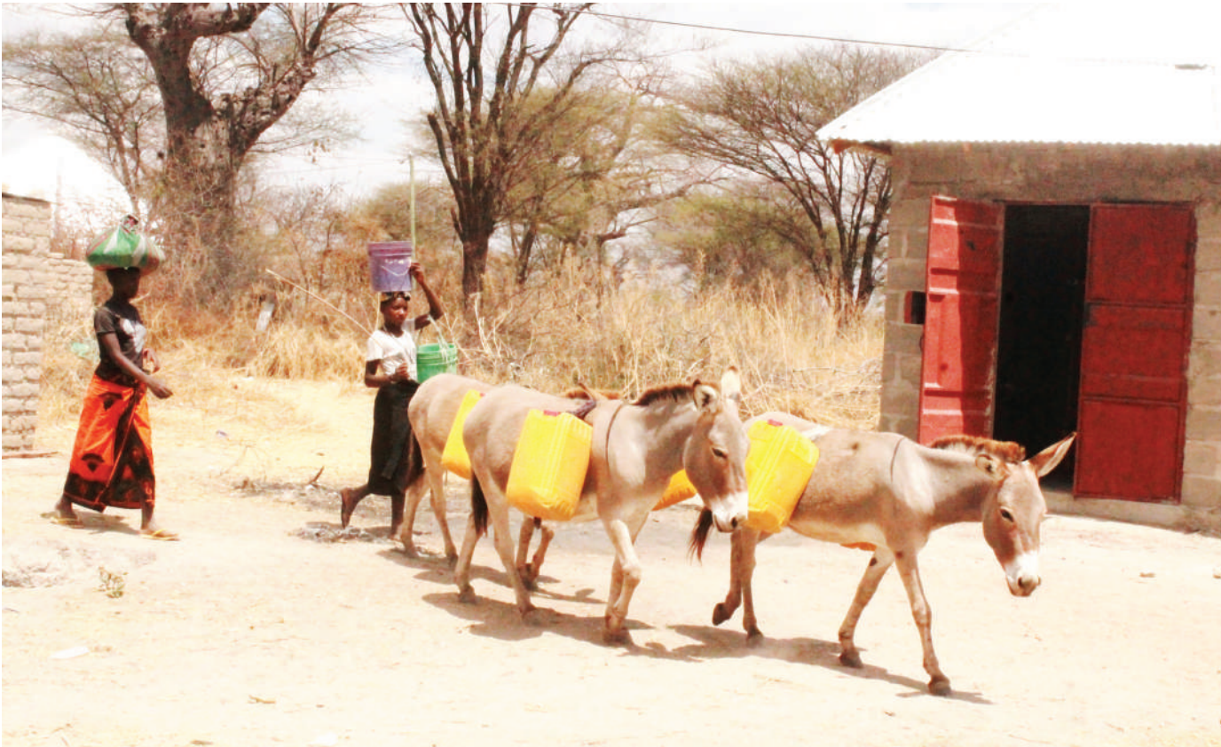
Wakazi wa kijiji cha Magungu, wilayani Chemba, mkoani Dodoma, wakiswaga punda waliowabebesha madumu ya maji kwa ajili ya matumizi ya nyumbani, jana.