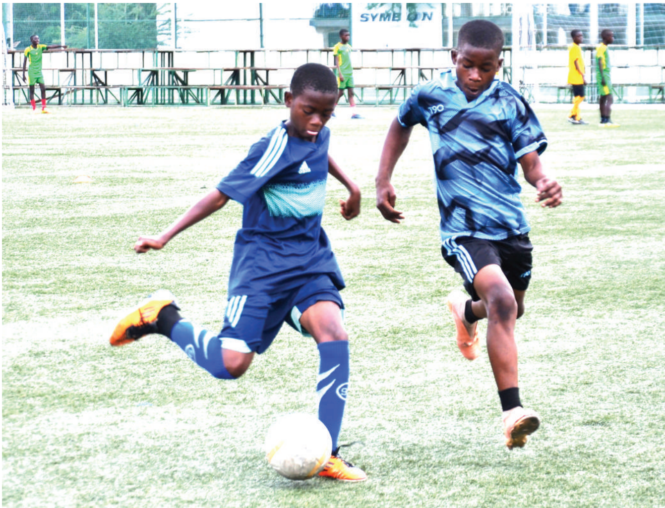
Wasichana wanaolelewa katika kituo cha michezo cha JKM Park kilichoko Dar es Salaam wakifanya mazoezi ili kujiimarisha.