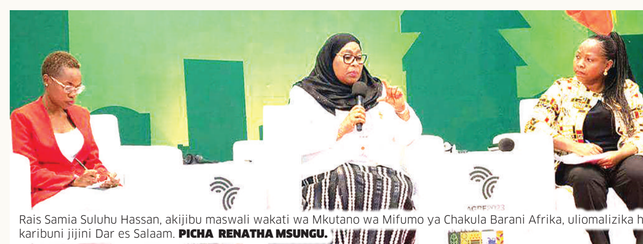
Rais Samia Suluhu Hassan, akijibu maswali wakati wa Mkutano wa Mifumo ya Chakula Barani Afrika, uliomalizika hivi karibuni jijini Dar es Salaam.

Anafafanua zaidi ya kuwa miradi iliyopata