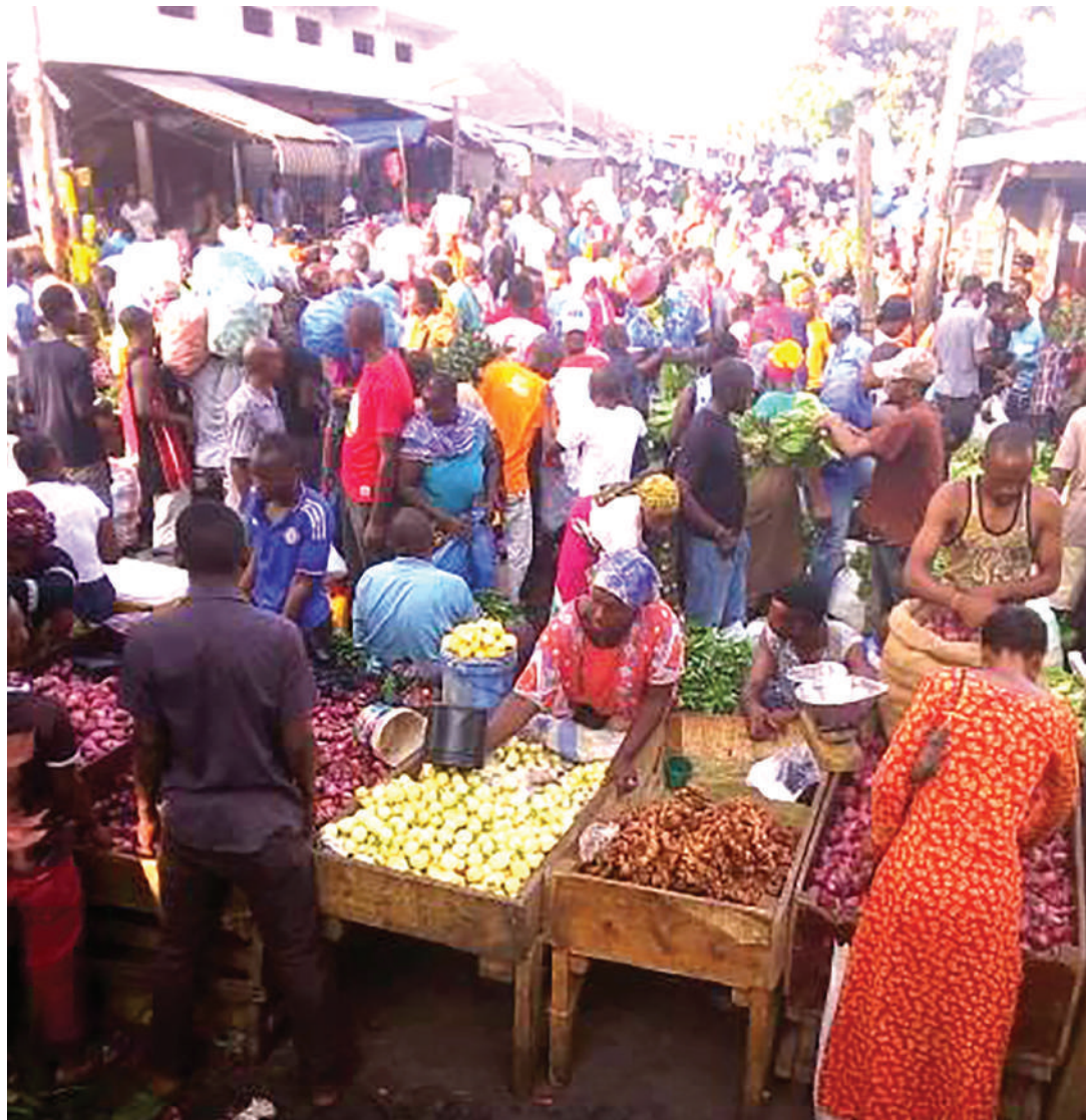
Shughuli za kilimo, zikiendelea sokoni Ilala, Dar es Salaam.

“Baada ya kubaini changamoto hizo, tumeona ni vyema kuwapo na vyumba, mtoto akitoka shule anafika sokoni aendeleo kupata elimu ili asifanyiwe ukatili au kujiingiza katika yasiyofaa na wale ambao umri wao ni wa kunyonya, nao wataendelea kupewa huduma hizo, wakiwa katika