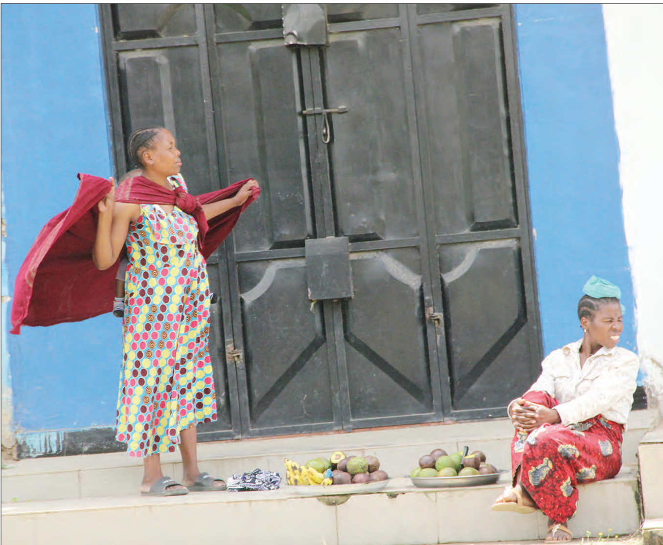
Baadhi ya wajasiriamali wanaouza matunda jijini Mbeya, wakiwa wamepumzika katika moja ya vyumba vya biashara vinavyozunguka uwanja wa Kumbukumbu ya Sokoine mwishoni mwa wiki.

Alisema baadhi ya wakazi hususani wazee wanaomiliki miji hawana uwezo wa kumudu gharama za kununua miche ya miti, alishauri viongozi kuandaa utaratibu maalum kuwagawia ili nao waendane na kasi ya upandaji miti.