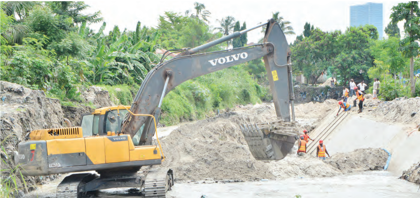
Mafundi wakiendelea na ujenzi wa upanuzi na ukuta wa Mto Ng'ombe, eneo la Kijitonyama na Tandale, Manispaa ya Kinondoni, jijini Dar es Salaam jana.