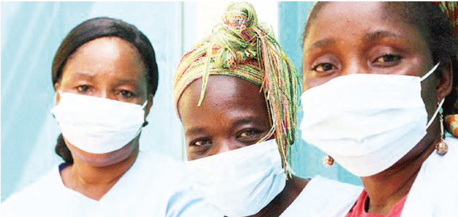
Kuvaa barokoa, kunawa mara kwa mara na kukwepa mikusanyiko ni mambo yanayokuepusha na corona.