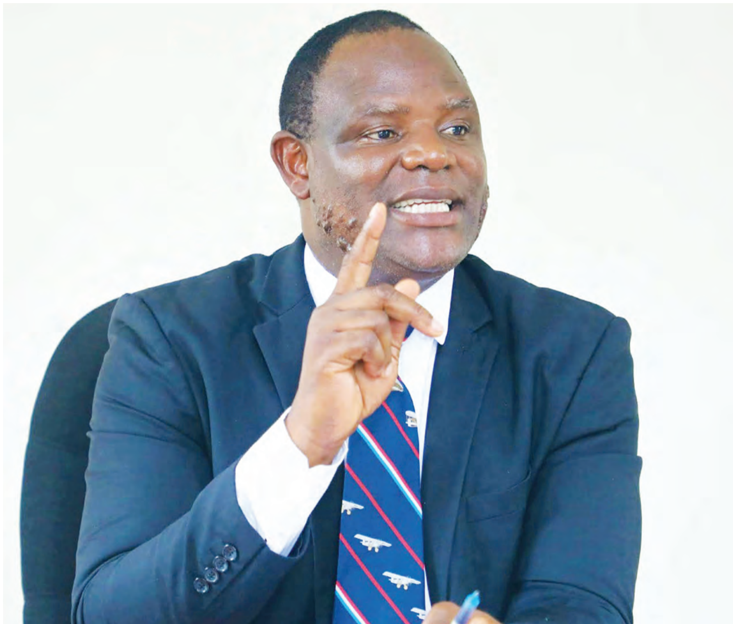
Waziri wa Kilimo, Japhet Hasunga