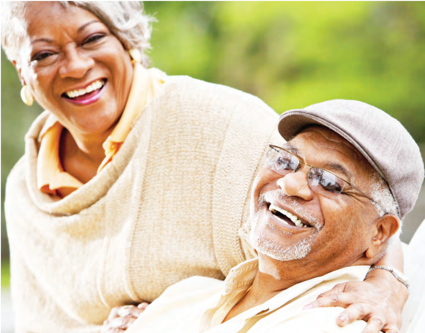
Wastaafu wakifurajia maisha bora baada ya kazi ya utumishi wa umma. Furaha inategemea kupata pensheni kwa wakati.