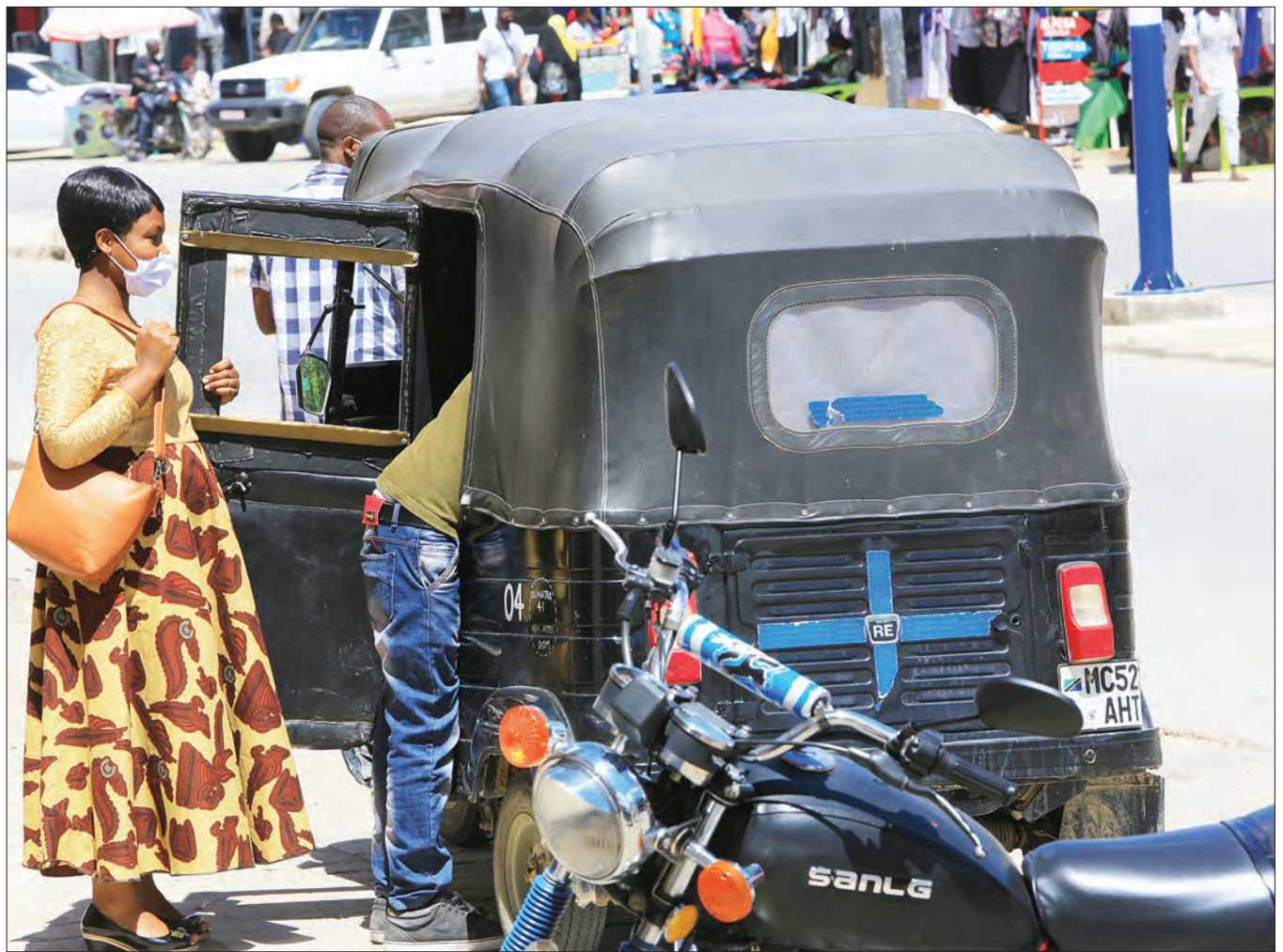
Dereva wa bajaji ambaye jina lake halikupatikana, akiwafungulia mlango wateja wake kandokando ya Barabara ya Nyerere jijini Dodoma jana. Siku hizi kazi zote zinafanywa na makundi ya jinsia zote.

“Na watumishi waache tabia ya kuwaombea wagonjwa kwa kuwagusa na mikono yao wakati huu wa mlipuko wa corona, bali wawanyooshee mikono tu inatosh.”