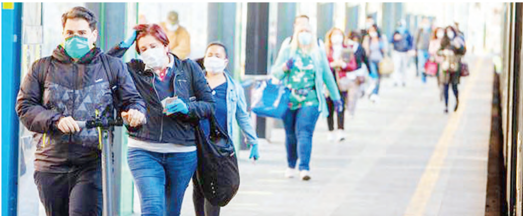
Wananchi katika Jiji la Rome, Italy, wakiwa mitaani baada ya kuondolewa kwa katazo la watu kuzurura.

Imesema imekubali kutoa msaada wa randi bilioni 5.8 kutowa afueni ya kurudisha mkopo au kupunguza madeni hayo kwa awamu katika kipindi cha miezi mitatu. DW