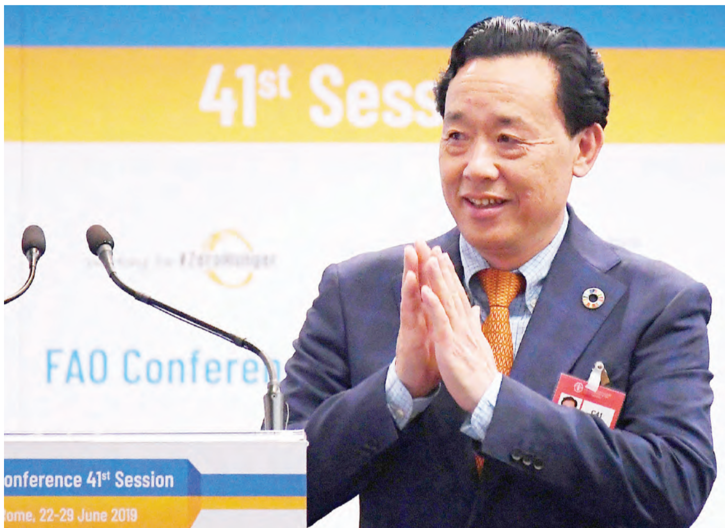
Rais wa FAO, Qu Dongyu, akizungumzia tatizo kukosekana chakula.

Nchi 10 zilizoathirika vibaya na uhaba wa chakula mwaka 2019