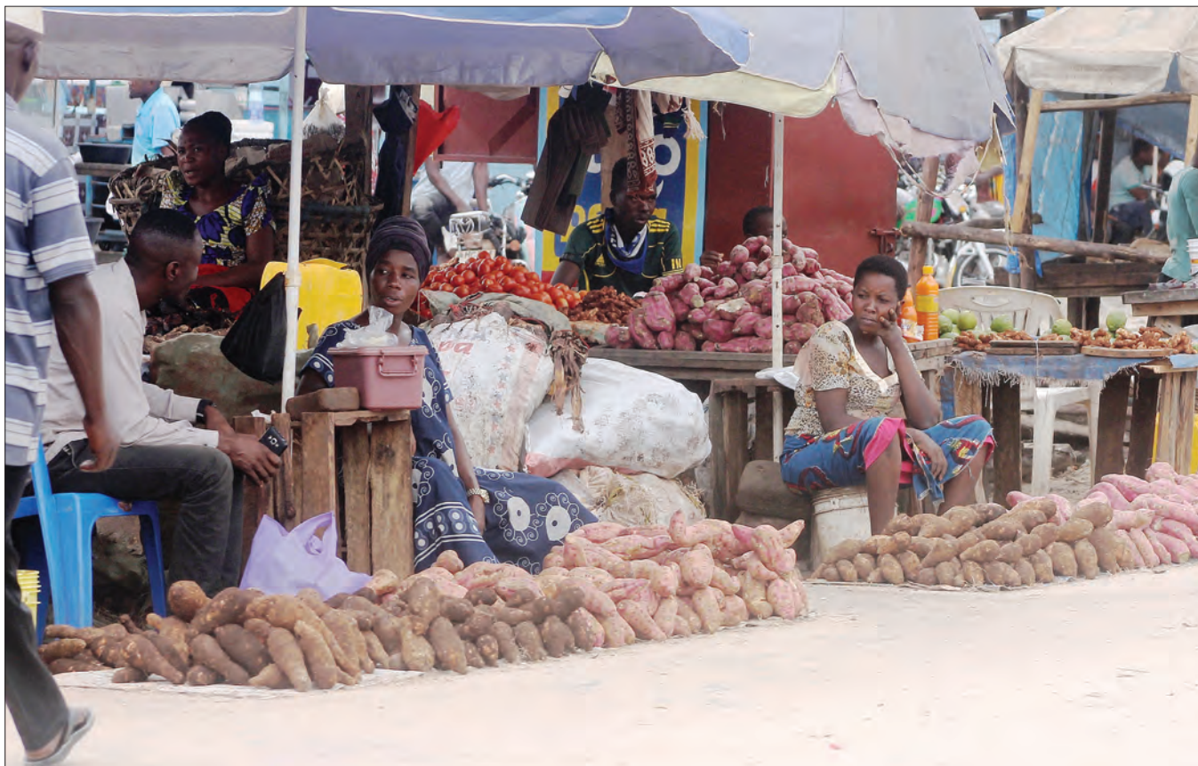
Wafanyabiashara wa viazi vitamu wakisubiri wateja katika eneo la Chanika, nje kidogo ya Jiji la Dar es Salaam jana. Viazi hutumika katika maandalizi ya futari hasa katika kipindi hiki cha Mwezi Mtukufu wa Ramadhani.

"Tumewapa maagizo masheha wote kuhakikisha kwamba wanachukuwa tahadhari ya kujikinga na corona ikiwamo kuorodhesha watu wote wanaoingia katika maeneo yao," alisema.