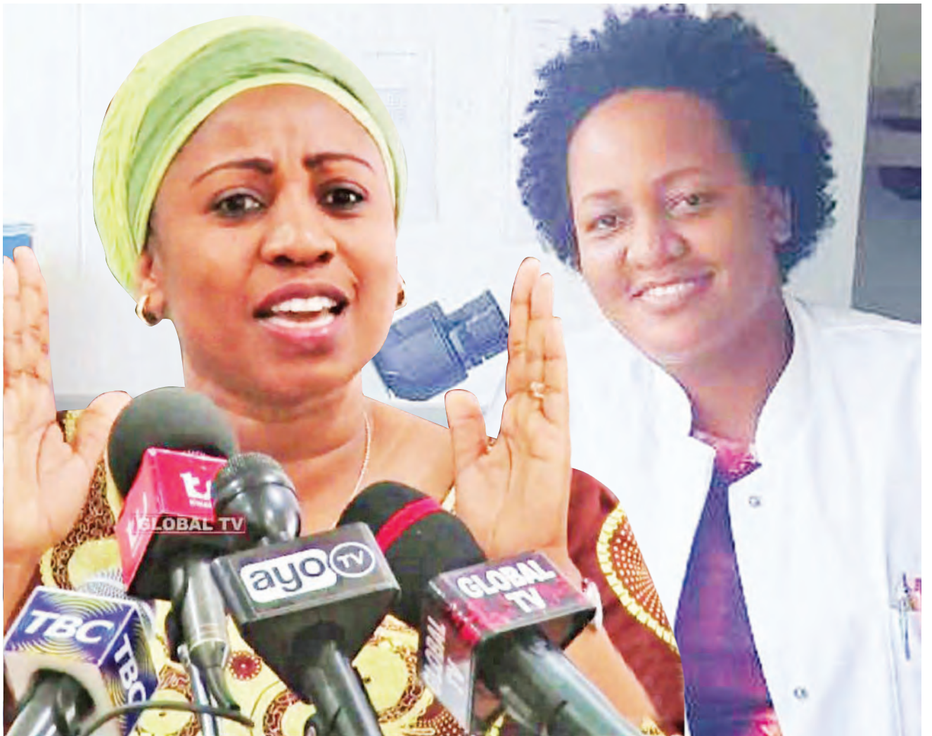
Waziri wa Afya, Maendeleo ya Jamii, Jinsia, Wazee na Watoto, Umyy Mwalimu.