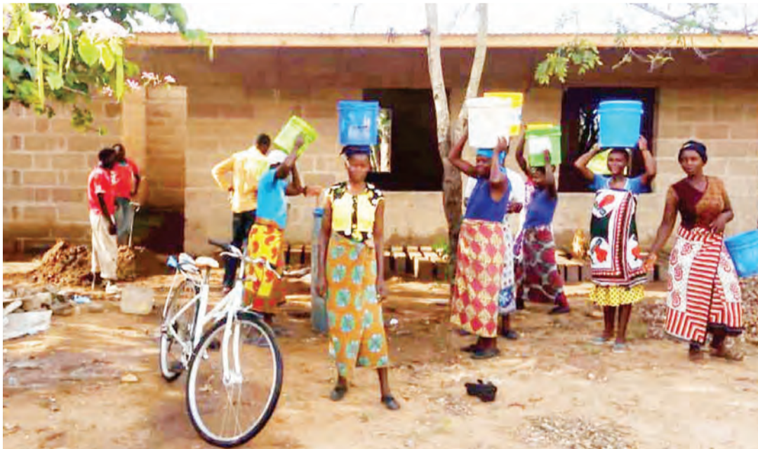
Baadhi ya wakazi wa kijiji cha Kiemba, katika halmashauri hiyo, wakisomba maji kwa ajili ya uboreshaji wa miundombinu ya Shule ya Msingi Murunyigo.

“Wakazi wa Kata ya Busambara yenye vijiji vitatu wameonyesha mfano huo kwani sasa wanajenga