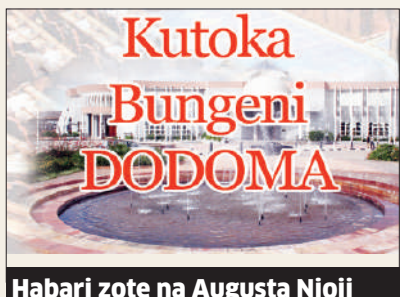
Habari zote na Augusta Njoji

Byabato alisema serikali itahakikisha inakabana na wakandarasi ili kufikisha umeme kwenye maeneo yote kwa kuwa vifaa vimeshanunuliwa, hivyo kazi zilizopangwa zitakamilika.