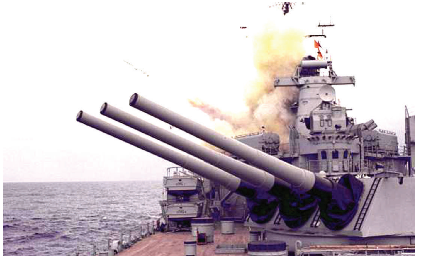
Meli ya kivita ya Russia ikiwa katika bahari nyeusi ikiongoza mashambulizi ya makombora dhidi ya miji ya Ukraine.