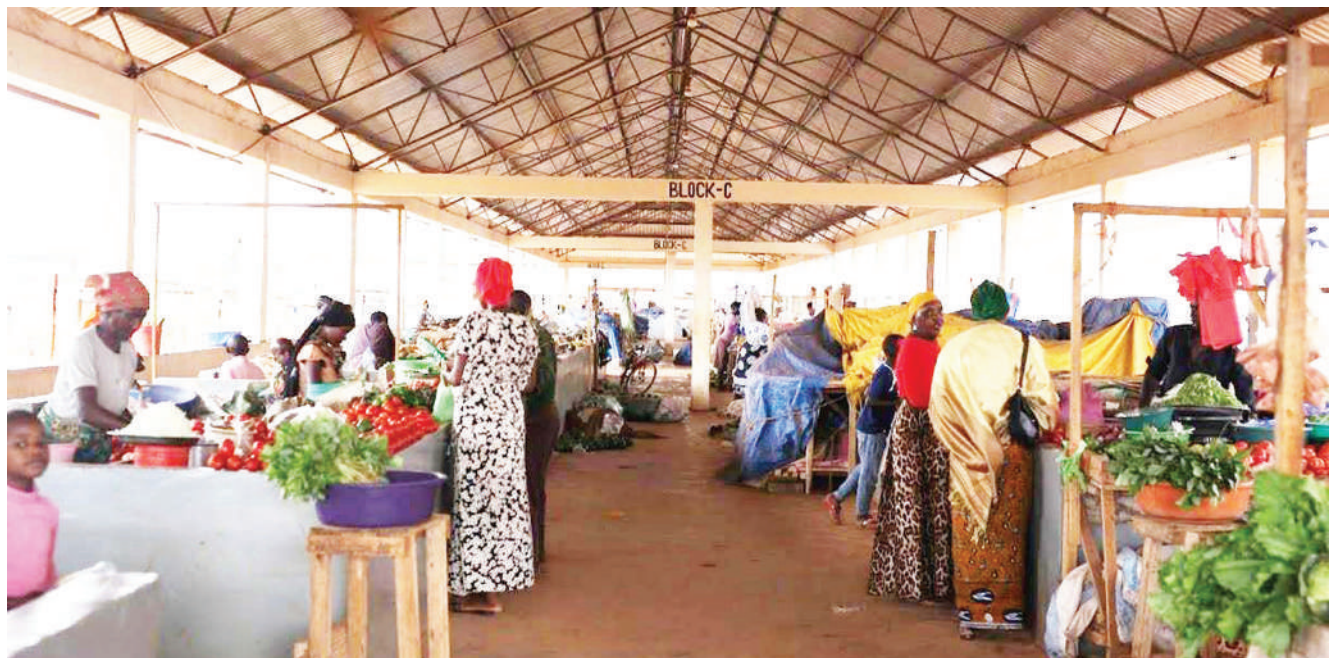
Baadhii ya wananchi wa Mji wa Geita, wakijipatia mahitaji katika soko la kisasa la Katundu juji, lililojengwa kwa ubia baina ya Kampuni ya Geita Gold Mining Ltd (GGML) na Halmashauri ya Mji wa Geita mkoani Geita.

Alisema kama gari linatembea mitaani, watakuwa wanavunja sheria kwa sababu hairuhusiwi kutembea kabla ya kukamilisha malipo ya kodi.