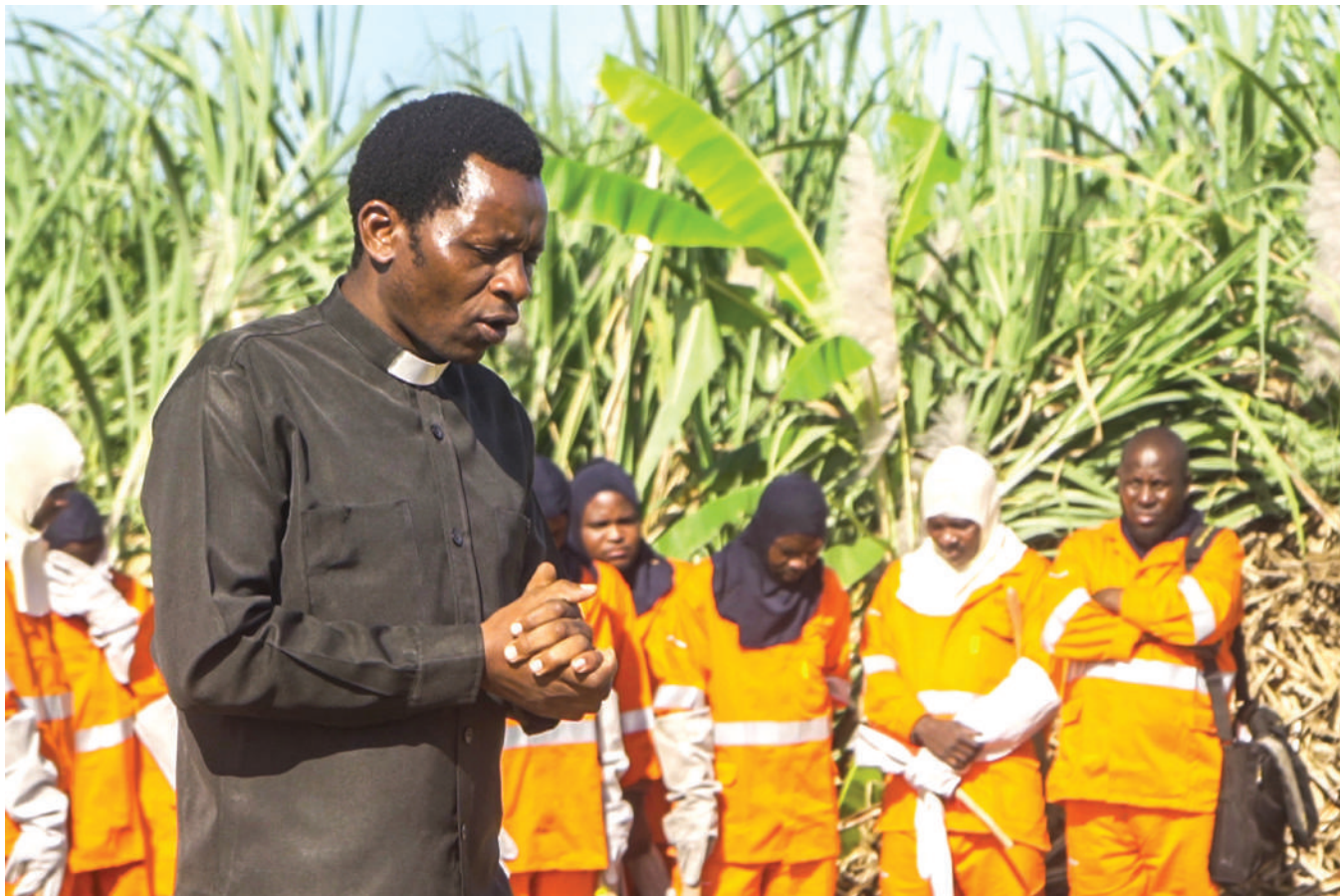
Mmoja wa viongozi wa dini walioshiriki katika uzinduzi rasmi wa msimu wa uzalishaji sukari 2022/23 katika kampuni ya Sukari ya Kilombero (KSCL), mkoani Morogoro mapema wiki hii, akitoa sala fupi kubariki shughuli za uchomaji mashamba na uvunaji wa miwa. Wengine ni kikosi maalumu cha uchomaji.

“Kama kampuni tuna mikakati mbalimbali ya kuhakikisha upatikanaji wa bidhaa hii muhimu. Kuanza uzalishaji mapema ni hatua kubwa na kwa sasa iko katika mradi wa upanuzi ambao unatarajiwa kukamilika Juni 2024 na utaongeza uwezo wa kampuni kuzalisha sukari mara mbili zaidi na kupunguza uhaba wa sukari nchini kupitia chapa ya Bwana Sukari.”