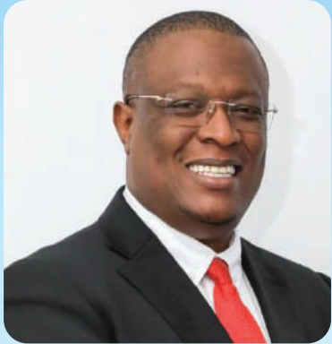
MHE. NAPE NNAUYE WAZIRI WA HABARI, MAWASILIANO NA TEKNOLOJIA YA HABARI