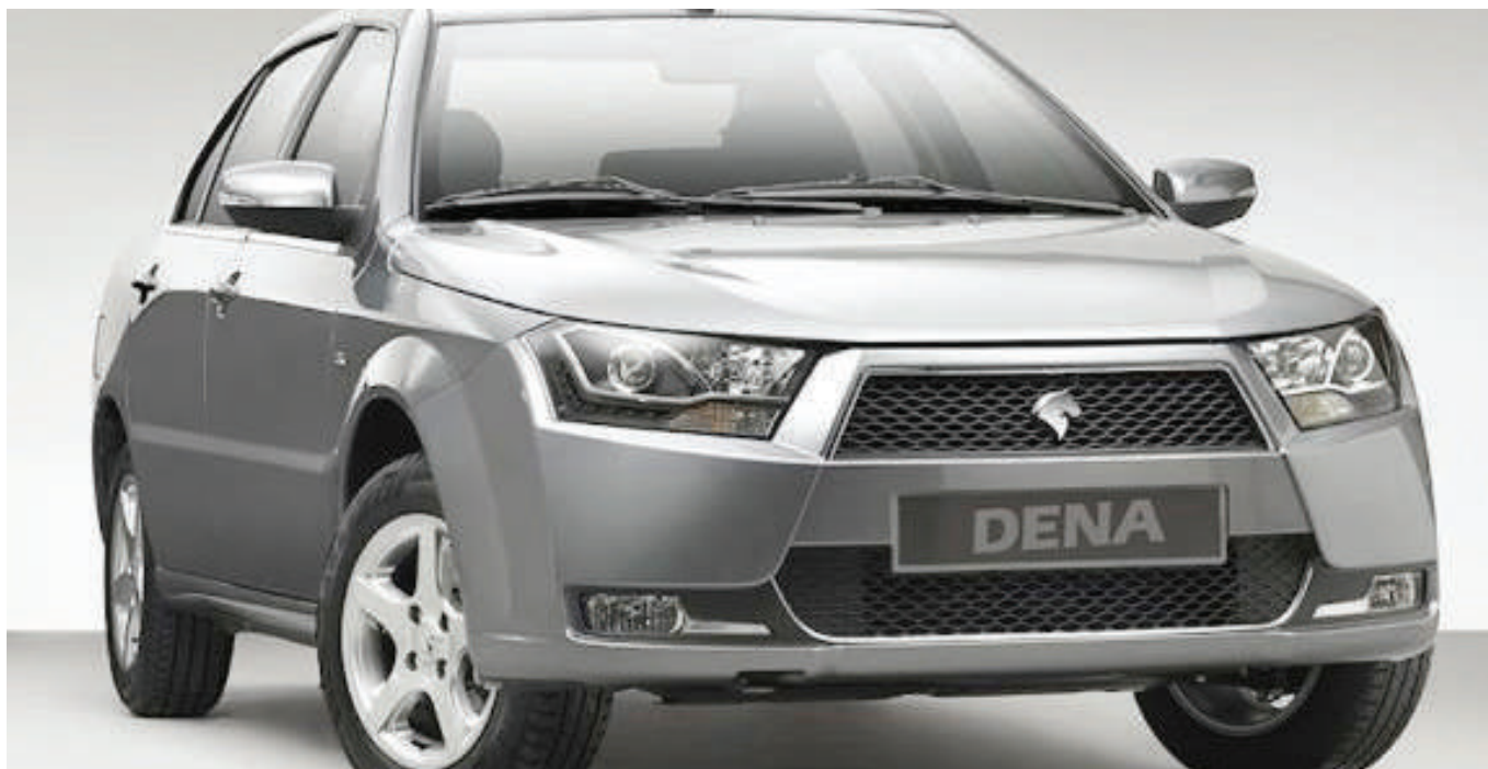
Gari aina ya Dena, inayozalishwa kwa teknolojia ya ndani, nchini Iran.

Iran ni nchi inayosifika duniani kwa kuzaa mafuta na gesi, pia ikitumia vyema utalii wake kuboresha uchumi wake, ingawa sekta hiyo im-