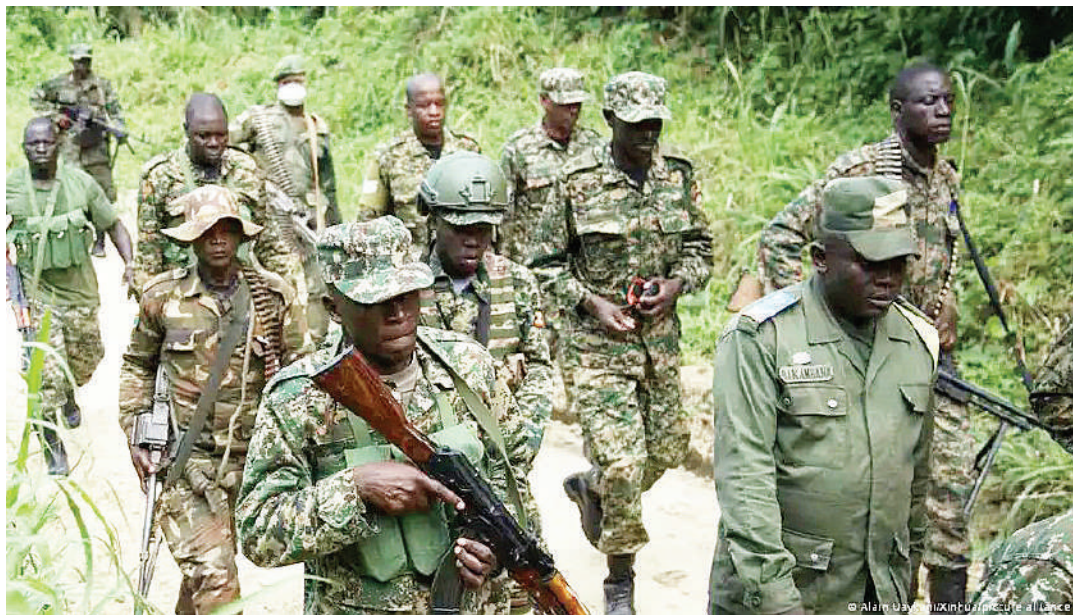
Jeshi la Jamhuri ya Kidemokrasia ya Congo (DRC) ambalo limefanikiwa kuzima jaribio ya waasi wa M23 walipotaka kuutwaa mji wa Sake, jana.

Mwanasheria huyo alidai mgonjwa huyo alikuwa amekamilisha taratibu zote ikiwamo kulipa gharama zote za matibabu na kitanda, lakini mshtakiwa aliendelea kumtaka ampe kiasi hicho cha fedha kama bahashishi yake, ndipo ndugu aliyemsindikiza mgonjwa alipotoa taarifa na mtego ukaandaliwa na kumtia nguvuni.