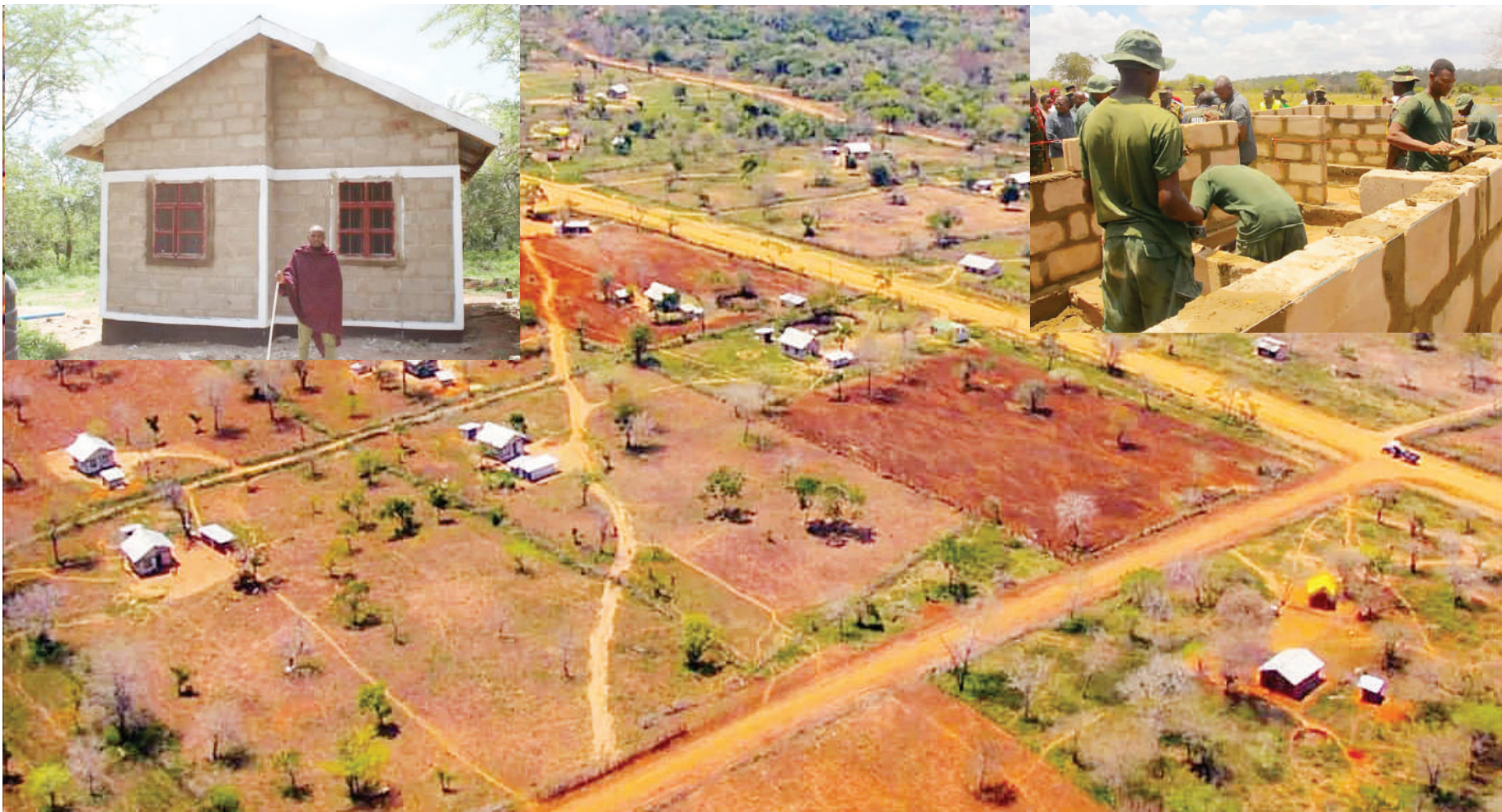
Makazi mapya kijijini Msomera, Handeni shughuli za ujenzi na nyumba mpya zilivyo.