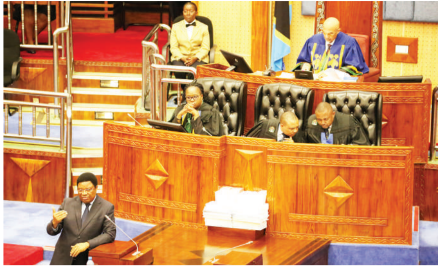
Waziri Mkuu, Kassim Majaliwa aki-jibu maswali yaliyoulizwa na baadhi ya wabunge kwenye kipindi cha maswali ya hapo kwa papo, Bungeni Dodoma jana.