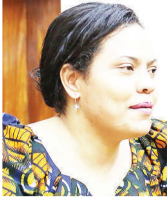
Waziri wa Maliasili na Utalii, Angellah Kairuki