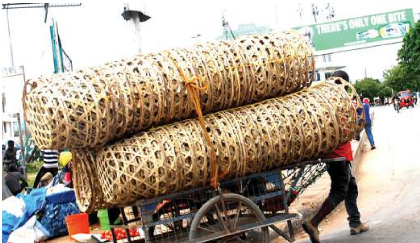
Mkazi wa Jiji la Dodoma, akilikokota tolori alilolisheheni matenga matupu na kumfanya ashindwe kuona nyuma katika Barabara ya Soko Kuu la Majengo, jana, kitendo ambacho ni hatari kwa usalama barabarani.

"Tunashukuru sana kwa kupata dhana hizi ili kutuwezesha kuingia vitani kwa kuwa hata taifa lilipoingia katika vita na Nduli Iddi Amini kuna watu kama nyie walitoa msaada wao ili kuwezesha vita vile, hivyo vifaa hivi vitakua silaha tosha kupambana na corona hapa Kongwa," alisema Mkulo.