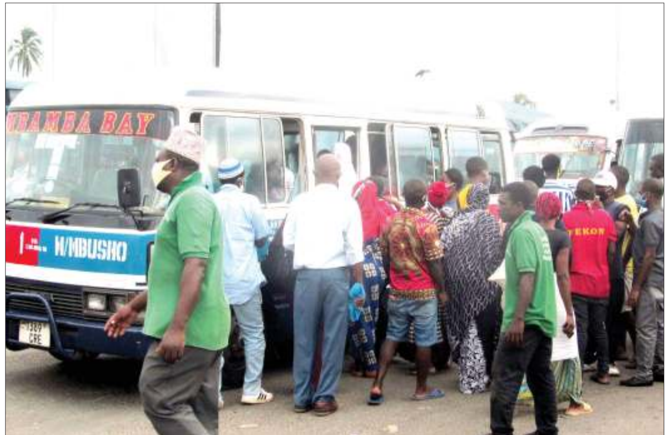
Abiria wakiingia katika daladala kwenye kituo cha Mbezi Mwisho, jijini Dar es Salaam jana, katika mazingira ya kusongamana, ambayo ni hatari kwa maambukizo ya virusi vya corona.

Kutokana na tukio hilo, Jeshi la Polisi limewataka wananchi kuchukua tahadhari dhidi ya wanyama wakali kwa kutoa taarifa wanapoonekana katika makazi ya watu.