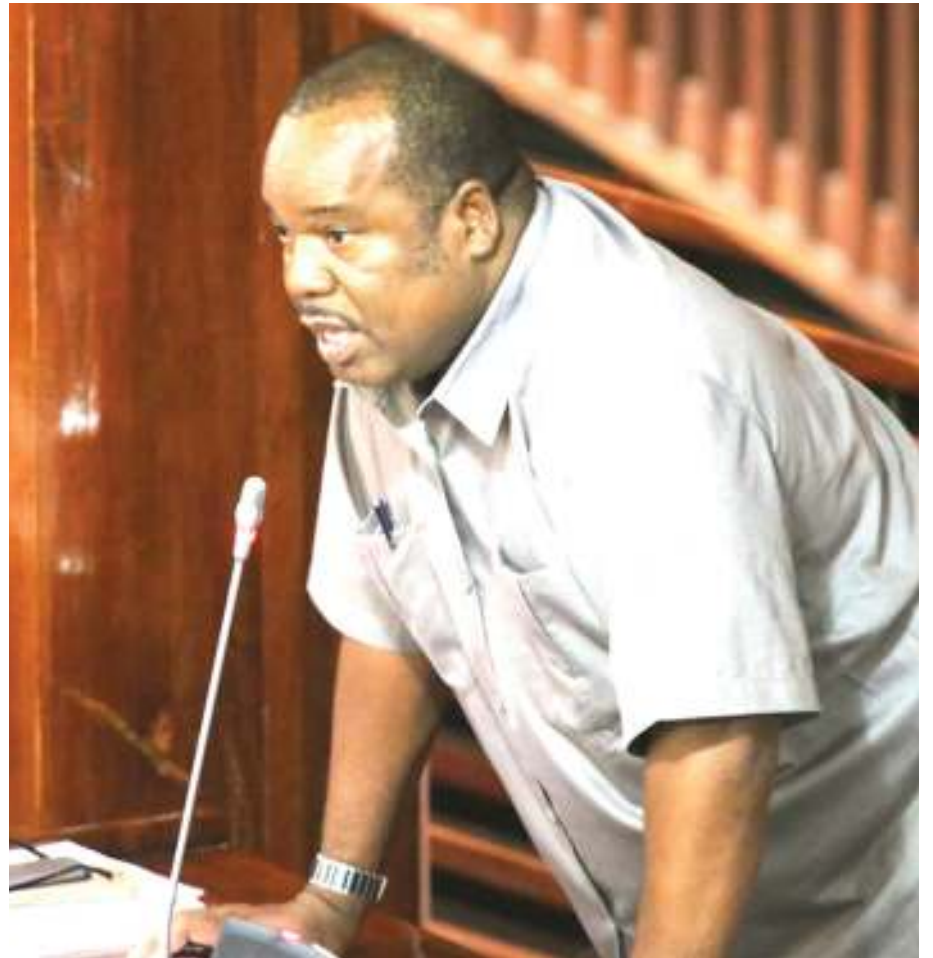
"Katika mazingira hayo mahakama nguvu iliyotumika ya matumizi ya silaha inaweza kumuona/kupima uwiano wa hatari/tishio," ilibainisha.

Aidha, ilisema yapo mazingira ambayo mmiliki wa silaha wakati akijilinda ama kumlinda mtu mwingine ama mali yanaweza kusababisha kifo.