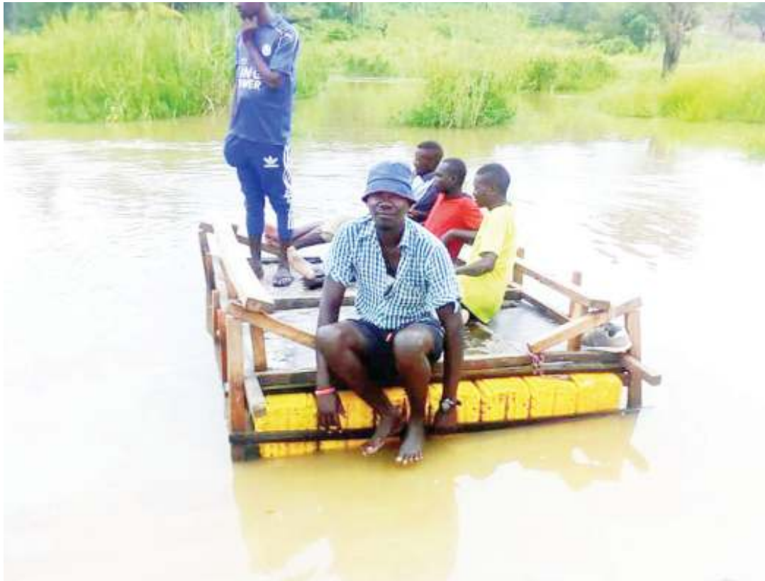
Boti linalowavusha wakazi wa Tambani Mkuranga.

“Watu walihamia wengi, wamejenga maduka makubwa ya biashara, lakini tokea mvua iharibu miundombinu, baadhi ya wafanyabiashara wamefunga maduka yao.”