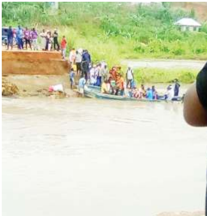
Wakazi wa Tambani Mkuranga, wakivuka mto Kifaulongo, kuelekea jijini Dar es Salaam, kwa mfumo wa kivuko uliopo sasa

“Watu walihamia wengi, wamejenga maduka makubwa ya biashara, lakini tokea mvua iharibu miundombinu, baadhi ya wafanyabiashara wamefunga maduka yao.”