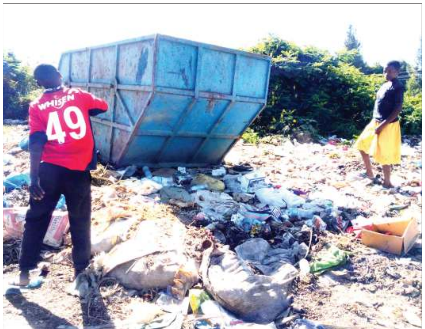
Baadhi ya wakazi wa Mtaa wa Manga-Veta, Kata ya Ilemi katika Halmashauri ya Jiji la Mbeya, wakitupa taka kwenye dampo la halmashauri hiyo, lenye mrundikano wa takataka na kutelekezwa bila ya kuondolewa kwa miezi miwili sasa, licha ya watendaji wa mitaa na wenyeviti kutoza kila familia Sh. 1,000 kwa mwezi kama gharama ya shughuli hiyo.

Baada ya kusomewa mashtaka yake, mshtakiwa hakutakiwa kujibu chochote kwa kuwa mahakama hiyo haina mam-laka ya kisheria ya kusikiliza shauri hilo na mtuhumiwa amepolekwa rumande mpaka Mei 27, mwaka huu kesi hiyo itakapomwa tena.