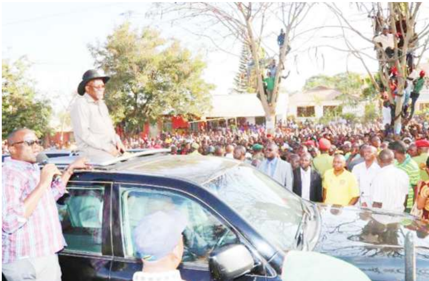
Rais Dk. John Magufuli, alipozungumza na wakazi wa Jiji la Mwanza, mahali alikoishi na kufanya kazi.