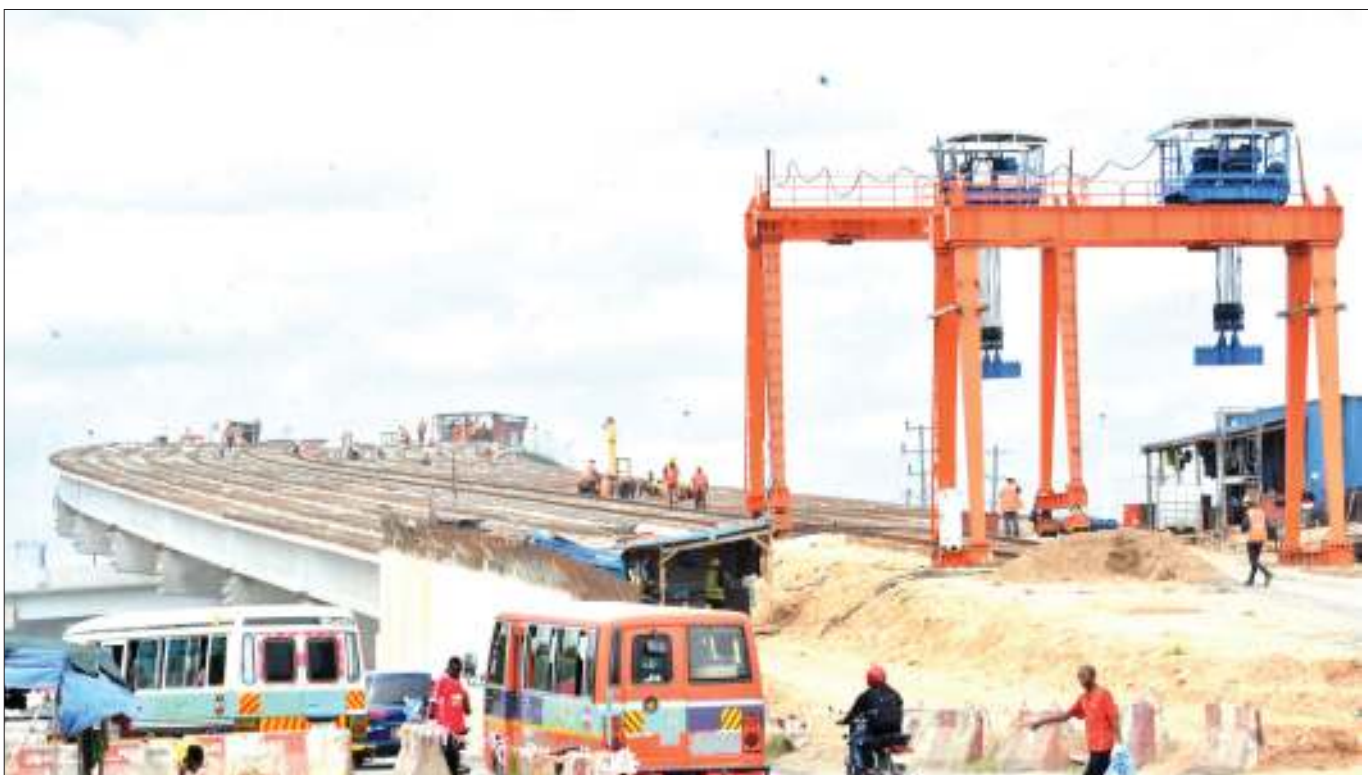
Mafundi wakiendelea na ujenzi wa daraja la juu la mpishano la Ubungo (Ubungo Interchange), katika makutano ya Barabara za Morogoro, Sam Nujoma na Mandela jijini Dar es Salaam jana.

Ndege itakapowasili, abiria watafuata masharti yaliyowekwa na Serikali ya Tanzania kwa kuwatenga.