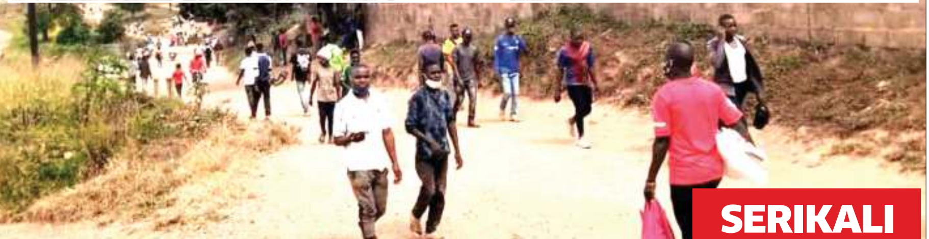
Baadhi ya wakazi wa Nakonde nchini Zambia, wakipita katika njia isiyo rasmi, katika mpaka wa Tanzania na nchi hiyo uli-ufungwa, wakivuka kwenda eneo la Tunduma, mkoani Songwe jana, kujipatia mahitaji mbalimbali.