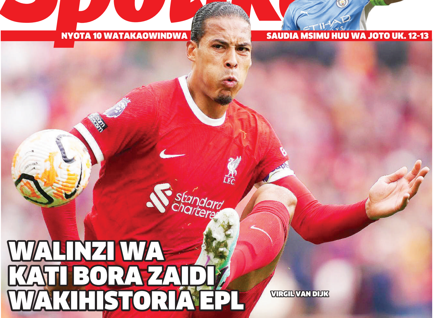
VIRGIL VAN DIJK