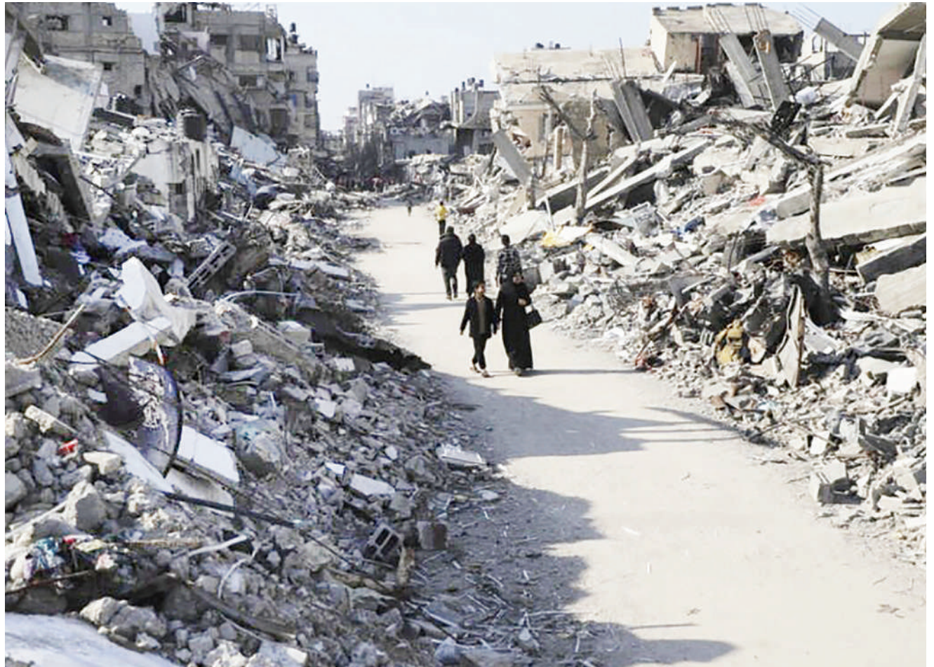
Wananchi wa Palestina wakitembea katikati ya magofu na vifusi vya makazi yao yaliyoharibiwa na mashambulizi ya Israel.

Wanajeshi wengine wawili wa Afrika Kusini waliuawa mwezi uliopita kupitia shambulizi la kombora, tukio lililosababisha vyama vya upinzani vya Afrika Kusini kudai kwamba walitumwa DRC bila kuwapo kwa mipango ya kutosha ya kiufundi. VOA