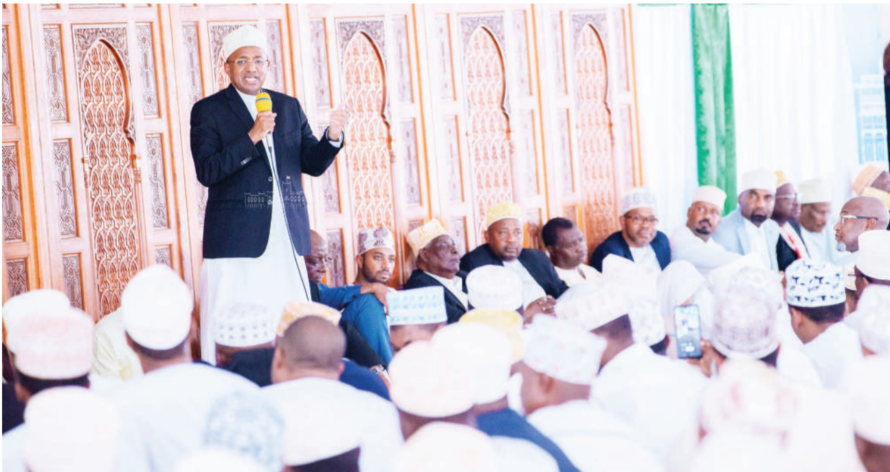
Rais wa Zanzibar, Dk. Hussein Ali Mwinyi, akizungumza wakati wa dua maalum (khitma) ya Rais Mstaafu wa Awamu ya Pili, Hayati Ali Hassan Mwinyi, kwenye viwanja vya maonyesho Nyamazi Mkoa wa Mjini Magharibi, Zanzibar jana.