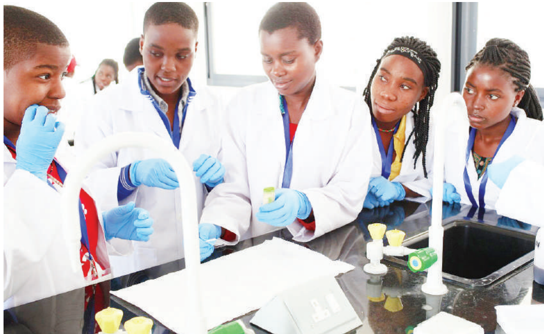
Wasichana wakiandaliwa kuwa wataalamu wa sayansi kwenye maabara.

Tanzania ya sayansi na teknolojia itafikiwa endapo uwekezaji mkubwa na endelevu