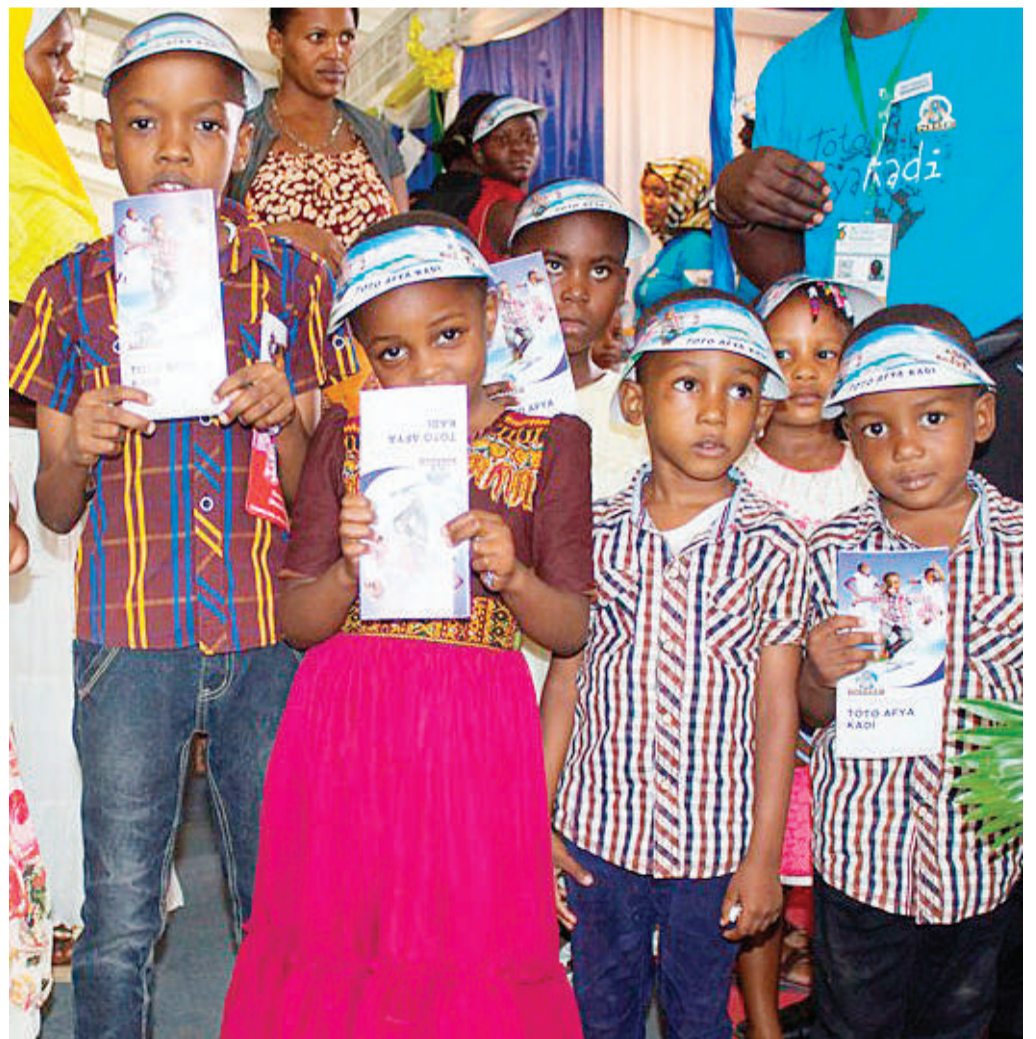
Baadhi ya watoto waliofaidika na Toto Kadi.

“Katika hili tunaonea sana NHIF, kila mwananchi atimize wajibu wake kwa kuwa tayari serikali imeweka mazingira wezeshi kupitia Mfuko wa Taifa wa Bima ya Afya.”