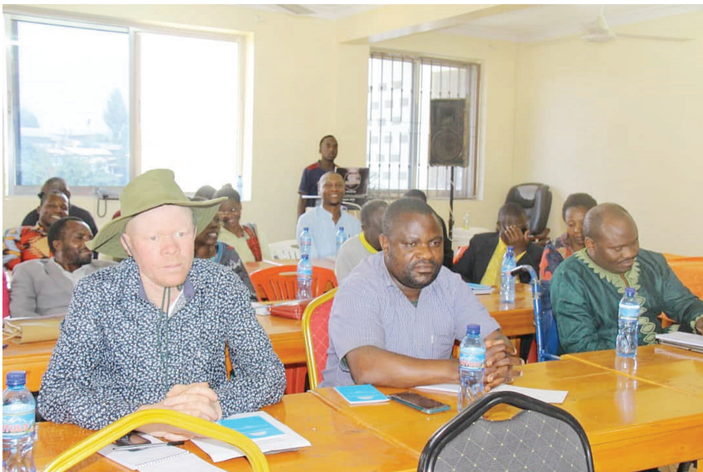
Baadhi ya walimu wenye ulemavu wa aina mbalimbali mkoani Mbeya, wakiwa kwenye kikao na viongozi wa Chama cha Walimu nchini (CWT), mwishoni mwa wiki kilichokuwa na lengo la kujadili kero mbalimbali zinazowakabili kundi hilo.

Ujenzi wa Zahanati ya Ndandaro umekamilika hivi karibuni na kabla haijaanza kutoa huduma kwa wananchi ilizinduliwa na Mwenge wa Uhuru wiki iliyopita.