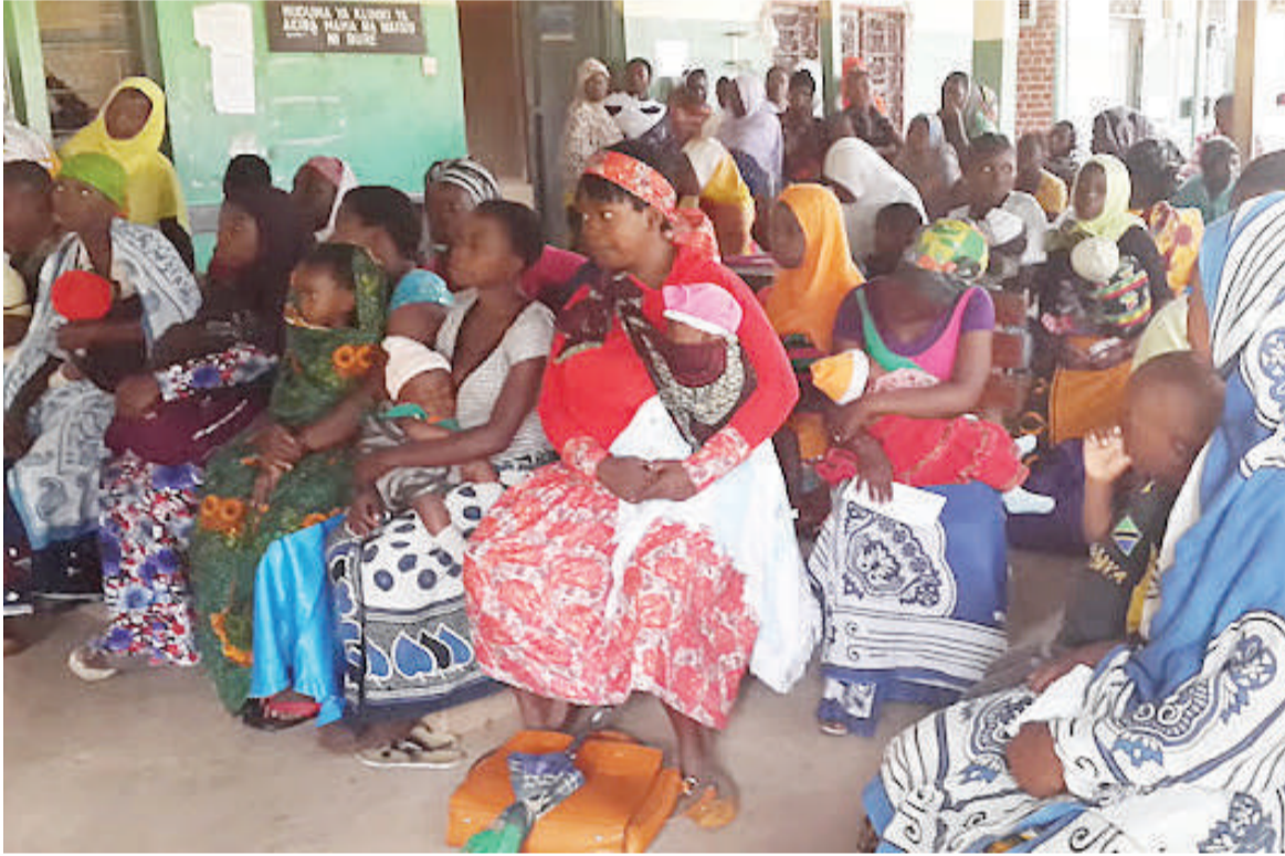
Kinamama wakipewa elimu ya Toto Kadi na Mfuko wa Taifa wa Bima ya Afya (NHIF).