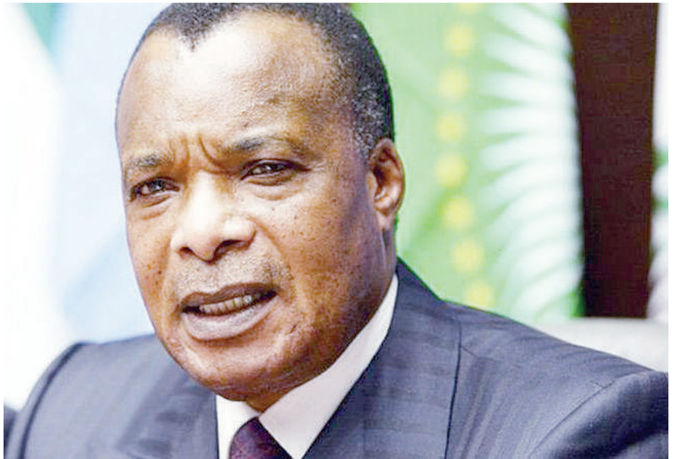
Rais Denis Nguesso.

Katika wiki za hivi karibuni, baadhi ya wakazi wa jiji hilo na taasisi kama vile hospitali, zimekosa maji na kusababisha taharuki kwa umma. BBC