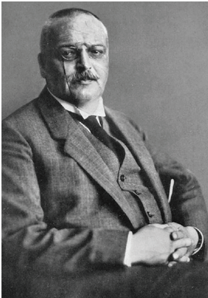
Dk. Alois Alzheimers mgunduzi wa ugonjwa wa usahaulifu.