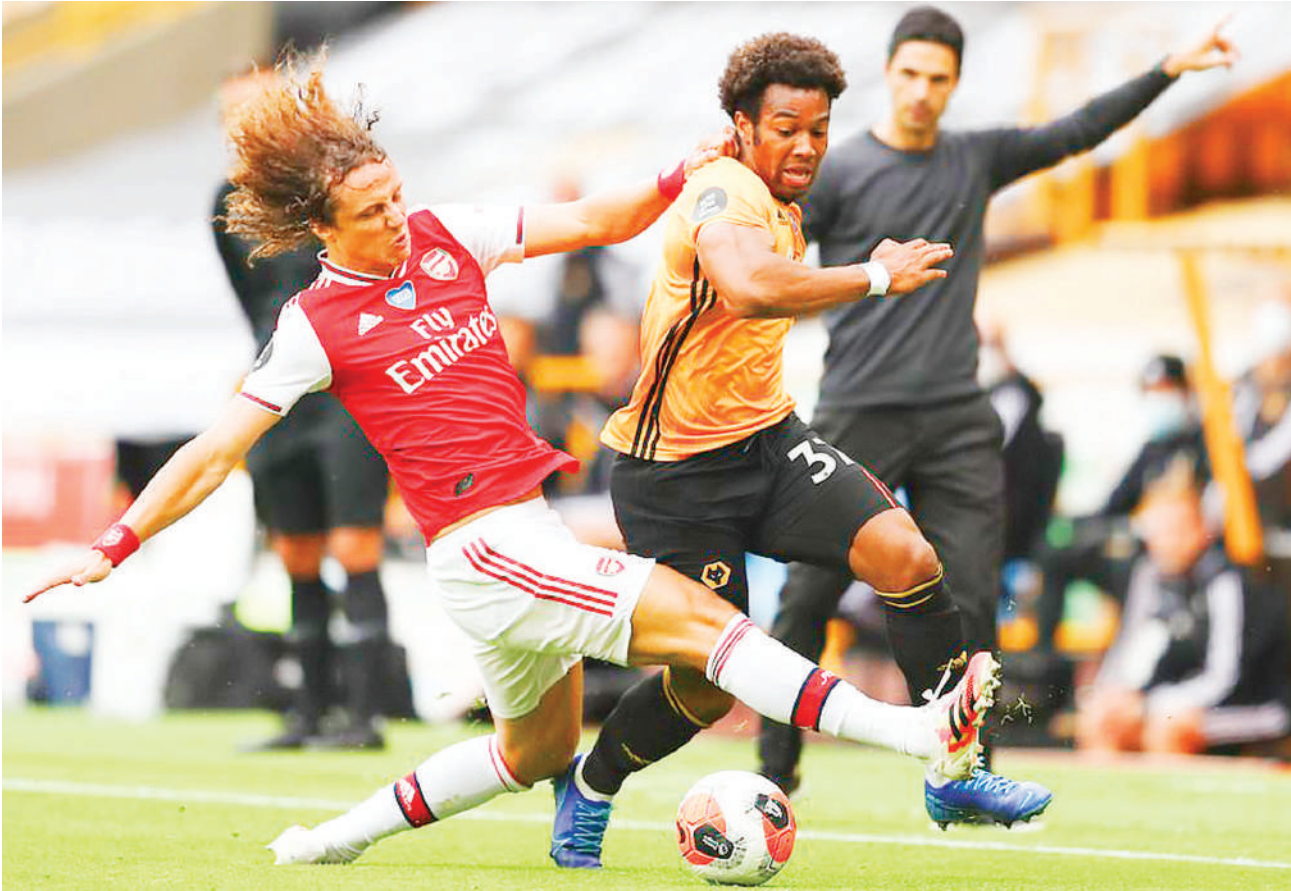
Beki wa kati wa Arsenal, David Luiz (kushoto), akipambana kuwania mpira dhidi ya straika wa Wolves, Adama Traore katika mechi ya Ligi Kuu England iliyochezwa kwenye Uwanja wa Molineux juzi usiku. Arsenal ilishinda mabao 2-0.