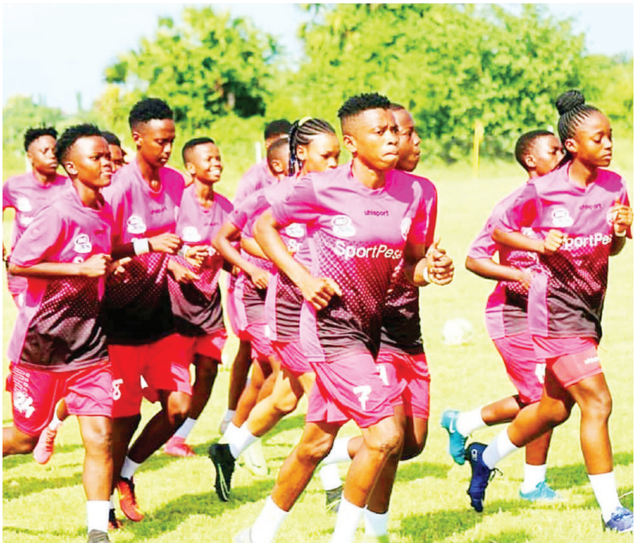
Wachezaji wa Simba Queens wakifanya mazoezi kujiandaa na mechi ya Ligi Kuu ya Wanawake Tanzania dhidi ya JKT Queens itakayochezwa leo kwenye Uwanja wa Simba Mo Arena ulioko Bunju jijini, Dar es Salaam.

Mechi nyingine ya ligi hiyo itakayochezwa leo ni kati ya Alliance Girls dhidi ya Panama Girls wakati Baobab Queens watawakaribisha Marsh Queens huku Yanga Princess watawafuata Mlandizi Queens kwenye Uwanja wa Mabatini Mlandizi, mkoani Pwani.