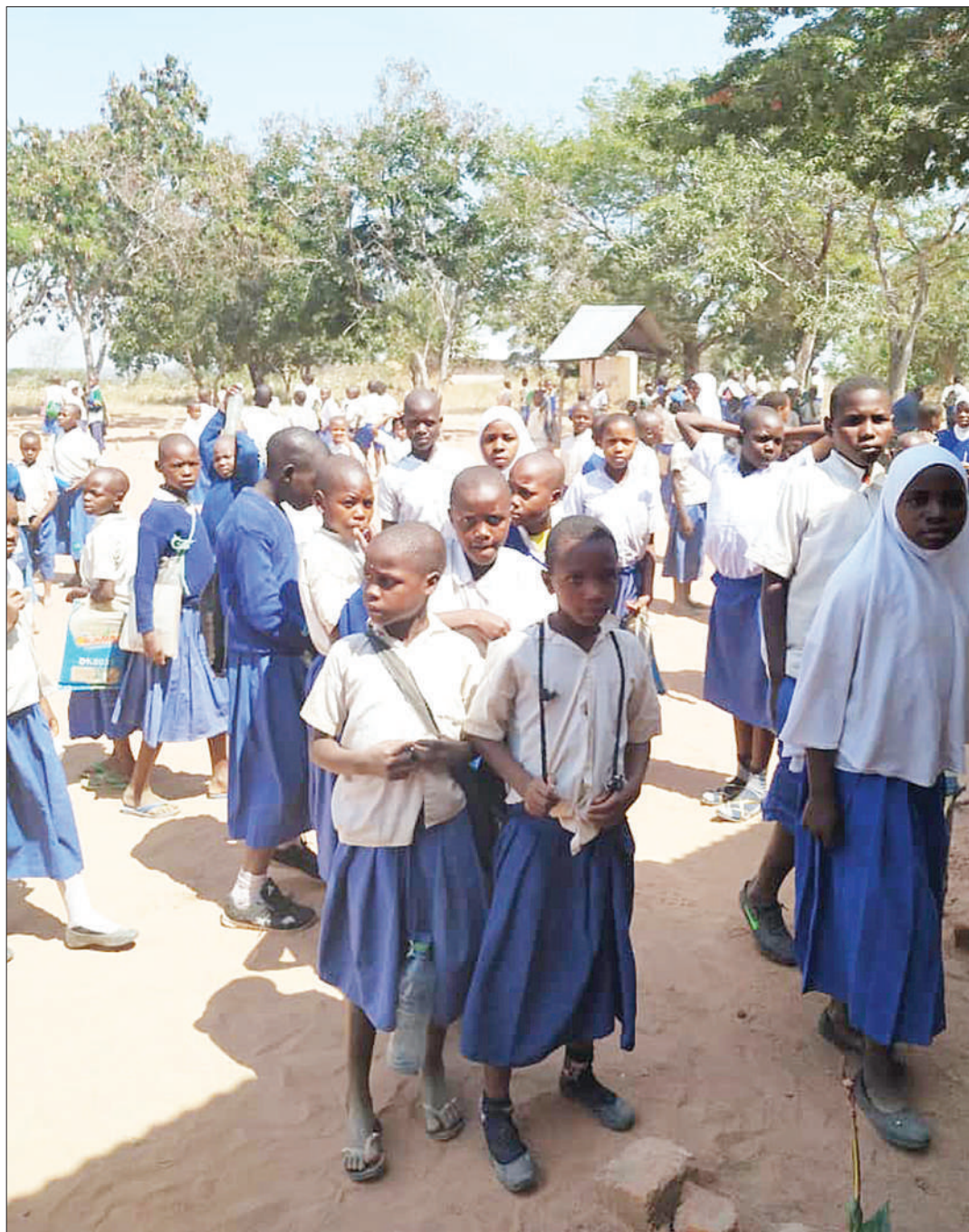
Wanafunzi wa Shule ya Msingi Luzilukulu, Wilaya ya Iramba, mkoani Singida, wakiwa kwenye viwanja vya shule hiyo.

Lailat alisema kuwa anatanani na yeye angekuwa na uwezo wa