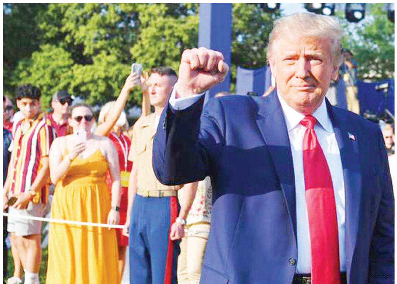
Rais wa Marekani, Donald Trump, akiinua mkono baada ya kuwasili katika sherehe za kuadhimisha Siku ya Uhuru wa Taifa hilo mjini Washington.

Hatua hiyo imeiweka Rwanda mbele kati ya nchi za Uganda na Kenya ambazo bado hazijafungua shughuli zake za ndege. BBC