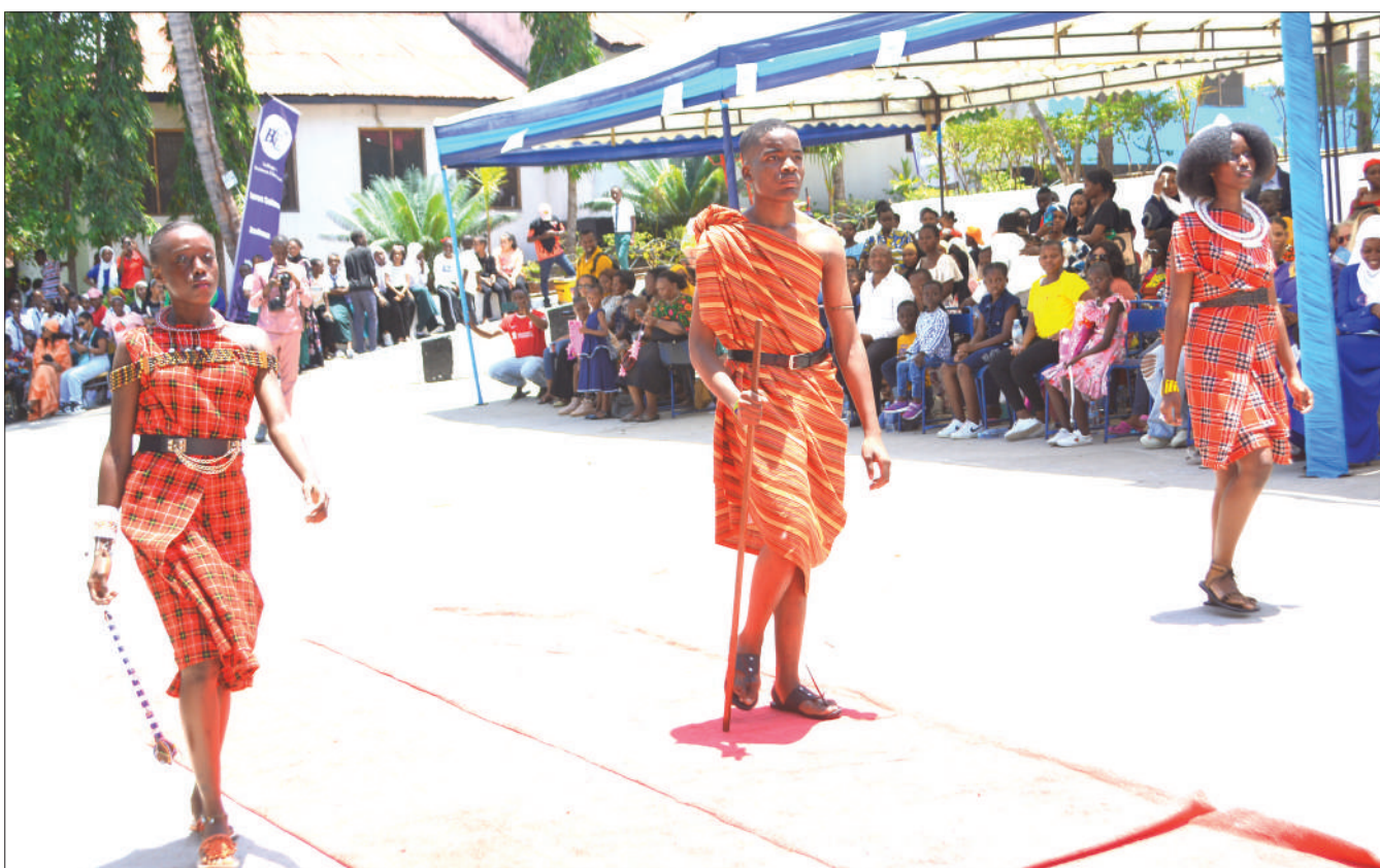
Wanafunzi wa Shule ya Sekondari St Mary's Mbezi Beach wakionesha umahiri wao kwenye mitindo ya mavazi wakati wa mahafali ya 22 ya kidato cha nne ya shule hiyo yaliyofanyika mwishoni mwa wiki jijini Dar es Salaam.

"Tumefurahi kuona vipaji vya wanafunzi hawa kwenye michezo mbalimbali na duniani hapa ziko njia nyingi za kufikia mafanikio kwa hiyo kuna mwanafunzi anaweza asiwe mzuri sana darasani lakini akawa na kipaji kwenye kuimba, mpira wa miguu, kikapu na vikampa mafanikio makubwa sana kwa hiyo ningependa shule zingine nazo zive na program za kuibua vipaji," alisema.