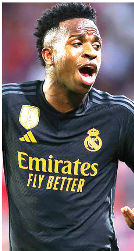
Kupitia ukurasa wake wa X, ambayo zamani ilijulikana kama Twitter, baada

Real Madrid, ambao kwa sasa ndio vinara wa LaLiga walitoka sare ya 1-1 ugenini kwa Sevilla kwenye Uwanja wa Ramon Sanchez-Pizjuan Jumamosi jioni.