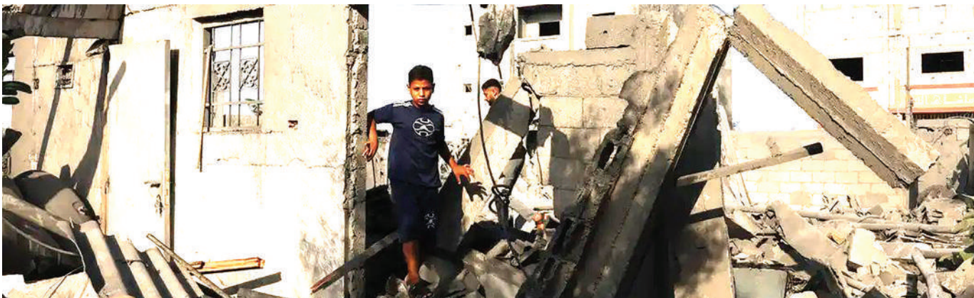
Wapalestina wakiangalia sehemu ya madhara ya mashambulizi ya Israel kwenye kiunga cha Rafah kusini mwa Gaza, jana.