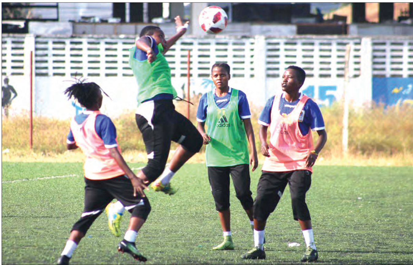
Wachezaji wa Timu ya Taifa ya Soka ya Wanawake (Twiga Stars), wakiwa katika mazoezi kwenye Uwanja wa Karume jijini Dar es Salaam kwa ajili ya kujiandaa na mechi mbalimbali za kufuzu kushiriki mashindano ya Kombe la Afrika zitakazofanyika baadaye mwaka huu.

Tayari Simba yenye pointi 79 imeshatwaa ubingwa wa ligi hiyo kwa mara ya nne mfululizo huku Mwadui FC ya mkoani Shinyanga nayo imeshashuka daraja.