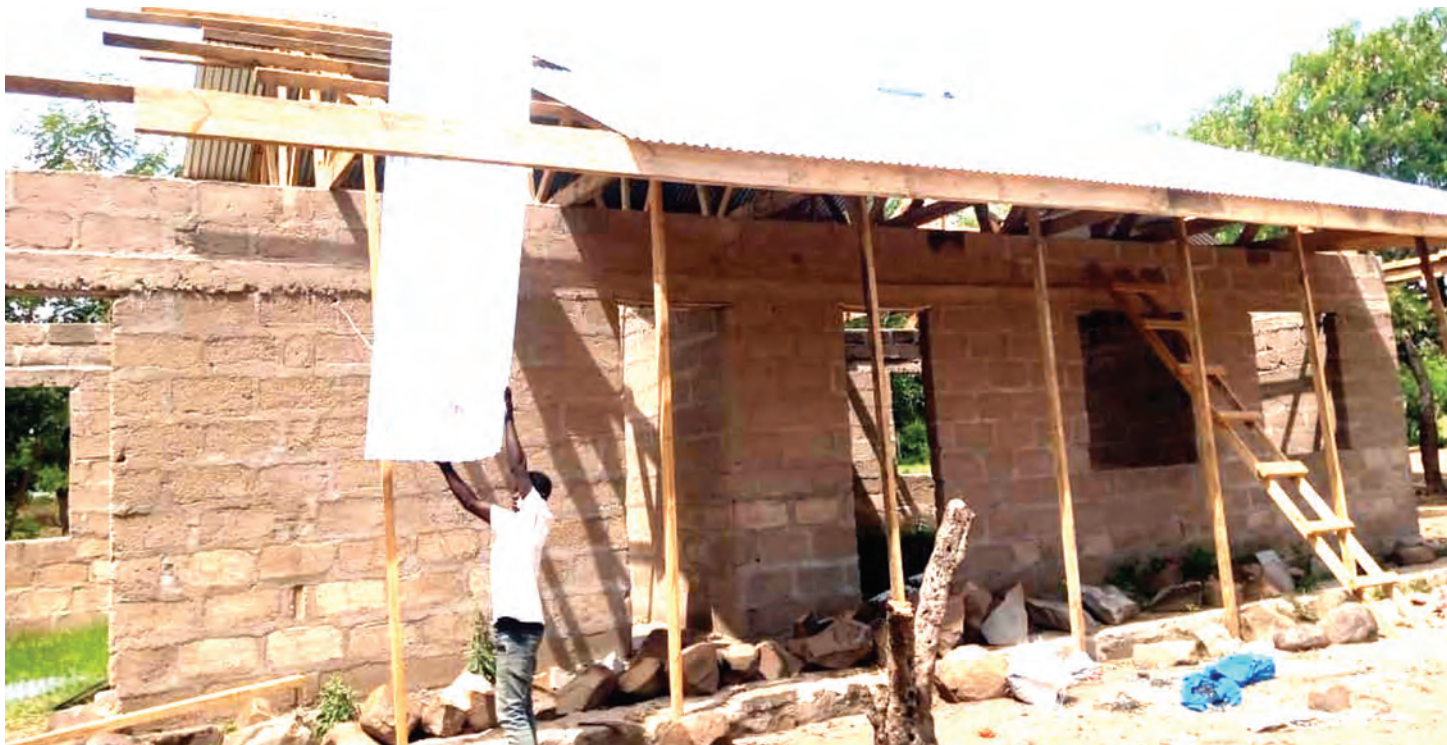
Madarasa ya Shule ya Msingi Nyasaungu mkoani Mara yanayojengwa kwa nguvu za wananchi.

B AADHI ya wanavijiji wanaotambua umuhimu wa elimu wanafanya kila jitihada ili kufanikisha masomo ya watoto wao katika mazingira rafiki na salama.