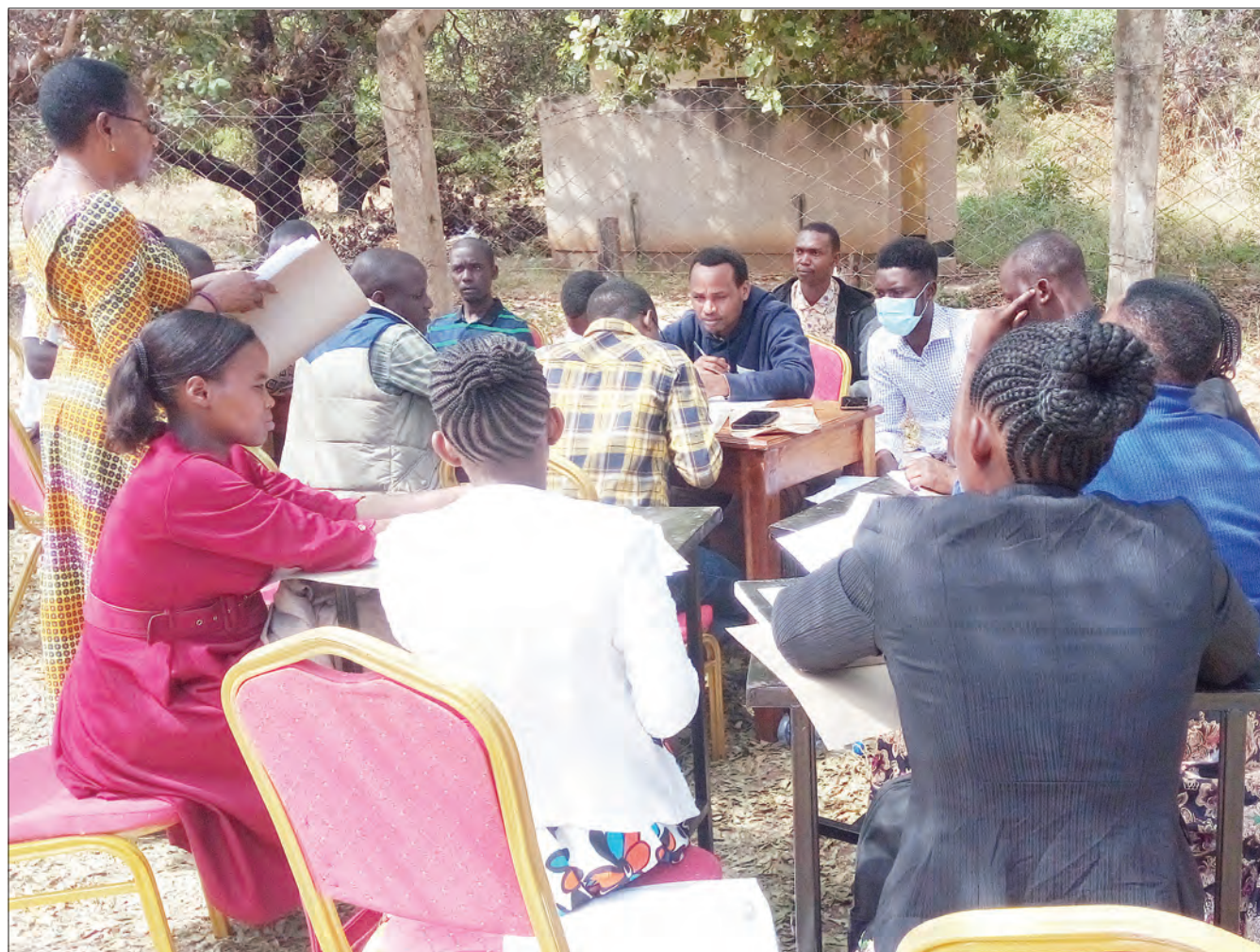
Watumishi wapya 82 wa Idara ya Afya na Elimu waliopangiwa kazi Halmashauri ya Wilaya ya Nanyumbu mkoani Mtwara wakijaza mikataba yao ya kazi baada ya kuripoti wilayani humo, kwa ajili ya kuanza kazi kwenye vituo vyao. Watumishi hao 62 ni walimu na 20 wa Idara ya Afya walikusanyika katika ofisi ya za halmashauri jana.

Prof. Kihampa aliwasisitiza wananchi kuepuka kupotoshwa na watu wanaojitua mawakala au washauri wanaodai kutoa huduma ya namna ya kujiunga na vyuo.