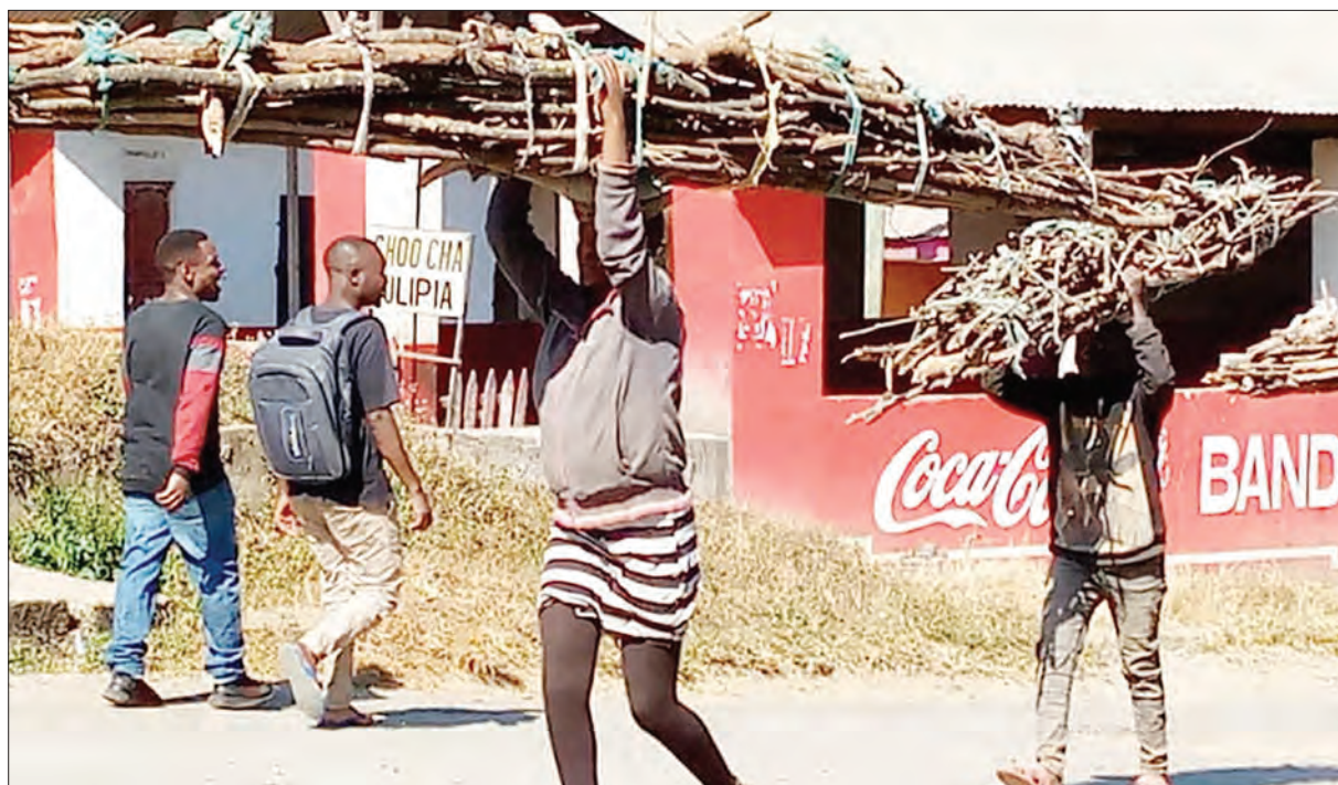
Baadhi ya watoto wakipita katika eneo la Sokoine jijini Mbeya, huku wakiwa wamejitwisha mizigo ya kuni wakipeleka sokoni mwishoni mwa wiki.