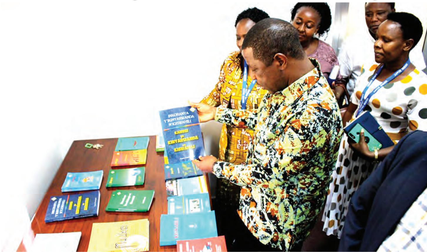
Wadau wakijichagulia vitabu vya Kiswahili katika duka lililoko Chuo Kikuu cha Dar es Salaam.

J ITIHADA za kuendeleza matumizi ya Kiswahili katika nyanja tofauti za maisha na uchumi kwa jumla zinaendana na juhudi za taasisi zinazohusika na kukua kwa lugha kutoa mwanga pale ambapo kuna hitilafu katika matumizi ya lugha.