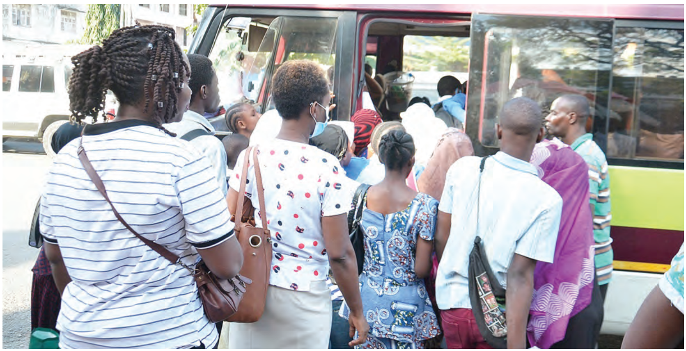
Abiria wakipanda gari kwa kugombania huku wakiwa hawajachukua hatua za kujikinga na ugonjwa wa corona katika kituo cha mabasi Mnazi Mmoja jijini Dar es Salaam jana.