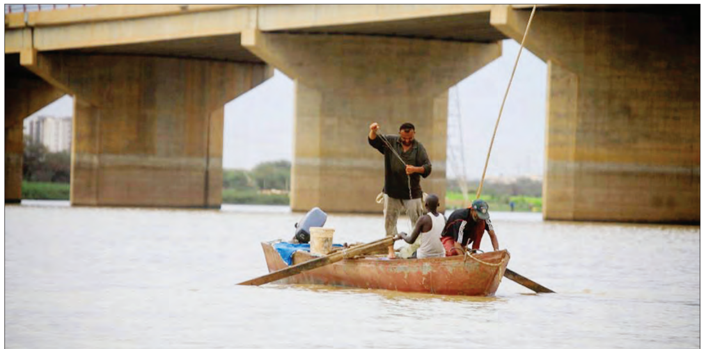
Wavuvi wakivua samaki kwenye Mto Nile, uliokatisha kwenye daraja mjini Khartoum, nchini Sudan, mwishoni mwa wiki.