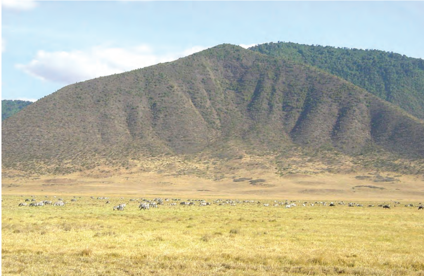
Hifadhi ya Bonde la Ngorongoro ni moja ya maajabu ya dunia yanayovutia watalii wengi.

T ANZANIA imesheheni vivutio vingi vya utalii na ipo juu kwenye chati kutokana na kuwapo hifadhi nyingi za taifa, mito, Mlima Kilimanjaro, maziwa kadhaa na pia uwepo wa Bonde la Ngorongoro, wanamoishi binadamu na wanyamapori.