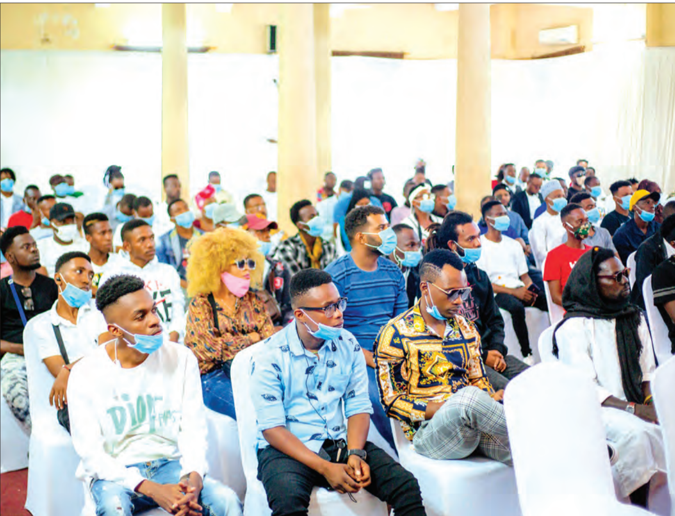
Wasanii mbalimbali wa muziki kutoka Zanzibar, wakifuatilia kwa umakini semina maalumu juu ya namna bora ya kukuza vipaji vya muziki visiwani humo. Semina hiyo ni sehemu ya Tamasha la Zuchu Home Coming na Zantel litakalofanyika Agosti 21, katika Viwanja vya Amani Zanzibar.

"Ni kweli tumechukua ubingwa kwa kuwafunga Yanga ikiwa pungufu na kushinda bao 1-0 kwamba wapinzani wao ni wagumu, haijalishi hilo kwa sababu Simba ni Bingwa wa ligi na hii FA, tena mfululizo," alisema Lwanga.