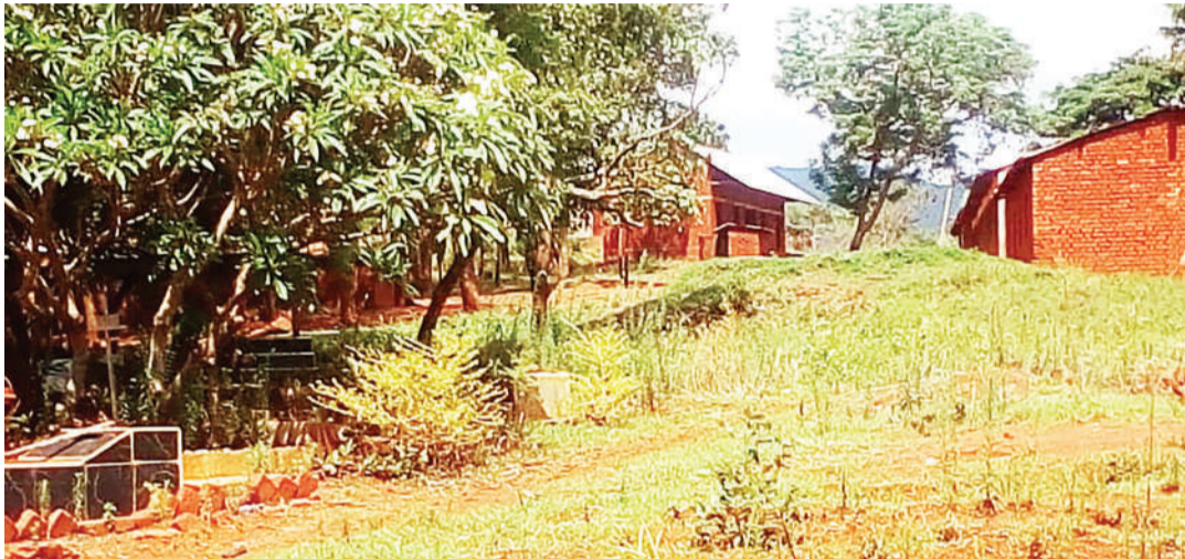
Sehemu ya eneo la makaburi karibu na madarasa ya Shule ya Msingi Lipumba, wilayani Mbinga, mkoa wa Ruvuma.

"Sisi (kanisa) hivi sasa hatuna uwezo wa kujenga ukuta kutenganisha makaburi na madarasa, lakini tumeamua kupanda miti mpakani mwa shule na eneo la makaburi. Miti hii ikishakua itawazuia wanafunzi kuona kina-