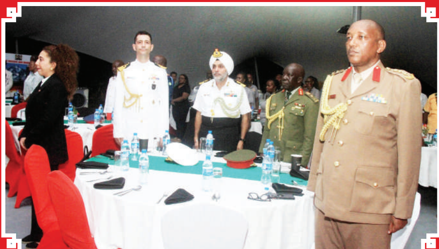
Baadhi ya Maofisa wa Ulinzi wakitoa heshima wakati nyimbo za taifa zikiimbwa katika hafala ya miaka 61 ya uhuru wa Kenya iliyofoyanyika jijini Dar es Salaam.