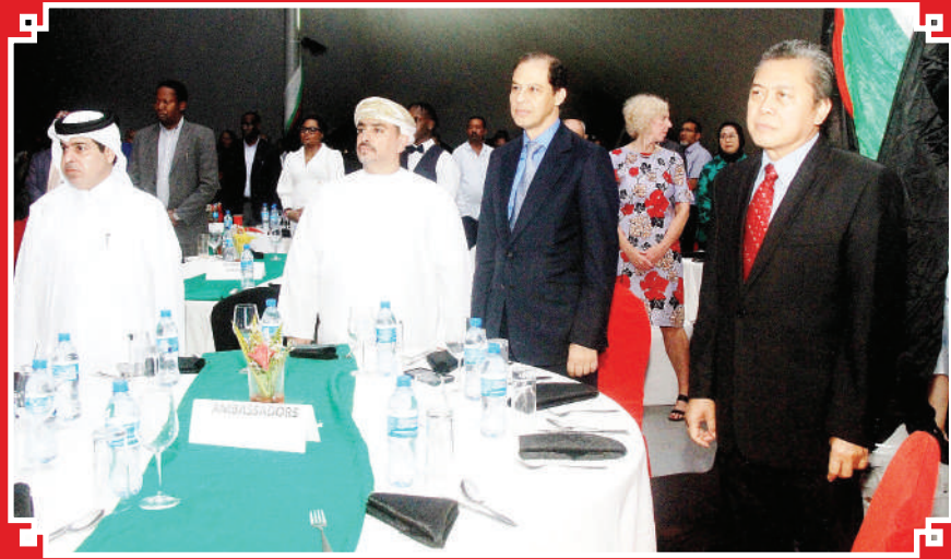
Baadhi ya mabalozi wakiwa wameziwakilisha nchi zao katika hafala ya miaka 61 ya uhuru wa Kenya iliyofoyanyika jijini Dar es Salaam.