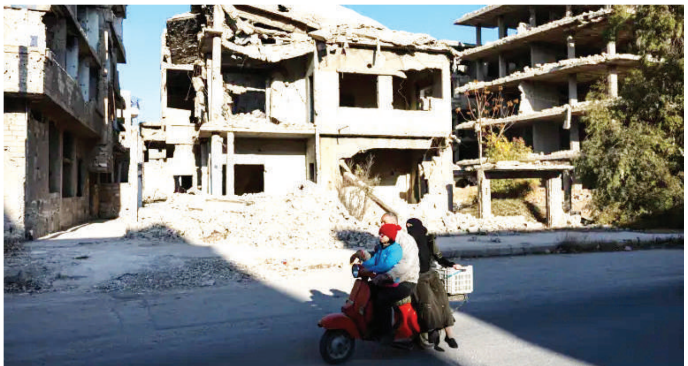
Mwanaume wa Syria akiendesha pikipiki yake akiwa amebeba familia yake, wakiwa wanayakimbia makazi yao yaliyoaharibiwa kutokana na mashambulizi yaliyofanywa katika mji wa Harasta Mashariki nje kidogo ya Damascus jana.