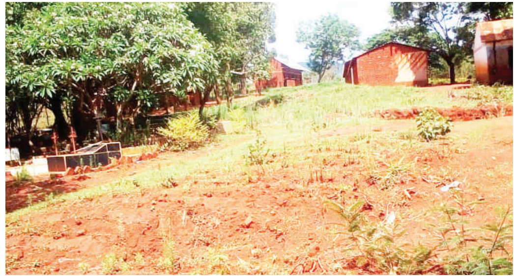
Sehemu ya eneo la makaburi karibu na madarasa ya Shule ya Msingi Lipumba, wilayani Mbinga, mkoani Ruvuma.

• Wakati wa maziko masomo husitishwa shuleni... Uk.2