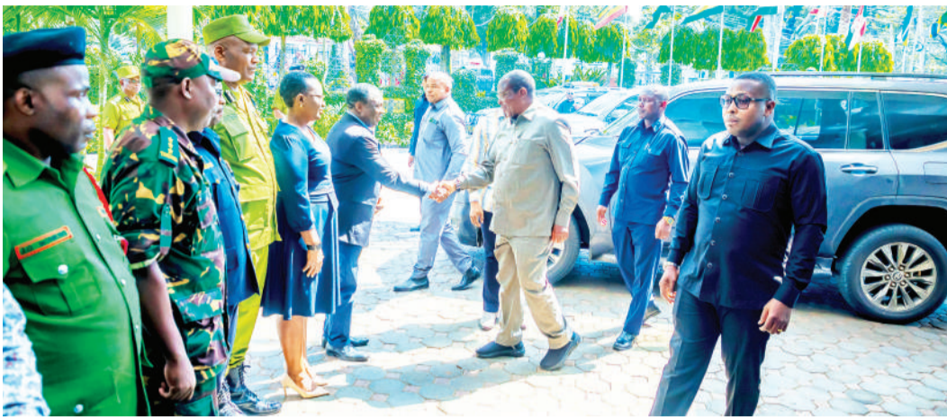
Makamu wa Rais Dk Philip Mpango akisalimiana na viongozi mbalimbali wa Arusha wakati alipowasili mkoani Arusha jana. Makamu wa Rais anatarajiwa kufungua Mkutano wa Mwaka wa Viongozi wa Taasisi ya Kuzuia na Kupambana na Rushwa (TAKUKURU) utakaofanyika leo mkoani Arusha.