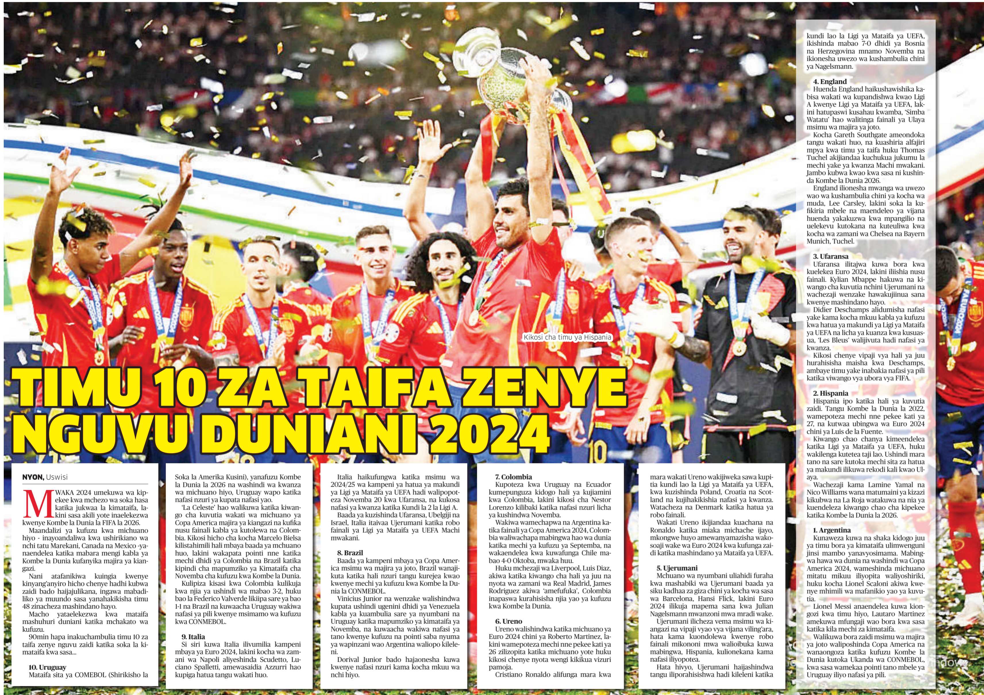
Kikosi cha timu ya Hispania