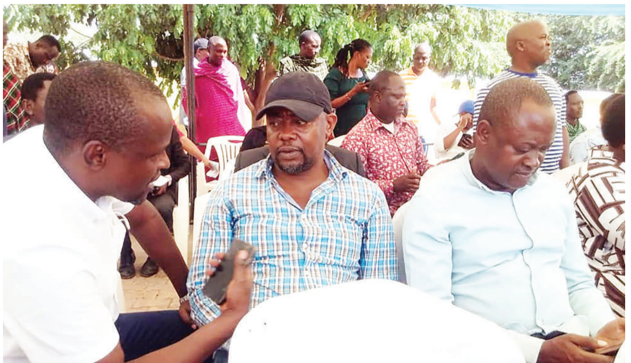
Baadhi ya wafanyabiashara ya madini wakibadilishana mawazo kwenye mnada wa madini ya vito ulioandaliwa na Wizara ya Madini ambapo gramu 184.06 za thamani ya Sh.bilioni 3.1 ziliuzwa mji mdogo wa Mirerani wilayani Simanjoro mkoani Manyara, juzi.