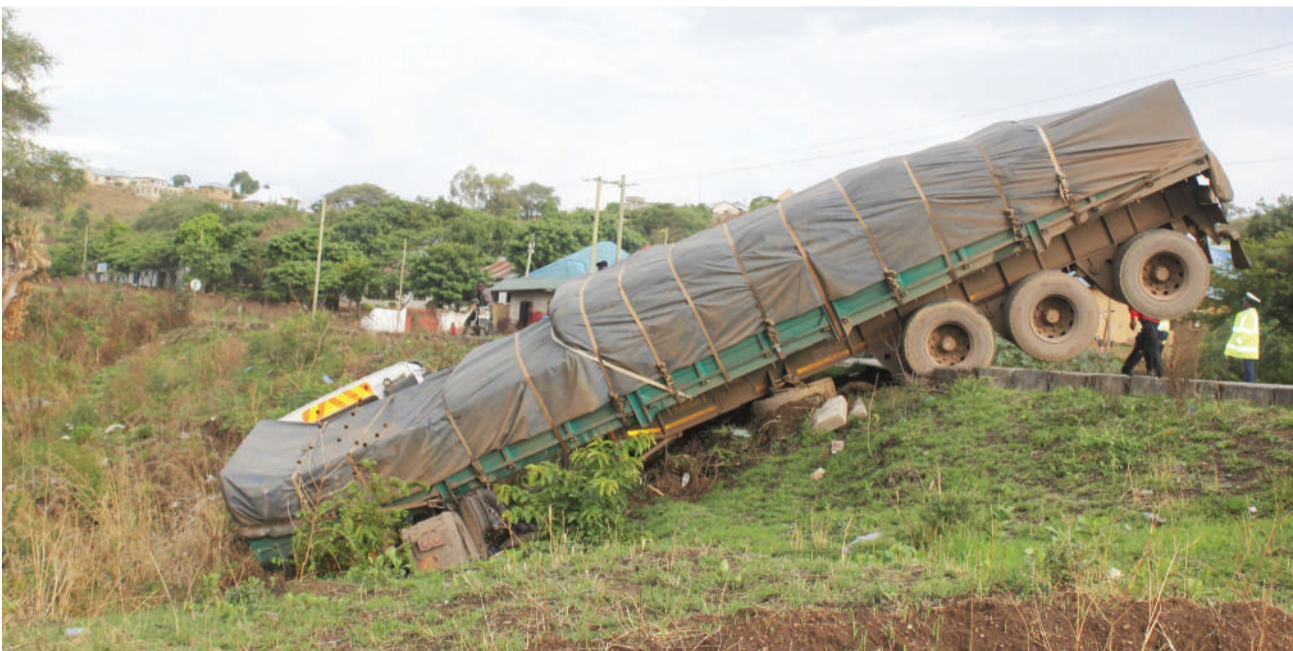
Lori la mizigo lililobeba shehena ya mbolea likiwa limeacha njia na kutumbukia korongoni katika eneo la Malafyale kwenye mteremko wa mlima Iwambi jijini Mbeya hivi karibuni.

Alisema: "Ni wajibu wetu kuhakikisha kuwa elimu hii inasambazwa kuanzia ngazi ya familia hadi sehemu za kazi ili kujenga jamii yenye haki, amani, na utawala bora".