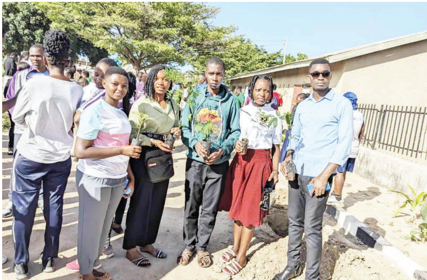
Baadhi ya wanachama wa Shirika lisilo la kiserikali la Akili Platform Tanzania (APT), wakiwa na miche ya miti, kwa ajili ya kupanda kwenye eneo la Shule ya Msingi Makole, Dodoma mwishoni mwa wiki.

Alisema: "Aidha, matumizi hayo yaliwezesha Tanzania kutoa matokeo ya sensa ya sita ndani ya muda wa siku 45 tangu ukusanyaji wa taarifa Agosti, 2022 hadi uzinduzi wa matokeo ya mwanzo Oktoba 2022".