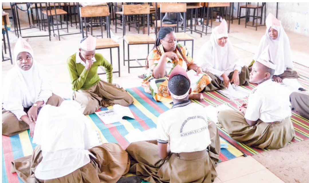
Baadhi ya wanafunzi wakiwa kwenye mafunzo ya ujasiriamali.

Hapa tunamzungumzia msichana mwenye ndoto nyingi kuanzia akiwa shule ya msingi na ili kutimiza ndoto zake ni lazima apate elimu ya stadi za maisha ambayo imeandaliwa kwa hatua kumuokoa ili awe jasiri na kuhimili maisha bila utegemezi.