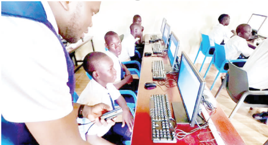
Mfano wa darasa linalofundisha TEHAMA.

"Kuna somo jipya linaitwa naipenda nchi yangu Tanzania ambalo limelenga kufundisha maadili ya Kitanzania, historia kwa njia ya michezo na nyimbo lengo ni kujenga taratibu uzalendo kwa watoto," anasema Mkurugenzi wa TET.