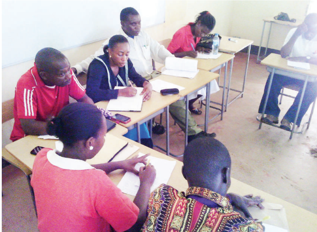
Darasa la Elimu ya Watu Wazima likiendelea.

"Mabadiliko yanatakiwa katika sekta ya elimu ya watu wazima